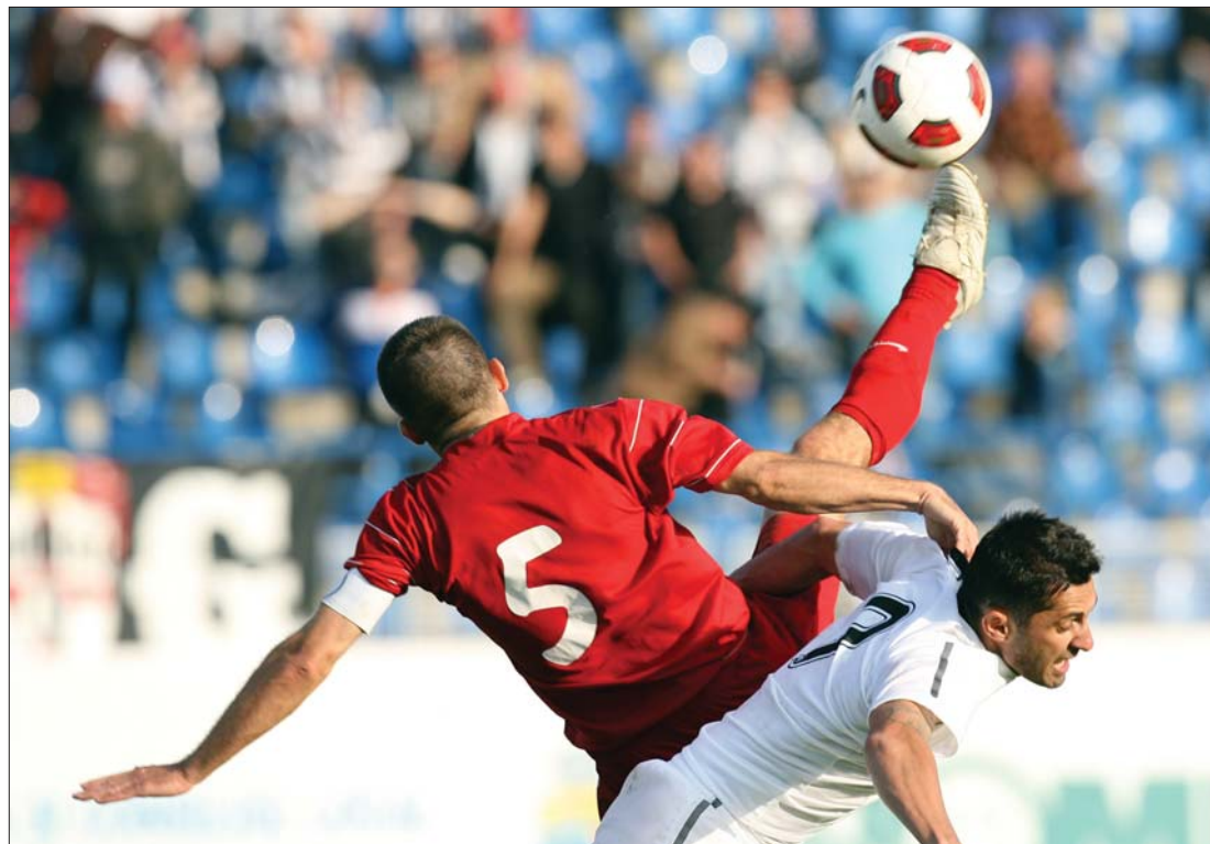
Focibalett Gyulafehérváron. A fehér mezű U „odahaza” kapott ki a Victoria Brănești játékosaitól