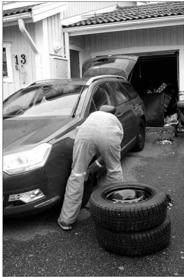
A téligumiabroncs-kínálat – márká és ár függvényében – széles

A szenátus elfogadta azt a törvénytervezetet, amely szerint az új egészségbiztosítási kártyán szerepelne, hogy a tulajdonos hozzájárul-e a szervadományozáshoz. A javaslat Tudor Ciuhodaru képviselőtől származik, a politikus szerint az utóbbi időben drámaian csökkent a donorok száma Romániában, és az emberek többsége elutasítja ezzel az életmentő lehetőséggel szemben. „Ha az opció helyet kapna az új egészségügyi kártyán a többi információ között, valószínűleg többen fontolnák meg a szervadományozás lehetőségét” – véli az előterjesztő.