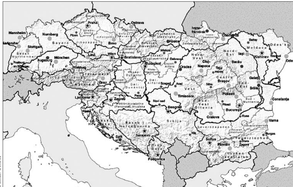
A hat Duna menti tagállamon kívül Szlovénia, Csehország, Szerbia és Ukrajna is csatlakozna a projekthez

A Duna által érintett régiókra összpontosító operatív programnak gazdasági, társadalomfejlesztési és egyéb szempontból is számos pozitív hatása lenne: többek között a hajózhatóság, szállítás, kereskedelem, turizmus, környezetvédelem, migráció, klímaváltozás, energiabiztonság területeit érinti. Fontos azonban kiemelni, hogy a Bizottság korábban úgy fogalmazott, a stratégia nem számíthat arra, hogy számára a jövőben külön forrást különítenek el a kohéziós alapokból – „ehelyett a már létező EU-s források és alapok, továbbá más pénzügyi eszközök hatékonyabb felhasználásán alapul”. Bár a jelenlegi – hosszú távú – uniós költségvetés nem ad lehetőséget ilyen makroregionális együttmű-