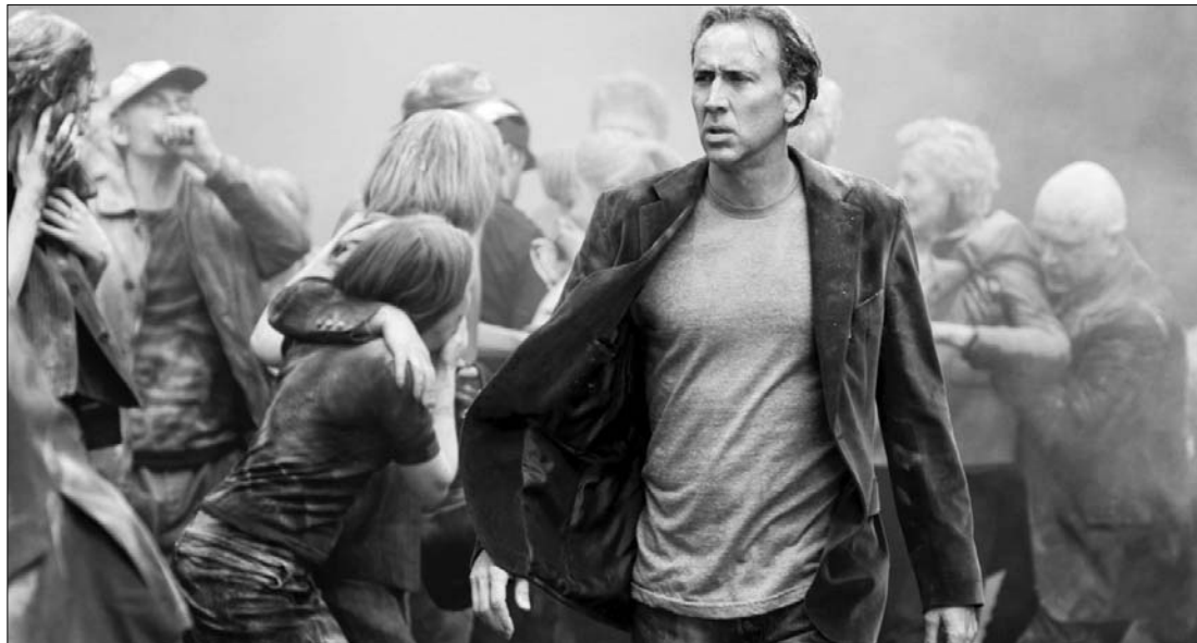
Nicolas Cage, egykori „fegyverkereskedő” és „szellemlovos” romániai roma gyerekekért jótékonykodik

A sajtó értesülései szerint néhány jelenetet a román tengerparton és Bukarestben vesznek fel. A film a tervek szerint 2012 februárjában kerül a mozikba. ◀