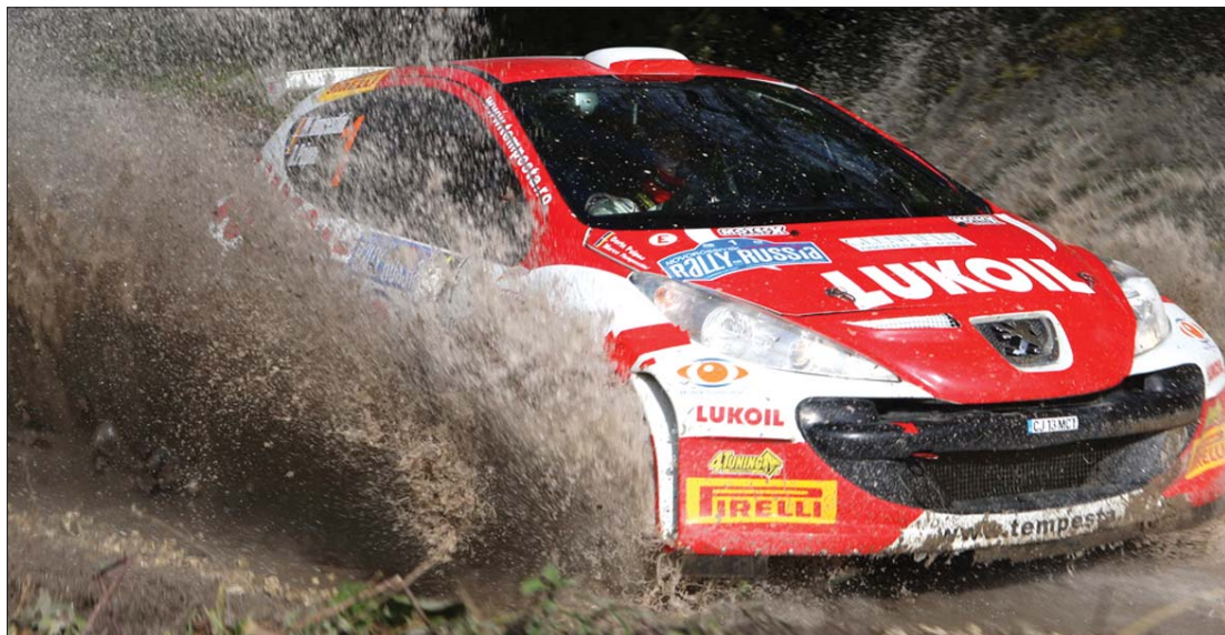
Az olasz versenyző keményen kezdett a remekül szuperáló Peugeot 207 S2000-ese kormányánál

► Három fordulón már túl vannak a vízilabda-Szuperligában, s az eddig lejátszott 24 mérkőzés változatlan erőviszonyokról árulkodik. A bajnok Nagyvárad CSM Digi mintha ezúttal is a mezőny fölött lenne, hiszen átlagban húsz gólnál is nagyobb különbséggel verte eddigi ellenfeleit, köztük az éremesélyes Steauát is, amely 13-4-re és 10-6-ra kapott ki a Sebes-Körös-parti városban. Hibátlan a Dinamo is, amely a Rapid ellen is hengerelt, 15-3 és 13-2 arányban. A dobogót a Steaua egészíti ki, s e három gárda számít bajnokesélyesnek. A Rapid negyedik helyét sem fenyegeti veszély, míg a kolozsvári és az aradi gárda várhatóan az ötödik pozícióért harcol, szinte azonos eséllyel. A Nagyvárad CSM Digi és a Bukaresti Sportul Studentescnek sem sikerült a nagy kiugrás, e két csapat csak az utolsó hely elkerülését tűzhette ki céljául. A hét végén a 4. forduló mérkőzéseit rendezik meg, kivéve a Crișul-CSM Digi nagyvárad házirangadót, amelyet elhalasztottak. A Sportul Studentesc a Dinamót, a Steaua a Kolozsvári Politehnicát, a Rapid pedig az Aradi AMEFA-t fogadja páros mérkőzésen. ◀