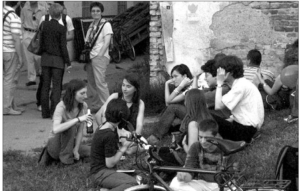
A műhelyfoglalkozás befejezése után is folytatódnak a beszélgetések