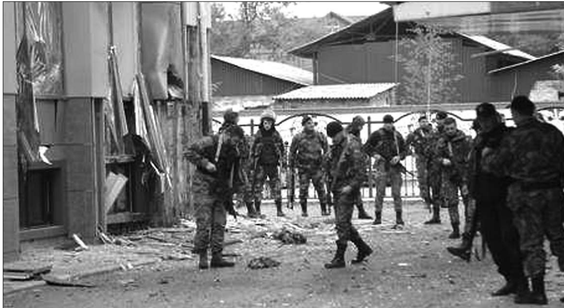
Az öngyilkos merénylet után hat halott maradt a helyszínen. A csecsen fővárosban kommandósok cirkálnak