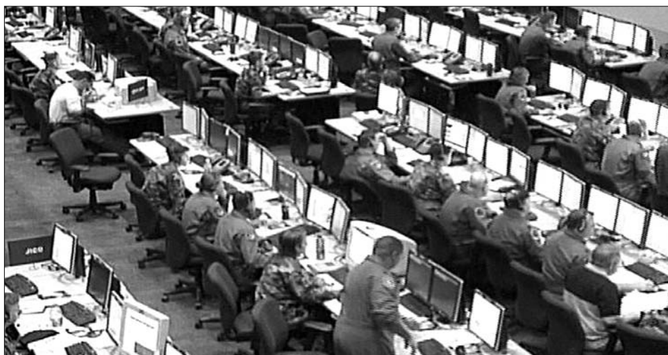
Ilyen lenne a potenciális cyber-háború irányítóközpontja

Az iráni vezetés nemrégiben közölte, hogy sikeresen hatástalanította a Stuxnet elnevezésű számítógépes vírust, az informatikusok minden berendezést megtisztítottak. A támadás valószínű végpontja a busheri atomerőmű lehetett, de a Stuxnet számos más országban is felütötte a fejét, hogy az adóhivatalok munkáját befolyásolja. A komputeres férgék, vírusok és más ártalmas programok már régóta nem csak a felhasználókat, a vállalkozásokat fenyegetik, hanem egész államokat is. William Lynn, az amerikai védelmi minisztérium államtitkára a közelmúltban arra panaszkod-