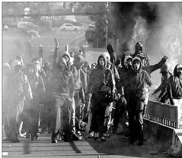
Nanterre-ben a fiatalok gyújtogatni kezdtek

Az elmúlt héten a gimnazisták is csatlakoztak a megmozduláshoz. A rendfenntartók számára ők jelentik a legnagyobb kockázatot, mivel gyakran keverednek közjüket szándékos rendbontók, akik kizárólag az összecsapásokat keresik a rendőrökkel, autókat gyújtogatnak, kirakatokat törnek be. Tegnap kora délutánig 163 olyan személyt vettek őrizetbe Lyonban és Nanterreben, akik már a tüntetések megkezdése előtt összecsaptak a rendőrökkel. Nicolas Sarkozy államfő sajtótájékoztatón jelezte: mindent meg fog tenni az olajfinomítók blokádjának feloldásáért és a rend helyreállításáért. Egy hétfőn közzétett felmérés szerint a franciák 71 százaléka támogatja a tiltakozó megmozdulásokat. ◀