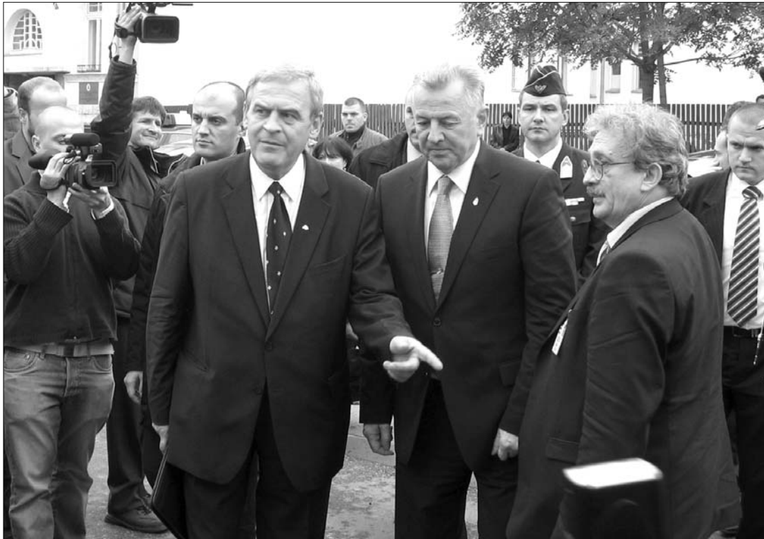
Mellettem az utódom. Tőkés László EP-alelnök Nagyváradon fogadta elődjét, Schmitt Pált (középen)

„A Sapientia szót tegnap (hétfőn), a Traian Băsescu államfővel és Emil Boc kormányfővel folytatott tárgyaláson – szerk. megj. – legalább harmincszor mondtam ki, kértem az akkreditáció megadásának a támogatását, amely elismerés a tanároknak, a diákoknak, lehetőséget ad a mindenkori magyar kormánynak és a román kormánynak is az egyetem támogatására” – fogalmazott Schmitt Pál a Sapientia – Erdélyi Magyar Tudományegyetem (EMTE) Műszaki és Humántudományok Karán rendezett ünnepségen. A magyar köztársasági elnök szerint nagyszerű dolog, hogy az EMTE-n magyar nyelven lehet tanulni, és nagyon fontos az is, hogy ez a tudás hasznos, piacképes legyen a világban. Schmitt kifejtette, magyar államfőként az a feladata, hogy összefogja a magyar nemzetet. Emlékeztetett arra a három fogadalomra, amelyet elnöki mandátuma elején hirdetett meg. E szerint mindent el akar követni, hogy a magyar nyelvet ne hagyjuk veszni, hiszen a nyelv ápolására, szeretetre és gondozásra szorul. Ahhoz is hozzá akar járulni,