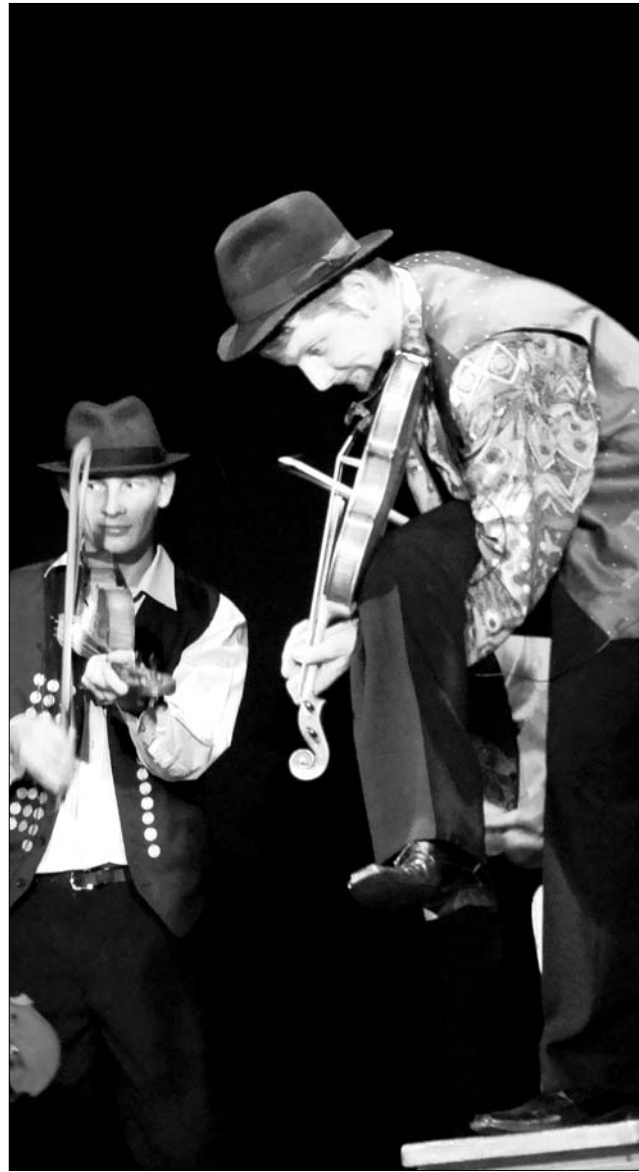
A Háromszék Táncgyüttes a Csávási balladát adja elő

A négynaposra tervezett fesztivál október 28-án, csütörtökön egy gyereknek szóló előadással nyit, a Mátyás király áruhái című mesejátékot a Maros Művészegyüttes hozza el Székelyudvarhelyre. A Csíki Játékszín mozgásszínházzal érkezik, az Átváltozás című produkciót adják elő, szintén a találkozó első napján. A rendezvényre régi barátok is érkeznek, a megalakulásának huszadik évfordulóját ünneplő Háromszék Táncgyüttes és ennek ikertestvéreként, a mozgásszínházi műhelyként létrejött formáció, az M Stúdió, kifejezetten erre az alkalomra készült ünne-