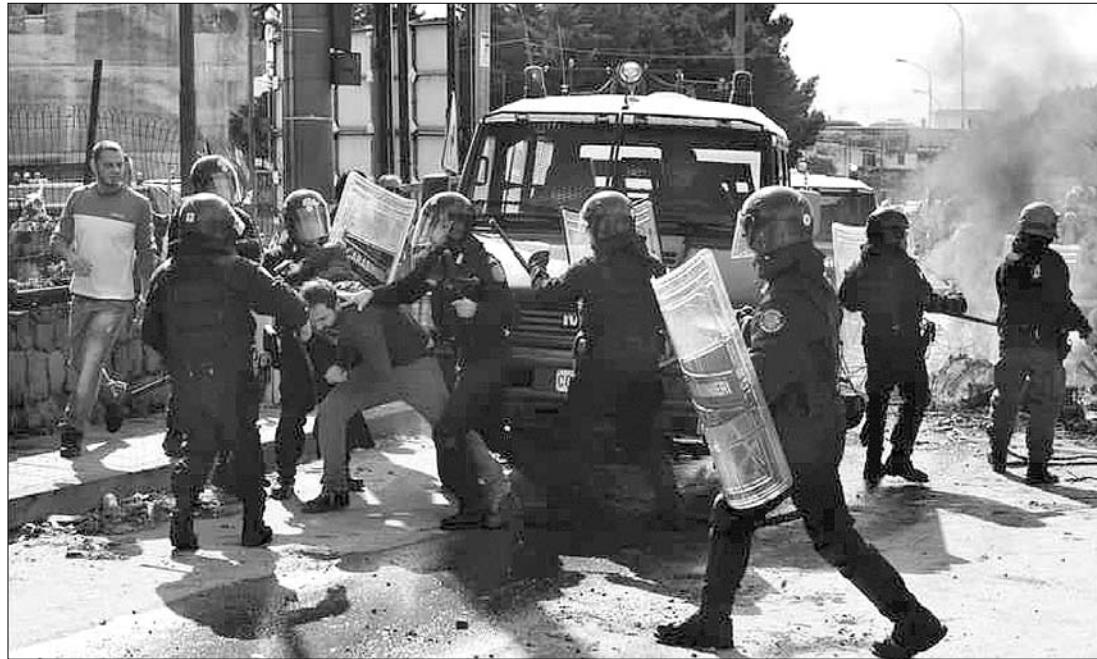
Nápoly külvárosaiban rendőrök fékeztek meg a randalírozó tömeget

is sor került. Nápolyban két éve már kialakult egy, a mostanihoz hasonló vészhelyzet, mert a hulladék-tározók telítődtek, a lakosság pedig ellenezte újabb területek használatba vételét. ◀