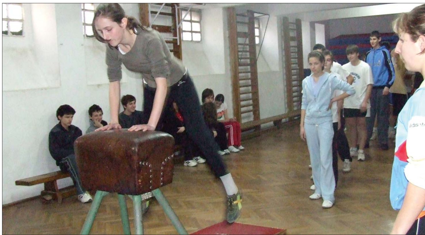
Tornaóra-vita. A szakemberek, tanárok, szülők egyhangú véleménye szerint a mennyiségi növekedést minőségi ugrásnak kell megelőznie

Minőségi ugrás nélkül nem sokat ér a testnevelési órák számának javasolt növelése