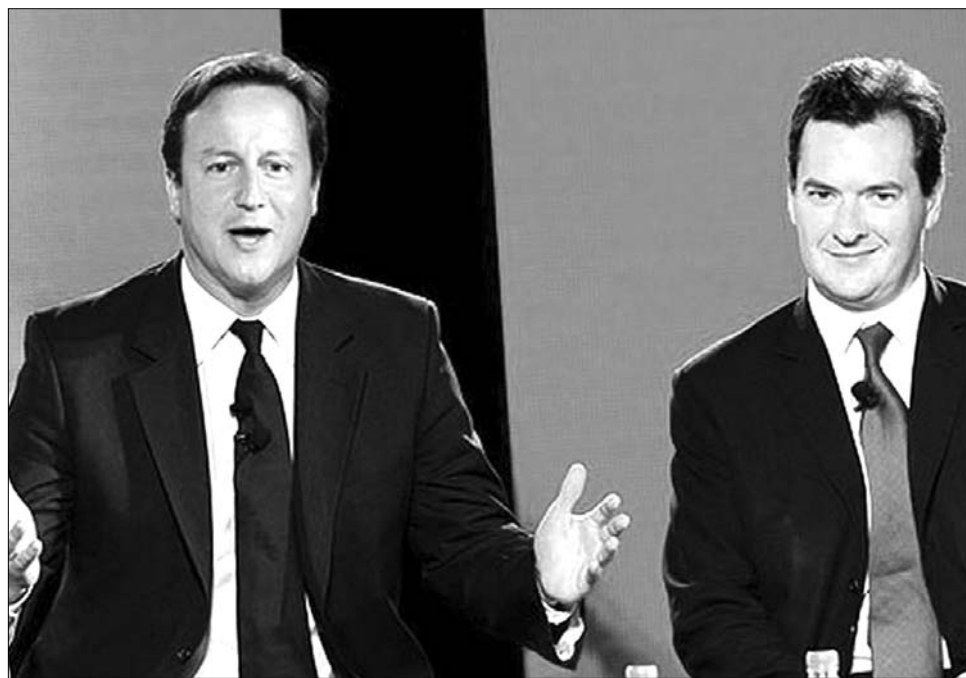
A vészharangot meghúzó David Cameron kormányfő (balra) és George Osborne, a „fejszés ember”

A brit közfinanszírozás jelenleg valóban tarthatatlan helyzetben van. A recessziós brit gazdaság élné- kítésére és a bankok megmentésére fordított csillagá-