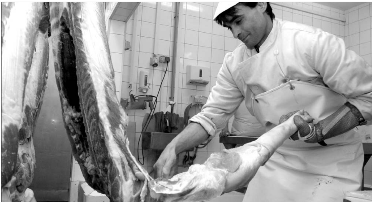
Bár szinte bizonyosan növelné a vásárlóerőt a kilátásba helyezett adócsökkentés, törvénytervezetével a képviselőház „élő húsba vágott”

Az élelmiszerek árának alakulása különben több ízben is a figyelem középpontjába került az utóbbi hetekben. Mint korábban beszámoltunk róla, Romániában az év első nyolc hónapjában átlagosan 6,25 százalékkal emelkedtek a főbb élelmiszertermékek árai, ami elmentmond a közgazdászok minden számításának. (Szakértők szerint ugyanis a bérek csökkentésének és a munkanélküliség növekedésének körülményei között természetesen visszaesik a fogyasztás, aminek elkerülhetetlenül az árak csökkenéséhez kellene vezetnie.) A nagy kereskedelmi láncok és a szakminisztériumok képviselői azonban egymásra mutatnak, ha a felelősségről van szó a drágulás tekintetében. Szakértők szerint az okok között a túl magas adók, az állami támogatás hiánya és az energia drágulása mellett a vilápiaci árak növekedése és a kedvezőtlen időjárási viszonyok egyaránt megtalálhatóak. ◀