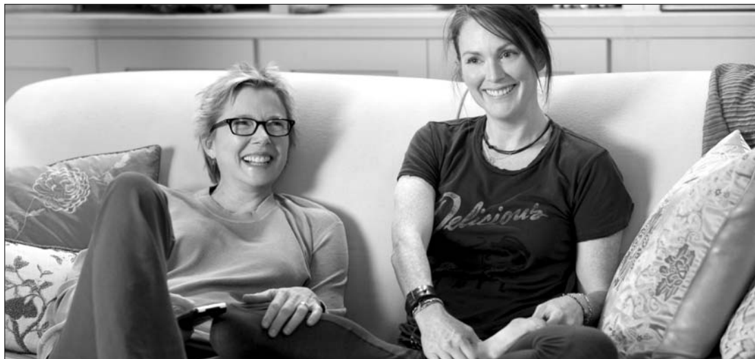
Annette Bening és Julianne Moore egyaránt Oscar-esélyes. A február 27-i gálán vajon melyikük mosolyog majd?

Alig kezdődött el az Oscar-szezon, máris tucatnyi esélyest emlegetnek Hollywoodban a legjobb színésznő Oscar-díjára. A nőkre irányuló figyelem oka részint az, hogy idén számos erős, független női produkció készült – nemcsak abban az értelemben, hogy „női témákat” állítottak a középpontba, hanem úgy is, hogy a főhősöket eljátszó színésznők maguk is tevékenyen hozzájárultak – produkciós oldalról is – a filmek létrejöttéhez. Julianne Moore például öt évig kitartott a Kids Are All Right című film mellett, amíg a producereknek sikerült összeszedni a tinédzsereket nevelő leszbikus párról szóló történetre a szükséges pénzt. Az is az ő érdeme, hogy megnyerte Mark Ruffalót az egyik fontos szerepre. De Moore mellett a partnerét alakító Annette Bening neve is joggal szerepelhet az Oscar-esélyesek készülő listáján. Sokakat megragadott