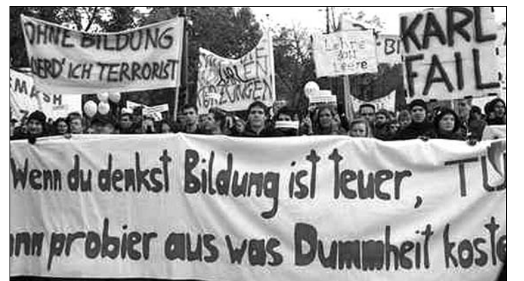
A transzparens azt sugallja: a butaság többbe kerül, mint az oktatás