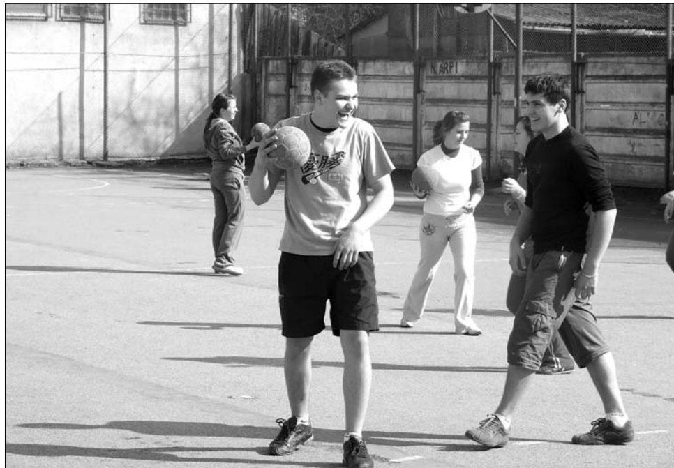
Nem mozgatja meg a testnevelés eléggé a diákokat – vélik a sportreform sürgetői

A sportoktatás reformját uniós szinten is sürgetik, de egészen más szempontok szerint, mint ahogyan azt a kérdésben többször állást foglaló kormánypart teszi. Franciaországban például az az elvárás, hogy a testnevelés az eddigieknél szervezettebben illeszkedjen az alaptantervbe: egészítse ki a többi tantárgyat, szolgálja a készségfejlesztést, a gyerekek mozgáskultúráját, és differenciált sportoktatásban vehessenek részt a szellemileg, fizikailag sérült gyerekek is. Az ügy érdekében több civil szervezet is felszólalt, egyikük például azt szorgalmazza, az unió nyújtson több, könnyebben elérhető támogatást a tömegsportnak és az iskolai testnevelés fejlesztésének. ◀