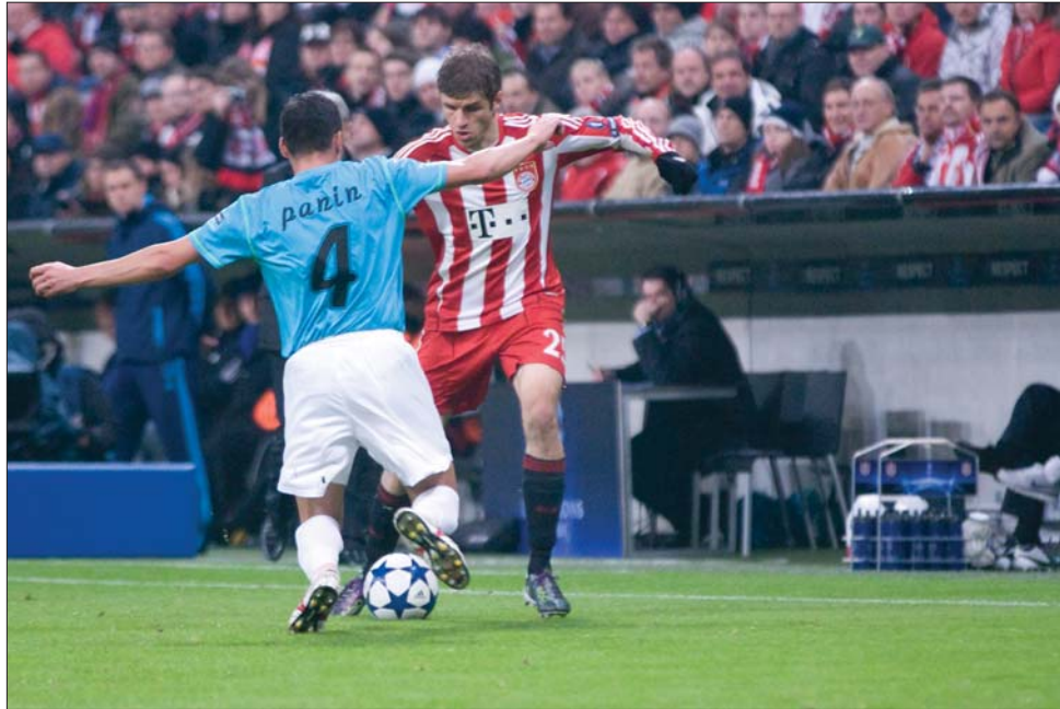
A CFR 1907 játékosai két góljuk mellett ugyanannyi öngólt is vétettek