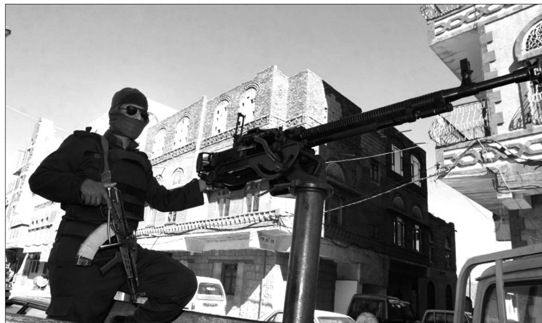
Hiába erősítették be a biztonsági intézkedéseket az iraki fővárosban: tegnap több merényletet is elkövettek

Mindössze az egyötödét vizsgálják át fizikailag, bomba után kutatva annak a 4 millió tonnányi légi szállítmánynak, amely évente az Egyesült Államokba érkezik – írta tegnap a USA Today című amerikai lap. Az újság szerint az amerikai belbiztonsági minisztérium számítógépes rendszere jellemzően csak akkor azonosítja be a veszélyes szállítmányokat, amikor azok a levegőbe emelkedett repülőgépek vagy a tengerre kifutott hajók fedélzetén már elindultak az Egyesült Államokba. ◀