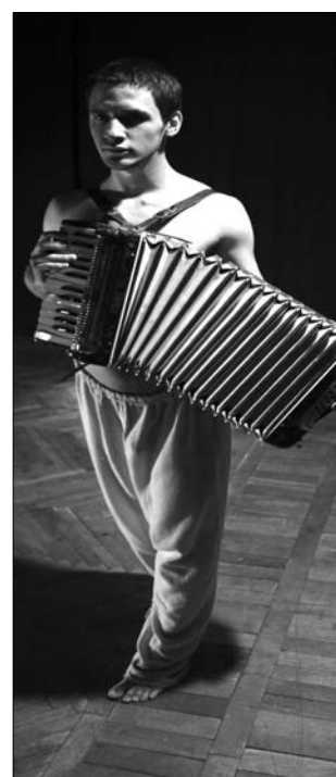
Részletek a bolyongás meséiből

Mint arról lapunkban is beszámoltunk, az Osonó az év elején a thaiföldi Patumthani Nemzetközi Színházi Fesztiválon vett részt. A