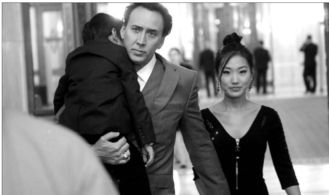
Nicolas Cage Oscar-díjas amerikai színész családjával együtt mintegy öt hónapig forgat Romániában

Cage filmbeli partnere az olasz Violante Placido, aki legutóbb George Clooney Az amerikai című filmjében villogott, az ördögöt pedig a München mel (rendezte: Steven Spielberg, 2005) már bizonyított írországi Ciaran Hinds alakítja. A képregény-adaptáció (amely az első, Romániában forgatott 3D-s film lesz) második részét a Mark Neveldine és Brian Taylor rendezi – a