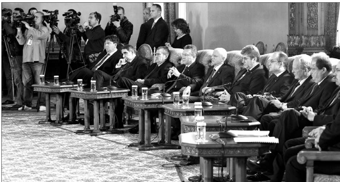
A koalíciós pártok között látszólag tökéletes összhang uralkodott a cotroceni-i tanácskozáson

Băsescu továbbá elmondta, hogy áttekintették a koalíciós pártokkal az IMF-nek küldött szándéklevélben vállalt kötelezettségeket, az újabb hitelszerződés előfeltétele, hogy mihamarabb elfogadják a nyugdíjtörvényt, a közalkalmazottak bérezését szabályozó egységes bértörvényt, valamint a 2011-es költségvetést. „Teljes összhangot tapasztaltam a kormányt támogató alakulatok között, ami bizalommal tölt el azzal kapcsolatban, hogy sikerül teljesíteniünk