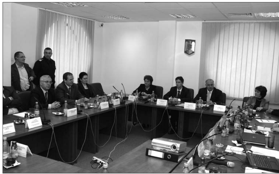
Egyetlen magyar jelölt sem jelentkezett az igazságügyet irányító Legfelső Bírói Tanácsba.

Daniel pátriárka nevével regisztráltak többen is a Facebook közösségi oldalon. A vallási vezető azt állítja, többször jelezte az üzemeltetőnek, hogy hamis regisztrációkról van szó, de egyelőre nem törölték a kérdéses oldalakat. Az egyértelmű, hogy nem a pátriárka az oldalak létrehozója, az egyik tulajdonos érdeklődési körként ugyanis a szélsőséges zenei stílust, a „black metal” jelölte meg. A másik regisztráló személyes információkat azt adta meg: „ott tanyázom, ahol csak tudok, és beleverem a frászt az emberekbe”. Ez az oldal 289 másik felhasználóval áll kapcsolatban.