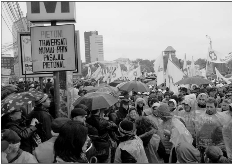
A múlt heti bukaresti tömegtüntetésen még úgy tűnt, megszervezhető a négyórás sztrájk