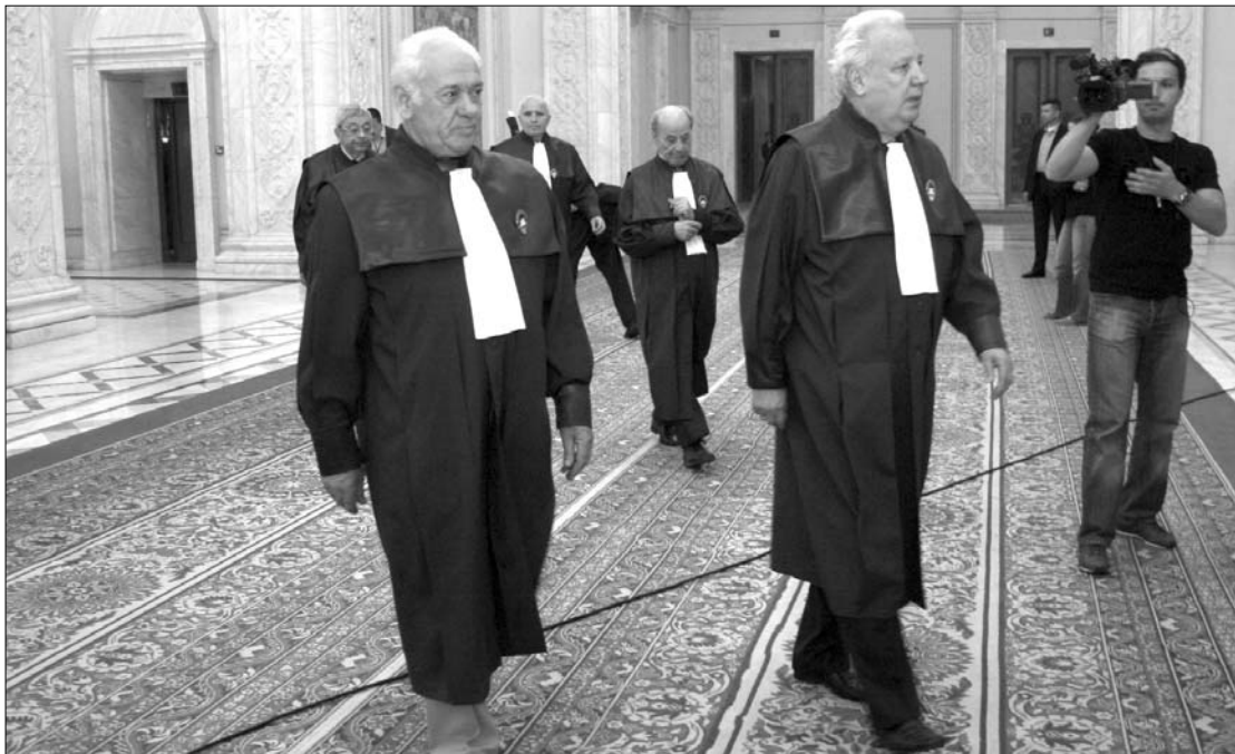
Az RMDSZ szerint politikai jellegű döntést hoztak az alkotmánybírák a felelősségvállalás megakadályozásával.

A szövetségi elnök a kormányulást követő tegnap esti sajtótájékoztatóján megfedte a koalíciós társakat. „Nem az ellenzék hibája az, hogy a tanügyi törvény elakad a törvényhozásban, hanem a koalíció gyengesége” – jelentette ki. A miniszterelnök-helyet-