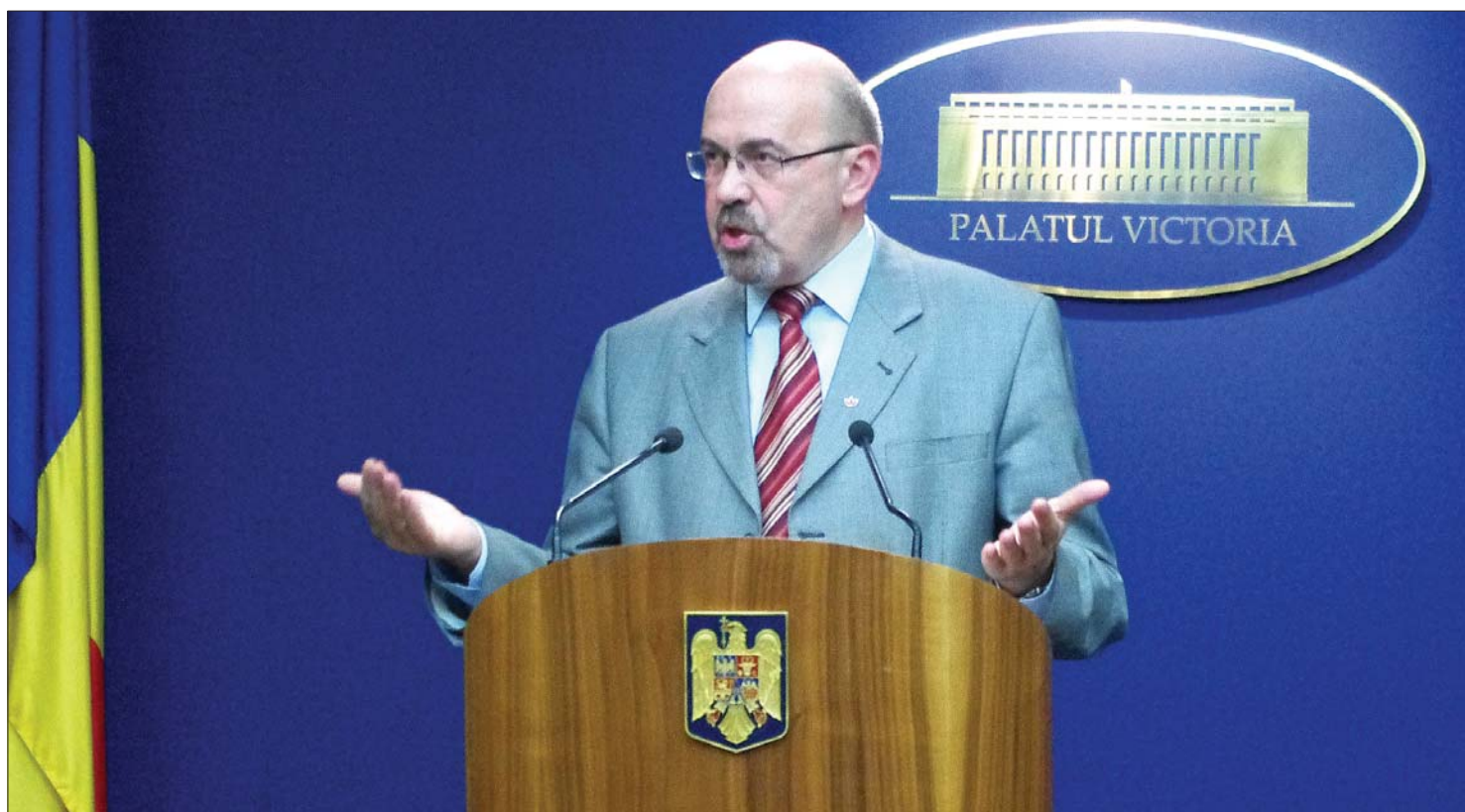
Nem szakítanak. Markó Béla RMDSZ-elnök tegnap esti sajtótájékoztatóján cáfolta, hogy a Szövetség kilépni készülne a kormánykoalícióból.

Alkotmányellenes az oktatási törvényért történő kormányzati felelősségvállalás