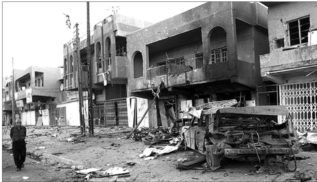
Bagdadi tájkép, merénylet után. Autóba rejtett bombák, aknák robbantak, száznál több a halott

Irakban 2006–2007-ben érte el csúcspontját a szunniták és síták belharca, de azóta jelentősen csökkent a merényletek száma. A kiújult támadások miatt kétséges, hogy a belbiztonsági erők képesek-e megvédeni a fővárost. ◀