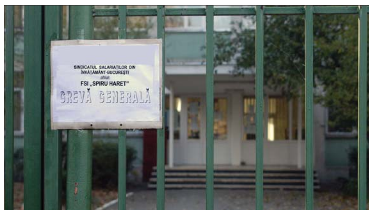
A tanügyi szakszervezetek csak elvétve sztrájkoltak tegnap