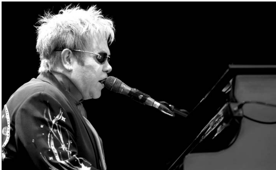
Sir Elton John nem tud és nem is akar már versenyezni a század celebjével. Ezért inkább visszavonul a publikum elől

Amint arról lapunkban beszámoltunk, a 63 éves Sir Elton Hercules John (született: Reginald Kenneth Dwight) a GQ című, elsősorban férfiaknak szóló nemzetközi életmódmagazin legfrissebb brit kiadásának elmondta: úgy gondolja, hogy eljutott abba az életszakaszba, amikor már nem tud több popdalt szerezni. „Nem tudok leülni és megírni egy valamirevaló számot. Amikor 25 vagy 26 éves voltam, addig lényegesen könnyebb volt ez a dolog, de most már nem az” – fogalmazott a népszerű folyóiratnak adott interjúban a szupersztár, akinek lemezeitől több mint 250 millió fogyott. Szerénykedve kijelentette még, hogy a közönség „sem követel torkaszakadtából egy új Elton John-lemezt – és én sem ordítok a vágytól, hogy írjak egyet”. A Radio Times című, a celebvilággal is foglalkozó brit tévé- és rádióújságnak nyilatkozó veterán rocker a tehetségkutató showműsorokat kritizálta. Ar-