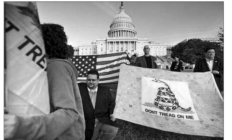
„Ne taposs rám” – a Teadélután mozgalom hívei ünnepelnek Washingtonban

A demokrata Andrew Cuomo megszerezte New York állam, párttársa, Jerry Brown pedig Kalifornia kormányzó posztját. Ez utóbbi államban népszavazást is tartottak. ◀