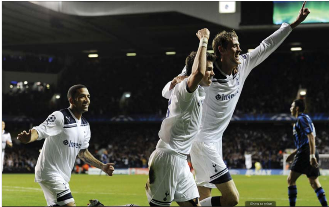
Angol gólöröm a White Harte Lane-en. A Tottenham simán verte az Internazionale Milanót