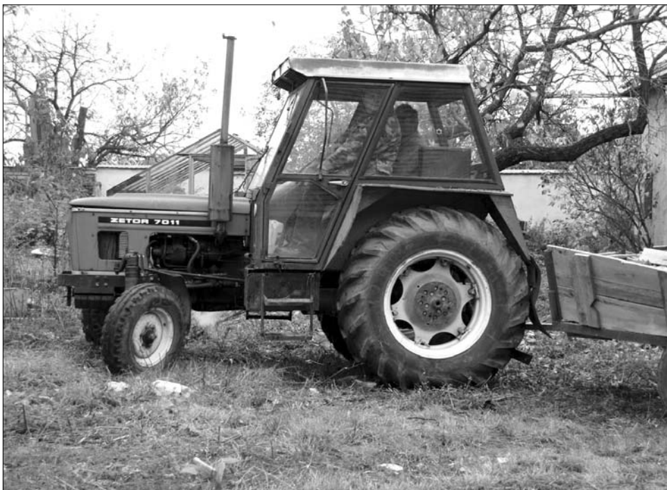
Az új technológiák terjedésével nő az érdeklődés: akinek traktorra futja, tanulásra is áldoznia kell

Mint megtudtuk, újabban alig akad ilyen támogatás, mivel a döntéshozók úgy gondolták, hogy aki mezőgazdaságból akar megélni, az nyolc-tíz év alatt megtanulhatta a legfontosabbakat, aki meg új ismeretekre vágyik, az fizesse meg. Így a mostani két-három, esetleg négy hónapos tanfolyamok már 250–400 lejes költségbe kerülnek a résztvevőknek. A központ a gazdasági válságra való tekintettel gyér érdeklődésre számított, a valóság azonban kellemes csatlódást hozott: a jelenlegi 14 tanfolyamra közel ezren jelentkeztek, újabban a szomszéd megyékből is, elsősorban a Szilágyságból, de nem ritkán Biharból is. A tapasztalatok szerint az emberek úgy gondolják, az új ismeretek hozzásegítik őket a kitöréshez: a növénytermesztők például új technológiákkal ismerkedhetnek meg, míg a mezőgépeszet kurzusain azoknak a nagyteljesítményű agrárrobotoknak a ke-