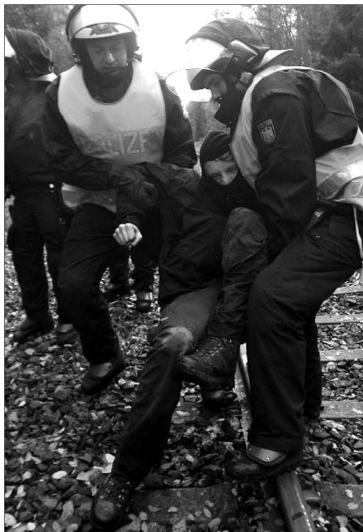
Húszezer rendőr huszonnyolc órát volt talpon étlen-szomjan

A berlini kormány még ebben a hónapban szerződést kíván aláírni Moszkvával három szállítmány Oroszországba történő szállításáról: az egykori NDK elöregedett atomerőműveinek kiégett fűtőelemeit vinnék az észak-rajna-vesztfáliai Ahausban lévő tárolóhelyről egy uráli orosz atomtemetőbe. A megállapodás már készen áll az aláírásra. ◀