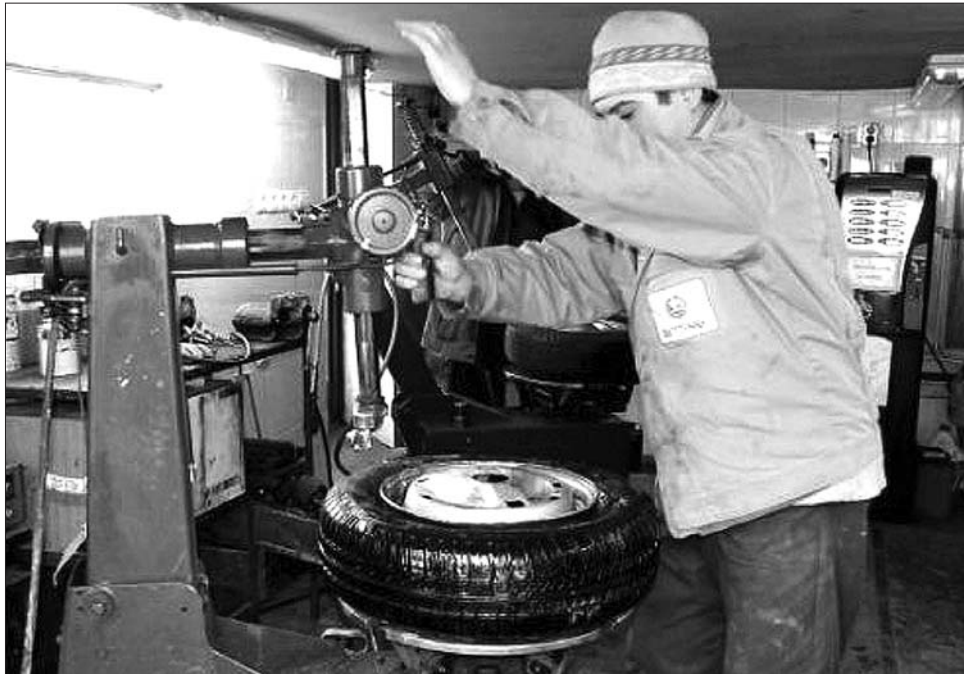
A gumicsere az erdélyi megyékben átlagban 30-50 lejbe kerül, abroncsról függően