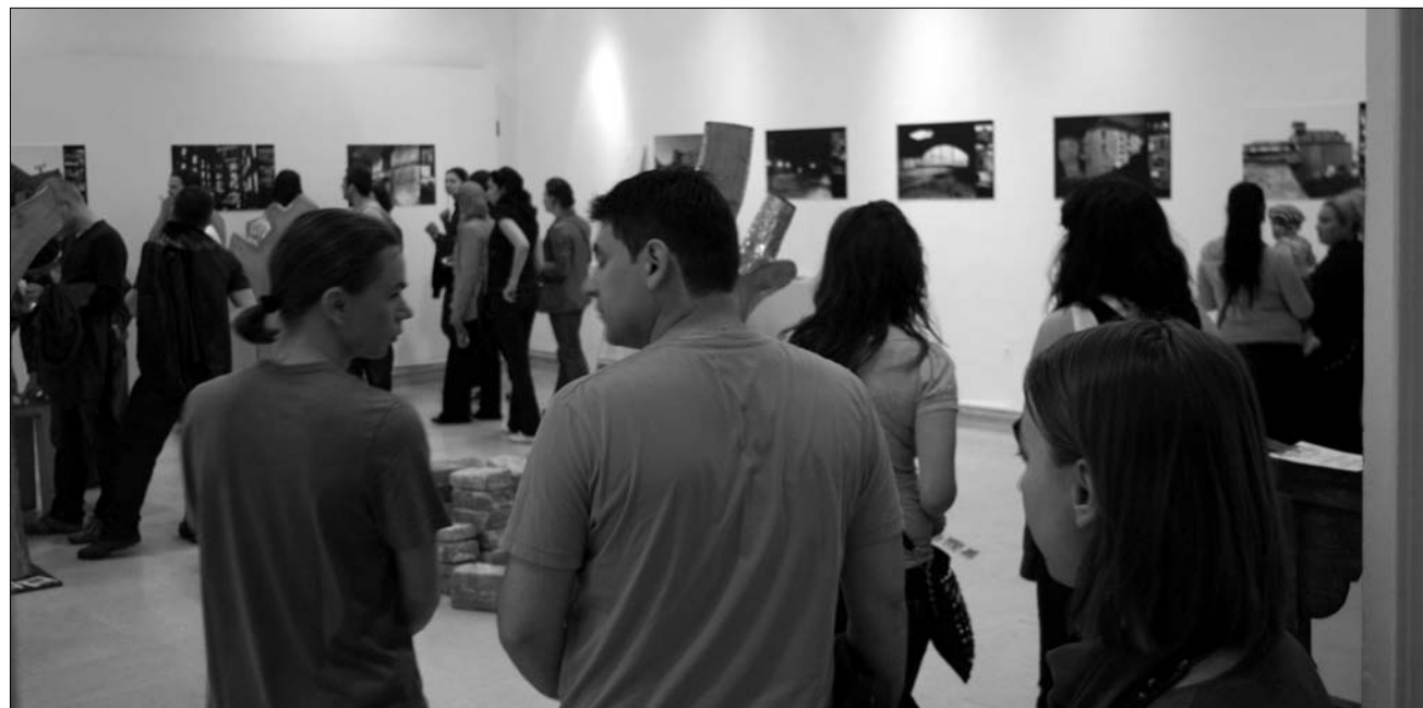
A kormánypártiaknak és a szakmabelieknek sem tetszik, hogy a PSD a szombati napfénybe tenné a múzeumok éjszakáját.