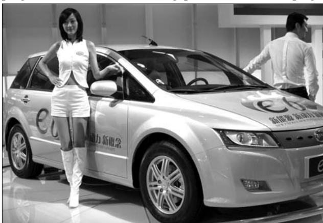
Míg más kategória drágul, az elektroautó mentesülhet az adó alól

A miniszter által felsorolt példák alapján az adóemelés a tervek szerint a következőképpen fog alakulni: egy egyéves, 1400 köbcentis motorral rendelkező Euró 4-es gépkocsi eddig 380 eurónak megfelelő illetéke 483 euróra emelkedne. Egy ugyanakkora kapacitású, hétéves Euró 3-as szennyezési illetéke a mostani 673-ról 998 euróra növekedne – azon Euró 2-es autók tulajdonosainak pedig, akik tízéves járgányaik után eddig 1616 eurót fizettek, ezentúl 2428 eurós adóval kell számolniuk. ◀