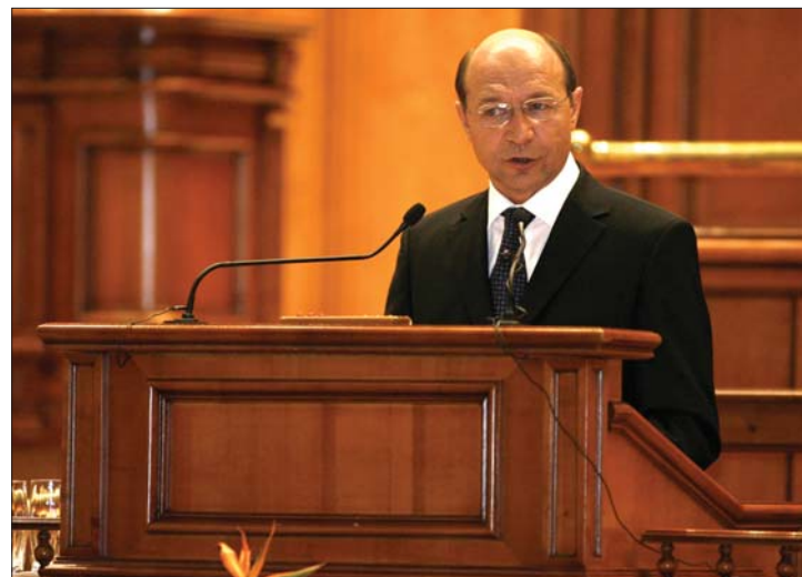
Traian Băsescu államfő a nyugdíj- és a bértörvényt sürgette