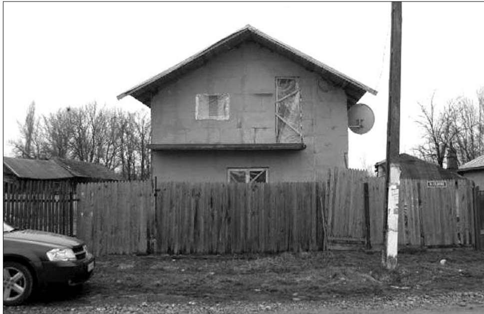
Răcari, Dâmbovița megye. Utcakép egy 6600 lakosú városból

A törvényalkotó szenátor viszont elsősorban a választások szervezési költségeinek csökkentését emeli ki, hiszen az átszervezés nyomán kevesebb szavazókörzetet kell majd létesíteni. Egyben arra is emlékeztet, hogy a „visszaminősítés” a lakosság számára anyagi előnyökkel is jár, hiszen a városi vagy községi státus elvesztésével természetesen csökkennek az adók és illetékek is. Azt viszont nem tagadja, hogy az átállás kezdetben utánajárást és némi pénzalapot is igényel tőlük, tekintve, hogy hiszen új személyi iratokat kell beszerezniük. ◀