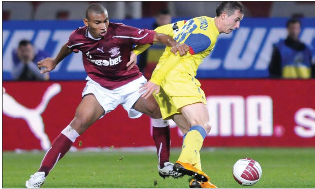
A két bukaresti rivális, a Rapid és a Steaua döntetlenjének legjobban a listavezető galaciak örülhettek

A 15. forduló műsora: pénteken: Otelul-Brănești, FC Vaslui-Astra. szombaton: Kolozsvári U-Pandurii, Un. Urziceni-Temesvár, Brassó-Sportul. vasárnap: Marosvásárhely-Rapid, Steaua-Gaz Metan, Dinamo-Univ. Craiova. hétfőn: Gloria-Kv. CFR 1907. ◀