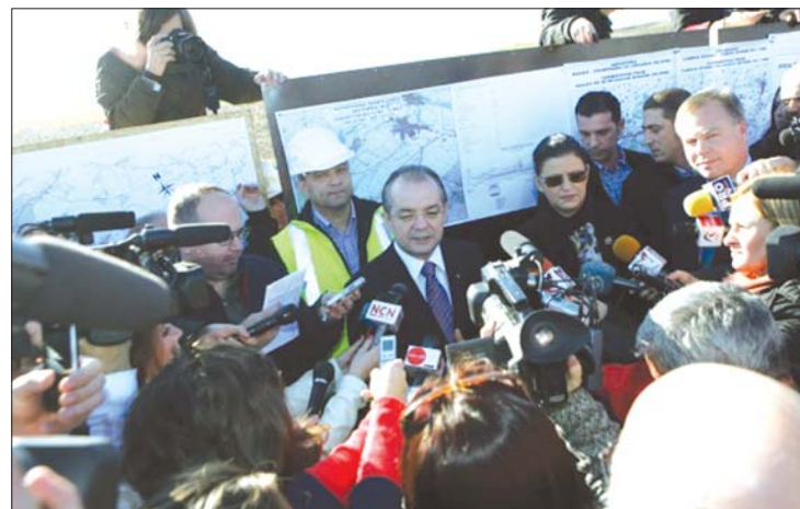
Emil Boc kormányfő és Anca Boagiu miniszter a sztrádaavatón