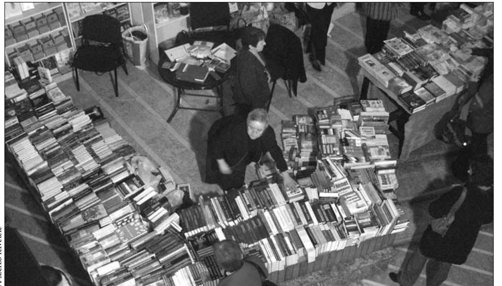
A XVI. Marosvásárhelyi Nemzetközi Könyvvásár szervezői teljesen, a vásárlók részben elégedettek

A színház kétszintes előcsarnokában senki sem panaszkodhatott a kínálatra, 43 szépirodalmi művevel, szakkönyvekkel, szótárakkal és gyerekkönyvekkel megrakott stand várta a vásárlókat, akiknek valamennyi kiadó és könyvkereskedő 10-20, de akár még 40 százalékkal is olcsóbban kínálta a „kultúrát”. Többen kihasználták a lehetőséget és vásároltak, de többen panaszkodtak is az árakra. „Egyszerűen nem érem fel diákszűréssel ezeket az árakat, még a húszszázalékos árengedmény ellenére sem” – panaszkodott lapunk