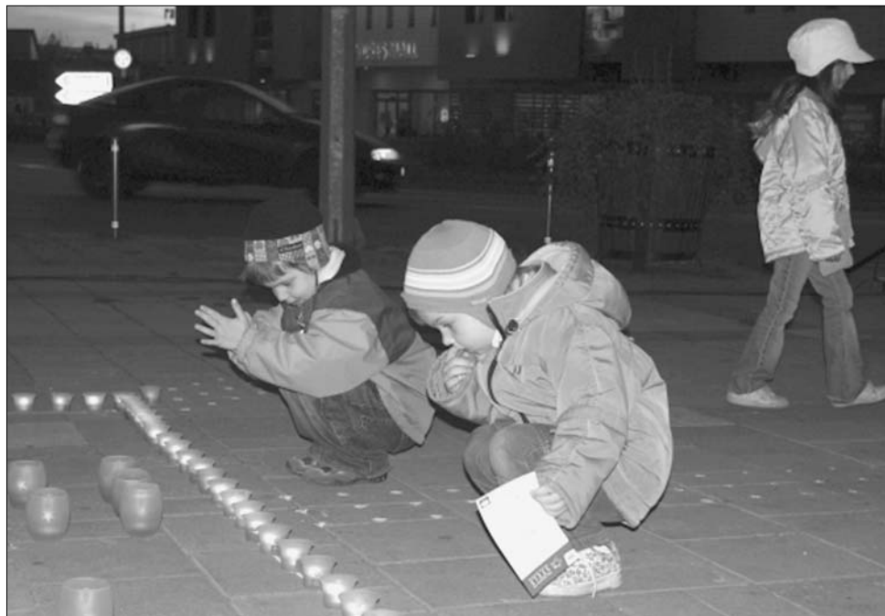
A szolidaritás lángja Marosvásárhelyen. Huszonegy erdélyi városban gyűjtöttak gyertyát

Mégis csak a jövő év novemberétől lesz kötelező a téli abroncsok használata, de pénzbírságot fizet az az autótulajdonos, aki a nem megfelelően téliessített autót miatt okoz balesetet. Anca Boagiu szállításiügyi miniszter bejelentette: a következő napokban tárgyal a szakmai szervezetek és érdekvédelmi szövetségek képviselőivel a közlekedési szabályok elfogadható módosításáról.