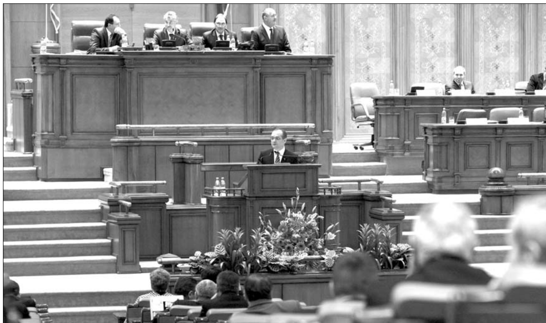
Emil Boc ragaszkodik a parlament kikerüléséhez, folytatná a tanügyi törvény felelősségvállalási procedúráját

Sorin Oprescu fővárosi főpolgármester szerint Bukarestben nagyobb a tisztaság, mint Párizsban. (Adevărul) ► A Dacia nyolc újabb gépkocsitípust kíván piacra dobni 2015-ig. Leghamarabb egy városi kisautót, a Citadine-t fogják bemutatni, amelynek ára ötezer euró körül lesz. (Gândul) ► Berlinben minden nyolcadik cég tulajdonosa külföldi, zömükben kelet-európai. Közöttük is jelentős számban képviseltetik magukat a románok, akiknek a száma az amerikaiakét is meghaladja. (Evenimentul zilei) ► A román belügyminisztérium 1,2 millió euróra vásárolt NATO-szabvány szerinti egyenruhát, amelyek erdős vidéken és sivatagi környezetben egyaránt használhatók. (Puterea)