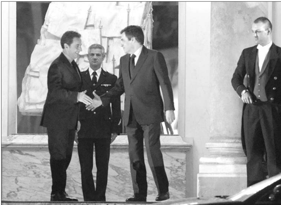
Nicolas Sarkozy és François Fillon: a válás vagy az újratálcázás kézfogása?

A konzervatív választóknek Sarkozy személye és eddigi működése nagy csalódást okozott, s a kormányátalakítás erre adott válaszként