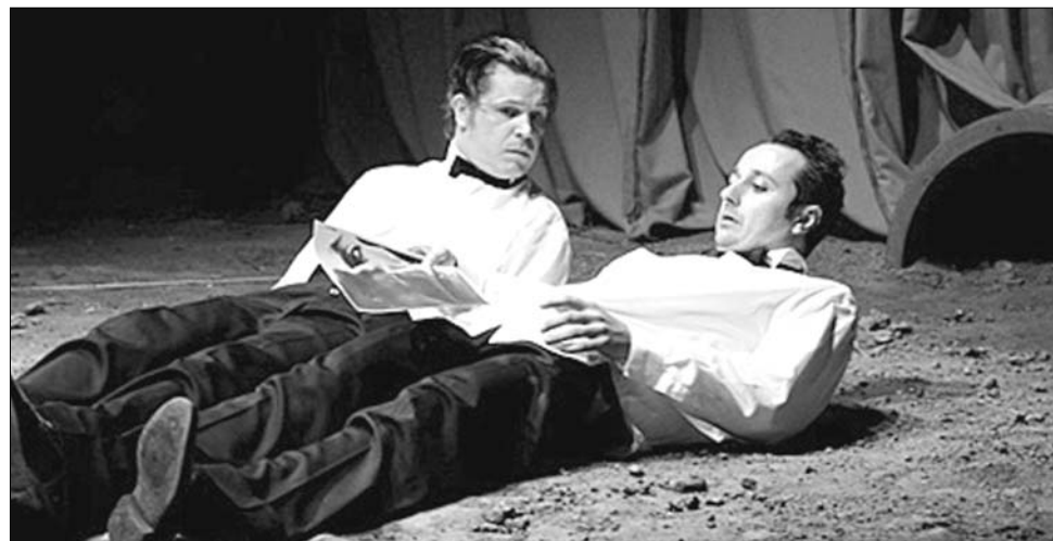
Szakemberek szerint a Rosencrantz és Guildenstern halott díjakat „zsebelhet be” Aradon