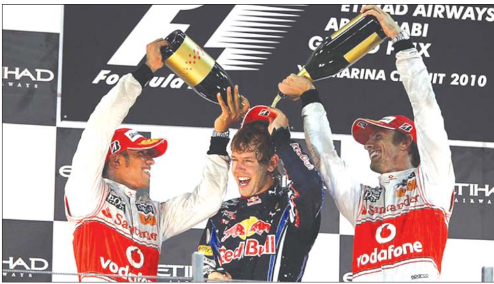
Pezsgőmámor. Sebastian Vettel (középen) a Forma-1 történetének legfiatalabb világbajnoka

A konstruktőröknél Red Bull (498), McLaren-Mercedes (454), Ferrari (396) volt a dobogós sorrend, a Mercedes 214, a Renault pedig 163 pontig jutott. ◀