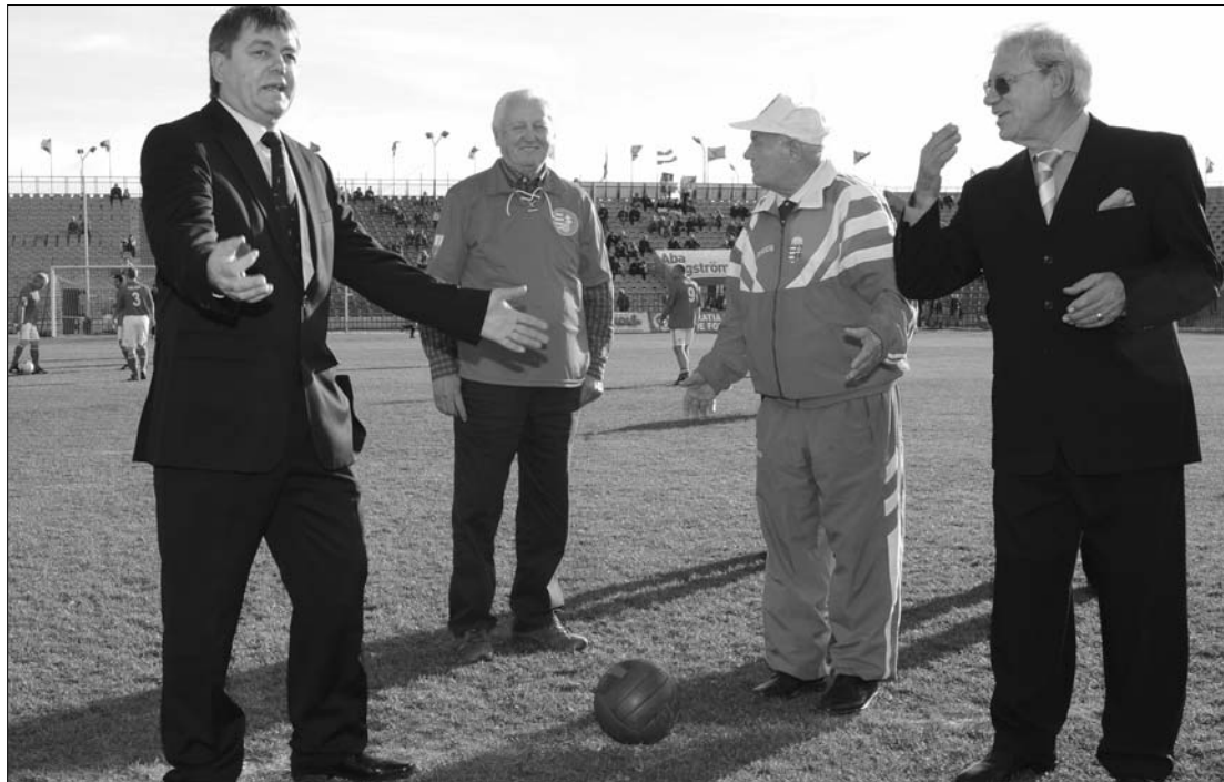
Nagy idők focija – kezdőgűgás Nagyváradon. Puhl Sándor, Albert Flórián, Buzánszky Jenő és Jenei Imre

A magyar öregfiúk és a felcsútiak győztek a NAC-gálán