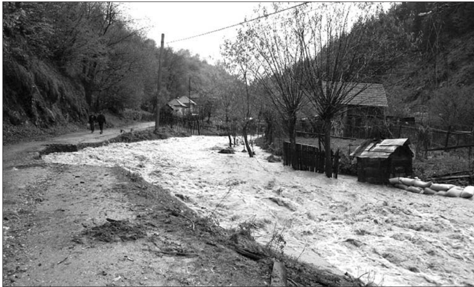
Kilépett a medrél a Tisza, Ukrajnából jön a vízfelesleg az észak-romániai megyékbé

A hirtelen hőmérsékletcsökkenés mellett gondot okozott a helyenként orkánerejű szél is. Az óránkénti 70-75 kilométeres szél hótorlaszokat, hóátfújásokat hozott létre: országszerte akadózott a közlekedés, megugrott a szezonbalesetek száma. A Szeben megyei Nagytalmácson, a DN7-es úton tömegbaleset miatt benuult le tegnap délután a forgalom: két teherszállító és két személygépkocsi rohant egymásba. Luciana Baltes megyei rendőrségi szóvivő