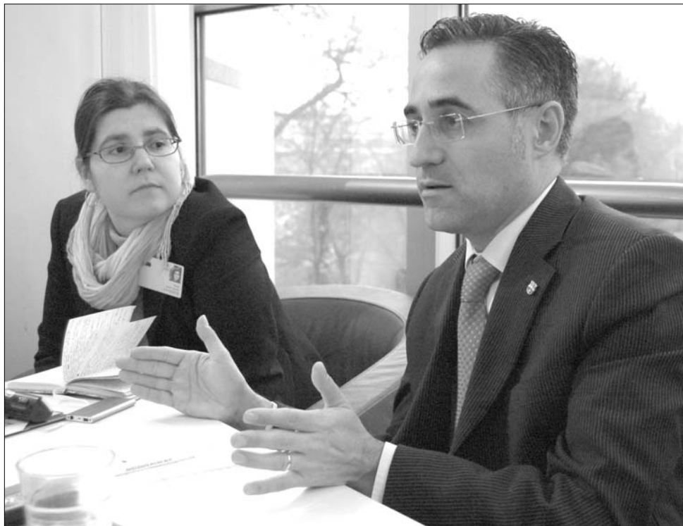
Ramon Tremosa i Balcells tanácsokat adott az újságíróknak székellyföldi autonómia ügyében

nak kell lenni, egyértelművé kell tenni, hogy a nemzeti és kulturális identitás nem lehet alku tárgya. Ha szorosan együtt van a nemzet, azt nehéz megtörni, az „ellenfél” nem oszthatja meg. „Legfontosabb, hogy a politikai alakulatok megállapodjanak egy nemzeti minimumban, amely mellett mindvégig tartanak. Ezen túl minden alakulat járhatja a saját útját, lehet célja az autonómia bővítése, a függetlenség vagy lehet liberális és konzervatív” – véli Ramon Tremosa i Balcells, kifejtve: a Franco-diktatúrában tiltott volt a katalán nyelv használata, ezért a nyelvi jogok és az oktatási rendszer fölötti rendelkezés volt a legfőbb cél. Jelenleg az elemi iskola után mindenkinek kötelező megtanulnia katalánul, felismerve annak fontosságát, hogy a Katalóniában élő spanyolok ismerjék a katalán nyelvet és kultúrát, mivel így a két nemzet tagjai közelebb kerülnek egymáshoz, és ha nem is válnak barátokká, legalább nem tekintenek ellenségként egymásra. A katalán politikus ezért arra biztatja a székellyföldi magyarokat, hogy igyekezzenek elnyerni a románok bizalmát, kommunikáljanak velük, mert az autonómia akkor valósulhat meg, ha a