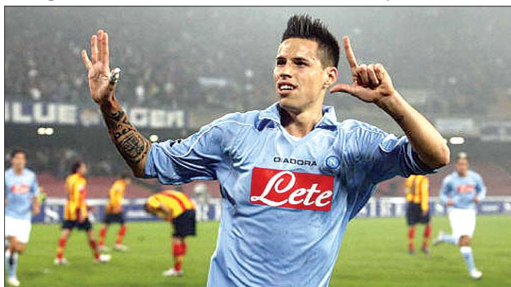
A Steaua „mumusa” Marek Hamsik, a Napoli legjobbjára lehet

▶ Az eddig megszokottnál később kezdődhet a 2014-es brazil labdarúgó-világbajnokság, mert a nemzetközi szövetség (FIFA) hosszabb pihenőt szeretne biztosítani a szezon végigjátszó futballistáknak. A torna kezdési időpontját június közepéről júliusra tennék át, így az európai ligákban május végéig érdekelt játékosok kipihentebben érkeznek a helyszínre. A részletek kidolgozásáért és a vb izgalmasabbá tételéért a Joseph Blatter FIFA-elnök által létrehozott szövetségi különítmény felel. A sportvezető azért állította össze a módosítási javaslatok értékelésével és azok megvalósításával foglalkozó csapatot, mert az idei, dél-afrikai tornán több sztárfutballista, így többek között Cristiano Ronaldo, Wayne Rooney és Didier Drogba is a töle megszokottól gyengébben teljesített. Blatter szeptemberben úgy nyilatkozott, a következő vb-n azt is el szeretnék kerülni, hogy túl sok döntetlen szülessen, és arra ösztönöznék a csapatokat, hogy nagyobb hangsúlyt fektessenek a támadójátégra. Az elnök akkor azt mondta, megfontolják, hogy eltörlik a hosszabbítást vagy újra bevezetik az aranygólszabályt. ◀