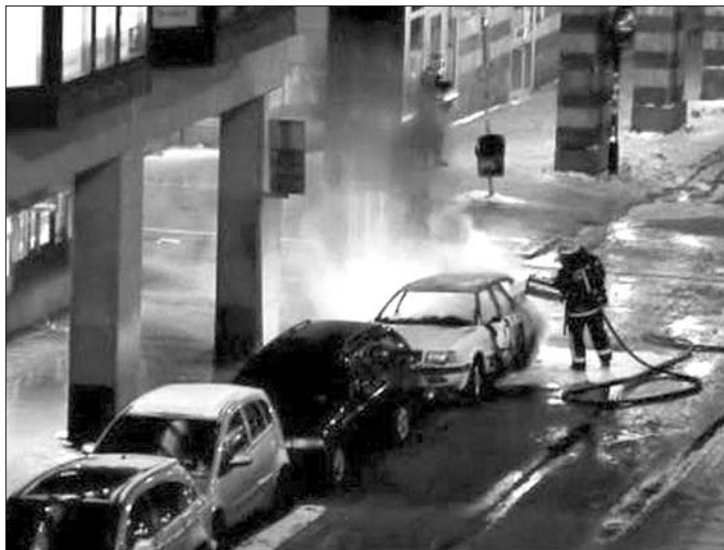
A Stockholmban felrobbant autóban állítólag gázpalackok voltak

A rendőrség és az igazságügyi minisztérium szóvivője nem közölte az elkövető kilétét, mivel még nem sikerült minden hozzátartozóját értesíteniük. Ezzel szemben mindketten megerősítették, hogy a merénylet összefügg egy kevéssel korábban a rendőrségnek és egy hírügynökségnek megküldött fenyegető elektronikus levéllel. Hivatalosan meg nem erősített sajtóinformációk szerint a rend-