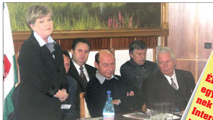
Szili Katalin volt magyar házelnök is részt vett a rendezvényen

▶ Az elmúlt hat év legerőteljesebb kormánykoalícióját a Demokrata-Liberális Párt (PD-L) és az RMDSZ alkotja – jelentette ki Traian Bănescu államfő a hétvégén, Kovásznán. 3. oldal ▶