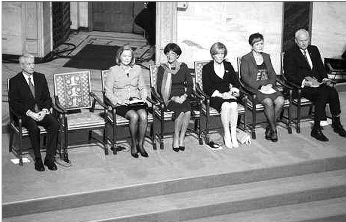
Liu Nobel-békedíját az üresen maradt székre helyezték Oslóban, mert a kínai emberjogi harcos börtönben ül