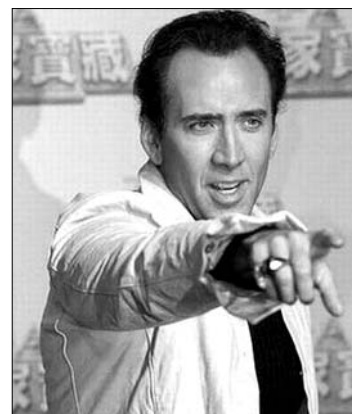
– aki a színész legújabb, Ghost Rider 2 ( Szellemlovás 2 ) című filmjének a forgatásán vett részt

Különszámot mutatott be Bukarest központjában a hétvégén Nicolas Cage ( képünkön ), aki egy bulin többet ivott a kelteténél. Az amerikai színész a főváros utcáján kezdett veszekedni kísérőivel, indulatosan hadonászva és kiabálva a türelmes társaságának. A perpatvarnak Cage testőrei vetettek véget, akik betuszkolták a színészt az autójába és a szállodába vitték. Amint arról lapunkban beszámoltunk, egy héttel ezelőtt szintén a bulvárlapok címlapjára került Nicolas Cage. Egy statisza