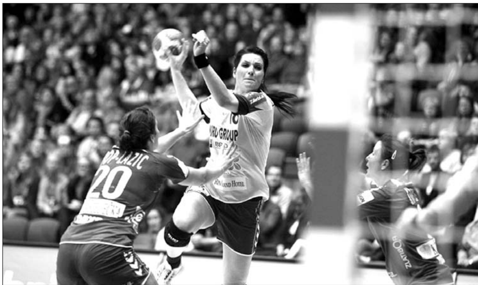
A román női válogatott (világos mez) „szétzedte” az izlandiakat a középdöntőbe jutásáért.