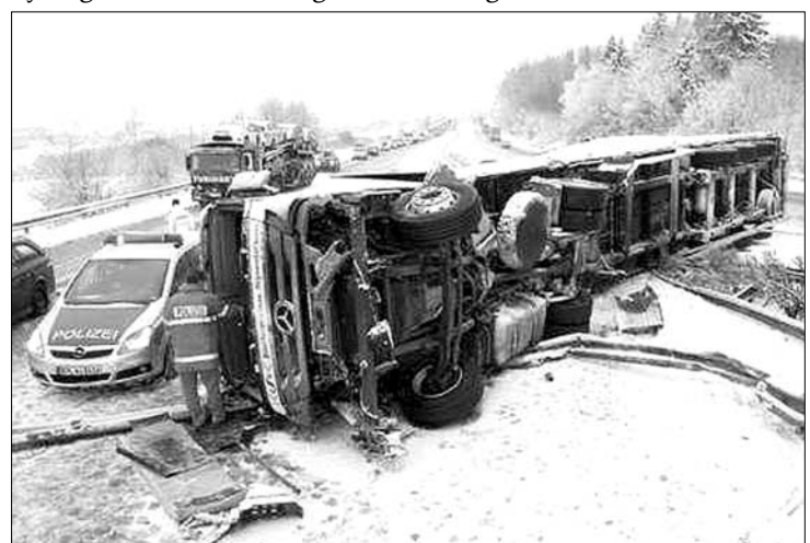
Keresztbe fordult kamion az autópályán. A hétvégi hóesés megbénította Európát

► A hóviharak és a fagypont alatti hőmérséklet miatt szerte Európában nem tudott közlekedni szombaton számos légi járat, járhatatlanná váltak a vasútvonalak és közutak. Sokan az úton veszteglő autójukban töltötték az éjszakát. Járattörést, illetve késést jelentettek Nagy-Britannia, Németország, Franciaország, Spanyolország, Hollandia, Belgium és Dánia repülőtereiről. A brüsszeli repülőtér szombat este 3-4 ezer utas vesztegelt, mert számos, tengerentúlról érkező járatot irányítottak oda más európai repülőtér helyett. Este fél nyolcig csak a londoni légikikötés 16 gépet nem tudtak fogadni. Veszélyben volt a brüsszeli repülőtér fogadóképessége is, mert este Belgiumban is elkezdett havazni. Olaszországban bedugult a legjelentősebb, északra délre tartó autópálya, és sok utazó veszteglő autójában töltötte az éjszakát. Svédországban – ahol médiajelentések szerint a másfél évszázada leghidegebb télre kell számítani – sok közúti balesetet okozott az időjárás.