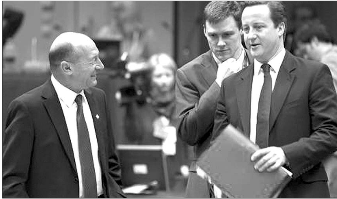
Traian Băsescu és James Cameron brit miniszterelnök Brüsszelben. Intézkedéseket hoztak az euró védelmében