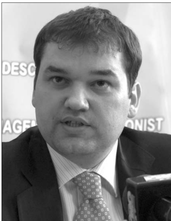
Cseke Attila egészségügyi miniszter