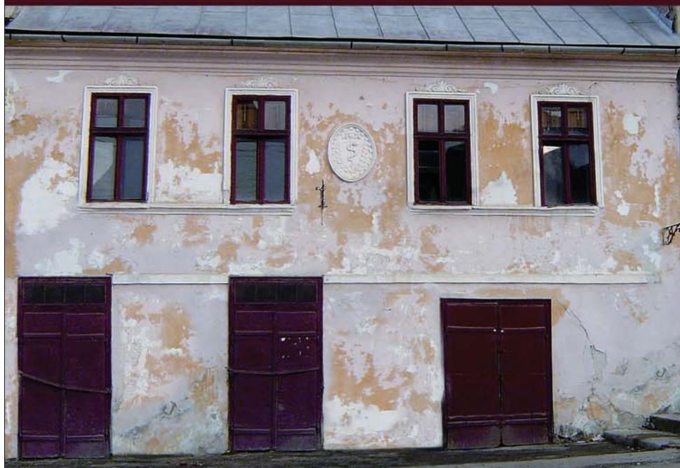
A 325. számú ház restaurálás előtt