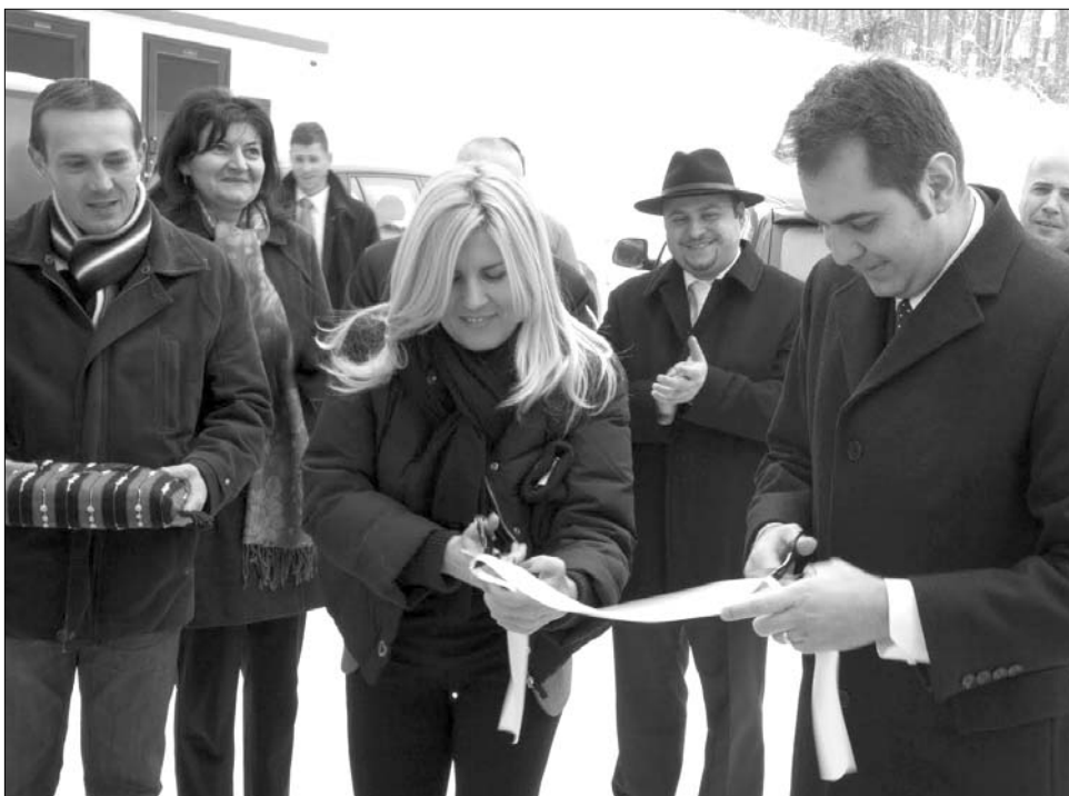
Szalagvágás Sugásfürdőn. Elena Udrea és Antal Árpád sepsiszentgyörgyi polgármester

Sugásfürdőn „ropogós”, mínusz 17 fokban hidegben avatott sípályát a turisztikai miniszter, Hatolykán pedig hagyományos gyógyfürdőt, amelynek újjáépítése 2,4 millió lejtbe kerül. Az épület földszintjén a mofetta, egy 12 kádás fürdő, orvosi rendelő, fizioterápiás kezelő, szauna és társalgó kapott helyet, az emeleten 6 fürdőszobával is rendelkező vendégszobákat rendeztek be, közös konyhával. Udrea rámutatott: Háromszéken adottak a versenyképes turizmus feltételei, nemcsak a ritka természeti adottságokkal, hanem