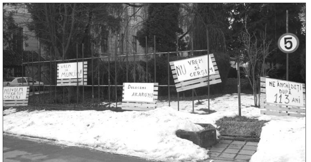
Az alkalmazottak februárban is tiltakoztak már a sepsiszentgyörgyi gyár bezárása ellen