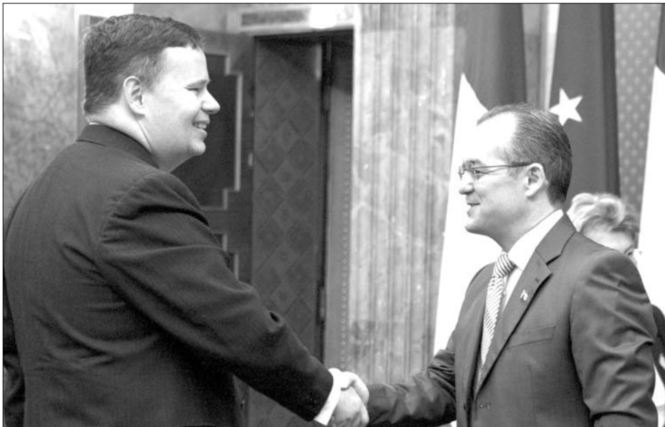
Kezet rá. Jeffrey Franks és Emil Boc jövőre újabb hitelszerződésben állapodhat meg

Az IMF romániai küldöttségének vezetője novemberben közölte, hogy a nemzetközi pénzügyminiszter