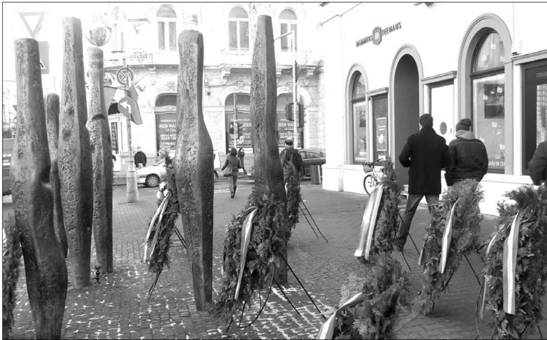
Kolozsváron az 1989-es forradalmárok főtéri emlékművénél helyezték el a kegyelet koszorúit

cember 21-i eseményekről, amikor a város gyáraiból, üzemeiből elinduló tömeg a főtéren követelte a kommunista diktátor lemondását. Az esti órákban több ezer ember gyűlt össze, a tömeg elosztása céljából a karhatalom közléjük lövetett. Hatan vesztették életüket, emléküket őrzi az egykori helyszínen felállított, fából készült emlékmű. Tegnap gyertyákat gyújtottak a forradalom hőseinek emlékére, majd koszorúkat helyeztek el a forradalmárok, a polgármesteri hivatal és a Maros megyei tanács nevében. ◀