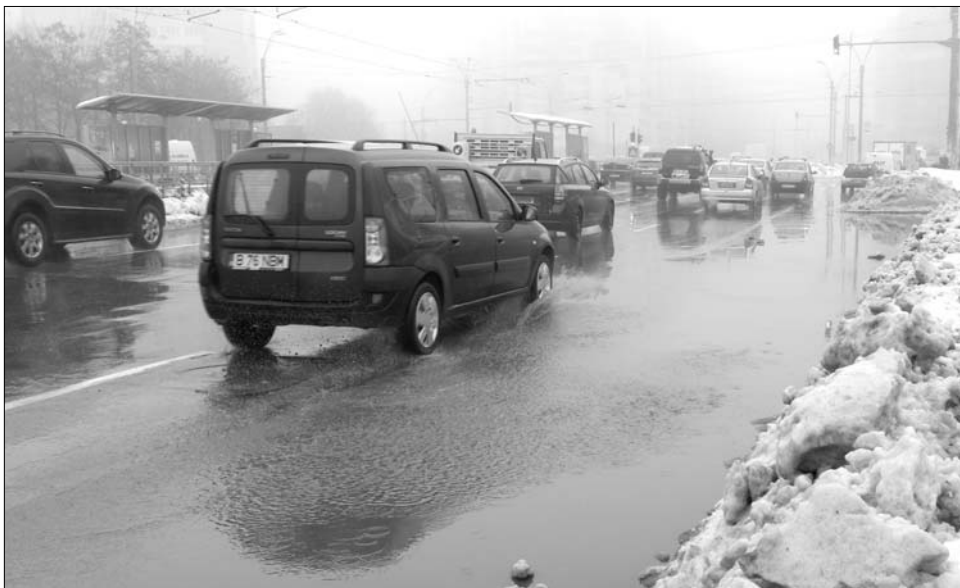
Majdnem harmincfokos hőmérsékletváltozásra lehet számítani néhány nap alatt

A fronthatás az ünnepek alatt nemcsak a frontérzékenyek számára okoz gondot az idén. „A szokatlanul gyorsan változó hőmérséklet nagyon megterheli az emberi szervezetet, a hirtelen felmelegedő idő hatására megnő a légúti fertőzések