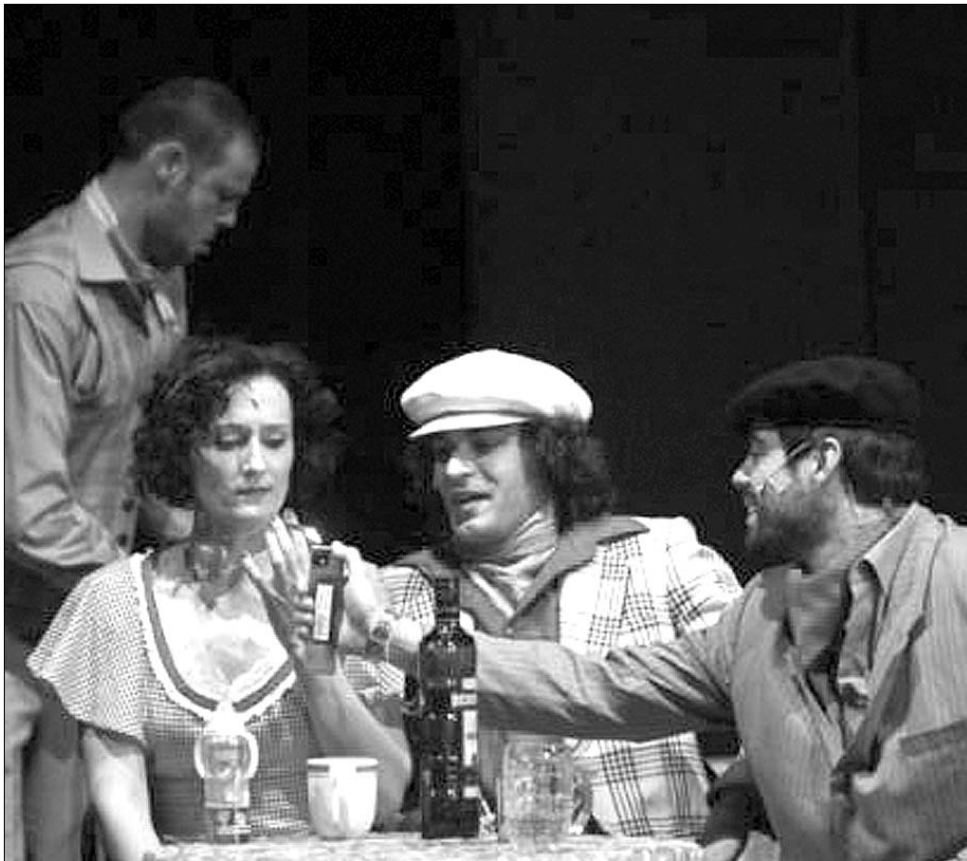
A székelyudvarhelyiek az Irma, te édes című zenés komédiával várják a közönséget

válthatók. Az Irma, te édes egy zenés komédia, amelyet az Alexandre Breffort-Marguerite Monnot-Raymond Legrand szerzőpáros jegyez. „Történetünk egy lányról szól, a neve Irma... Itt a környéken úgy hívják, hogy Irma, te édes... Hogy miért, arra a nézők hamar rá fognak jönni. Foglalkozása nem tartozik a könnyű mesterségek közé, hiszen naphosszat az utcákon áll. Ehhez a mesterséghez is szorgalom kell, a