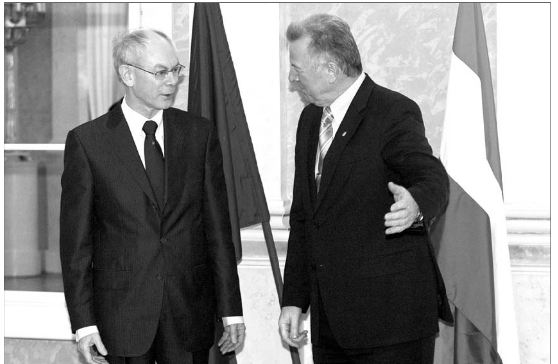
Herman Van Rompuy fogadta Schmitt Pál köztársasági elnök. Az EU pártját ritkítóan nehéz fél év előtt áll

Orbán hangsúlyozta, hogy minden tagállamnak be kell tartania a legszigorúbb pénzügyi kritériumokat, és az eladósodottságra olyan megoldást kell találniuk, amely egyúttal felszámolja a különbségeket az országok között. Álláspontja szerint Európának úttörőnek kell lennie a kutatásban és az innovációban, olyan körülményeket kell teremnie, amelyek arra készítik a fiatal tudósokat, hogy a kontinensen maradjanak, ugyanakkor le kell bontani a tudósok mobilitásának akadályait is az unióban. Megfogalmazása szerint mindez jelenleg is nagyon fontos az uniónak, amely a megbékélés és a régi elmentétek felszámolásának szellemében biztonságot és jólétet teremt a tagállamainak. „Az euró-zóna stabilitásának megőrzé-