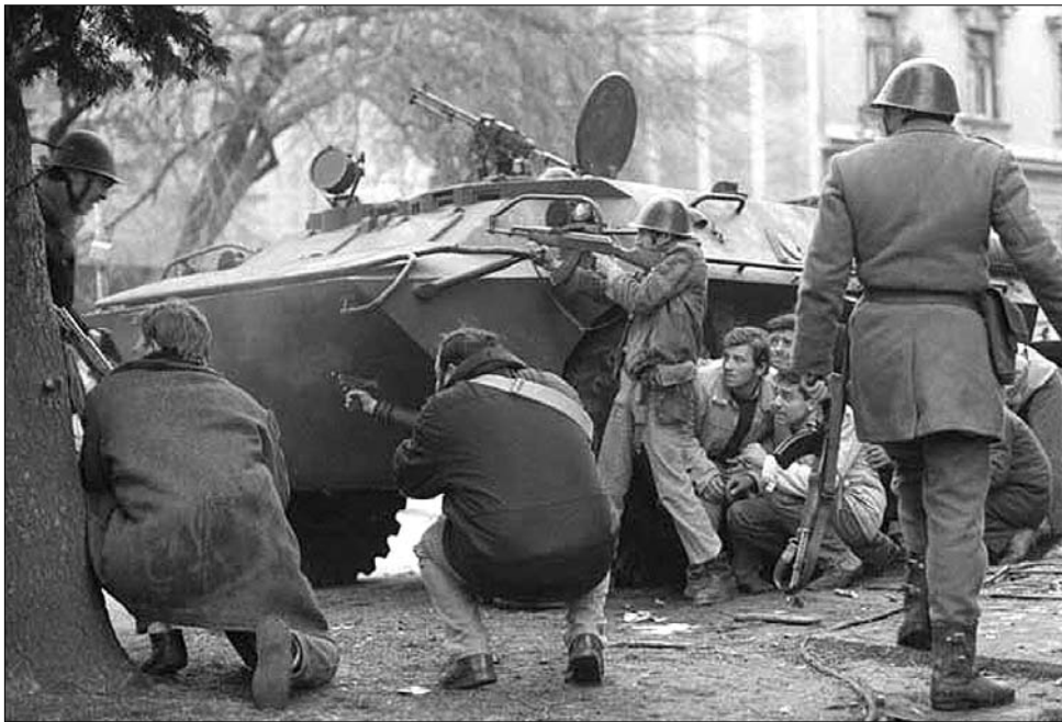
Többen haltak meg Ceaușescuék menekülése után, mint a diktátorpár által elrendelt megtorlások idején

A hadsereg és a Szekuritáté átállása után Ceaușescu már csak az R-hálózatban reménykedhetett. Létezéséről azonban minden bizonnyal tudtak a szovjetek – már csak azért is, mert a hálózatot elsősorban ellenük építették ki, de a struktúráról értesülhettek a rögtön december 22-én honvédelmi miniszterre kinevezett Nicolae Militaru tábornoktól is, aki bizonyítottan a szovjet hírszerzés, a GRU embere volt. Moszkvának így könnyű volt semlegesítenie a hálózatot, amelynek legfeljebb elszórt egységei léphettek akcióba. Az általuk keltett diverzió viszont megközelíthette az Iliescu-féle „terroristák” akcióit. ◀