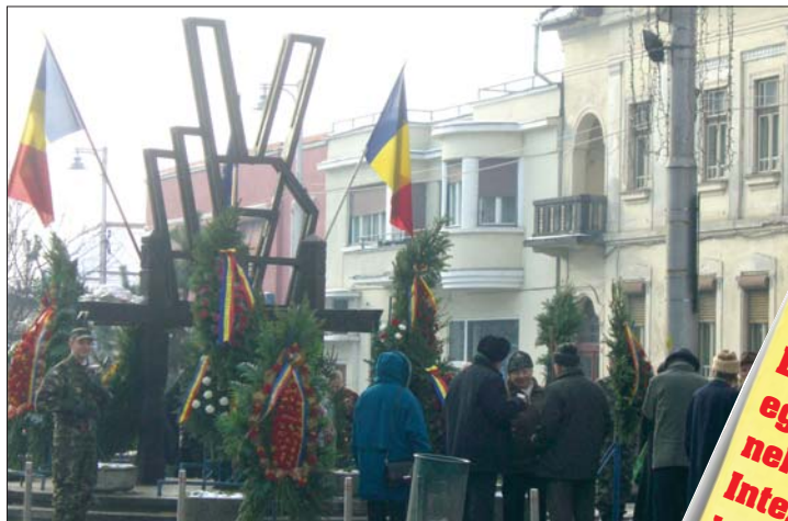
A forradalom áldozataira emlékeztek. 3. oldal ▶