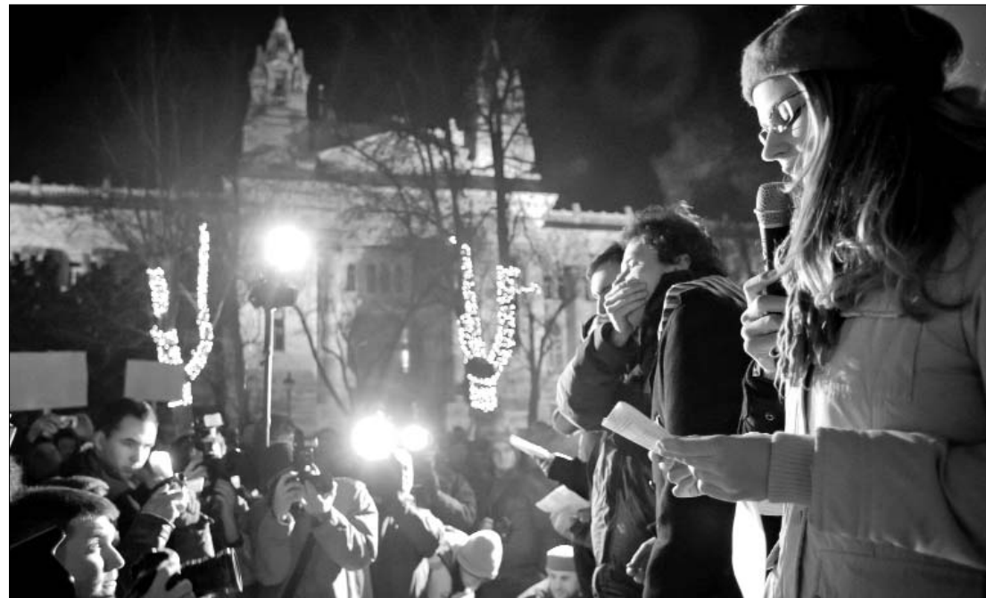
Hiába tiltakoztak a médiatörvény ellen a budapesti Szabadság téren. A Fidesz „héjái” kivájták a média szemét

Az AvPGalaxy értesülései szerint H.R. Giger, aki a filmfanatikusok körében elsősorban az Alien -filmek lénydizájnereként ismert, visszatér az Alien -univerzumba, és csatlakozott Ridley Scott tervezett előzmény mozifilmjéhez, mely 3D-ben fog elkészülni. Azt, hogy a film mikor kerülhet bemutatásra, egyelőre még mindig nem tudni hivatalosan. Bár jelenleg rengeteg pletyka kering az Alien -előzményfilmmel kapcsolatban, a 70 éves svájci festő, szobrász, díszlettervező, aki Oscar-díjat is kapott A nyolcadik utas: a Halál különleges effektusaiért, úgy tűnik, hogy valóban részt fog venni a produkcióban. Mindezt a felesége, Carmen Scheifele erősítette meg a német médianak adott interjújában. Mint ismeretes, Ridley Scott eredetileg a svájci úriember által a Necronomicon hoz készített festményeiről kapta az ihletet az Alien szörny alakjához, majd később megkérte őt, hogy a saját rajzai alapján készítsen félelmetes monsztrát.