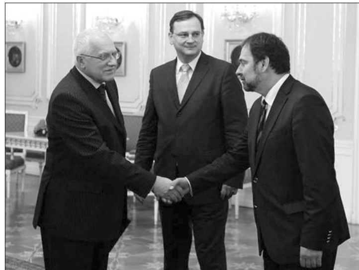
Karácsonyi kézfogás. Václav Klaus (balról), a kormányfő és a belügyminiszter

nye nem okozott meglepetést. A botrányos ügy miatt a hárompárti koalíció ugyan csúnyán összeveszett, s egyikük még a koalíció elhagyását is meglebegtette, de Václav Klaus államfő a keddi parlamenti ülés előtt magához ren-