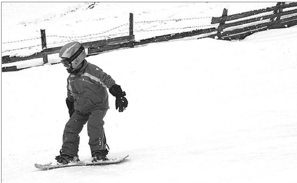
A sítáborok többségében síoktatást is biztosítanak a gyerekeknek