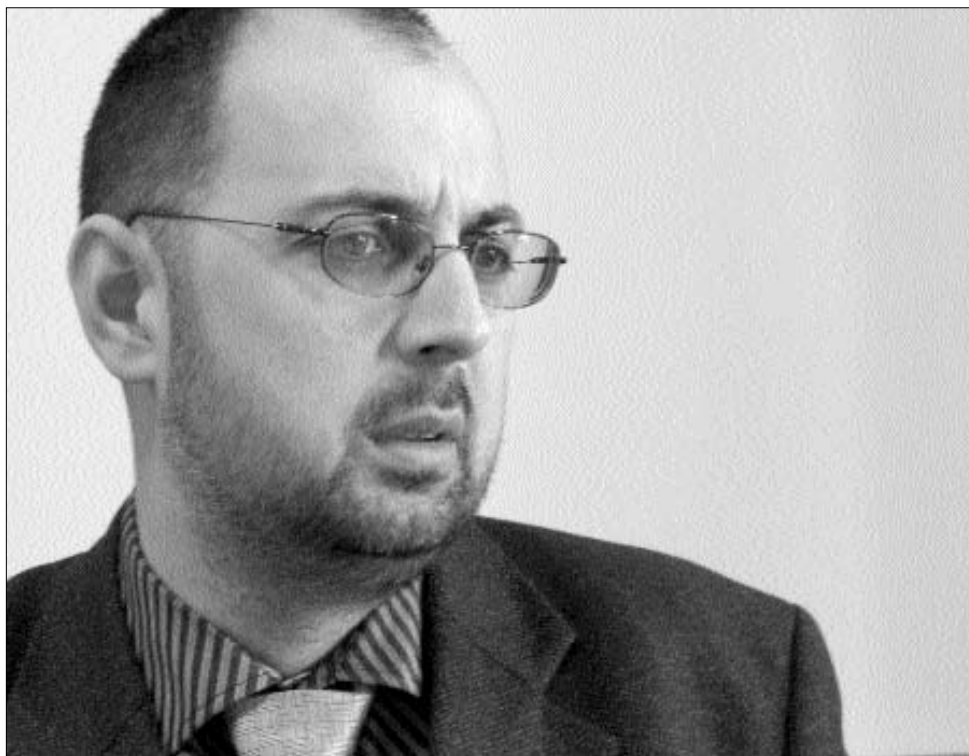
Kelemen Hunor művelődési miniszterrel, RMDSZ-elnökkénttel Bukarestben beszélgettünk

– Nem az a fontos, hogy mikor, hanem az, hogy hogyan. Ha rajtunk múlna, akkor tegnaptól lenne autonómia. A hogyan sokkal fontosabb, és a hogyanra az a válaszom, hogy egy hat és fél százalékkal rendelkező kisebbségi szervezet csak a többségi társadalommal folytatott párbeszéddel, parlamenti eszközökkel és nemzetközi lobbival tudja elérni az autonómiát. Ehhez kell egyfajta akciótervet elkészíteni a következő jó néhány esztendőre. A következő két évben két jogszabályt kell elfogadtatnunk: a kisebbségi törvényt, amely a kulturális autonómia kereteit biztosítja, és a régióatszervezési törvényt. Mindkettő a törvényhozásban vár sorsára, és valószínűleg jövő tavasszal tudunk újra elkezdni ezekkel foglalkozni. Ehhez azonban nagyon erős szolidaritásra van szükség.