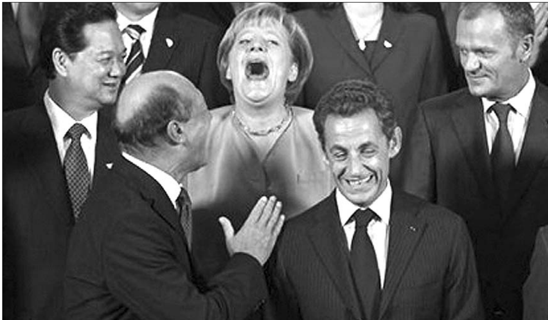
Ki nevet a végén? Traian Băsescu (háttal) szórakoztatja Angela Merkelt és Nicolas Sarkozyt

Legpresszimiztábbnak Leonard Orban, az államfő európai ügyekben illetékes főtanácsadója, az Európai Bizottság korábbi többnyelvűségi biztosa mutatkozott, aki a Radio France Internationale -nak (RFI) adott tegnapi interjújában úgy vélte, Románia nagy valószínűség szerint már csak annak érdekében tehet erőfeszítéseket, hogy a jövő márciusra tervezett csatlakozás halasztása minél rövidebb időtartamú legyen. Orban szerint Brice Hortefeux francia és Thomas de Maiziere német belügyminiszterek közös levele – amelyben az Európai Unió két alapító állama Románia és Bulgária 2011 tavaszára tervezett Schengen-csatlakozásának halasztását kéri – nagy valószínűség szerint azt jelenti, hogy Bukarest és Szófia nem válhat a szabad mozgást lehetővé tevő övezet részévé az eredeti ütemterv szerint. Hozzátette: több jel utal arra, hogy akár évekig eltarthat a csatlakozás halasztása, hiszen Franciaországban 2012-ben, Németországban pedig 2013-ban rendeznek választásokat, ebben az időszakban pedig nagyon kemény tárgyalások várhatók az EU következő költségvetéséről. „Ezek