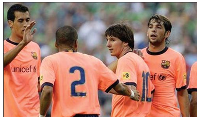
Messiék nem bírtak a Bilbaoval, de így is jó szezonot zárnak

David Bernsteint, a Manchester City korábbi első emberét választották tegnap az Angol Labdarúgó Szövetség (FA) elnökévé. A választásra január 25-én az FA tanácsának is rá kell bólintania. ◀