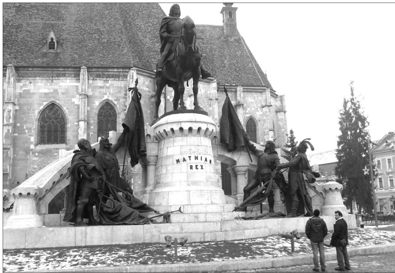
A kincses város látványossága. Nagyon sok turista a Mátyás-szobor talapzatán állva szereti megörökíteni kolozsvári látogatását.

többsége úgy vélekedik, hogy nincs jelentősége annak, hogy páran felmásztak a szoborra. „Nem hiszem, hogy komoly ügyet kellene csinálni ebből, a világon mindenhol előfordul, hogy az emberek felmásznak egy köztéri szoborra. Engem személy szerint nem hoz lázba annak a gondolata, hogy megmásszak bármilyen szobrot is, de ha valakinek kedve szottyan ilyesmire, és örömet leli benne, hadd tegye” – mondta el a punknak egy tizenéves. ◀