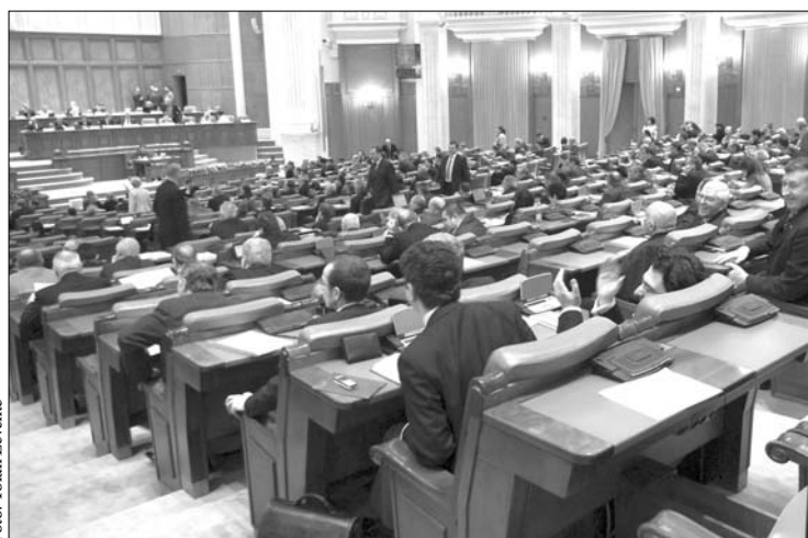
A kormányparti honatyák futószalagon vetették el a büdzsétörvény módosításait

lamfő még nem hirdetetett ki. Mint ismert, a közalkalmazottak jövő évi bérét szabályozó törvény még nem lépett érvénybe, ennek ellenére a jövő évi büdzsé a jogszabály előírásaira alapoz.