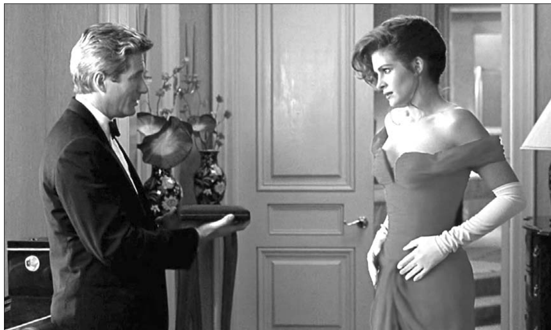
Garry Marshall húszéves klasszikusát, a Julia Roberts főszereplésű Pretty Woman is láthatjuk az ünnepek alatt

Eladó Barót központjában két csillagos panzió. 500 m 2 haszonfelület, 10 szoba fürdőszobával, 40 személyes étterem. Barót központjában 2 szintes új lakás eladó. 5 szoba, 800 m 2 telek, ipari áram, nagy műhely. Telefon: 0726-313 820.