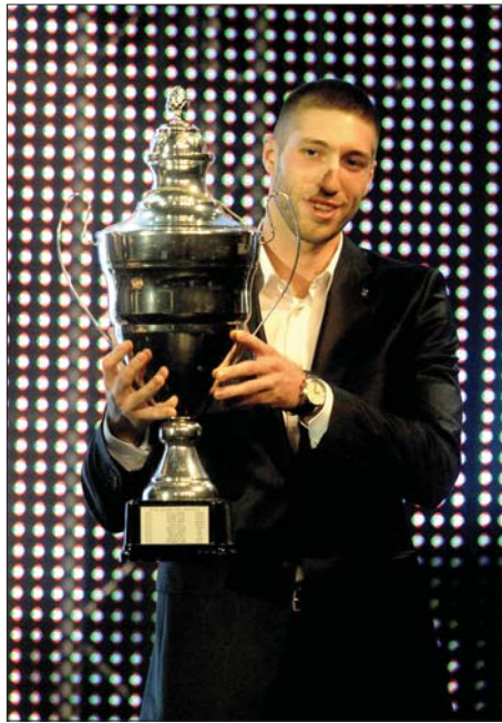
Berki Krisztián tornász

Janics Natasa idén három aranyat és két ezüstöt nyert a