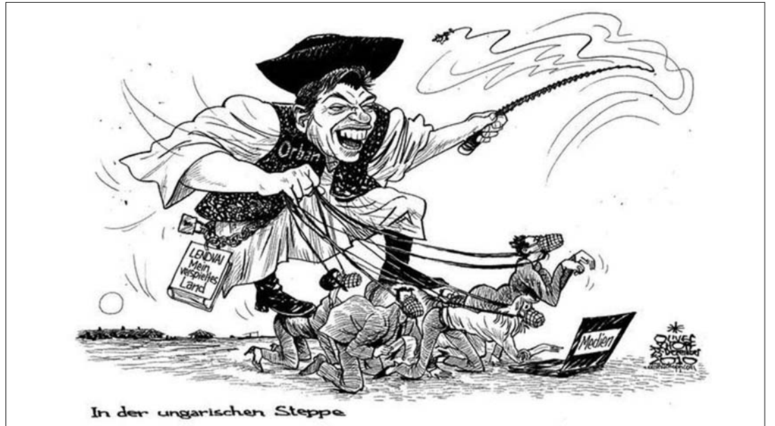
Az osztrák Der Standard karikatúrája: „A magyar sztyeppén”. Orbán Viktor ráuszítja kutyáit a médiára

„Így számos indoka lehet annak, ha felemeljük szavunkat, amikor egy országban veszélybe kerülnek a demokráciát és az egyetemes emberi jogokat érintő közös elvi alapok” – mondta Asselborn hozzátéve: ez következett be Magyarországon a médiatörvény jóváhagyásával. „Egyetlen másik tagállamban sem fordul elő, hogy a teljes médiaszektort egyazon állami hatóság felügyelete alá helyezték, amely hatóság kormány által kijelölt tagjai egyazon párthoz tartoznak” – hangsúlyozta. Arra, hogy szó van-e valamiféle Magyarországot fenyegető szankcióról, a luxemburgi miniszterelnök így válaszol: „Nem tudok róla. Léteznek eljárások, amelyeket tiszteletben kell tartani, ezenkívül csak bele kell nézni az uniós alapszerződésbe, és abból kiderül, hogy mi fog kockán. Azt azonban mindenkinek tudnia kell, hogy január elején Orbán miniszterelnök prezentálja az Európai Parlamentben a magyar