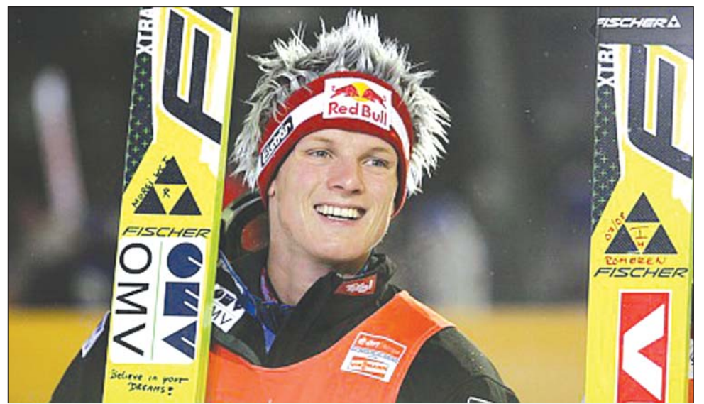
Az egyik nagy esélyes: Thomas Morgenstern a Világkupa-pontversenyt is vezeti 605 ponttal

A Világkupa-sorozatba tartozó hagyományos viadalt január 1-jei Garmisch-Partenkirchen-i követi, majd