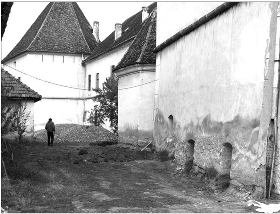
A román kormány támogatja mintegy másfél millióval a Mikó vár külső felújítását