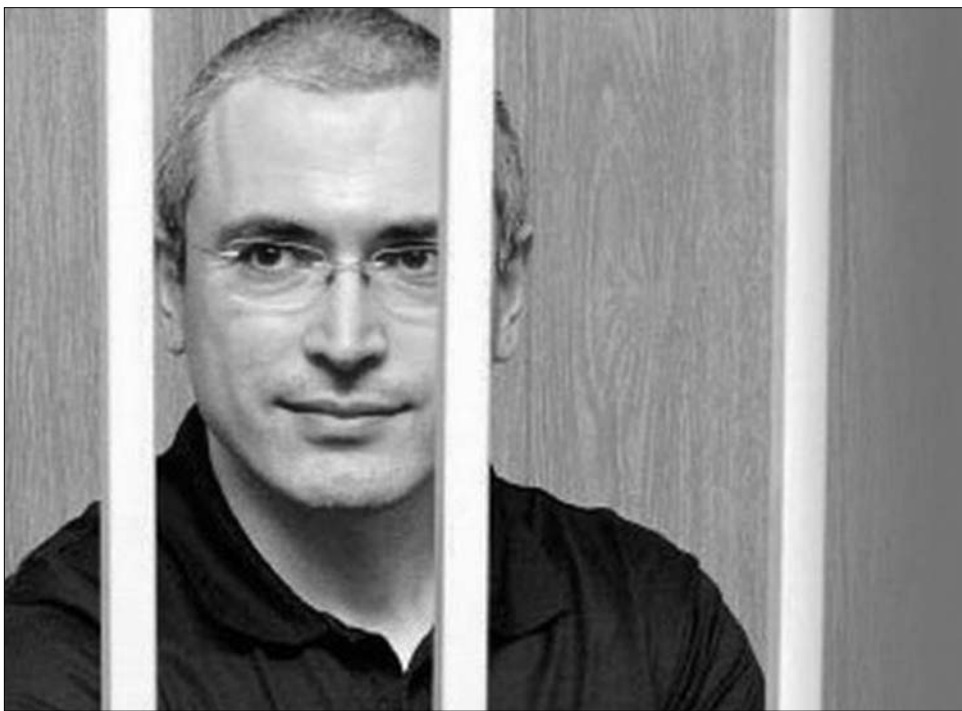
Mihail Hodorkovszkij, az „ősellenség”. Rács mögött, újabb büntetésre várva – de mosolygósan

Hodorkovszkij vegyészetet és gazdaságtant tanult. A Komszomol nevű kommunista ifjúsági szervezetben tisztséget viselve Mihail Gorbacsov pártvezér jóváhagyásával már a kommunizmus végóráiban kísérletezni kezdett a kapitalizmussal. Kezéssel az összeomlás előtt, 1988-ban az oroszországi