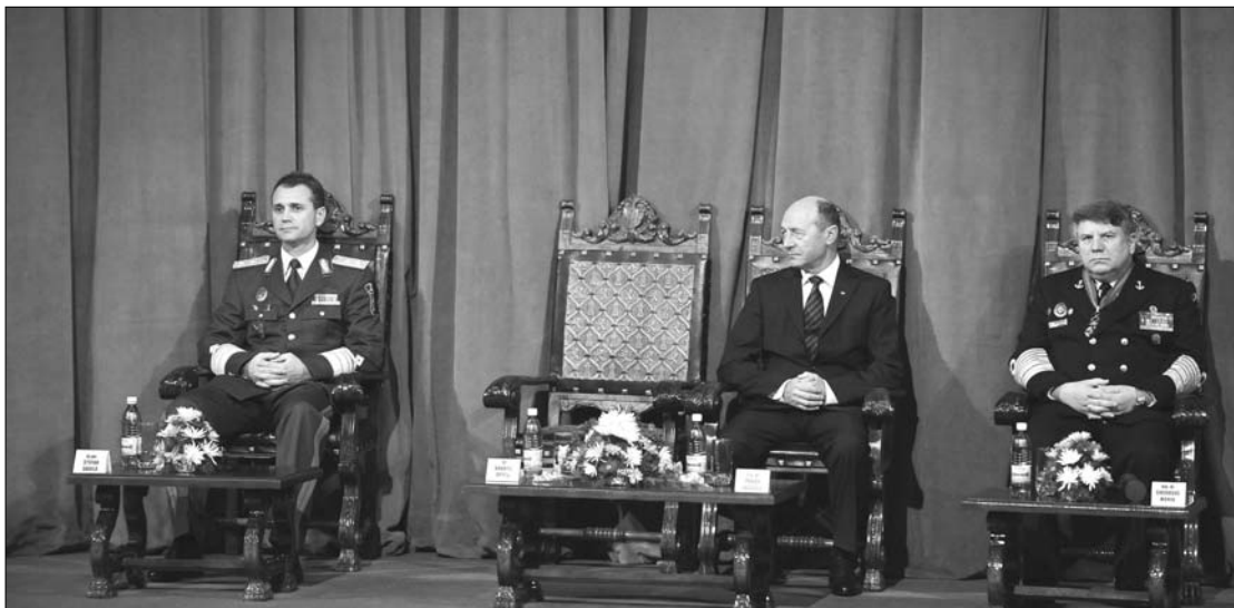
Traian Băsescu államfő is részt vett a stafétabot-átadáson: jobbján Ștefan Dănilă, balján Gheorghe Marin.

díjazottak ellátmánya. Az államfő elmondta, előző este Emil Boc kormányfővel és Gabriel Oprea védelmi miniszterrel „áttekintették a számokat”, és garanciát kapott arra, hogy a katonai nyugdíjak alsó határát az említett szinten be lehet fagyasztani. „Nem fogom eltitkolni, hogy amikor Oprea miniszter először beszélt a 3000 lejes katonai minimál nyugdíjról, szkeptikus voltam. Odafigyeléssel és politikai akarral nyugodt öregkorot biztosíthatunk azok számára, akik a haza védelmének szentelték életüket” – vonta le a következtetést Băsescu. ◀