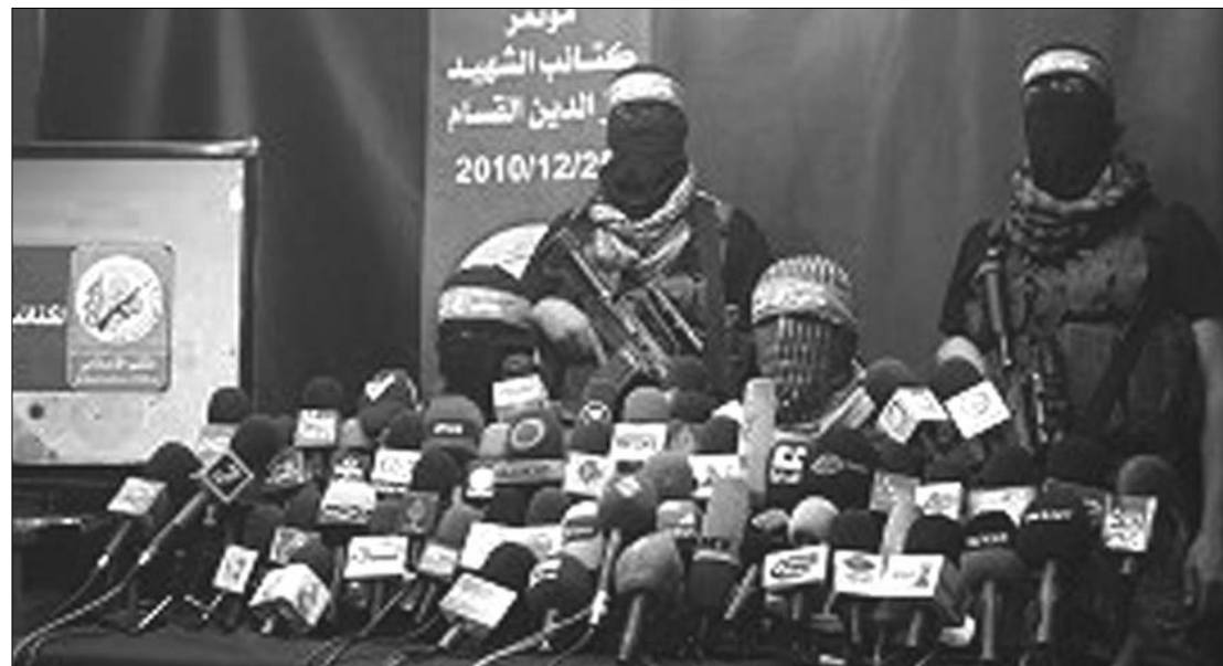
Merényletekkel a békéért? Az iszlámista terroristák az egész nem arab világot fenyegetik

► Észak-Koreában kisiklott az országot irányító diktátor utódjául kijelölt Kim Dzsong Un számára készült ajándékokat szállító vasúti szerelvény. Sokan máris szabotázszt kiáltottak. A vonat kevéssel Szjudzsuból történt indulását követően, a kínai határ mentén tért le a sínekről – jelentette az Észak-koreai Nyílt Rádió . Az adó szerint a phenjani titkosszolgálat vizsgálódik, mivel a baleset mögött a rendszer ellenzőit feltételezi. „A vágányok Észak-Koreában előregedtek, ezúttal azonban olyanmennyire sérültek voltak, hogy vélhetően kevéssel a szerelvény érkezése előtt tudatosan rongálták meg őket” – idézte a rádióadó az észak-koreai titkosszolgálat egy munkatársát. Közlélek szerint a vonat nagy mennyiségben szállított drága órákat, korszerű tévékészülékeket a január 8-án huszonhetedik életévét betöltő diktátorcsemetének. Kim Dzsong Unt arra szemelték ki, hogy apját, a súlyosan beteg Kim Dzsong Ilt (68) váltsa a kommunista diktatúra élén. Az utód luxur iránti vonzódása közismert. A Kim-dinasztia harmadik nemzedékét képviselő ifjúról az észak-koreai televízió a hétvégén sugárzott először hosszabb felvételeket. Kim Dzsong Unt a közelmúltban négyéves tábornokká nevezték ki, és elemzők szerint ez is hozzájárult a koreai helyzet kiéleződéséhez. ◀