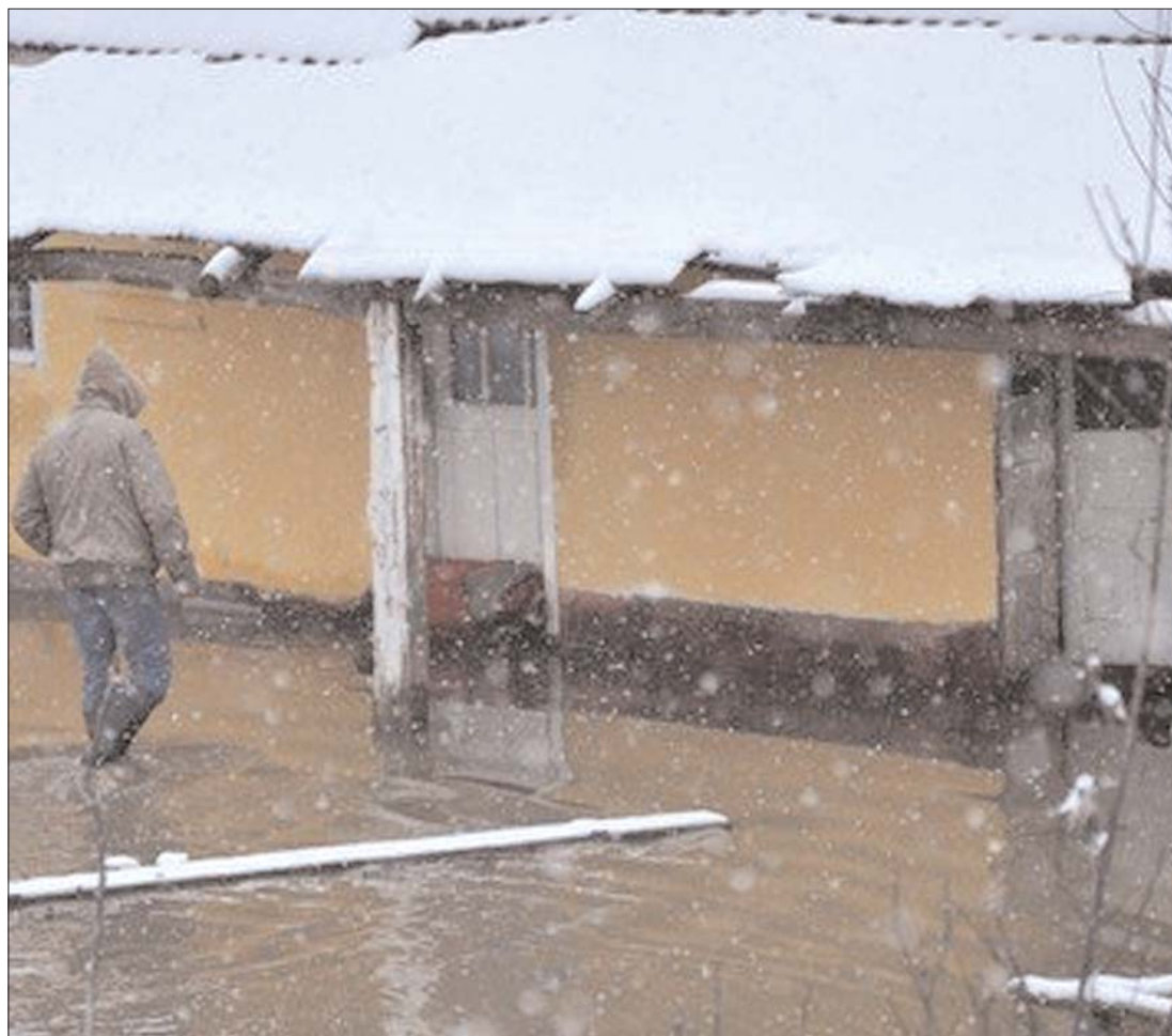
A napokban Szatmáron pusztító károsultjainak gondján enyhít, ha megkötötték a kötelező biztosítást

▶ Hamarosan vége a türelmi időnek, január 15-ig vala- mennyi hazai lakástulajdonos- nak biztosítást kell kötnie a tu- lajdonában lévő ingatlanra. Ro- mániában 8 millió lakást tarta- nak nyilván, eddig csupán 140 ezret biztosítottak: a teljes állo- mány két százalékát. A biztosí- tótársaságok szerint rohamosan