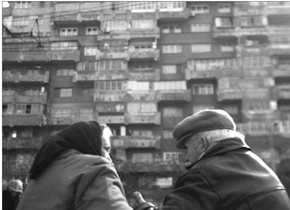
A tömbházlakások és téglapületek után 20 eurós illetéket kötelesek fizetni tulajdonosaik

Aki nagyobb biztonságot szeretne, illetve az említett