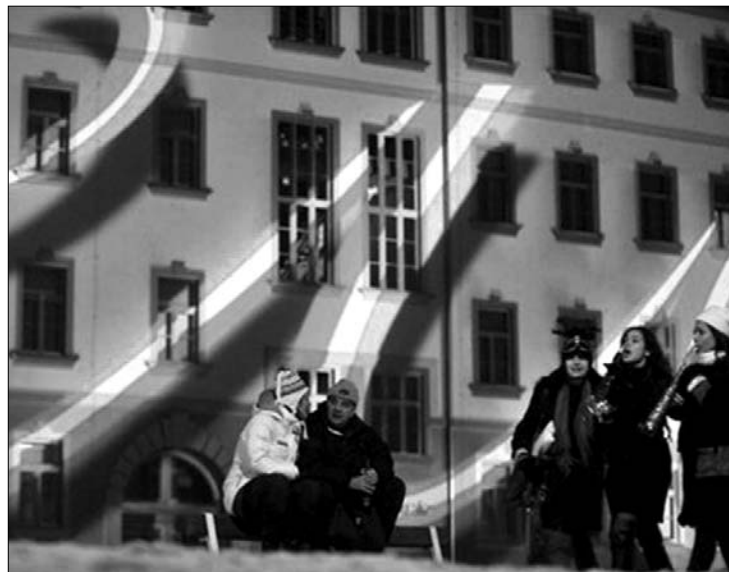
A magyar elnökség szilveszteri „felvezetője” a budapesti Millenáris Parkban

Vitathatatlanul erős ember áll Magyarországon élén, amely szombattól átveszi az Európai Unió elnökségét – írta pénteken a La Libre Belgique című belga napilap. A mérsékelt jobboldali újság konzervatív, opportunist, populista és vakmerő politikusként írta le Orbán Viktor miniszterelnököt, aki „Magyarország hagyományos értékeit dicsőíti”. Christine Dupré közép-európai tudósító emlékeztetett arra, hogy a Fidesz kétharmados többséggel nyerte a választásokat, és azt követően a változások nem is vártak magukra. Szankciókat követel a magyar kormány ellen tizenhárom jelentős európai nagyvállalat elsőszámú vezetője a különadók és a külföldi vállalatokra vonatkozó egyéb intézkedések miatt – írta a hétfőgőn a Die Welt című német lap online kiadása egy december 15-én íródott közös levélre hivatkozva.