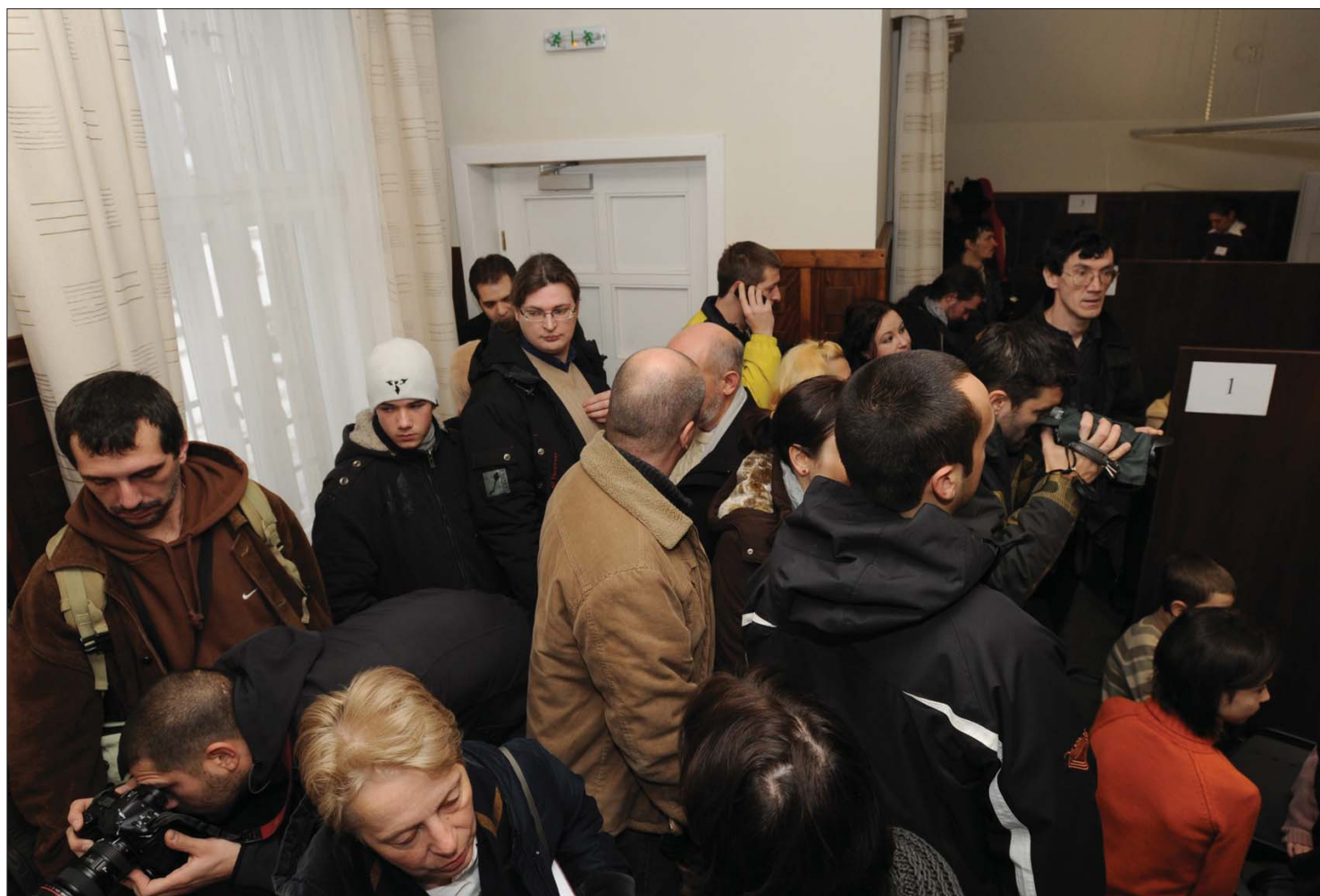
A csíkszeredai főkonzulátuson tegnap szinte nagyobb volt a sajtósok száma, mint a magyar állampolgárságért folyamodóké

Fennakadások nélkül fogadták a magyar állampolgárság igénylőit a konzulátusok