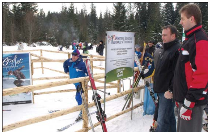
Síparadicsom. Borszéken új felvonó várja a sízőket

▶ Valóságos síparadicsommá nőtte ki magát szilveszterre Borszék. A helyi önkormányzat abban bízik, hogy nemcsak a téli szezon lendíti fel a beruházás, kedvet kapnak a ráfordításra az épületeket eddig elhanyagoló ingatlantulajdonosok is. 7. oldal ▶