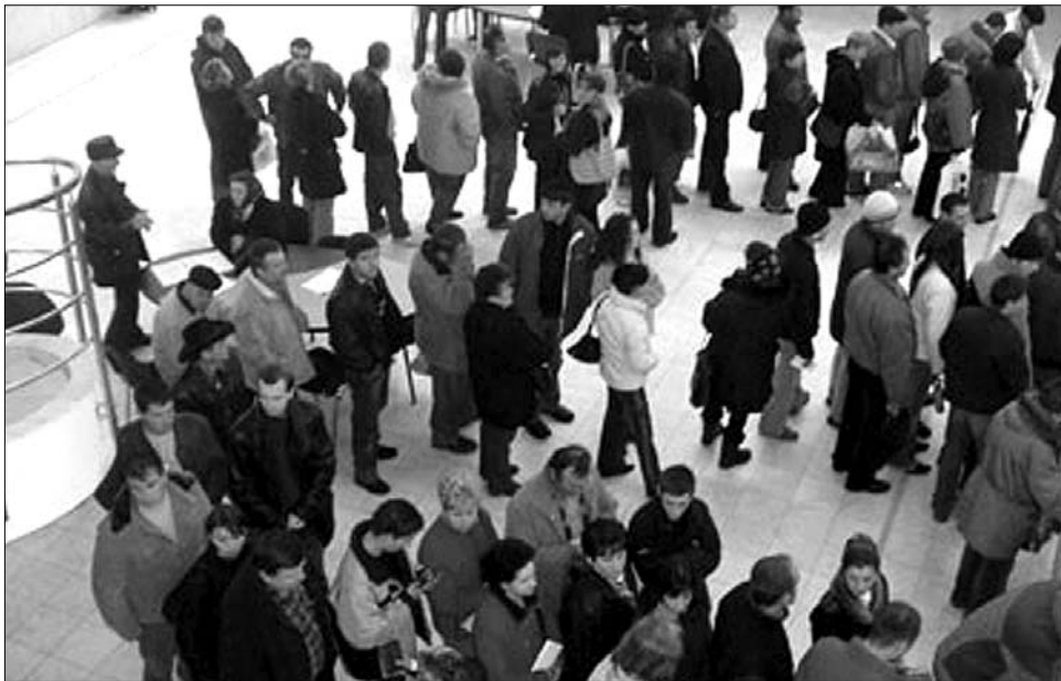
Az ügymenet egyszerűsödik, az illetékek nőnek: az adóhatóság 2011-ben is „történelmi várakozás” vár

Kevesebb bürokráciát és papírmunkát ígér a cégeknek 2011: egyetlen egységes nyilatkozat váltja fel azt az eddigi öt kérdőívet, melyeket az adóhatóságokhoz kellett leadni a cégeknek és magánszemélyeknek illetékfizetési, valamint társadalombiztosítási hozzájárulás ügyekben. Külön könnyítés, hogy mindezt elektronikus úton is benyújthatják. „Cserébe” állandó jel-