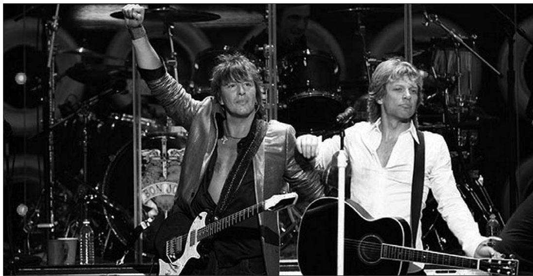
A nyáron a Bon Jovi amerikai rockegyüttes zenéjére lehet bulizni Bukarestben, de Sorin Opreșcu a U2-t is beígérte

A hónap végén a tervek szerint a legendás Roxette látogat Bukarestbe egy, világkörűli turné részeként. A Zone Arenába a turnén kívül új albummal tér vissza a majdnem 25 éves múltira visszatekintő zenekar, amely