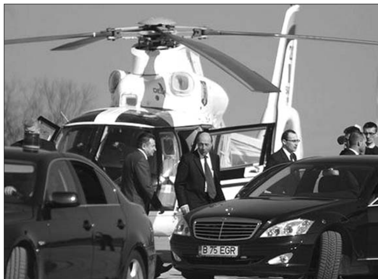
Az elnöknek könnyű. A helikopter nem kerül forgalmi dugóba

Az államfő még mindig túlságosan nagyra tartja a köztisztviselők számát. Tájékoztatója szerint tavaly 1,2 millió állami hivatalnok dolgozott Romániában, számukat két-három éven belül 900 ezerre kell csökkenteni. Újságírói kérdésre válaszolva azt mondta: az elesettek szerinte két kategóriába sorolhatók. Az egyikbe tartoznak azok, akik valóban