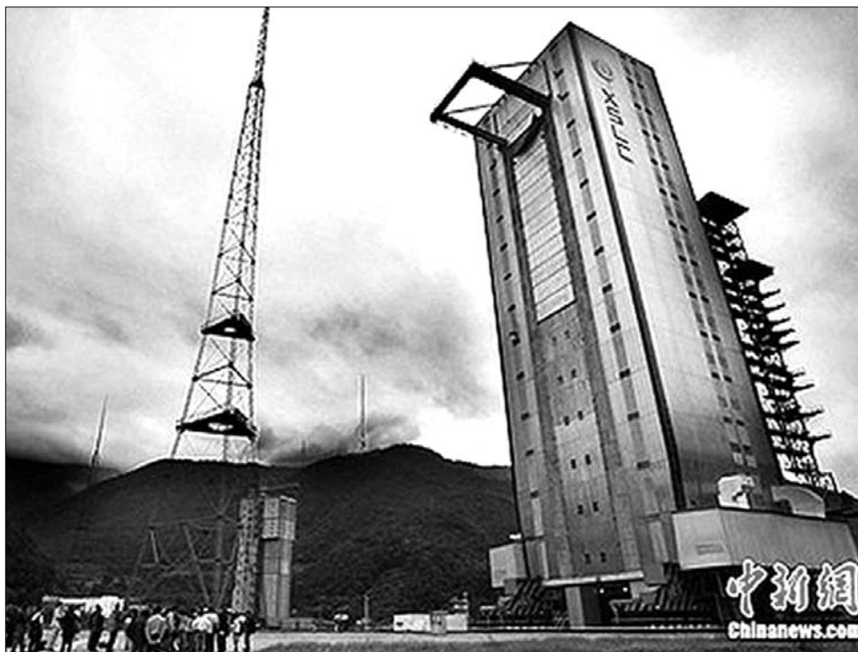
Kína: a xi chang-i rakétakilövő központ. Innen indult útjára a Chang' e2 holdkomp

A kínai tudományos-technológiai fejlődést azonban nem csupán statisztikák és