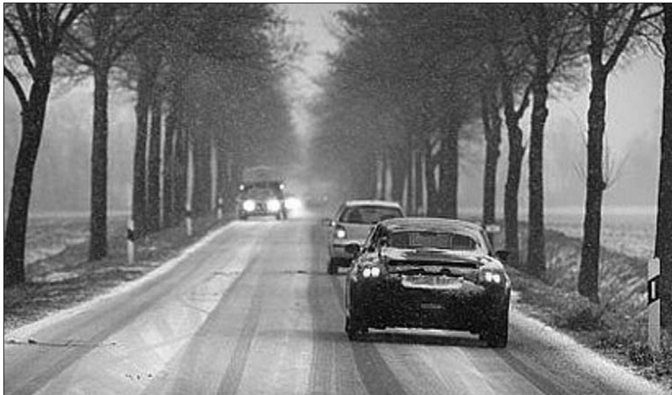
A tegnap főként a dél-romániai megyékben okozott gondot a havazás

megfelelő biztonsági felszerelések, illetve kellőképpen téli-ésített gépjármű nélkül. Hargita megyében telefonos ügyelet várja az autósok hívásait, kérésre helyszínre érkeznek a szolgálatban lévő hókotrók. A hószolgálat telefonszáma: 0266-207774. Máramaros megyében a Gutin hegységben és az ismert síközpont, Borsa körzetében nehézkes a közlekedés: ebben a térségben nem csak a hó, de a belvizek is meglepetéssel szolgálhatnak. A rendőrség munkatársai arra figyelmeztetnek, a vékony hóréteg alatt gyakori a jegesedés, a nappali olvadás után átfagyások keletkezhetnek, ezért különösen körültekintően kell vezetni ott is, ahol látszólag akadálymentes az áthaladás. ◀