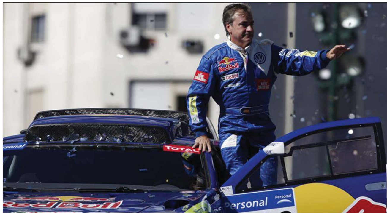
A tavalyi győztes Carlos Sainz jól rajtolt a 33. Dakar-ralin. A szakemberek idénre Sainz-Peterhansel-csatát jósoltak

Tegnap a Cordoba és San Miguel de Tucuman közötti 764 km-es szakaszt teljesítette a mezőny. ◀