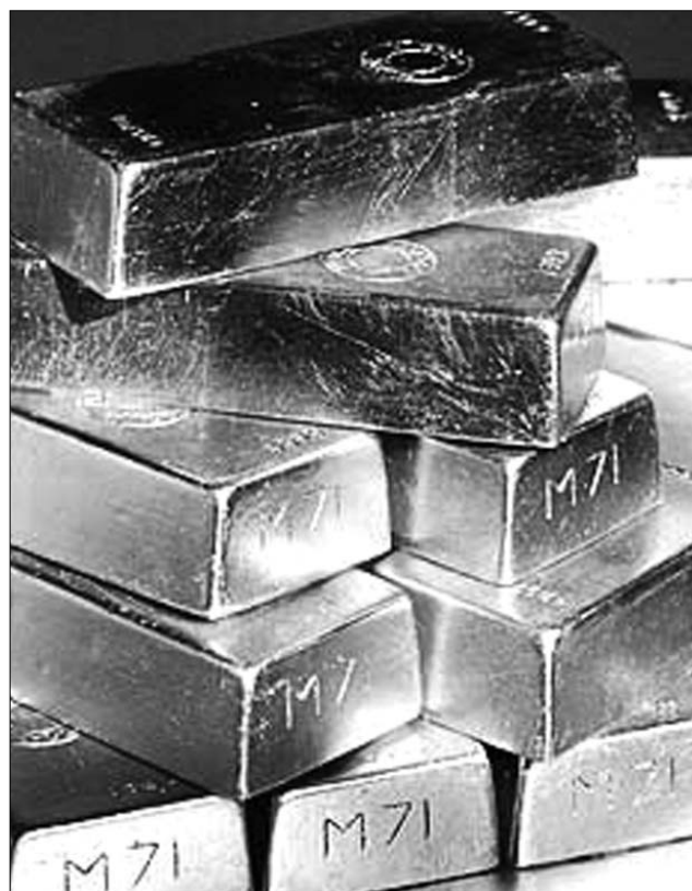
Az arany diadalmenete folytatódhat 2011-ben

Ami az ipari fémeket illeti, a Barclays Capitalnál a rézfelhasználás növekedésére számíthatnak, de a legjobban teljesítő eszköz nem ez lesz, hanem a cink, amelynek jövőre több mint 20 százalékkal nőhet az ára. A régió szakemberei is hisznek az ipari fémekben. „A kereslet együtt mozog a gazdaság növekedésével. Ha Kínában hosszú távon 6–7 százalékos marad évente a bruttó hazai termék (GDP) bővülése, az fenntartja az erős keresletet az ipari fémek iránt” – mondta a Világgaz-