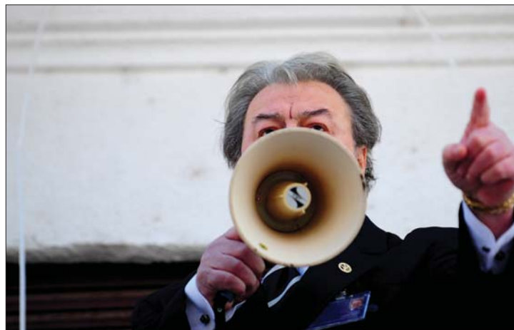
A bárd. Corneliu Vadim Tudor átkozódva védte pártja székházát

kívül hagyása és hivatalos személy elleni erőszak miatt. Az eljárás lefolytatásához az EP-képviselő mentelmi jogának felfüggesztése szükséges. 3. oldal ▶