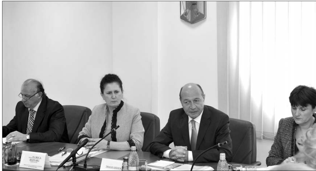
Traian Băsescu államfő a CSM tegnapi ülésén felelősséget vállalt és harcot hirdetett Schengen-ügyben