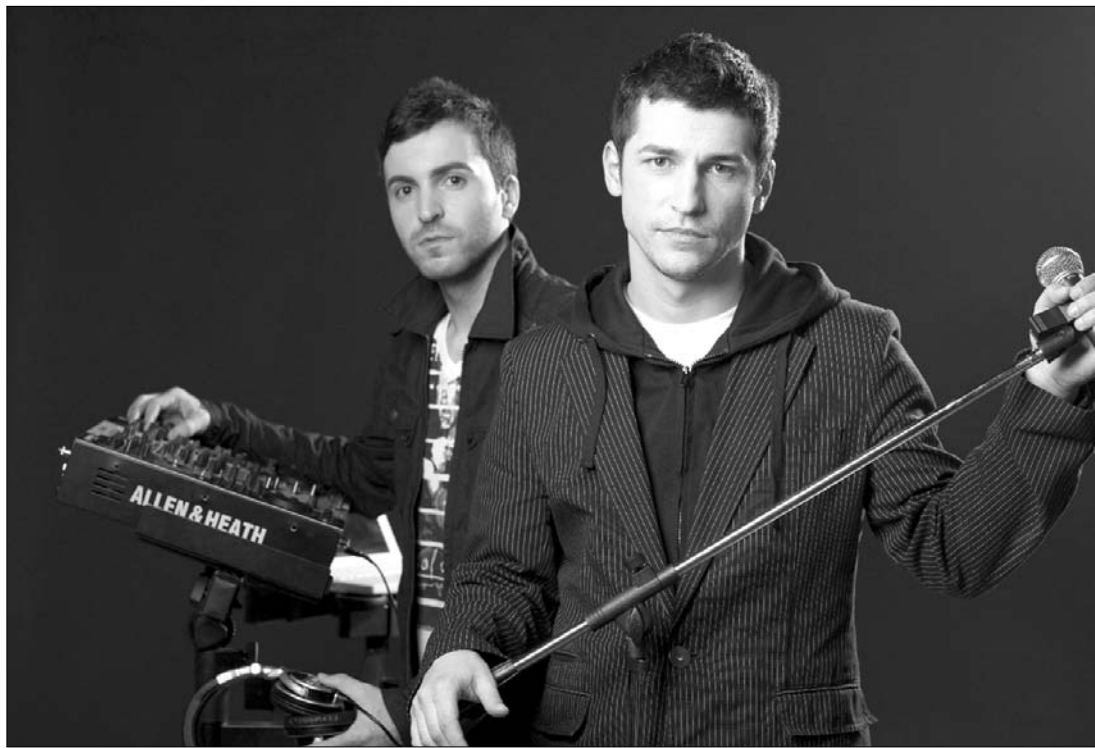
A Deepcentral nevű együttes In Love című dala Lady Gaga Alejandro -ját nyomta le a romániai rádiók toplistáján

A srácok első dala Cry it away címmel érkezett, és szinte azonnal meghódította a rádióállomá-