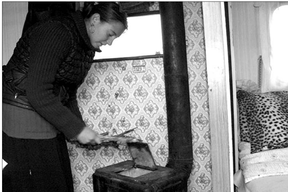
A távhőszolgáltatás ára miatt egyesek a hagyományos, tűzfával történő fűtésre fanyalodnak

Marosvásárhelyen az összeomlás fenyegette hosszú időn keresztül a távfűtési rendszert, jelentős részben a feltorlódtott adósságok miatt. A helyiek közül sokan saját hőközpontot szereltek be, hogy ne kelljen osztozni a lakóközösségek közös tartozásában, és azért is, hogy a hőközpontok leállása esetén is biztosítani lehessen a fűtést. Tízezer lakás esett így ki a távhőrendszerből, hétezer maradt – inkább kényszerből, mint tudatos választás eredményeként – a „közösben”, számukra az Energomur helyett decembertől a magyarországi RFV ígér megfelelő minőségű szolgáltatást. A kedélyek azonban a cégváltással sem csitulnak. „Sokkal többet fizetünk a