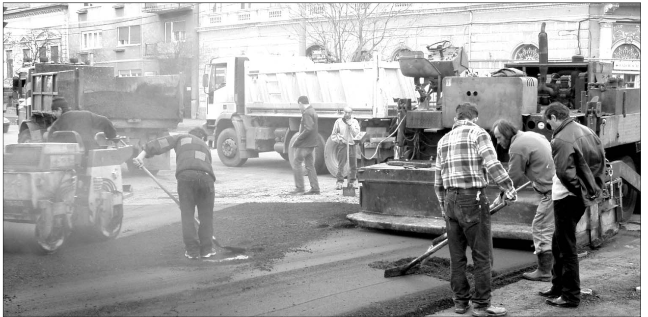
Pályázati alapoknak köszönhetően átfogó útjavításokra is sor kerülhet idén a legtöbb erdélyi nagyvárosban