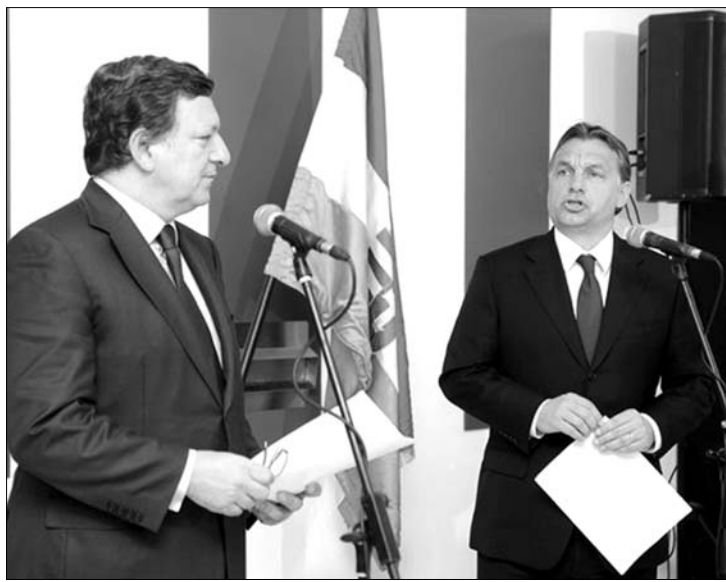
José Manuel Durao Barroso pénteken találkozik Orbán Viktorral

A folyamatos külföldi bírálatokra reagálva egyébként tegnap a magyar külügyminisztérium közleményt adott ki, amely szerint a kormány „töretlenül elkötelezett az Európai Unió elnökségi programjának végrehajtása mellett, ugyanakkor határozottan elutasít minden olyan megnyilatkozást, mely kétségbe vonja a magyar uniós elnökség cselekvőképességét és az elnökségi feladatok korlátozásának lehetőségét veti fel”. Magyarország jogköreinek leszűkítését kedden Németország javasolta. ◀