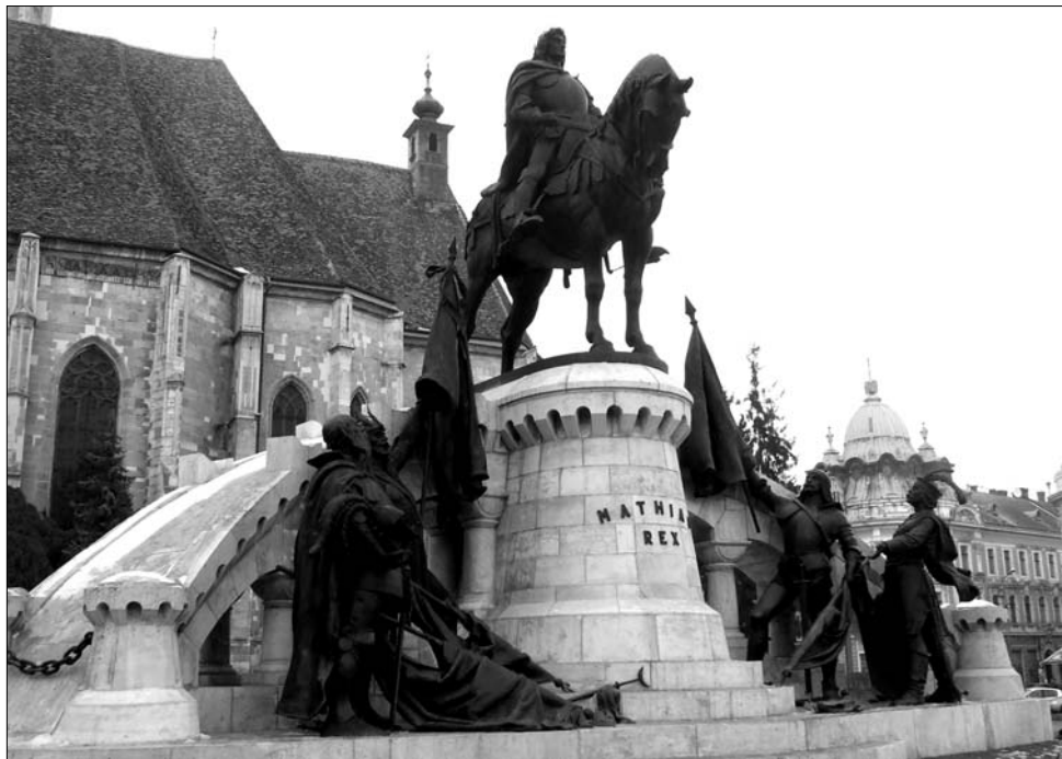
Teljes pompájában díszelgő Mátyás király szobra Kolozsvár főterén, január 22-én adják át hivatalosan

A tavaly tavaszi becslésektől eltérően – melyek szerint már július végére a talpazat fog állni a lovas alak és a körülötte álló vitézek – csak októberben került vissza eredeti helyére a szoboregység. A visszahelyezést követően ismét felgyorsult a munkatempó: a helyi tanács kikötötte: a szoborcsoportnak legkésőbb november végére késznek kell lennie. A várva várt időkapuszula végül november elején került be a ló belsejébe: több száz kézzel írott levél, vers, folyóirat és napilappéldány, valamint egy, a szoborcsoportról forgatott dokumentumfilm tekercse is helyet kapott a rézhengerben. Az ismét eredeti pompájában díszelgő alkotás technikai átadása tavaly november 29-én valósult meg. A restaurálás ideje alatt több rémhír is felbörtölt a kolozsvári magyarok kedélyeit: egyik szerint a fötérrel máshová viszik restaurálni az bronzalakokat, a másik szerint december 1-jén, Románia nemzeti ünnepén kerül sor a szobor hivatalos átadásra. ◀