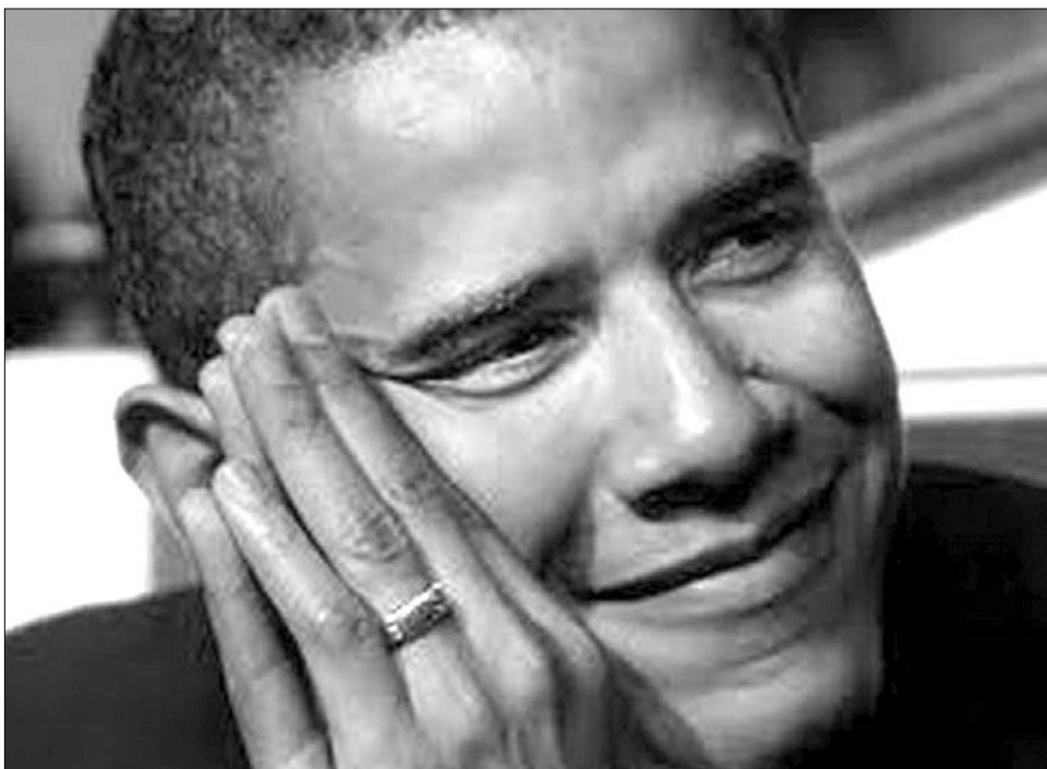
Palesztin–izraeli béketárgyalások. Barack Obama: aludjunk rá egyet?

Már a közvetlen tárgyalások újraindítását is erős psz-