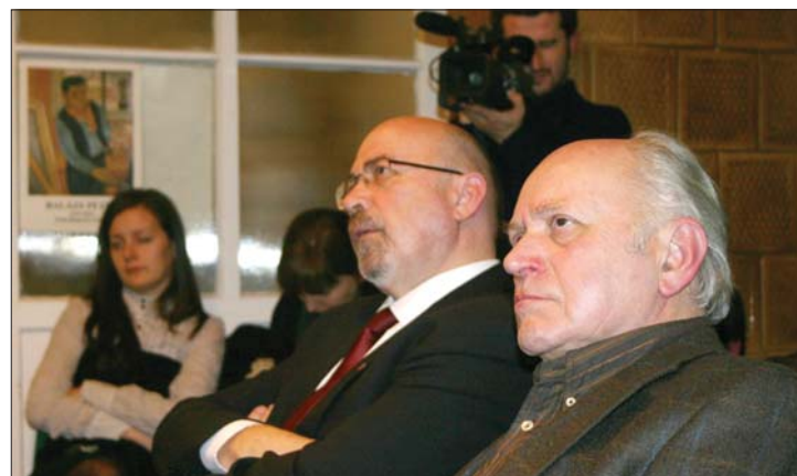
Markó Béla és Kántor Lajos a kolozsvári könyvbemutatón

szervezet alapjait” – jelentette ki Markó Béla miniszterelnök-helyettes A hívó szó és a vándor idő című könyv bemutatóján. 6. oldal ▶