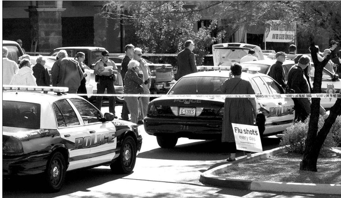
A tucsoni bevásárlóközpontban hat ember meghalt, 12 pedig megsebesült, valamennyien Gabrielle Giffords támogatói