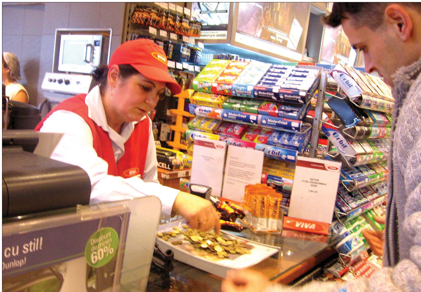
Huszonöt kilogrammot nyomó pénzerme-mennyiséggel fizettek tegnap Marosvásárhely egyik benzinkútjánál a tiltakozó fiatalok

Országszerte beindult az autósok aprópénzes tiltakozása az üzemanyagár-emelés ellen