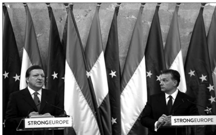
José Durao Manuel Barroso és Orbán Viktor sajtótájékoztotnak.

Az együttes ülést és az Európai Bizottság elnökével tartott találkozót követő sajtóértekezleten a magyar elnökség tartalmi kérdéseiről szólva a miniszterelnök kiemelte, hogy az erőfeszítések főleg gazdasági kérdésekre összpontosulnak majd. A magyar elnökség csak akkor lesz sikeresnek tekinthető, ha ebben a fél évben megtörténik a Lisszaboni Szerződés módosítása, illetve ha az unió elfogadja azt a hat jogszabályt,