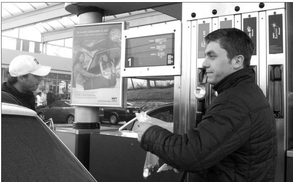
A fiatalok akciója alatt három óra szinte leállt az egyik benzin-kút Marosvásárhelyen

A már több városban is alkalmazott forgatókönyvnek megfelelően Marosvásárhelyen is csak pár liter üzemanyagot tankoltak a tiltakozók, illetve ráérősen szélvédőt mostak, gumiabroncsba pumpáltak levegőt. „Igazából egyikünknek sincs konkrét haszna az üzemanyag árából, nem fuvarozással foglalkozunk, többségünk egye-