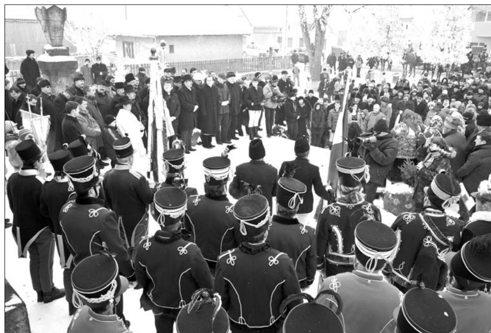
A rendezvényen Maros, Hargita és Kovászna megye közéleti személyiségei vettek részt.