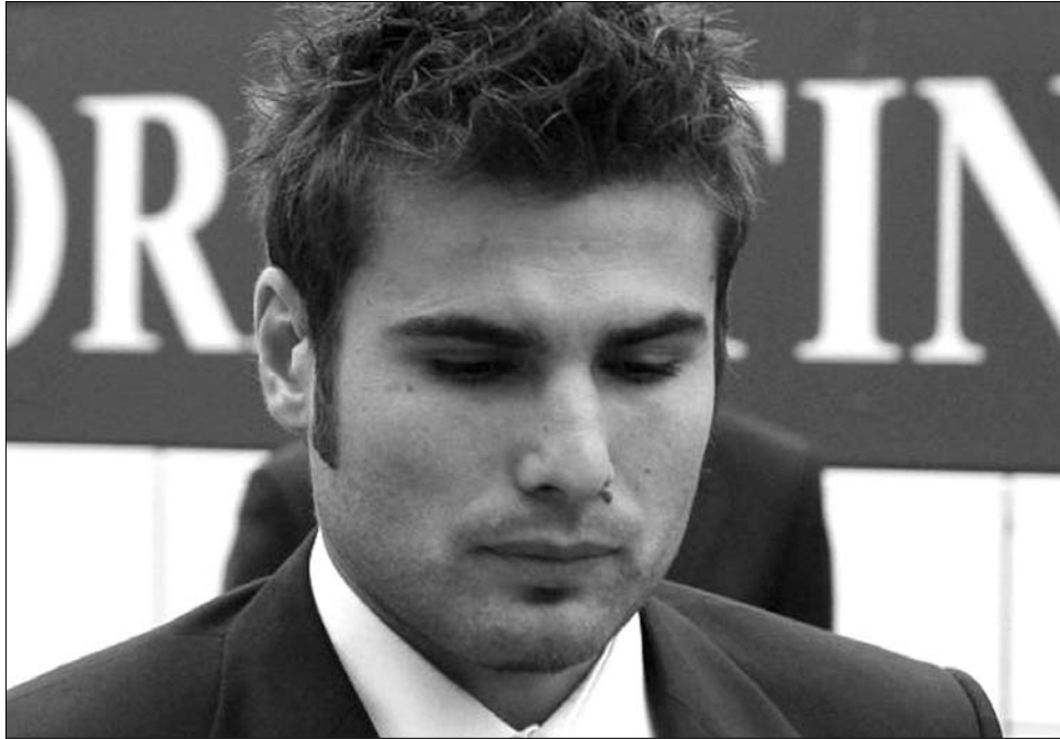
A londoni és a firenzei botrányok után Adrian Mutu várhatóan a Galatasarayhoz igazol

A legfrissebb hírek szerint a firenzei klubvezetés annak lehetőségét fontolgatja, hogy 2012 nyaráig, azaz a Fiorentinával élő szerződés lejártáig felfüggeszesse Mutu játékjogát, és így gyakorlatilag lehetetlenné tegye pályafutása folytatását. A viola vezetés a fizetés csökkentését is szeretné elérni, csakúgy, mint a szibutramin-üggyben.