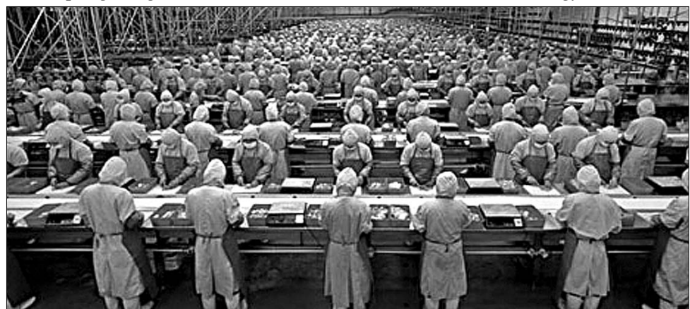
Egy minimálbért dolgozó román munkás Írországban tízszer többet keresne

Romániának jelenleg összesen húszmilliárd euró értékben van hitelmegállapodása a Világbankkal, a Nemzetközi Valutaalappal, valamint az Európai Bizottsággal. Az IMF egy küldöttsége január 25-én érkezik Bukarestbe, hogy vizsgálódásokat végezzen a legutóbbi megállapodás betartásáról, illetve hogy egy küszöbön álló új elővigyázatossági kölcsönről tárgyaljon. ◀