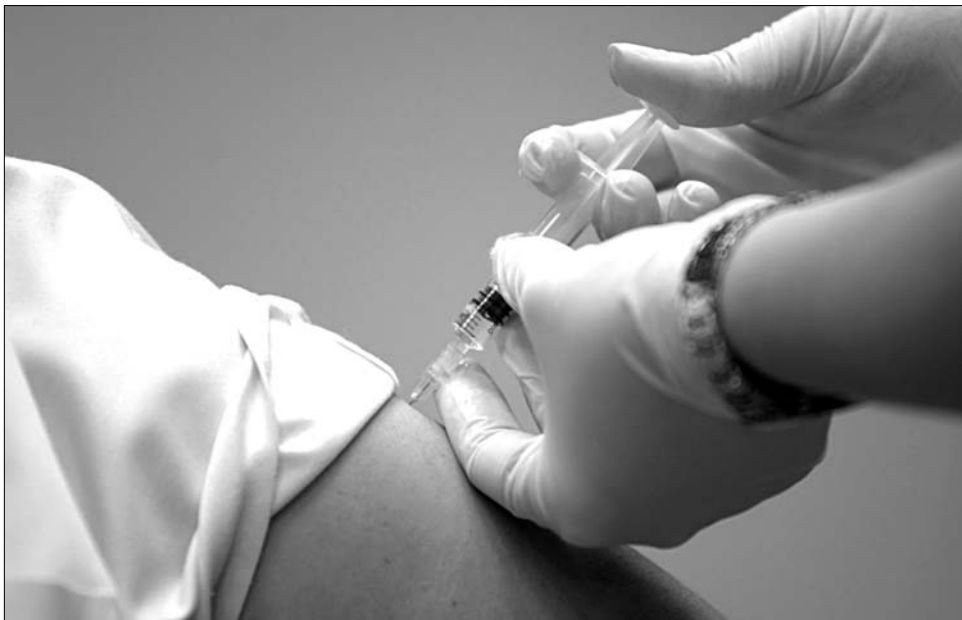
Három halálos áldozata volt már az idén az újinfluenza-vírusnak Romániában

tő fertőzési góccok, a megbetegedések száma az ilyenkor szokásos mértéknek felel meg. Eddig összesen 16 influenzás megbetegedést regisztráltak országszerte, ebből 13 AH1N1-vírusos (új influenza) megbetegedés, egy eset A-H3N2, kettő pedig B típusú vírusfertőzés. A halálesetekkel kapcsolatban az Egészségügyi Minisztérium arról tájékoztatta lapunkat, hogy az elhunyt betegek egyike sem oltatta be magát. A szakárca arra figyelmezteti a lakosságot, hogy az oltás az egyetlen hatékony védekezési eszköz az influenza ellen, ezért javasolják mindazoknak, akik fokozottan ki vannak téve a fertőzésveszélynek, hogy keressék fel háziorvosukat, és kérjék a szezonális influenza elleni oltást. Azok, akik tavaly már beoltatták magukat az A-H1N1 influenza ellen, továbbra is védettek – figyelmeztet a minisztérium. Szakértők szerint a személyi higiénés előírások betartása segíti az influenza és a légúti fertőzések elleni védekezést. A következő időszakban – emlékeztetnek a háziorvosok – gyakrabban mossunk kezet vízzel és szappannal, köhögéskor és tüsszentéskor használjunk zsebkendőt, kerüljük a zsúfoltságot, öltözzünk az időjárásnak megfelelően, ét-