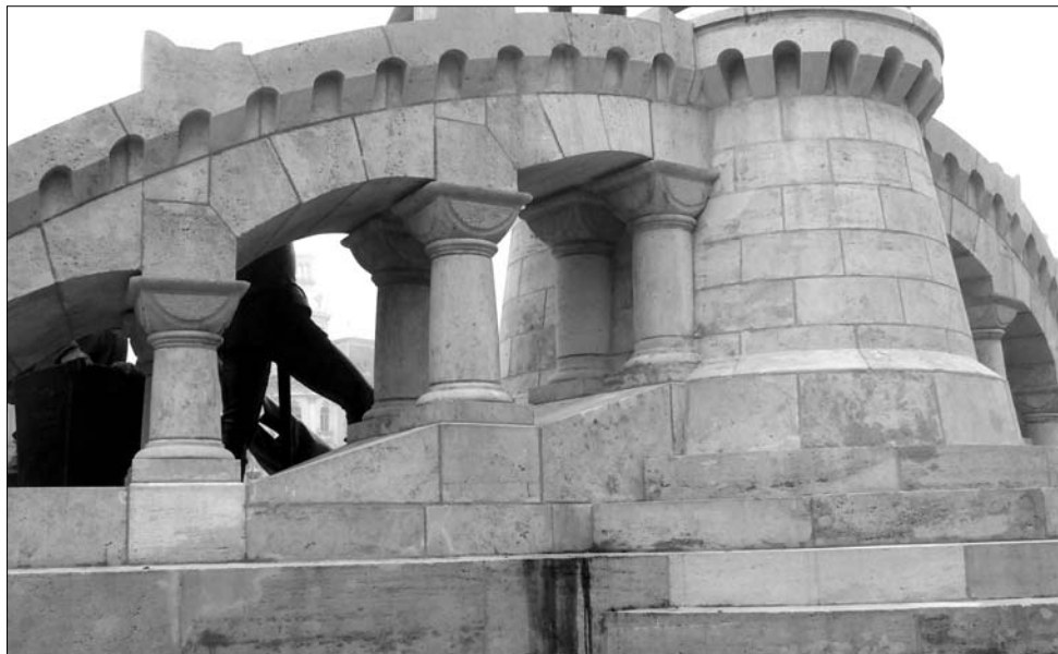
Továbbra is sötét foltok éktelenkednek a frissen felújított szobor talapzatán