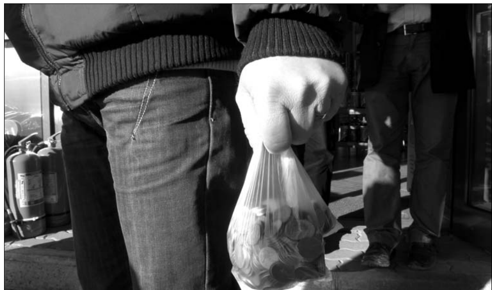
A székelyudvarhelyi autósok egy része aprópénzzel fizetett tegnap a benzinkutaknál

a Székelyudvarhelyi Kisvállalatok Szövetségének elnöke. Az udvarhelyi taxikók pár nappal ezelőtt is demonstráltak, akkor a Taxikók Országos Érdekvédelmi Szövetsége által közzétett felhívásnak megfelelően egy napig nem tankoltak. ◀