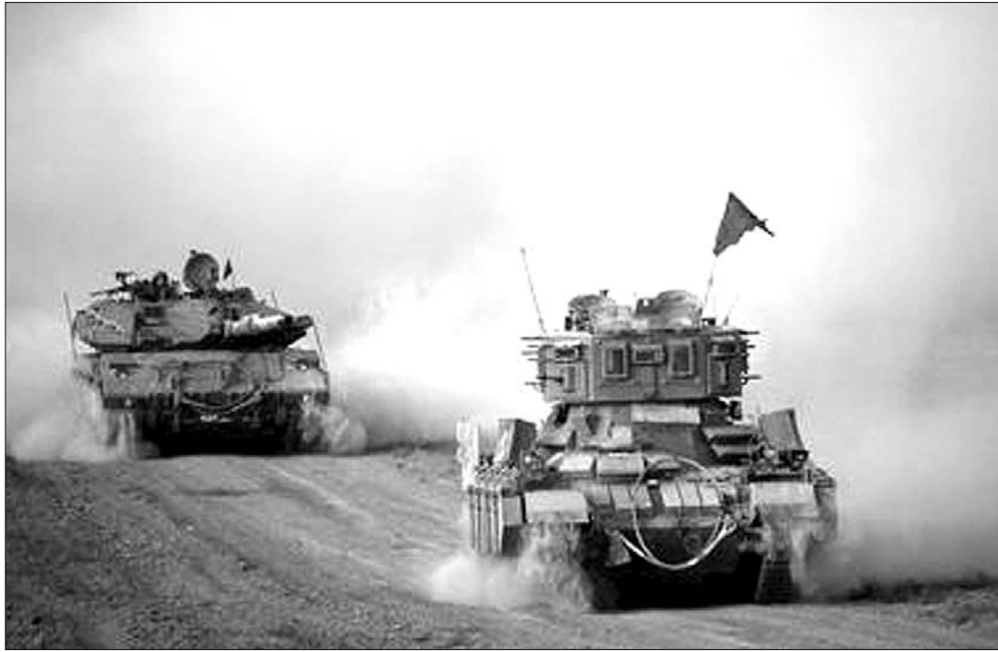
Izraeli tankok a Gázai övezetben. A tegnap hajnali behatolást palesztin rakétatámadások előzték meg

fegyveresek öt aknavető gránátot lőttek ki Izrael területére. A lövedékek nyílt terepre csapódtak be. A Gázai övezetet irányító Hamász múlt héten arra szólította fel a palesztin fegyveres csoportokat, hogy hagyjanak fel az Izrael elleni rakétatámadásokkal, de a kisebb alakulatok visszautasították ezt a felhívást. ◀