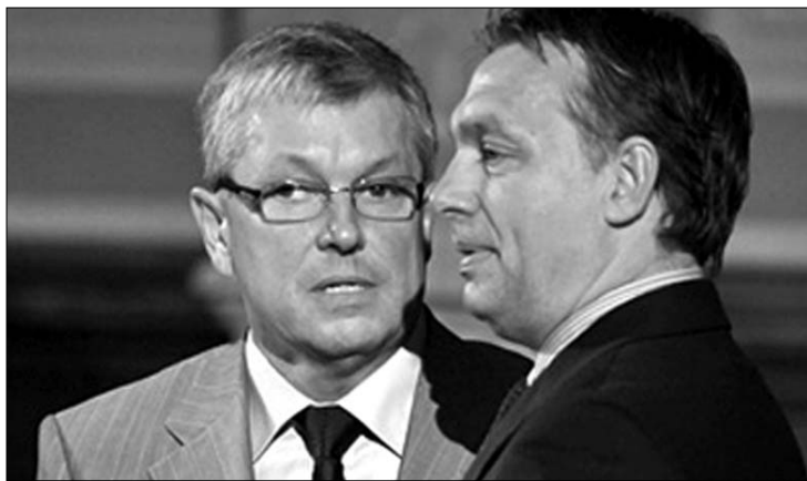
Matolcsy (balra) és Orbán. Sűrű a program Brüsszelben és Strasbourgban

Orbán Viktor miniszterelnök tegnap külön-külön megbeszéléseket kezdett Strasbourgban az Európai Parlament fontosabb frakcióinak vezetőivel, utána találkozott a magyar EP-képviselőkkel, majd pedig részt vett a jobbközép-kereszténydemokrata irányzatú néppárti EU-frakció ülésén. Orbán Viktor keddi tárgyaló partnerei közt volt Martin Schulz szocialista és Guy Verhofstadt liberális EP-frakció vezető, valamint Rebecca Harms és Daniel Cohn-Bendit, a zöldek két társ-frakcióvezetője. ◀