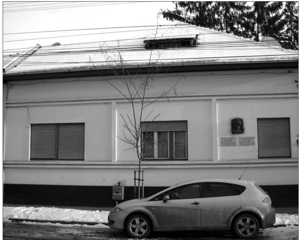
Az író volt lakóházának közelében levő parkban készülnek felállítani a szobrot