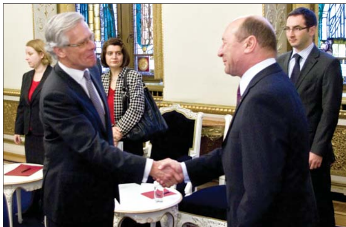
Knut Vollebaek főbiztos és Traian Băsescu államelnök

társági és Együttműködési Szervezet kisebbségügyi főbiztosa, aki Traian Băsescu államfővel és Markó Béla RMDSZ-elnökkel is eszmecsere-t folytatott. 3. oldal