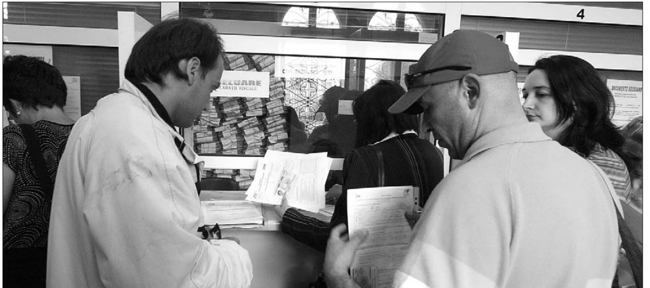
A kereskedőknek nyereségük, a szolgáltatóknak pedig jövedelmük alapján kifizetődőbb adózni, a 3 százalékos forgalmi adó bevezetése után