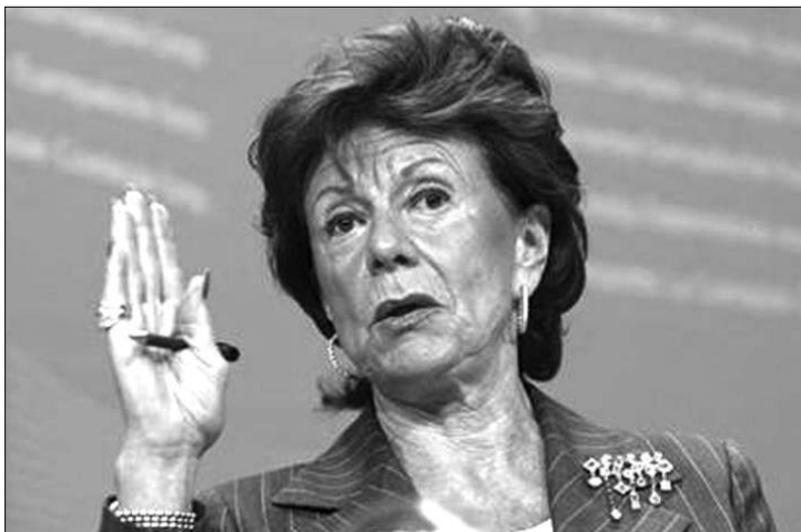
Kroesnak „komoly kételyei” vannak a magyar médiatörvénnyel kapcsolatban

Neelie Kroes három olyan területet jelölt meg levélben, amelyben tisztázást vár a magyar médiatörvényt illetően a kormánytól. Az uniós médiaügyi biztosa kifogásolja, hogy a magyar médiatörvény hatálya kiterjed más EU-tagállamokban letelepedett műsorszolgáltatókra, holott külföldi szolgáltatót csak az eredetországban lehet szabályozni. Nemtetszését fejezi ki az illetően, hogy a törvény kiterjeszti a kiegyensúlyozott tá-