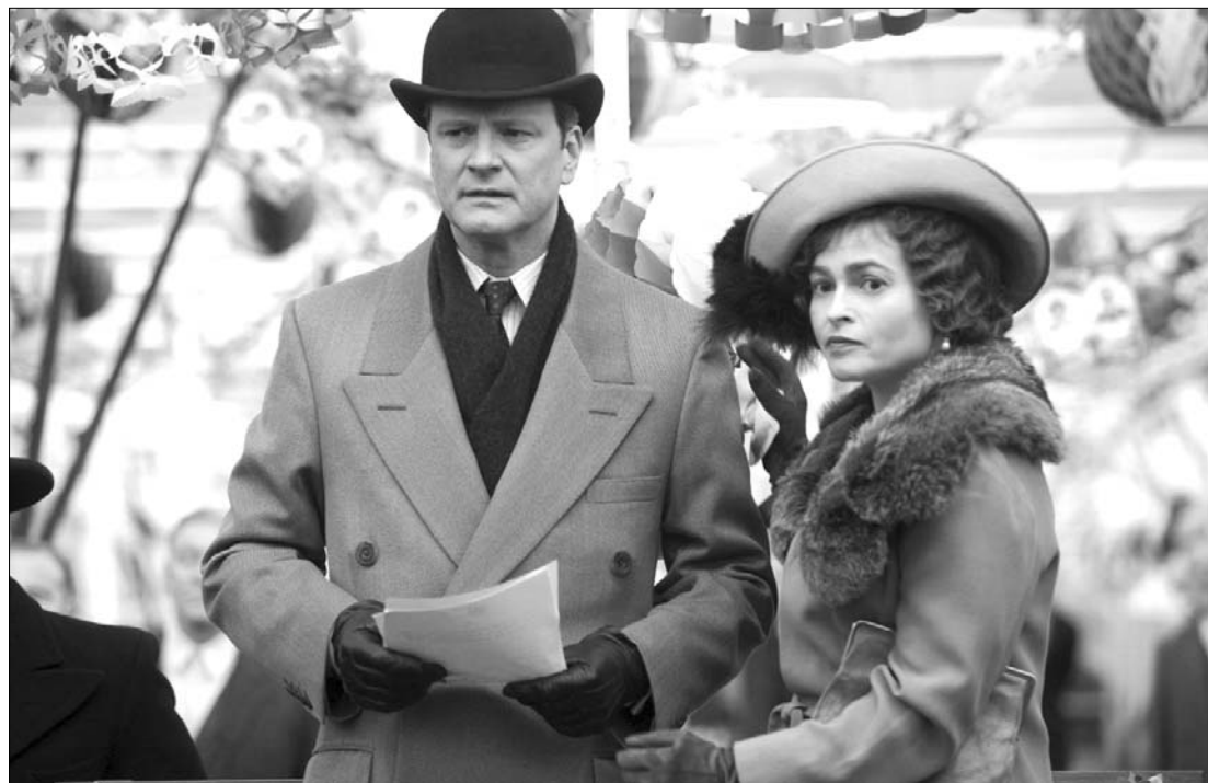
Colin Firth dadogása Oscar-díjat hozhat a Király beszéde című brit filmnek