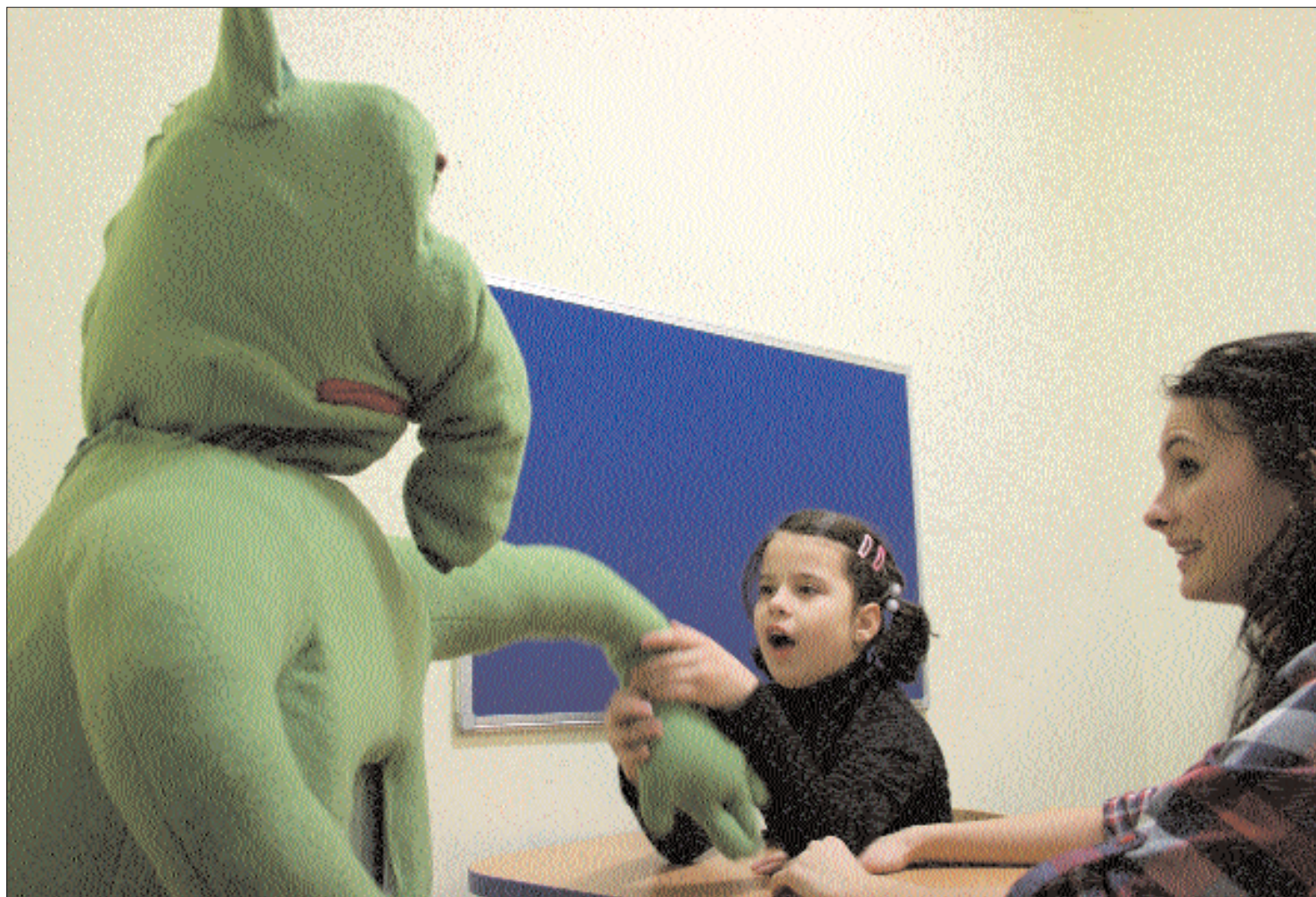
Probo, a „gyógyrobot”. Kolozsváron nemrégiben két hétig tesztelték az autizmus kezelésére alkalmas intelligens gépet

Programot indít az Egészségügyi Minisztérium az autista gyermekek kiszűrésére