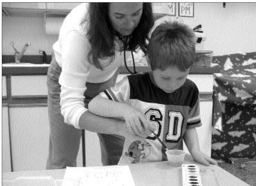
Az autizmusban szenvedő gyermekek az oktatásban is speciális foglalkozásokat igényelnek

Dr. Nagy Levente székelyudvarhelyi házi orvos helyénvalónak tartja azt, hogy