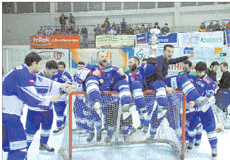
A HSC Csíkszereda simán nyerte a Dab.Docler elleni finálét a román-magyar jégkorongbajnokságban

A Steaua Rangers a nyolcadik helyen zárta az alapszakaszt, 9 győzelemmel és 23 vereséggel, 91-161-es gólaránnyal. A bukarestiek elvesztették az újpestiek elleni osztályozót, és végül a kilencedik, azaz utolsó helyen zárták a bajnokságot. Érdekes, hogy a Steaua Rangers az egyetlen csapat, amelynek sikerült Dunaújvárosban nyernie (3-2, még szeptember 24-én), az Acélbikák együttese végül ezzel a kisiklással bukta el az alapszakasz-győzelmet és vele együtt a döntő-sorozatban a több hazai mérkőzés előnyét. A fővárosiak addig voltak pariban riváisaikkal, amíg meg tudták tartani ukrán idegenlégiósiakat. Miután azonban a pénz elfogyott, és Jevgenyij Jemeljanenko, Gyenyisz Zabudovszkij, Andrej Butocsnov és Jevgenyij Piszarenko távozott, a gárda „szétesett”. ◀