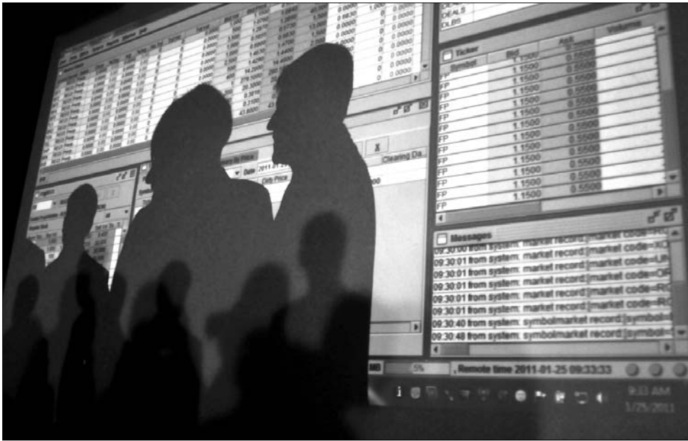
A brókereknek szusszanásnyi idejük sem jutott a Tulajdonalap iránti hatalmas kereslet miatt

Mint ismeretes, az utóbbi évtized legnagyobb politikai és gazdasági projektjének tartott Tulajdonalapot 2005 decemberében azért hozta létre az akkori Tăriceanu-kormány, hogy kárpótolja