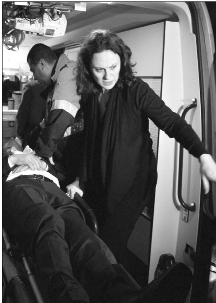
Szibeteg vagy szimuláns? Niclescut mentővel szállították el