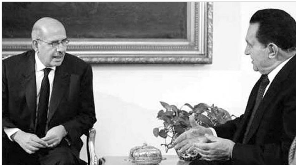
2010. február 19: tavaly még el-Baradei és Hoszni Mubarak (jobbra) „gyanútlanul” csevegett egymással

lett festett hajú) Mubarak példátlan megmozdulással találta szemben magát. Sorsa gyakorlatilag a biztonsági erők kezében van, ugyanis az egyiptomiak jelentős része megelégedett a kormány tehetetlenségével a szegénységgel, a munkanélküliséggel és a szárnyaló inflációval szemben. Az elnök módszerei megdermesztették a politikai rendszert, akadályozva minden változást. Három évtizedes uralmának egyik legfőbb alapítója az al-Kaidához hasonló iszlám radikalizmussal való határozott szembenállás volt. Am nem sikerült megakadályoznia a hagyományos iszlám előretörését: ez utóbbinak egyik szimbóluma a hivatalosan betöltött, de a gyakorlatban megtúrt Muzulmán Testvériség nevű ellenzéki mozgalom, amely a közelmúltbeli választási kudarc ellenére továbbra is befolyásos erőnek számít az országban. Személyét mégis sikerült a nemzetközi közéletben megkerülhetlenné tenni – valójában ez adja megkülső támogatottságát –, hiszen elődjéhez, a Kneszetben felszólaló Szadathoz hasonlóan ő is az Izraellel való