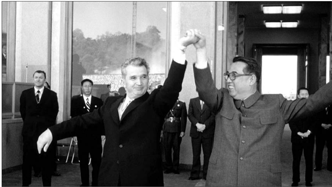
A Best Film Fest legjobbjának számító Ujică-film a román diktátort archív felvételekből idézi meg

► Az előző év romániai moziban vetített legjobb filmjeit és román színészeit díjazták a hétvégén a fővárosi Cinema Studio nevű filmszínházban, a Best Film Fest idei 11. kiadásán. A február 3-ig tartó filmes szemle péntek esti gáláján több száz mozis személyiség és tucatnyi VIP vendég volt jelen. Az est sztárjának Andrei Ujică Nicolae Ceaușescu önéletrajza (Autobiografia lui Nicolae Ceaușescu) című alkotása bizonyult, amely két kategóriában diadalmaskodott – a Legjobb román film díja mellett direktora megkapta a Legjobb rendezőnek járó elismerést is. A közel háromórás alkotás kizárólag archív felvételekből építkezik, amelyek során többek között megcsodálhatjuk a Romániát szívből szerető ázsiai énekesnőt (akit román népzenei játésszó koreai zenészek kísérnek), Ceaușescu fényűző szánózását, a Nixonnal való traccspartiját és az élelmiszerek alatt roskadozó polcú üzletben tett látogatását