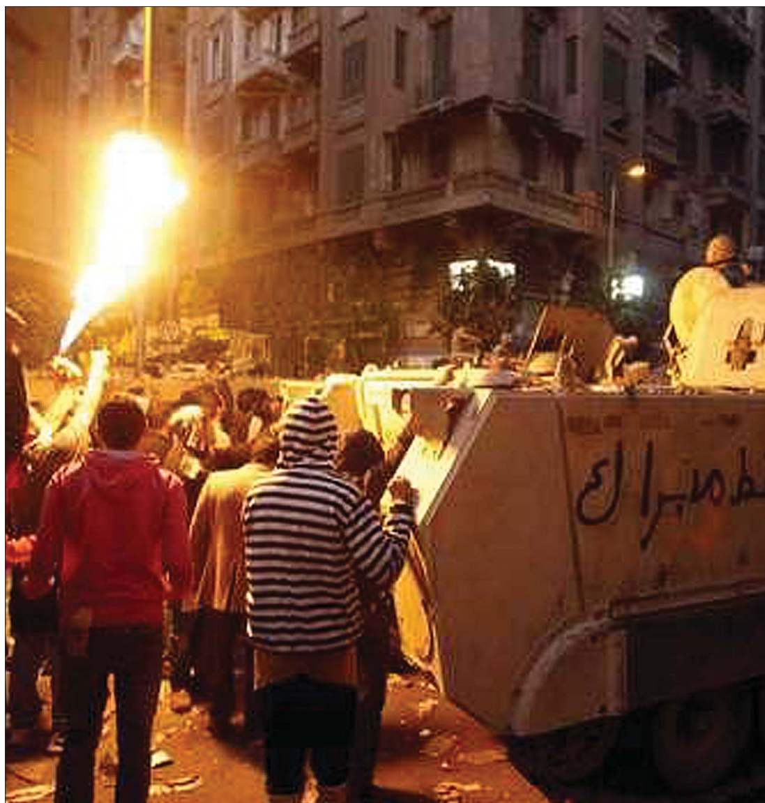
Egyiptom nagyvárosaiban, Kairóban, Szuezen és Alexandriában tömegek követelik Mubarak elnök távozását

▶ Folytatódta a tüntetések egész hétvégén Egyiptom nagyvárosaiban: Kairóban, Szuezen és Alexandriában tömegek követelik Mubarak elnök távozását. A rendfenntartó erők többször is a tömegbe lövettek. A tiltakozások halálos áldozatainak a száma már meghaladja a százat, a