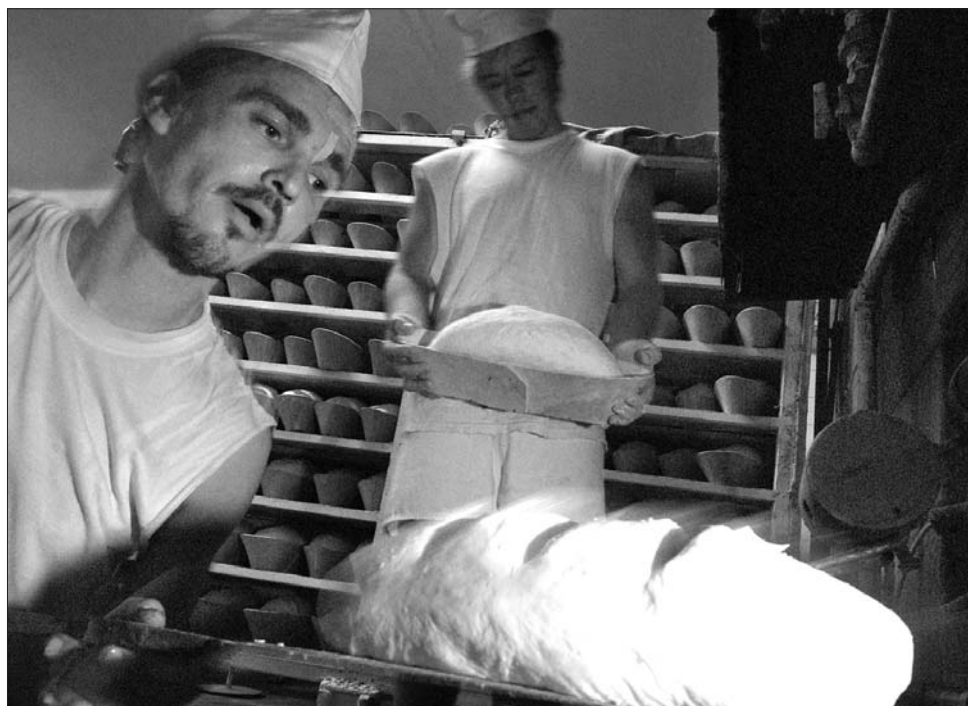
A kenyéripari cégek a nyersanyagárak emelkedése miatt három hónapja veszteségesen dolgoznak.

„Az Agrostar értesüléseivel ellentétben a román agrártárca nincs befolyása a new york-i gabonatorzsde árfolyamaira, sem az ausztráli-