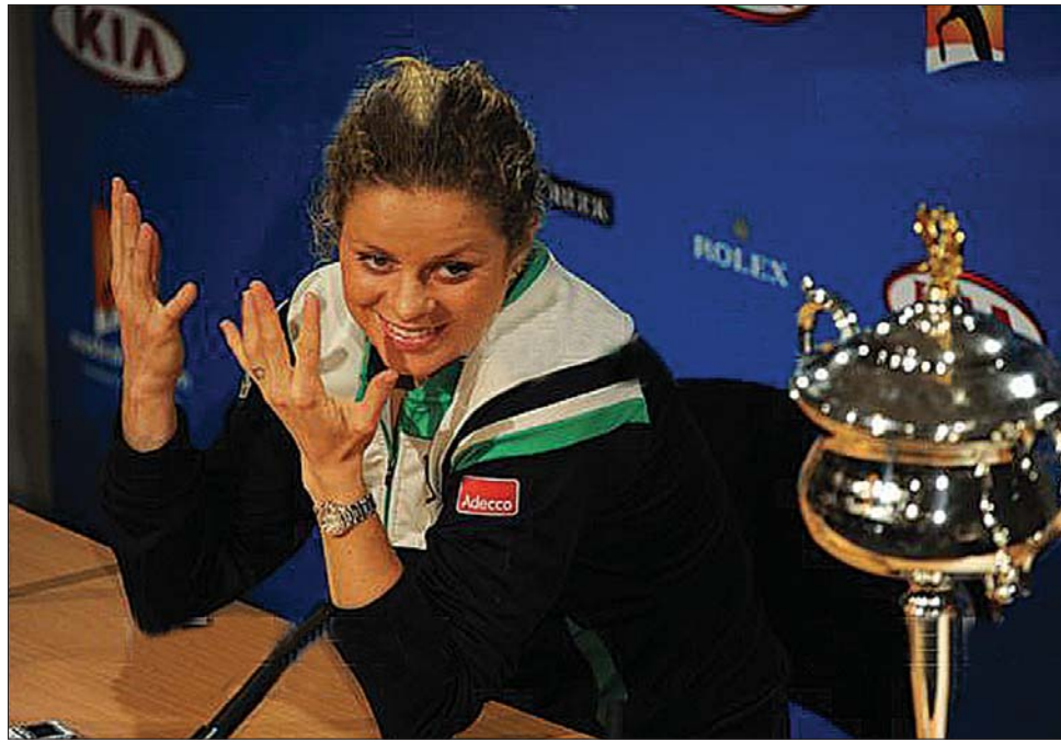
Kim Clijsters már a negyedik Grand Slam-sikerét pipálta ki a Melbourne Parkban

Na Li már tavaly is eljutott az elődöntőig az