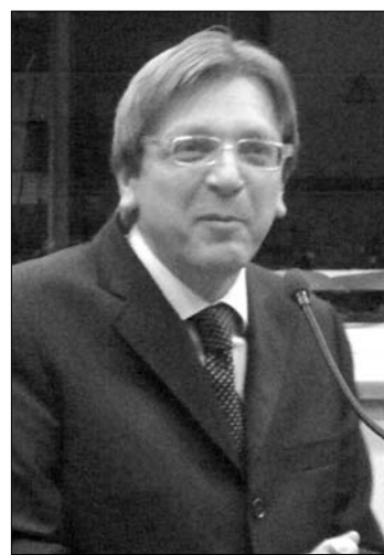
Guy Verhofstadt liberális EP-képviselő

Ugyanakkor azt is hangsúlyozta, hogy bizottság médiatörvénnyel kapcsolatos levele nem technikai jellegű „Én azt a levelet egyáltalán nem találok technikainak! Persze így is be lehet állítani” – fogalmazott. Verhofstadt hangsúlyozta: regisztrációra kötelezni a blogokat vagy újságokat képtelenség, mi több, a sajtószabadság ellen hat. Budapesti sajtótájékoztatóján a volt belga miniszterelnök hangsúlyozta: megítélése szerint