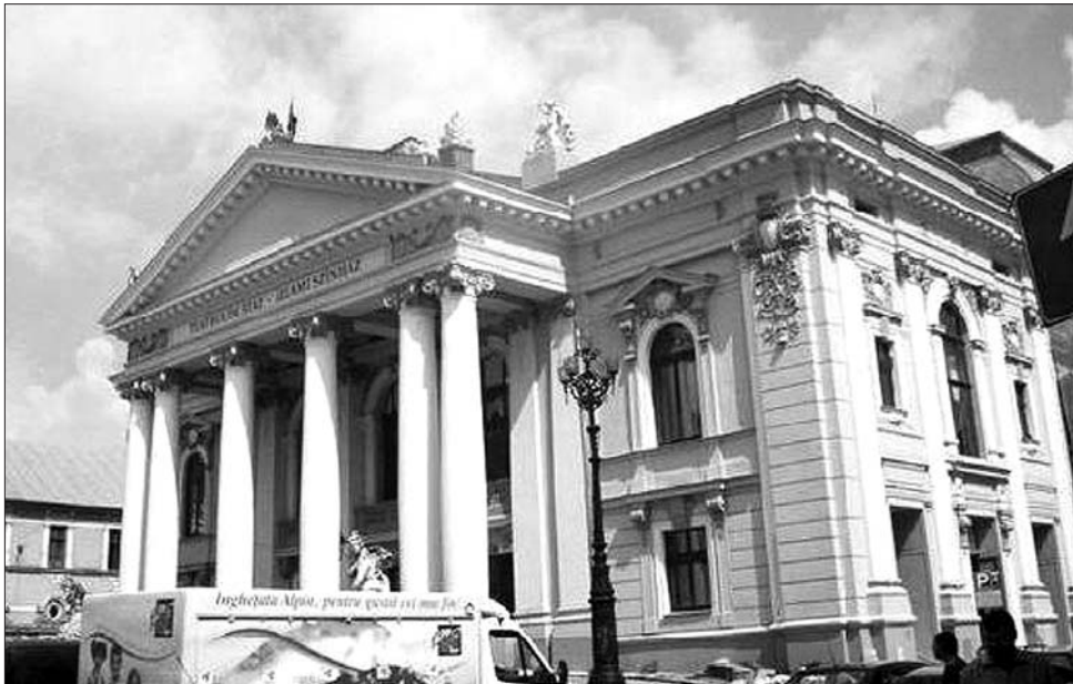
Egy fedél alatt. A két nagyváradai társulat közös épületben, de külön intézményekként működne