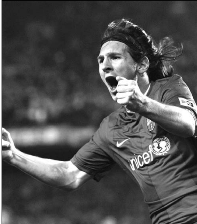
A Barcelona Messi két góljával 3-0-ra győzött a Hércules otthonában

Angliában az FA Kupa negyedik fordulójának mérkőzéseit rendezték meg. A címvédő Chelsea 1-1-es döntetlent játszott szombaton az Everton otthonában, így a továbbjutásról egy újabb mérkőzés dönt majd. További eredmények: Swansea City (II. osztályú)–Leyton Orient (III.) 1-2, Aston Villa–Blackburn Rovers 3-1, Birmingham City–Coventry City