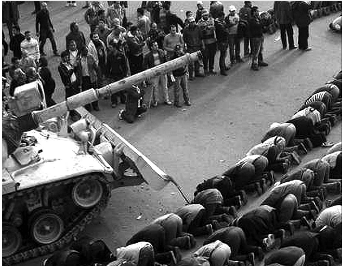
Az ima erejével. A kairói tüntetők megpróbálják maguk mellé állítani a kirendelt tankok személyzetét

A repülőtéri hatóságok igyekeznek fenntartani a légikikötők normális működését. A külföldi turisták tömegesen kezdték meg hazatérésüket, több ország pedig – köztük Izrael és az Egyesült Államok – szervezeten evakuálja állampolgárait. Szemtanúk és saj-