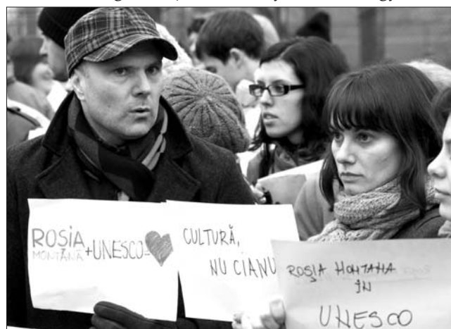
Több civil szervezet tüntetett nemrég a szaktárcánál

Több szakmai szervezet után a Történelmi Műemlékek Országos Bizottsága is azt javasolja, hogy Verespatak kerüljön fel az UNESCO Világörökség-listájára. Ezt legutóbbi ülésén szavazta meg a testület. A döntést követően a bizottság tagjai levélben kérték fel Kelemen Hunor művelődési minisztert, hogy a Fehér megyei település szerepeljen majd a világszervezetnek javasolt ügynevezett várományosi listán. Mint ismert, ezt kérte korábban a Műemlékek és Helyszínek Nemzetközi Bizottságának (ICOMOS) romániai szervezete is. Sergiu Nistor, az ICOMOS Románia elnöke az ÚMSZ -nek elmondta: a döntés a miniszter kezében van. „Legalábbis én így értelmezem a törvényt” – magyarázta. Emlékeztetett: a szervezet már 2009 júliusában megszavazta, hogy Verespatak kerüljön fel a várományosi listára. Amint arról beszámoltunk, több civil szervezet egy hete tüntetést is szervezett a minisztérium épülete előtt e cél érdekében. Kelemen Hunor – akit lapunk tegnap nem tudott elérni – korábban megígérte, valamennyi érintett fél véleményét kikéri az ügyben. ◀