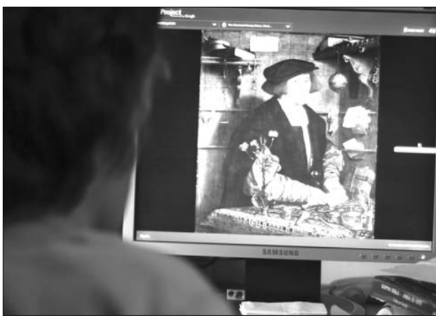
Híres múzeumokba léphet be a Google felhasználója

A www.googlearthproject.com címen található online műkincstár arra is alkalmas, hogy az érdeklődők létrehassák saját virtuális gyűjteményüket – derült ki a művészeti program keddi ünnepélyes megnyitóján, a londoni Tate Galériában. „Ez valóban nagy lépés arra, hogy az emberek közel kerülhessenek a világ minden tájának csodálatos műkincseihez. Szó sincs arról, hogy a lehetőség eltávolítaná az embereket a múzeumoktól. Bízunk benne, hogy éppen az ellenkezője történik” – jelentette ki Nelson Mattos, a világ 17 ga-