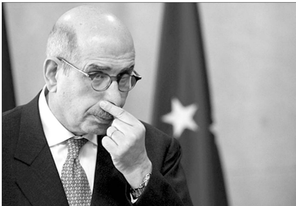
Mohamed el-Baradei. Ellenzéki vezér, vagy félretelhető sakkfigura?

Csak hogy Egyiptom esetében a „váltás” ellentétben állna azzal, amit Amerika és legfontosabb közel-keleti szövetségese, Izrael regionális érdekei diktálnak. Washington szeretné elkerülni, hogy a legnagyobb haderővel rendelkező arab országban látványosan megbukjon az a hatalom, amely 1978-ban Camp Davidben megegyezett a békéről a zsidó ál-