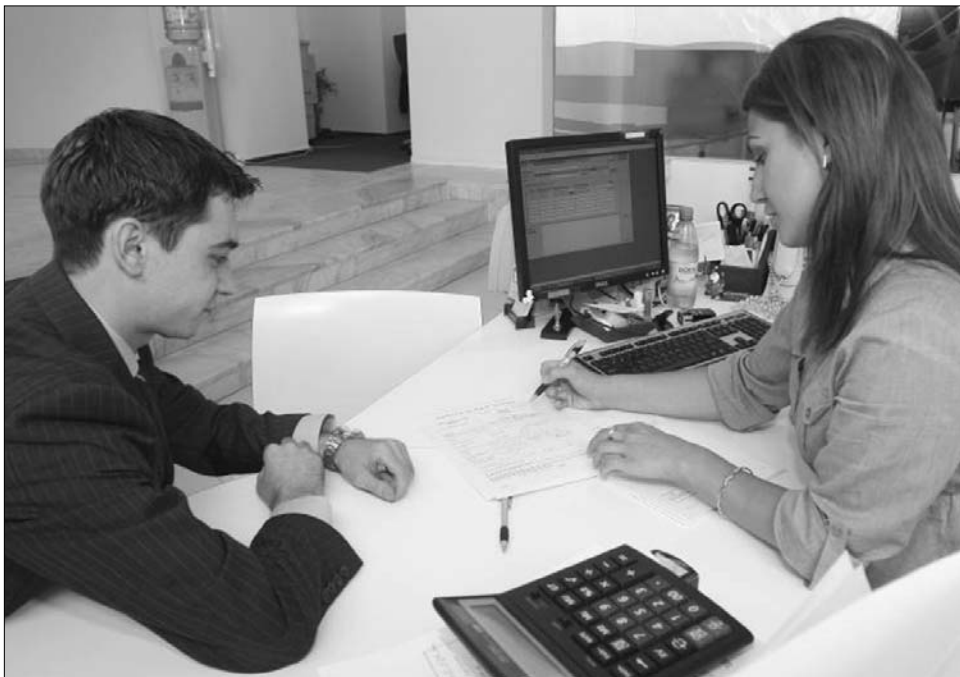
Egy kedvezőbb törlesztési konstrukció reménye is sokakat készített hátralék-felhalmozásra

A romló törlesztési mutatókat a szakemberek elsősorban a növekvő munkanélküliséggel, a közzsféra-beli elbocsátásokkal és a bérek lefaragásával magyarázzák, emellett azonban újabban kiemelik: a sokat vitatott tavalyi 50-es sürgősségi kormányrendelet is hozzájárult a hátralékok halmozódásához. 2010 második felétől ugyanis sok banki ügyfél halasztotta a határidős fizetést egy számára kedvezőbb törlesztési konstrukcióban bízva. Ezen a véleményen van a Capital -nak nyilatkozó Florin Pogonaru, a Romániai Üzletemberek Szövetségének elnöke is, aki hangsúlyozta: a kormányrendelet