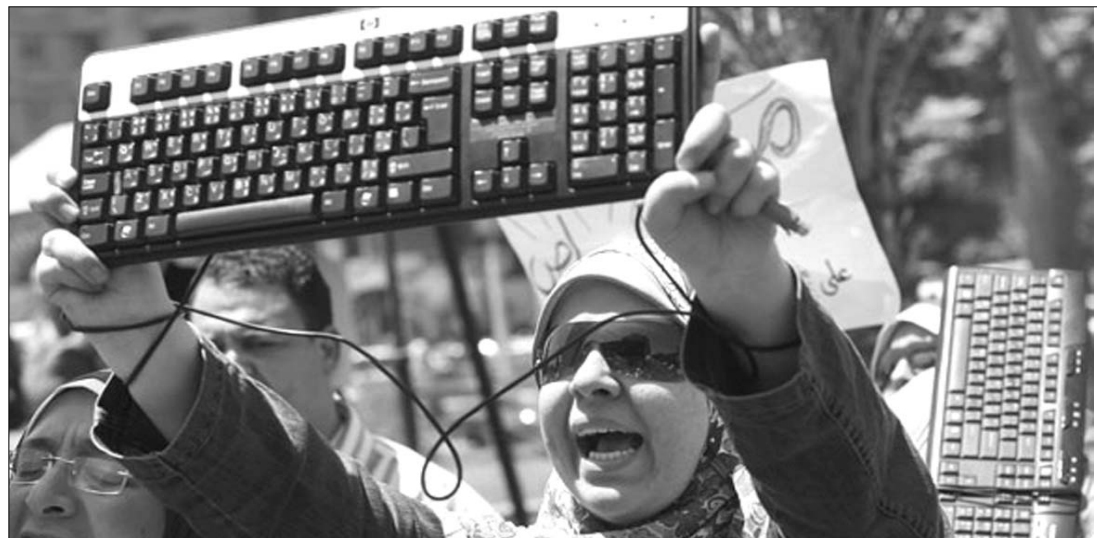
Hoszni Mubarak internetblokkádja feltűzelte a békés tüntetőket Egyiptomban

videó, kép és tudósítás. Az egyiptomi kormány ugyanakkor bezárta az al-Dzsazíra hírtelevízió kairói irodáját és blokkolta a Nilesat adót is, ahonnan adásait