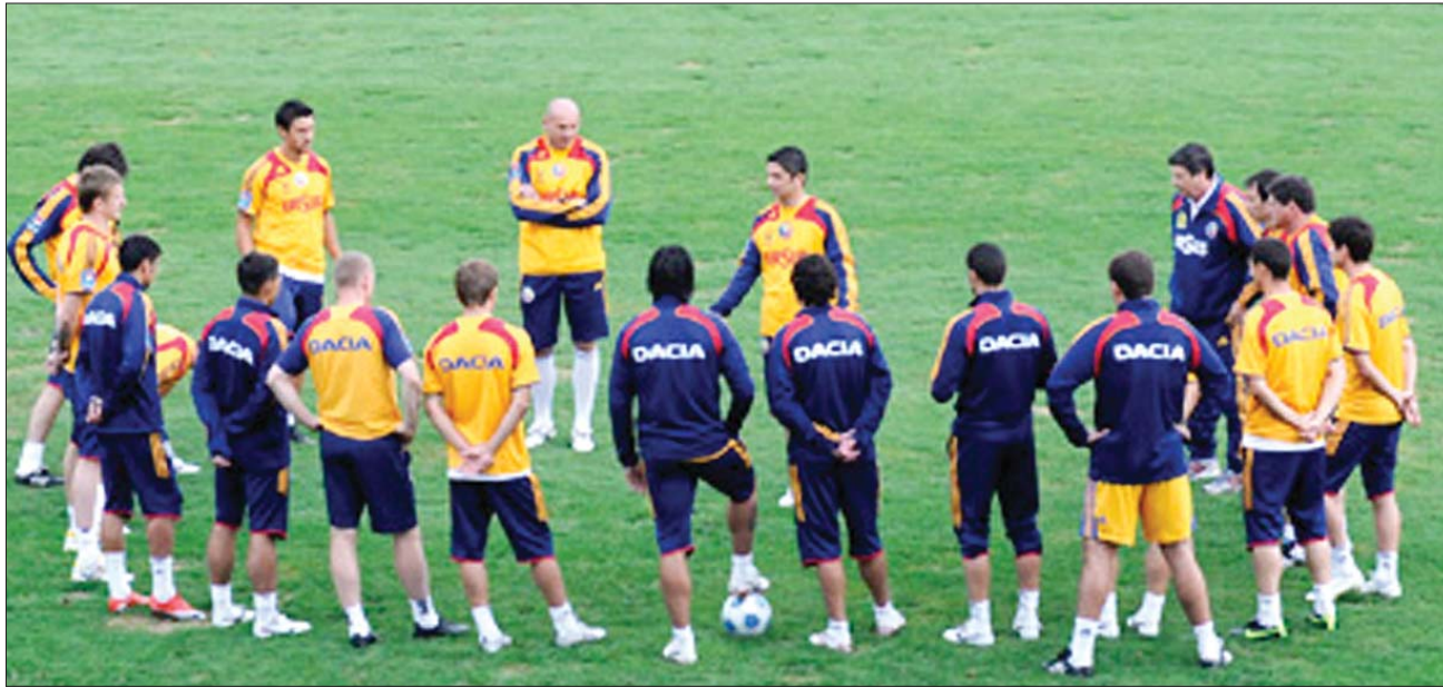
A román szövetségi kapitány 11 idegenlégióst hívott be, és kilenc klub 18 játékosát a hazai pontvádasztatból