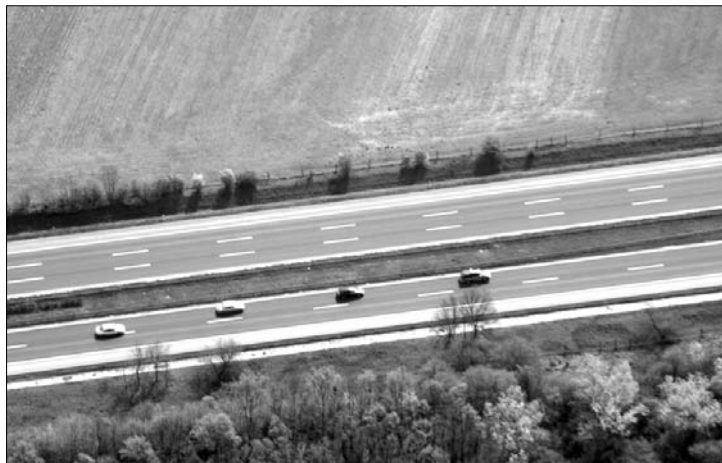
A tervek szerint a sztráda 2013 májusára éri el a nagylaki határátkelőt

mint bruttó 3,4 milliárd forint fordítanak, a költségek 15 százaléka hazai forrásból áll rendelkezésre, 85 százaléka pedig uniós pénz: az Európai Regionális Fejlesztési Alap adja. ◀