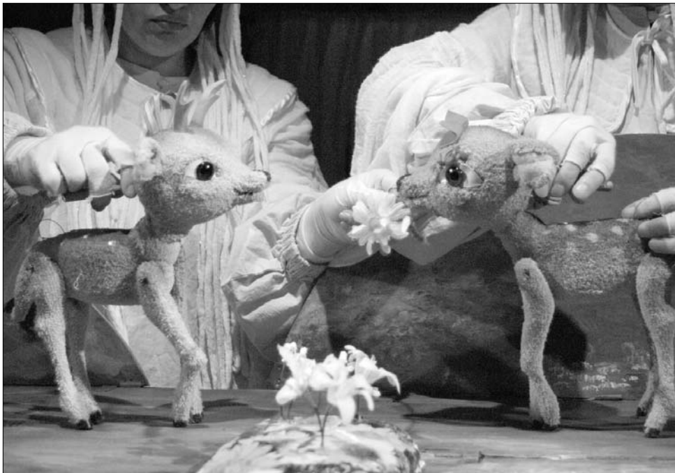
A Téli mese című előadás bemutatójára készül a Puck Bábszínház Kolozsváron