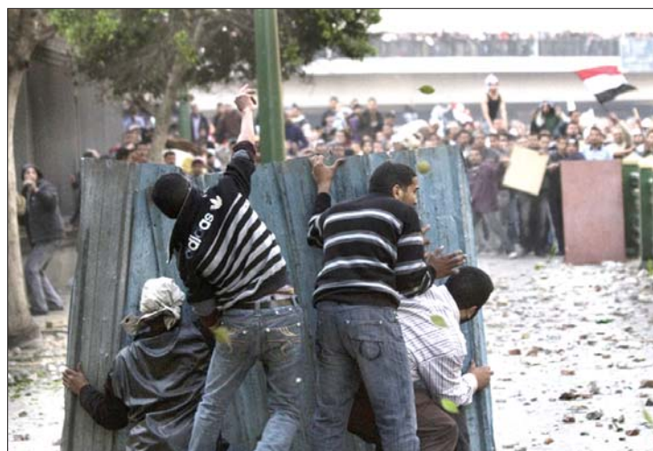
Hoszni Mubarak hívei összecsaptak az elnökellenes tüntetőkkel

Kairó lángba borult, miután Hoszni Mubarak bejelentette, szeptemberig maradni kíván. Az elnök hívei és a tiltakozók összecsaptak, sérültek százairól és h-