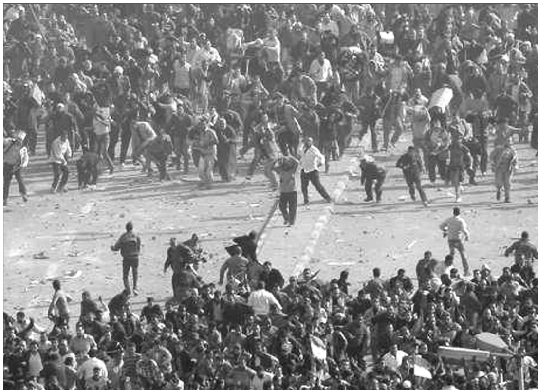
A két tábor itt még csak farkasszemét néz egymással. Estére már Molotov-koktélokot dobáltak egymásra Kairóban