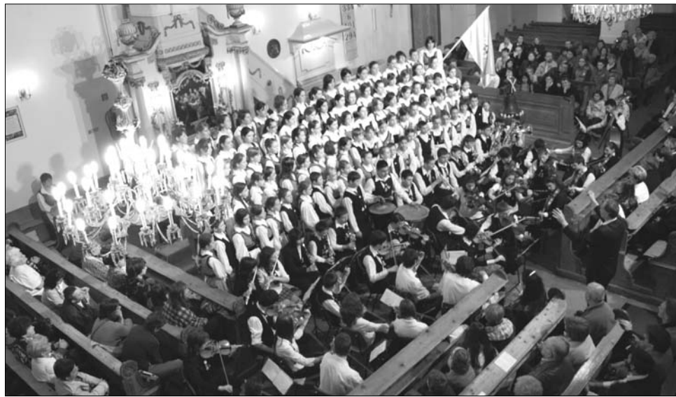
Székelyszék kulturális nagykövete a szentegyházi Gyermekfilharmónia