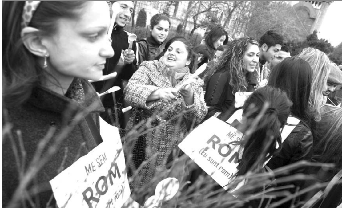
A roma jogvédő szervezetek korábban tüntetéseken tiltakoztak a „cigány” megnevezés ellen