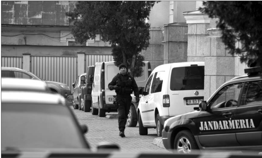
Tegnap ottjártunkkor a DNA bukaresti székházához egymás után érkeztek a vámosokat szállító buszok.

Mint ismeretes, február folyamán a hatóságok mintegy száz határrendőrt és vámost vettek őrizetbe, majd helyeztek előzetes letartóztatásba korrupció gyanúja miatt. A román–szerb határon lévő temesvári és a néraná-