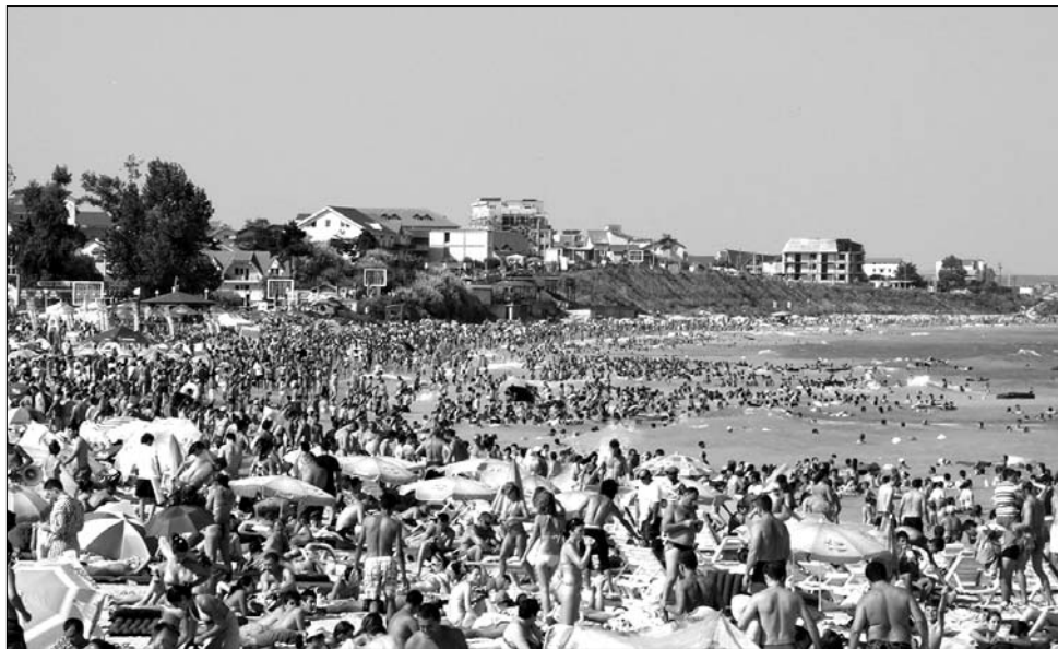
Ahol az ár és a vendég az úr. Kereslet lenne, ha a román illetékesek jobban figyelnének a valós igényekre

Ehhez képest a szállásadókat tömörítő Litoral-Duna-delta szervezet úgy véli, a román tengerpart végleg eltűnhet a világ turisztikai térképéről, ha a román hatóságok a következő öt-tíz évben is elhanyagolják fejlesztését. Az érdekvédelem szerint a politikai csatározások is hozzájárulhatnak a régió hanyatlásához, mivel a kormányzatok nem tördnek sem az ott dolgozók szezonon kívüli támogatásával, sem pedig a potenciális befektetők szöztönzésével. Javaslatuk szerint kormányzati prioritássá kellene emelni a furdőhelyek támogatását – részben azzal, hogy a befizetett adókat a régió fejlesztésére fordítanák vissza. A tengerparti turizmus üzemeltetői úgy látják, a túlzott központosítás ellehetetleníti a helyiek közös munkáját. ◀