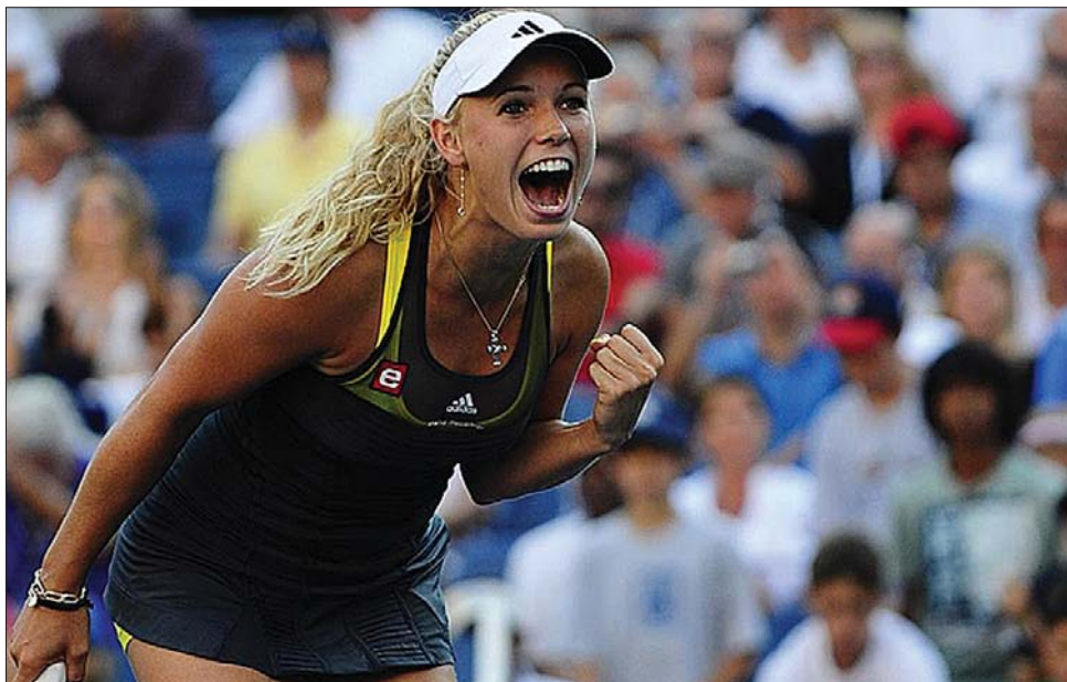
Tegnaptól ismét a dán Caroline Wozniacki (9430 WTA-pont) vezet a női teniszezők világranglistáját

Nincs változás a férfi teniszezők legfrissebb világranglistájának élén, továbbra is magabiztosan vezet a spanyol Rafael Nadal (12.390) a sváj-