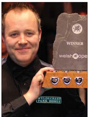
John Higgins a trófeával

A sheffieldi világbajnokság (április 16. – május 2.) még a China Open és a vb kvalifikációs tornáit rendezik meg, március 28. és április 3. között pedig a tulajdonképpen kínai nyílt bajnokságot. ◀