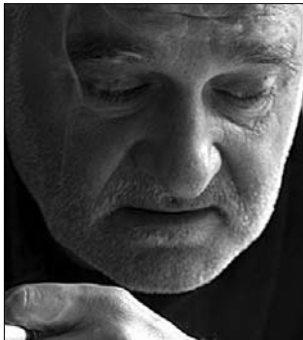
Tarr Béla filmrendező

Az interjúra Szöcs Géza kulturális államtitkár a Hír Tv -ben reagált. „Nagyon