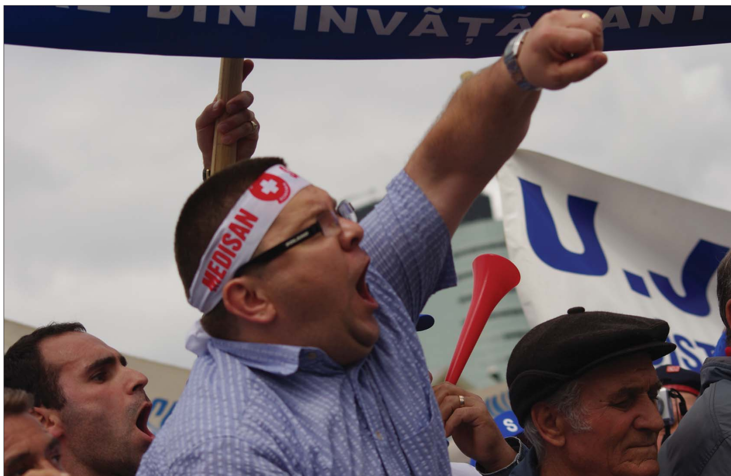
„Ha kell, kövekkel és botokkal vonulunk utcára” – figyelmeztettek a szakszervezetek, miután nem sikerült kiegyezniük a kormánnyal

Erőszakkal fenyegetőznek a munkavállalók a munkatörvénykönyv módosítása miatt