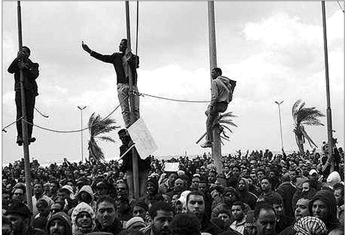
Bengázi gyakorlatilag a tüntetők kezére került. Már Tripolit is elhagyták a biztonsági erők

Jogvédők szerint már legalább 233 halálos áldozatot szedtek a Kadhafi elleni tüntetések Líbiában. Ezért azt követelik az ENSZ-től, hogy avatkozzon be a líbiai polgári lakosság védelmében. A 24 emberi jogi csoportból álló nemzetközi koalíció tegnap ilyen értelmű levelet küldött mások között Ban Ki Mun ENSZ-főtitkárnak, az amerikai kormánynak és az Európai Uniónak. Az aláírók szerint fel kell függeszteni Líbia tagságát az ENSZ Emberi Jogi Tanácsában.