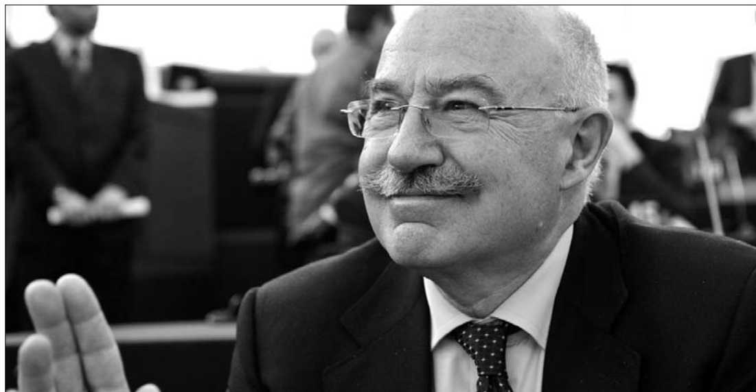
Martonyi János az unió nevében visszautasította Líbia kijelentéseit. Az EU állásfoglalásban ítélte el az erőszakot

vet tudomására, hogy felfüggesztik az EU-ba irányuló illegális bevándorlás megfékezését célzó együttműködést, ha az unió tovább kommentálja a líbiai belső eseményeket. A Tanácsban az uniós soros elnökségét adó Magyarországot képviselő Martonyi János külügyminiszter vasárnap este határozottan visszautasította, hogy Líbia ezt a két dolgot összekapcsolja. A mediterrán térség legújabb fejleményei miatt az Európai Unió déli szomszédságpolitikájának a megvitatását is felveték a március 24-én és 25-én megtartandó csúcstalálkozó napirendjére – jelentette be Martonyi János. A miniszterek emellett a vallási türelmetlenség és diszkrimináció megnyilvánulásai miatt közös állásfoglalásban fejezték ki aggodalmukat. Utaltak arra, hogy a közelmúltban több országban követtek el erőszakos, illetve terrorista cselekményeket keresztények és isztiszizleti helyeik, továbbá muzulmán zarándokok és más vallási közösségek tagjai ellen. Hangsúlyozták, hogy a vallásszabadság egyetemes emberi jog, amit mindenhol és mindenki tekintetében meg kell védeni. ◀