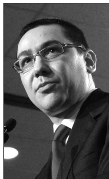
Victor Ponta PSD-elnök.