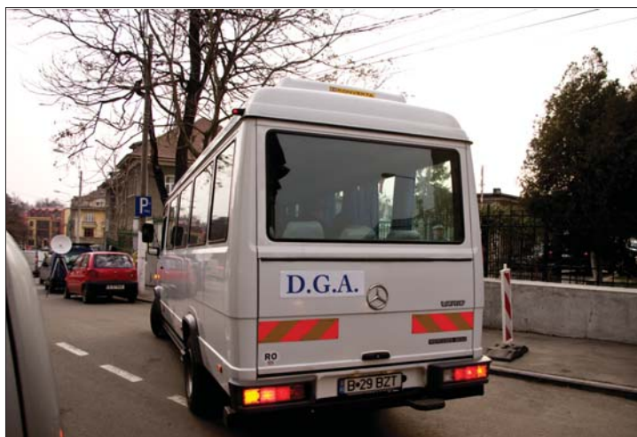
Az őrizetbe vett vámósokat ismét Bukarestbe szállították

A kormány ezektől az akcióktól azt reméli, hogy jobb belátásra bírja az ország schengeni csatlakozását ellenző EU-tagállamokat. 3. oldal ▶