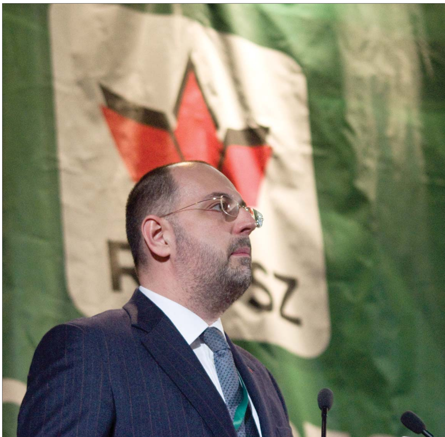
Kelemen Hunor művelődési miniszter az érvényes 536 szavazatból 371 szavazatot kapott. Az új elnök már máttól munkához lát

Kétharmados többséggel választották a minisztert az RMDSZ elnökévé Nagyváradon