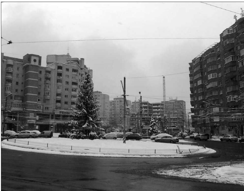
Kolozsváron a Monostori út a zajszennyezés „válságvöze”, a város 64 százaléka szenved a zajtól