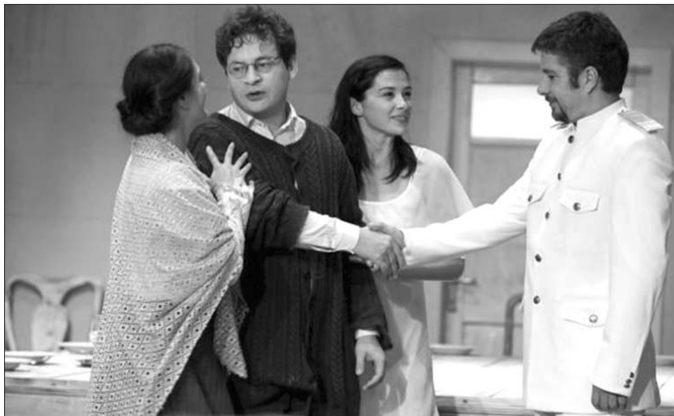
A kolozsvári közönség ezúttal a szatmáriak Három nővér című előadását nézheti meg

„magyarított”, vagyis egy „közvetítő” nyelv segítségével átírta, átköltötte a verseket. „Felidézte” Al. Nyezvanovot is, aki egy olyan, általa kitalált orosz költő volt, akinek a bőrébe bújva írta verseit. „Komoly egyetemi tanárok fordultak hozzám kétségbeesetten, hogy ki ez az Al. Nyezvanov, mert egyetlen lexikon, vagy irodalomtörténet sem ismeri” – anekdotázott Király, aki bevallotta, nem tudja, hogy az orosz költők és műfordítók felfedezték-e Nyezvanovot, esetleg megpróbálták-e visszafordítani magyarból oroszba. ◀