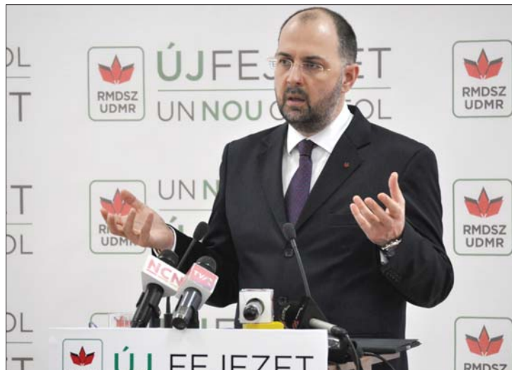
Kelemen Hunor a Majális utcába költözteti az Elnöki Hivatalt

▶ Kolozsvárra költözik az RMDSZ szövetségi elnöki hivatala, s a kincses városban működik majd a szervezet főtitkársága is. Kelemen Hunor elnök a hét végén éppen Kolozsváron számolt be a sajtónak az RMDSZ ideai tennivalóiról. 3. oldal ▶