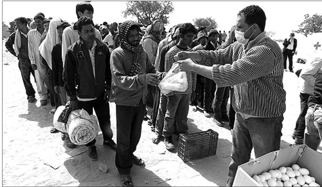
A nemzetközi közösség élelmiszert oszt a menekülőknek. Az Európai Bizottság vizsgálódn fog Líbiában