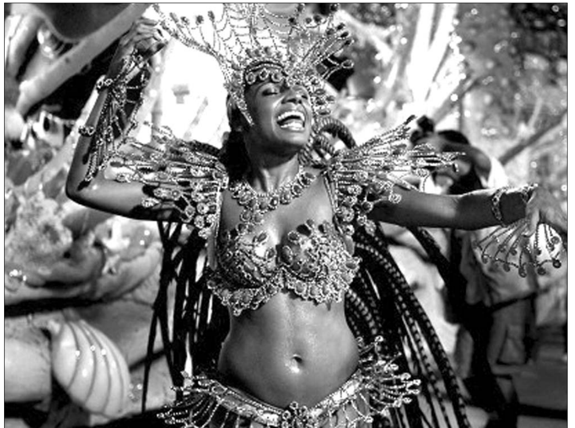
Péntektől holnapig tart a világ legnagyobb karneválja. Egész Rio összefogott az elégett kosztümök pótlására

Helyi idő szerint péntek délután a Rio de Janeiro-i polgármester átadta a város kulcsait a mitikus Momo királynak, ezzel hivatalosan is kezdődött a világ legnagyobb karneválja, amelynek során öt napon át nem hallgat el a zene, nem lankad a tánc. Noha a leglátványosabb, legnépesebb és legcsillogóbb fiesta az ország legnagyobb városában zajlik, ettől a naptól kezdve egészen húshagyókedd éjfélig minden brazíliai város is megrendezi a maga karneválját, amelyen álarcosok, dobosok vonulnak fel, és a közhiedelemmel ellentétben nemcsak a világhíressé vált szambának, hanem más tradicionális táncoknak, a maracatúnak, a xangónak és a marchinhának is komoly szerep jut. Rióban a karneváli hangulatot idén kissé beárnyékolják a pusztító erdőtüzek, amelyek a szamba fővárosának egy részére is áterjedtek, megsemmisítvén éppen a karneválra készülő színpompás kocsikat és kosztümöket három nagy szambaikolában is. Az egy hónapja történt katasztrófát követően