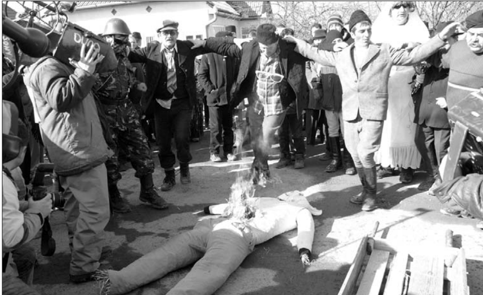
Lángokban a farsangi bábu. Gyergyóremetén násztáncot jártak a tél temetésén

Kelemen Hunor művelődési miniszter elmondta, legutóbb tíz évvel ezelőtt vett részt hasonló ünnepségen, és fontosnak tartja az ilyen szo-