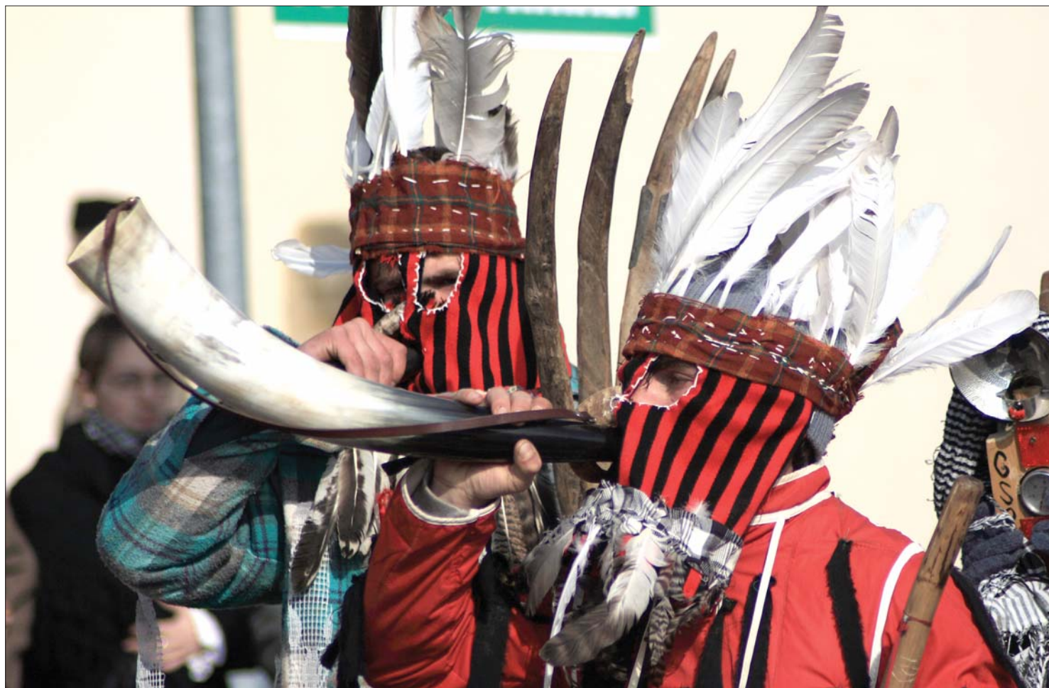
„Maskurások.” Közel ezer, jelmezbe öltözött vendégfogadó és vendégségbe érkező farsangozó vett részt a gyergyóremetei multságokon

A brazil karneválon, az erdélyi szórványban és Székelyföldön is mulatoznak a böjt előtt