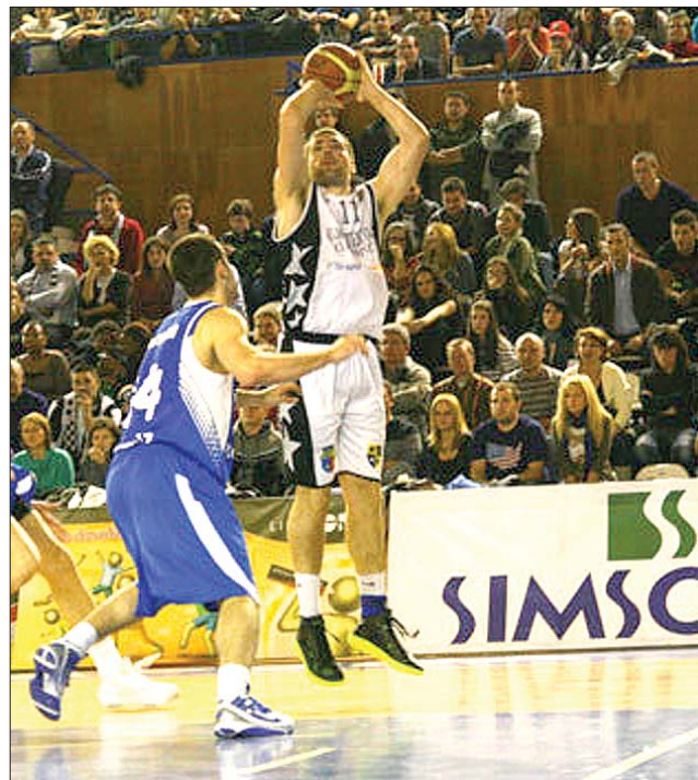
A forduló rangadóján a kolozsváriak legyőzték Medgyest (kék mez)

A második értékcsoportban (A2), a 7. fordulóban: Kolozsvári U–Nagyvárad CSM 71-68, Sportul Studentesc–Brassói Galactica Olimpia 62-55, Gyulafehérvári LPS–Politehnica Național Iași 74-52. ◀