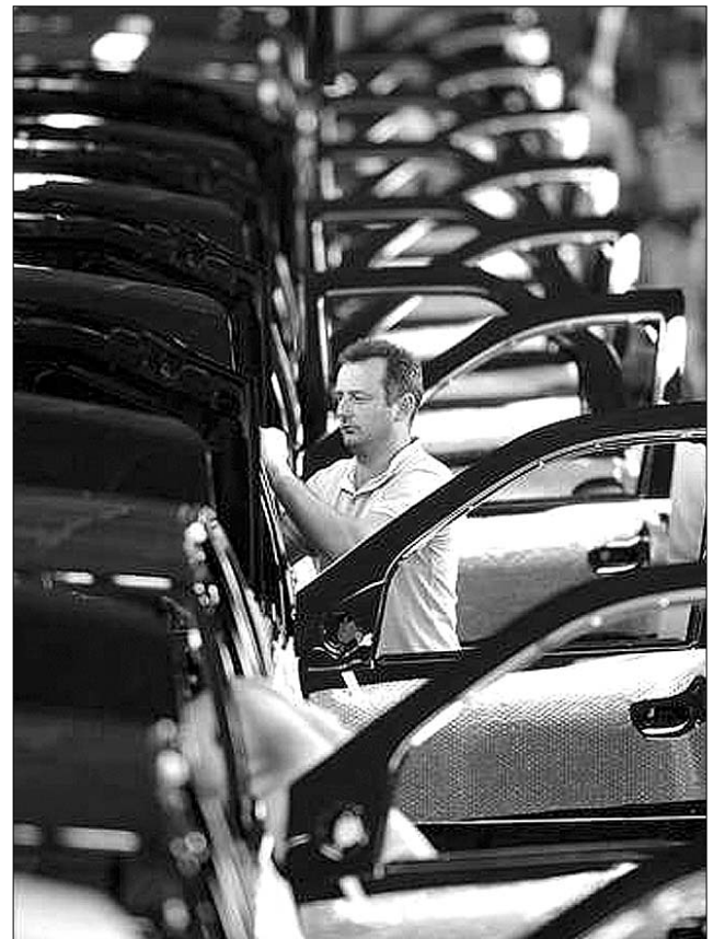
Béremelés és bónuszok a román „exportbajnoknak”