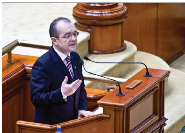
Emil Boc „védőbeszédét” az ellenzék nem hallgatta végig

▶ Felelősséget vállalt tegnap a parlament előtt Emil Boc a munkatörvénykönyvről. A Szociál-Liberális Szövetség (USL) már is benyújtotta bizalmatlansági indítványát a kormány ellen. A törvény és a Boc-kabinet sorsa egy hét múlva dől el. 3. és 6. oldal ▶