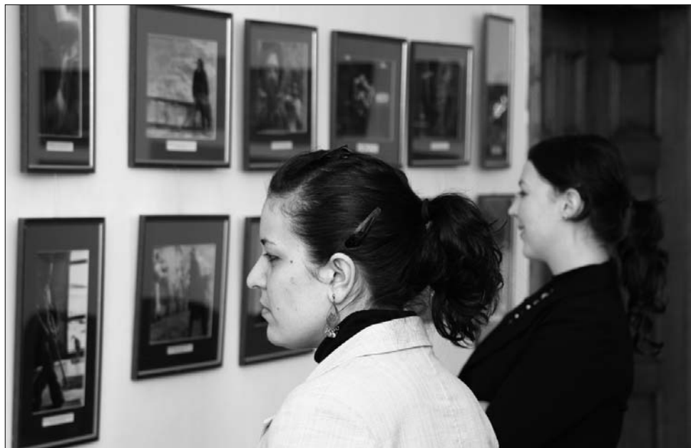
Hét ország fotósainak képeit tekinthetik meg a székelyudvarhelyi művelődési házban