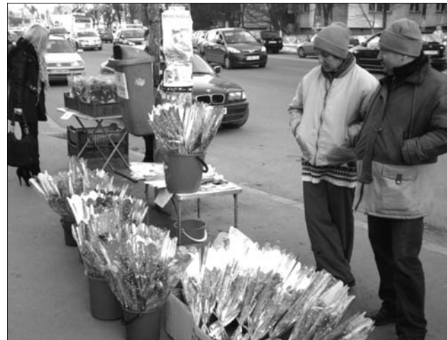
A virágárusok 2-3 lejjel emelték nőnapra az áraikat