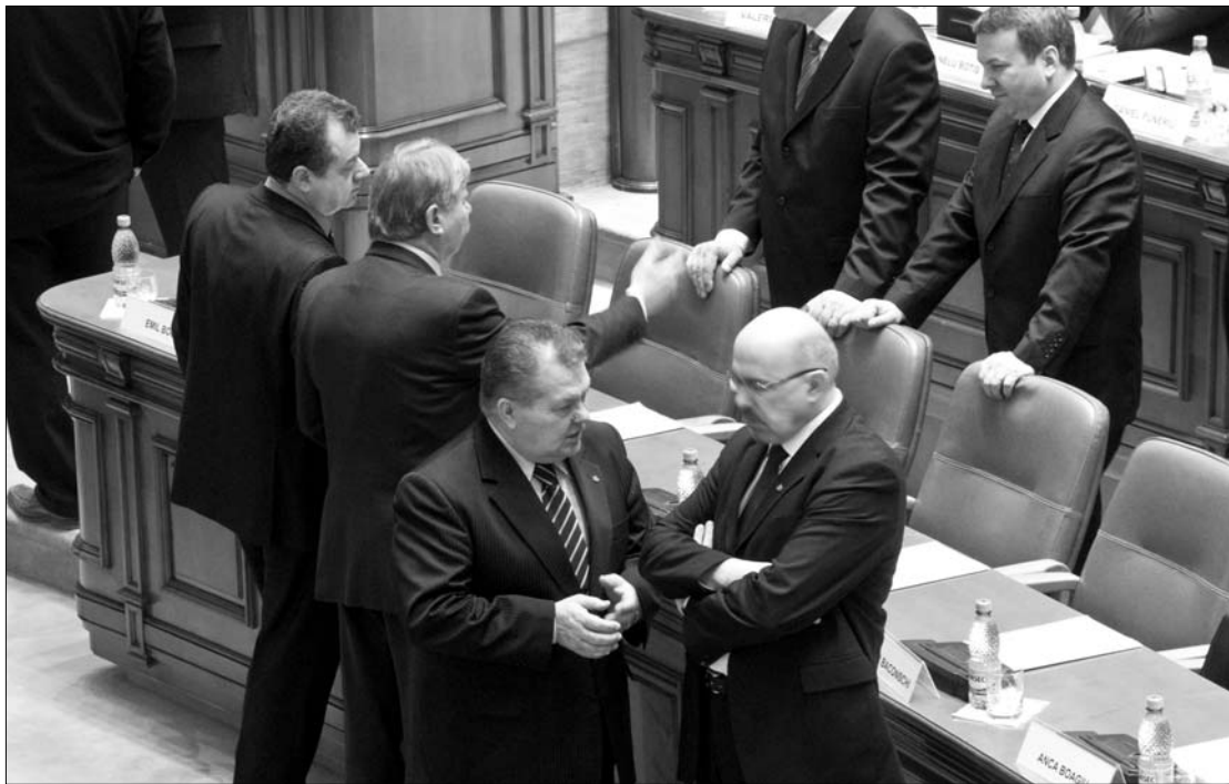
Az RMDSZ-es honatyák több módosító indítvánnyal „javították fel” a munkatörvénykönyv-tervezetet

Ugyancsak az RMDSZ kérésére törölték a tervezetből azt a cikkelyt, amely szerint a munkaszerződésben foglalt versenytalmi záradékot a munkáltató