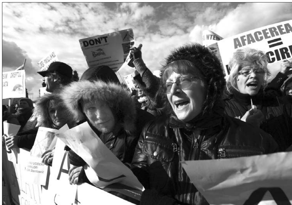
Az állatvédő egyesületek többször is tiltakoztak a parlament előtt az új törvény ellen