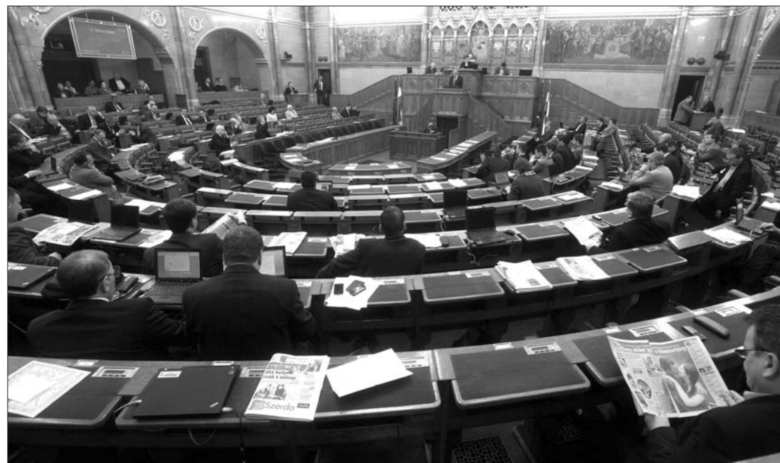
Alkotmányoz a magyar országgyűlés. Az ellenzék nem vesz részt az alaptörvény kidolgozásában

Az új alkotmány szabályozná az állampolgárságot és a választójogot is, ennek keretében a honosított állampolgárok választójogát is. Ezzel kapcsolatban Németh Zsolt magyar külügyi államtitkár a budapesti országgyűlési ülésen kiemelte: zökkenőmentes az egyszerűsített honosítási eljárás, a konzulátusok felkészülten végzik ezzel kapcsolatos feladataikat. A legnagyobb forgalmat a kolozsvári főkonzulátus bonyolította le. Az első ünnepélyes esküteleket március 14-én és március 15-én lesznek. ◀