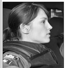
(kanadai akció sor.) 1.00 A bizalom ára (ism.)

6.00 Happy Hour (ismétlés) 7.00 ProTv hírek, sport, Könyvbemutató 10.00 Vádak csapdájában (amerikai dráma) (ismétlés) 12.00 Fiatál és nyugtalan (amerikai sorozat) 13.00 ProTv hírek, sport, időjárásjelentés 14.00 Eszelős szívatás (amerikai vígjáték, 1991) 16.00 Fiatál és nyugtalan (amerikai sorozat) 17.00 ProTv hírek, sport, időjárásjelentés 17.45 Happy Hour - szórakoztató műsor 19.00 ProTv hírek, sport, időjárásjelentés 20.30 A bizalom ára (am.-francia-angol-spanyol-cseh akciófilm, 1995) 22.15 Az örökség (román vígjáték sorozat) 23.30 ProTv hírek, sport, időjárásjelentés 0.00 Elit egység