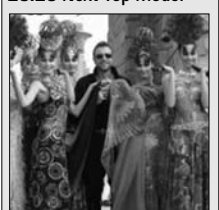
by Cătălin Botezatu - verseny show 22.00 Vad nárcisz (román sorozat) 23.00 Híradó 23.45 Egy bűnös show - Dan Capatos műsora 1.00 Egy rém rendes család (ism.) 1.45 Sebastian Cole kalandjai (am. vígjáték, 1998)

6.00 Híradó, Sport 8.00 Reggeli matiné - Razva és Dani műsora 10.00 Sajtószemle - Mircea Badeaval 11.00 Szindbád kalandjai (kanadai kaland sor.) 12.00 Xena (amerikai kaland sorozat) 13.00 Híradó, Sport 14.00 Egy rém rendes család (amerikai sor.) 14.30 Kikezdesz a szökéssel? - szórakoztató műsor (ism.) 16.00 Híradó, Sport 17.00 Közvetlen hozzáférés - Simona Gherghe műsora 19.00 Híradó, Sport, időjárásjelentés 20.20 Next Top Model