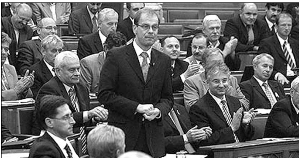
Navracsics Tibor miniszterelnök-helyettes, a médiatörvény módosításainak országgyűlési betérjesztője

A változtatás a kiegyensúlyozott tájékoztatás követelményét a tájékoztatási tevékenységet végző „lineáris médiaszolgáltatásokra” – vagyis a televíziókra és a rádiókra – korlátozza, így az a lekérhető tartalmakra nem vonatkozik. Rögzíti azt is, hogy nem az egyes médiaszolgáltatók, hanem a médiarendszer egészének a feladata a hiteles, gyors, pontos tájékoztatás.