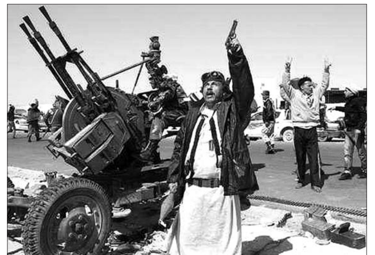
Lázadók „légvédelme” Bengáziban. Kadhafi csapatai bombázzák a kikötővárost