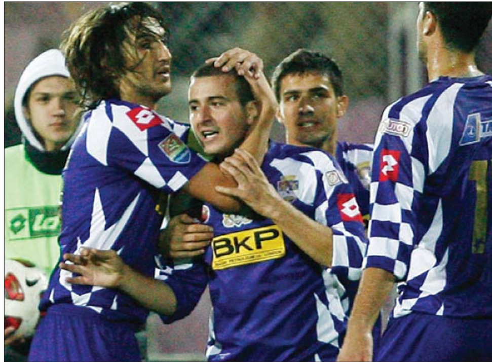
Zicu már három gólt lőtt a tavaszi idényben: gólkirály lesz a temesváriak csatára?

A hét végi 21. forduló műsora: pénteken: Pandurii-Gloria (összesen: 0-3) – 15 óra, GSP Tv , Brănești–Steaua (1-2) – 20.30 óra, Antena 1 ; szombaton: Kv. U–Unirea Urziceni (1-0) – 14 óra, GSP Tv , Marosvásárhelyi FCM–Oțelul (0-1) – 15.45 óra, Digi Sport , Rapid–Dinamo (2-3) – 20 óra, Digi Sport ; vasárnap: Sportul–Gaz Metan (0-3) – 15 óra, GSP Tv , Temesvár–Craiova (1-1) – 18 óra, Digi Sport ; hétfőn: Astra–Kv. CFR 1907 (2-2) – 17 óra, GSP Tv , Brassó–Vaslui (1-2) – 20.30 óra, Digi Sport . ◀