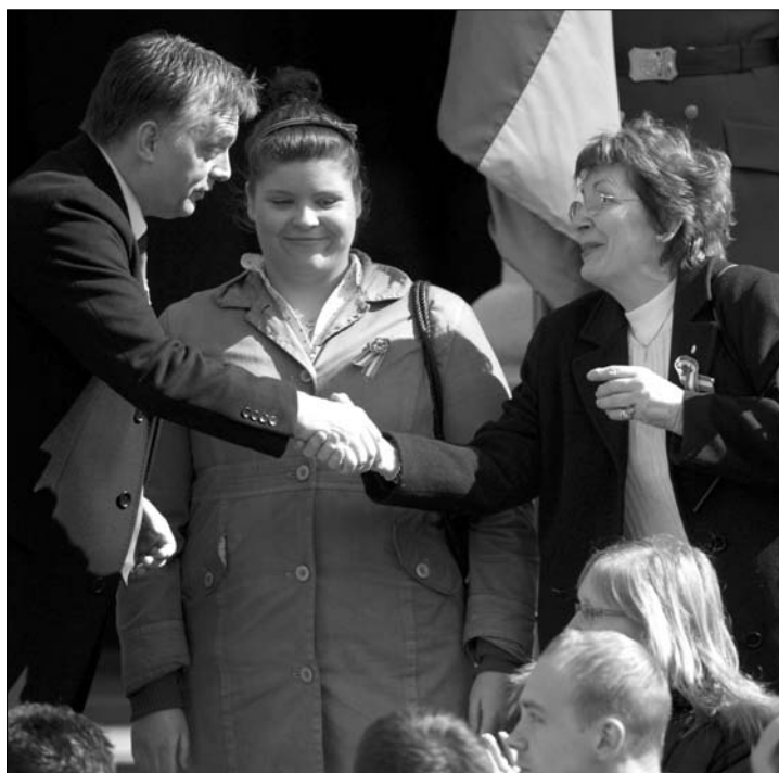
Orbán Viktor köszönti az ünneplőket. „Hadat üzent” Brüsszelnek

„Alkotmányos puccs zajlik ma Magyarországon, amelyet csak közös erővel, a demokratikus többség megteremtésével lehet megakadályozni. Ha ez sikerül, az alkotmányos puccs el fog bukni” – hangsúlyozta az MSZP el-