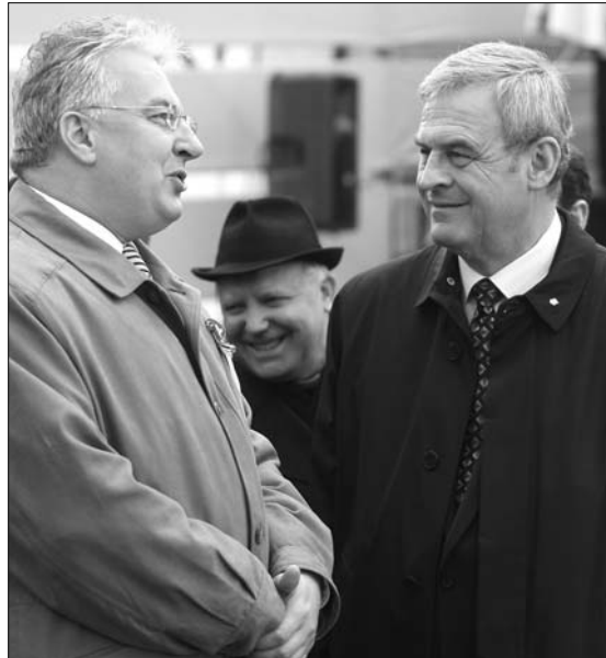
Kelemen Hunor RMDSZ-elnök, Semjén Zsolt magyar kormányfő-helyettes és Tőkés László EP-alelnök