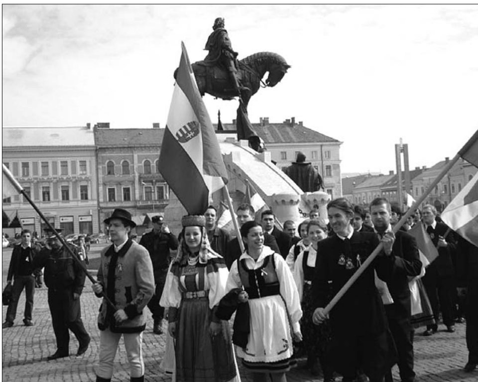
Meghitt hangulatban emlékeztek, székely népviseletben ünnepeltek Kolozsváron