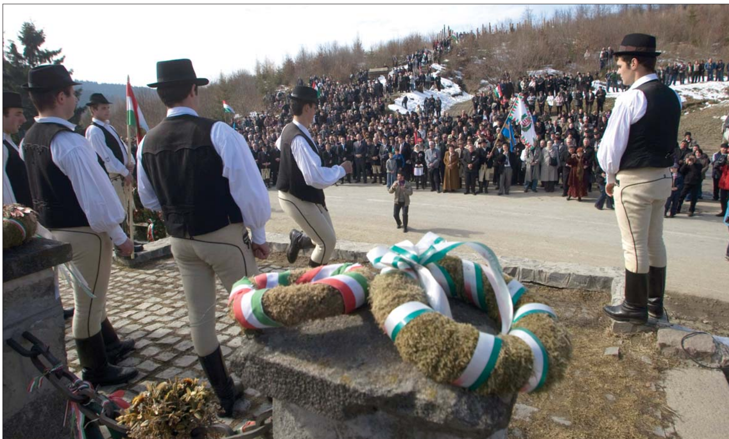
Székelyek a Nyerges-tetőn. Az 1849 augusztus elsejei harcokban elhunyt székelyek tiszteletére állított kőoszlopra idén is koszorúk kerültek

Az önrendelkezés fontosságát hangsúlyozták a március 15-i ünnepek szónokai