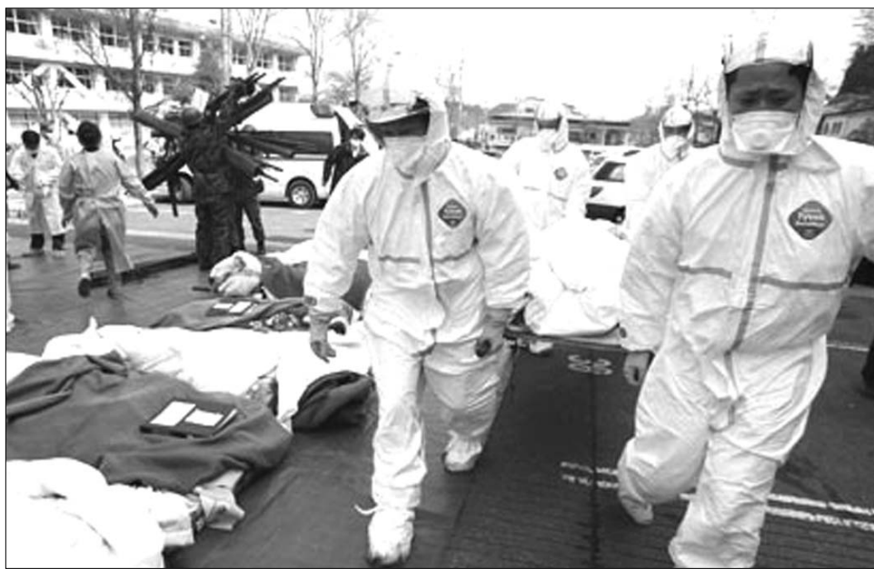
Riadó a fukusimai atomerőműnél. Mentik a sebesülteket

Az orvosok megkülönböztetik egymástól az akut és a besugárzás késői következményeit. Az akut jelenségekhez soroljuk a sugármegbetegedést. Csak a rendkívül nagy, 2 és 4 Sv közötti megterhelés váltja ki, mint például amilyenek azok a munkások voltak kitéve, akik a csernobili atomerőmű biztonságba helyezését kapták feladatuk. Tünetei: fejfájás, magatehetlenség, fáradtság, hajhullás, ellenőrizhetetlen vérzések. Az immunrendszer összeomlik, a szervezet képtelen újabb immun-