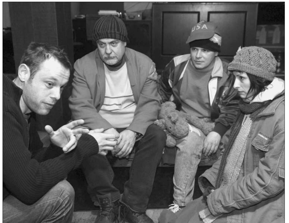
A Fedél nélkül című előadás színészei és rendezője a marosvásárhelyi Jazz Clubban próbálnak