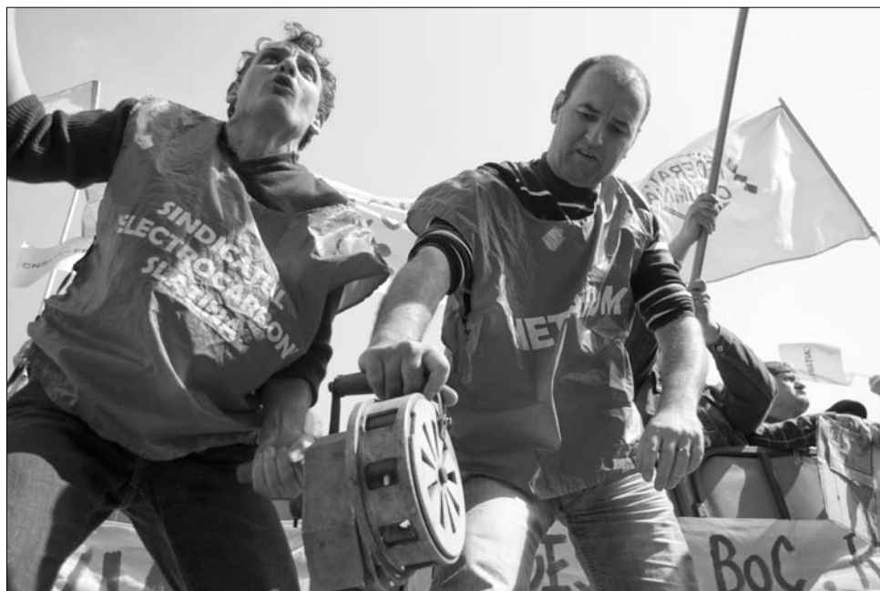
A tüntetők bekiabálásokkal, dobszóval, transzparenszekkel biztatták a szónokokat

A felfokozott hangulat annak ellenére alakult ki a tegnapi tüntetésen, hogy a résztvevők sokkal kevesebben voltak a szervezők által beharangozott létszámnál. Az érdekvédők ötvenezer emberre számítottak, de a rendőrség szerint csupán nyolcezeren (szakszervezeti források szerint tizenkétezeren) jelentek meg a fővárosban, pedig az érdekvédők