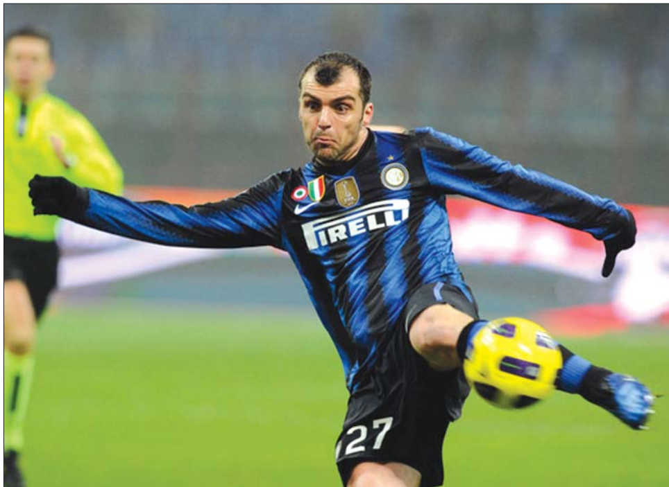
Goran Pandev, az Inter csatára, aki a győzelmet és a továbbjutást jelentő gólt lőtte Münchenben

A BL történetében a címvedő Internazionale a második csapat, amely hazai vereségét követően az idegenbeli visszavágón kiharcolta a továbbjutást. A bravúr különös pikantériája,