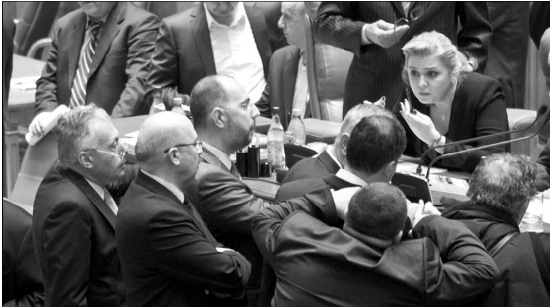
Az ülésvezető Roberta Anastase tegnap este szünetet rendelt el, az indítvány megszavazása előtt

A szünetig az ülés a már ismert forgatókönyv szerint zajlott: az ellenzék bírálta a bizalmatlansági indítvány tárgyát képező munkatörvénykönyvet, Emil Boc pedig védelmébe vette a jogszabályt. A kormányfő felszólásában arról beszélt: semmi esélye nincs az ellenzéki kezdeményezésnek, amelynek amúgy alig van köze a felelős-