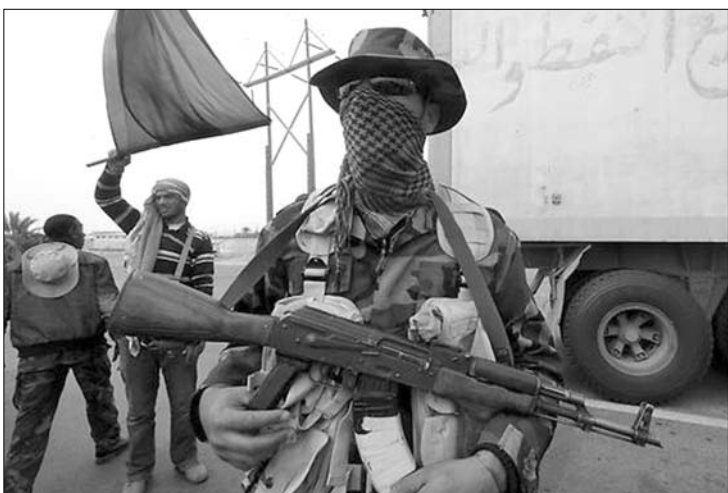
Bengázit védő felkelők. Kadhafi fia szerint 48 órán belül győznek a kormányerők

száműzetésben élő líbiai trónörökös azzal a kéréssel fordult az ENSZ Biztonsági Tanácsához, hogy hozzon létre repüléstilalmi zónát Líbiában, és bírálta azokat az országokat, amelyek ezt ellenzik. Mohamed esz-Szenuszi, akinek a családja a Kadhafi vezette, 1969-ben elkövetett államcsíny miatt távozott az országból, méltatta Franciaországot, Libanont és Nagy-Britanniát, mert a repülési tilalomra tettek javaslatot, egyúttal bírálta az Egyesült Államokat, Indiát, Kínát, Németországot és Oroszországot, mert vonakodnak megtenni a szerinte szükséges lépéseket.