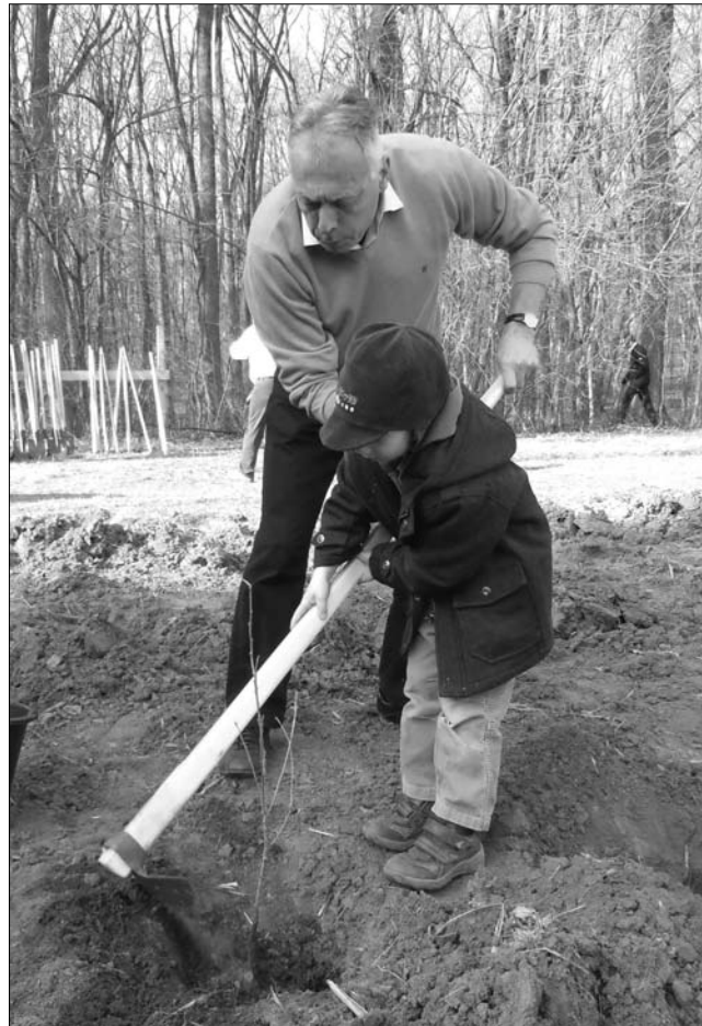
A következő nemzedéknek ülteti a fát Borbély László miniszter

gű befektetésekre a 2009-es fedezethez képest. Idén pedig a tavalyi emelt összeget is megduplázzuk” – hangsúlyozta a program fontosságát Borbély László. A hazai Környezetvédelmi Alap révén finanszírozott projekteken kívül a miniszter az Európai Unió által biztosított céltámogatásokra hívta fel a figyelmet, tavaly ebből a forrásból ugyanis már 800 hektár erdőesítettek. A 299 millió euróval finanszírozott, 2011-es erdőesítési terv újabb tizenkétezer hektár erdőesítést teszi lehetővé, ha a pénzek lehívása a tervezett ütemben halad. „2011-től erdészeti kerületenként egy hektár paragon hagyott mezőgazdasági terület beültetését szorgalmazzuk. Az Erdőgazdálkodási Hivatal az első erdőesítési program számára 14 millió facsemetét biztosít” – nyilatkozta a környezetvédelmi miniszter. Nemcsak az új erdők telepítése, a régiek védelme is kiemelt figyelmet kap: az illegális fakivágások mértékének csökkentése érdekében tovább szigorítja a szaktárca az erdőgazdálkodási törvényeket. Jelenleg csak akkor büntethető a falopás, ha az ellopott faanyag mennyisége meghaladja az öt köbmétert, Borbély azonban úgy véli ideje életbe léptetni a „zéró toleranciát”, és a legkisebb mennyiség esetében is büntetni kell. ◀