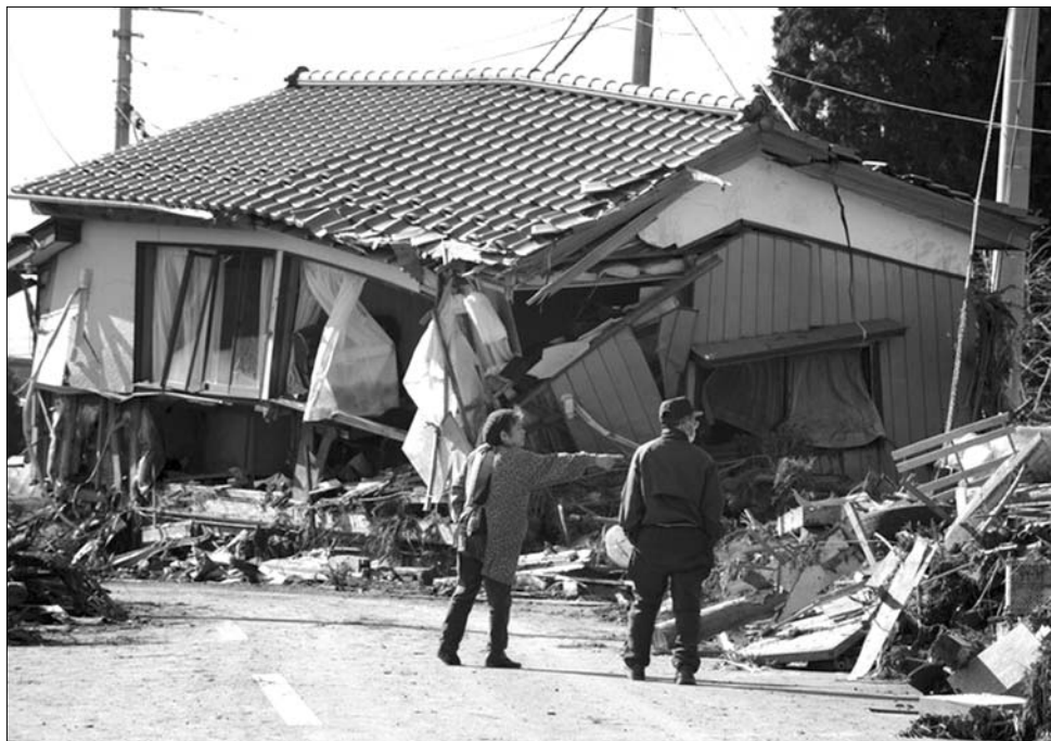
A büntetéstől jobban félnek, mint a katasztrófától: Romániában ez ösztönöz legjobban biztosításkötésre

Simpf tapasztalatai szerint Romániában a potenciális ügyfelek zöme inkább halogatja a szerződésükre, még a japán katasztrófa és a napokban történt romániai földrengés sem motiválja annyira az embereket, mint egy esetleges büntetést. A szakember ugyanakkor úgy látja, a helyhatósági intézményeknek nem érdeke a bírságotlós, mivel ezzel csak magukra haragítanak választókat – másrészt maguk az önkormányzatok is, anyagi helyzetük miatt, általában az utolsók között kullognak, ha a felelősségükbe tartozó szociális lakások biztosításáról van szó. ◀