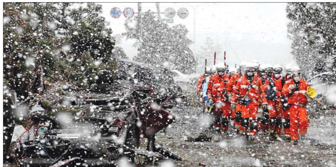
A fukusimai atomerőmű 3-as reaktora. A sűrű hóhullás is nehezíti a mentési munkálatokat

tonai helikopterről hűtik. Közben világszerte vita folyik az atomerőművek hasznosságáról és veszélyeiről. 2. oldal ▶