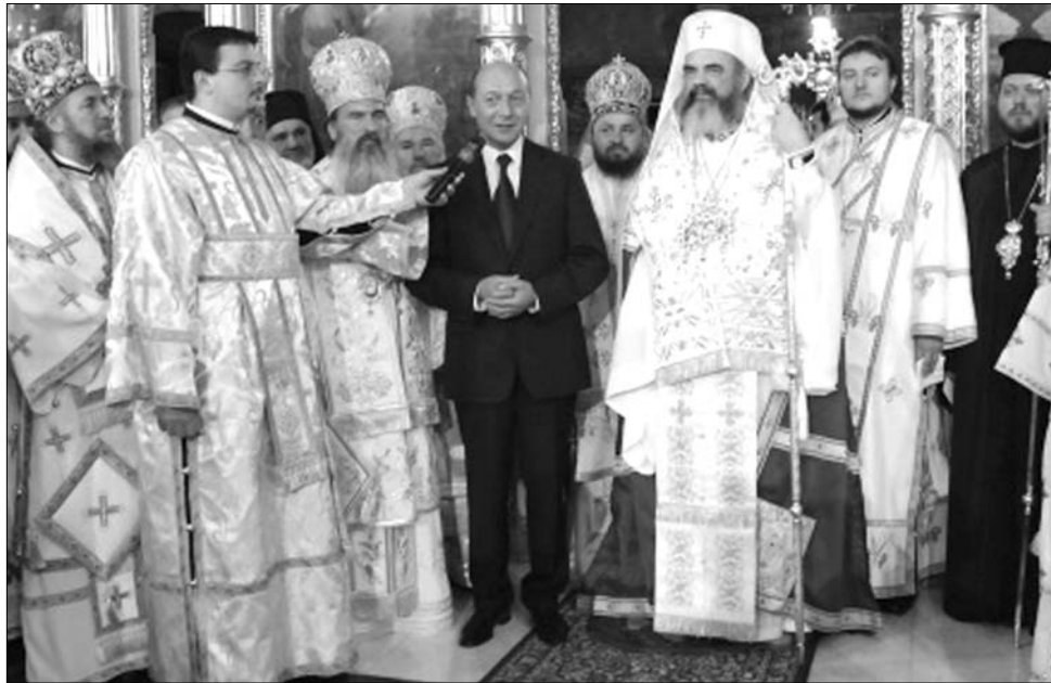
Állam és egyház összefonódása. Traian Basescu szívesen mutatkozik egyházfők társaságában

Az APADOR – Helsinki Bizottság emberjogvédő szervezet alapító tagja, Gabriel Andreescu pedig kretelés nélkül kimondta: a törvény megszavazása esetén az egyház az állammal seftelő oligarchává válik. ◀