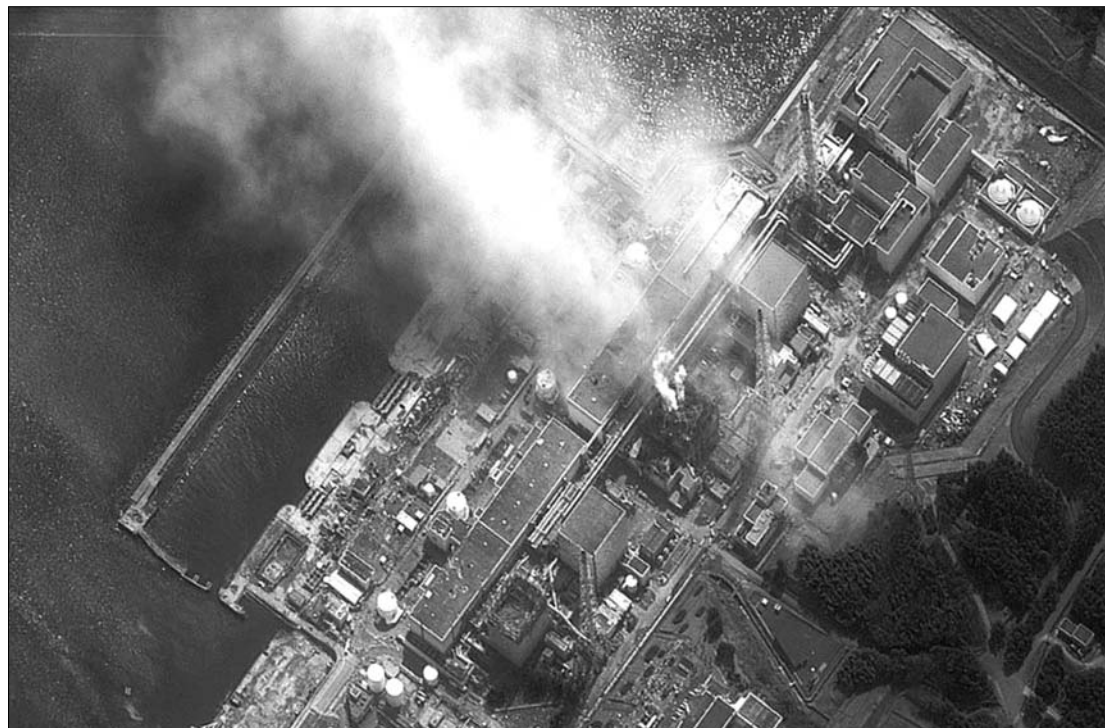
Ürfelvétel a sűrű füstöt árasztó fukusimai atomerőműről. A szakemberek magolvadástól tartanak

A fűtőelemek túlnyomó részét károsodott Japánban a fukusimai atomerőmű két reaktorában – közölte az erőművet üzemeltető Tokiói Elektromos Művek. Az egyes blokkban az üzemanyag-kazetták 70 százaléka, a kettős reaktorban egyharmaduk sérülhetett a túlhevülés következtében. A sérülés jellegéről ugyanakkor nem lehet tudni biztosan. A fűtőelemek részben megolvadhattak, de ki is lyukadhattak. A tengerparti komplexumban a pénteki szökőár következtében megszűnt az áramellátás, ezért leállt a hűtési rendszer. Tartani lehet, hogy ezért magolvadás következett be, vagyis cseppfolyóssá váltak a fűtőrudak. Ebben az esetben urán és az egészségre súlyosan káros más hasadóanyagok kerülhettek a környezetbe. Az elmúlt napokban a Fukushima-1 erőmű három reaktorában is robbanás történt. Kedden és szerdán tűz ütött ki a négyes reaktorban. Valószínűleg megron-