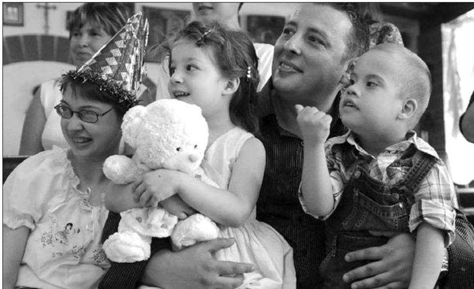
Minden hatszázadik magzatot érint a Down-szindrómát okozó kromoszóma-rendellenesség

„Nekünk a házasságunk ment rá arra, hogy a gyerekek érintett, de nem törvényszerűen alakulnak így a dolgok” – teszi hozzá a 36 éves nő, aki szerencsésnek