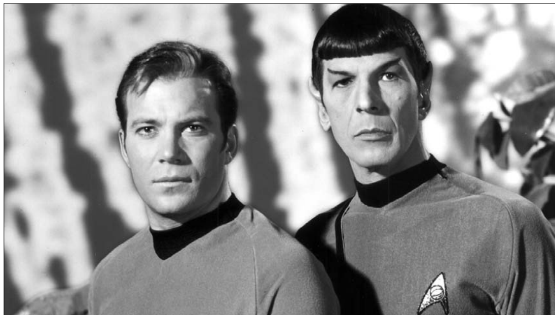
William Shatner (balra) az 1966–69 között felvett Star Trek Kirk kapitányának megformálásával lett világhírű

Filmes és tévés karrierjét az '50-es évek elején kezdte. 1958-ban már Yul Brynnerrel szerepelt együtt a Karamazov testvérek ben a '60-as évektől pedig sorra kapta az epizód szerepeket az olyan horroszériákban, mint a Twilight Zone vagy a The Outer Limits . Az NBC 1966-ban elstartoló Star Trek -sorozatában eredetileg Pike kapitánynak hívták volna a USS Enterprise csillaghajó parancsnokát, akit a '64-ben leforgatott, első pilot epizódban egy veterán westernszínész, Jeffrey Hunter alakított. Ezt a verziót az NBC