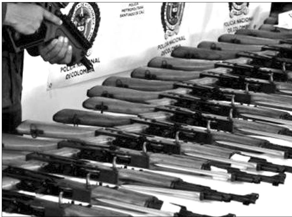
Kalasnyikov, made in Romania – minden mennyiségben