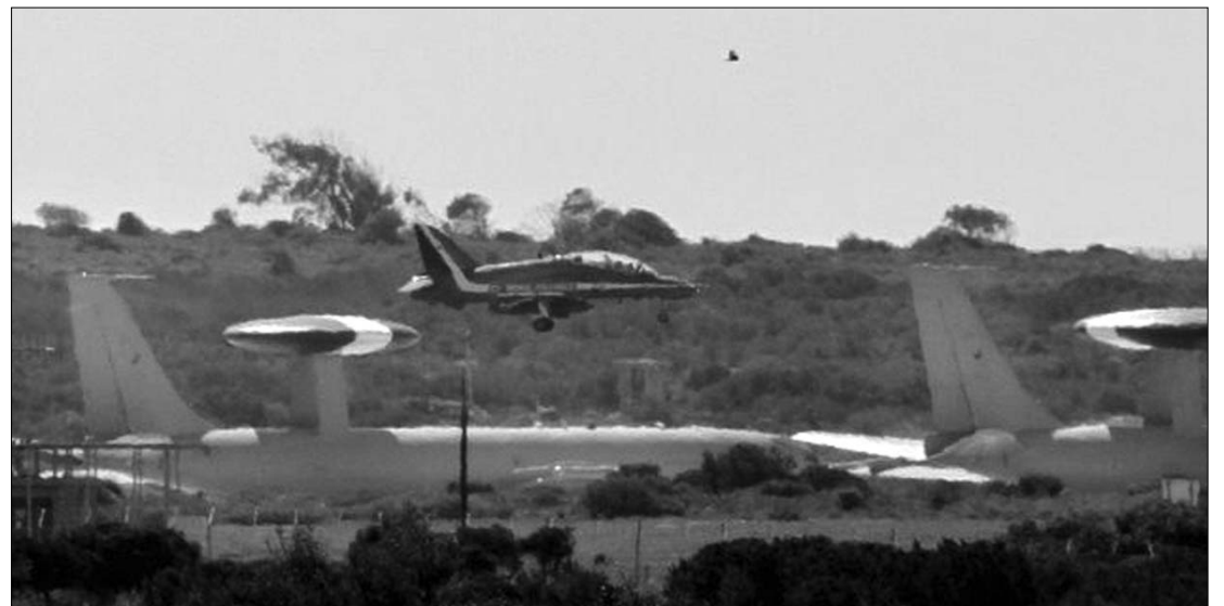
Kadhafi légiereje Líbia keleti részén a felkelőket támadta, miközben a nemzetközi haderő gépei rá vadásznak