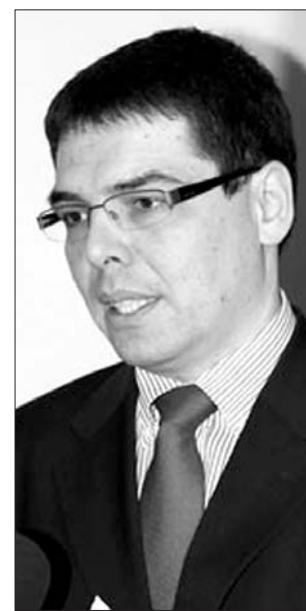
Zsigmond Barna csíki főkonzul

honosításhoz szükséges dokumentumokat. A főkonzul szerint áprilistól valószínű útleveleket is kezdenek kiállítani a magyar állampolgárságot frissen megszerzők számára. Zsigmond Barna Pál abban bíz, hogy a kezdeti bizonytalanságok után az állampolgárok egyre felkészültebben adják be a kérelmeket, nem okoznak gondot a hiányzó dokumentumok, így lerövidül a kérések átvételének és iktatásának ideje is. Tamás Sándor Kovászna megyei tanácselnök elmondta: egyezség született a háromszéki polgármesterekkel, hogy a magyarországi testvértelepülésekre szervezzenek autóbuszos kirándulásokat, és ott adják le a honosítási kéréseket. ◀