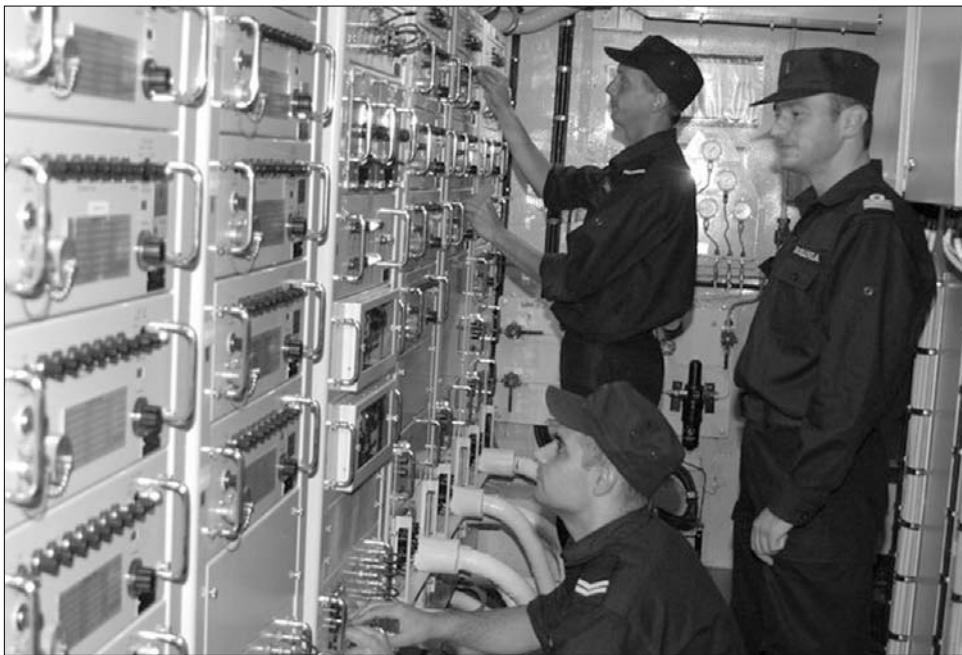
Öreg fregatt nem vén fregatt. A Ferdinánd király vezérlőtermének egy része

A különféle nemzetközi hadszíntereken Románia húsz embert veszített, a legtöbbet, tizenhetet Afganisztánban; Irakban két, Bosznia-Hercegovinában egy román katona vesztette életét. A sebesültek száma hatvan-kilencre emelkedett. ◀