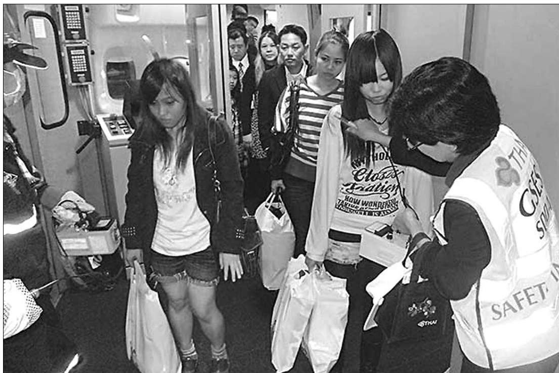
Japánban a jódtablettákat már a fukusimai katasztrófa utáni első órákban elkezdték osztogatni

Romániába azonban már akkor beköltözött a félelem, amikor a radioaktív felhő még messze járt az országtól. A lakosság már a múlt hétvégétől megrohmozta a patikákat, hogy jódtablettákat vásároljon. A bukaresti gyógyszertárak két nap alatt kifogytak emiatt a készleteikből. A „jódhisztéria” láttán az Egészségügyi Minisztérium a hét ele-