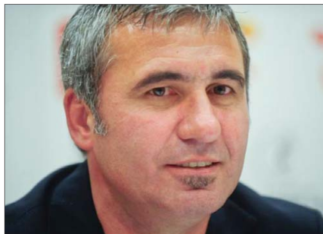
Gheorghe Hagi, aki úgy látszik, még marad a Galatánál.