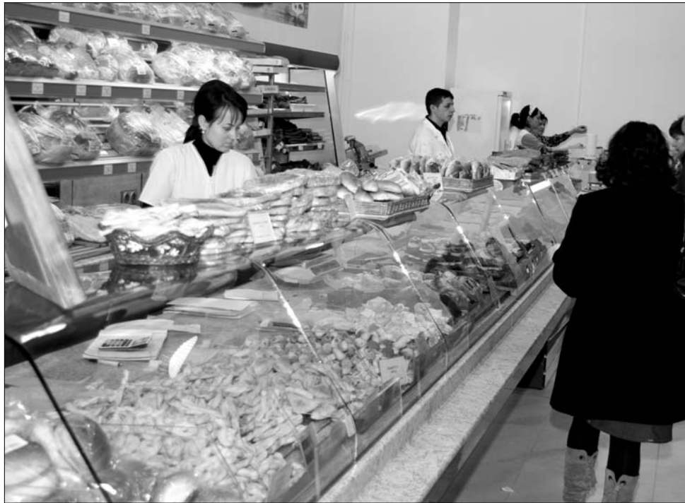
A liszt csökkentett áruforgalmi adója kifehéritené a gabonakereskedelem feketepiacát is.

Az államfői érvelésben az áll, hogy a tervezett áfacsökkentés nemcsak jelentős adóbevételektől fosztaná meg az államkasszát, de meghiúsítaná a tervezett költségvetési hiánycélt, rontana a pénzügyi kiszámíthatóságon és az ország értékelésén – ráadásul Románia nagyot esne a külföldi hitelintézetek szemében is. Korábbi számítások szerint az államkincstár legkevesebb 850 millió euróval lenne szegényebb az ötszázalékos áfa bevezetésével, a Ziarul Financiar számításai szerint ugyanis az élelmiszeripar érintett szegmense tavaly 5,5 milliárd eurós eladást bonyolított le. A kormánypárti politikusok, köztük Emil Boc kormányfő napokban tett kijelentései megegyeznek abban, hogy az ország még semmilyen téren nem érett meg az adócsökkentésre. Bár az élelmiszerárak az utóbbi időben valóságos robbanást produkáltak, a dráguláshullámnak kedveznek a közeljövőben is a globális katasztrófák és háborúk. ◀