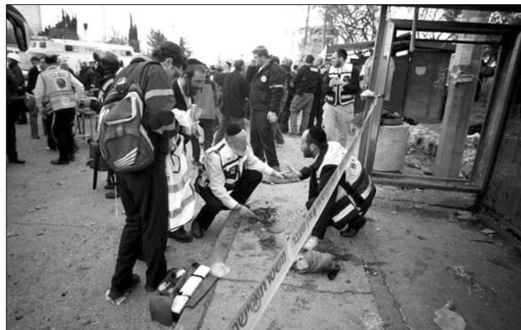
A detonáció egy embert megölt és legalább harmincat megsebesített

Benjámín Netanjahu izraeli kormányfő a robbanás hírére elhalasztotta moszkvai utazását. Szalám Fajjad, a palesztin autonóm területek miniszterelnöke „a lehető legélesebben” elítélte a merényletet, és hasonló nyilatkozatot adott ki Mahmúd Abbász palesztin elnök Moszkvában. ◀