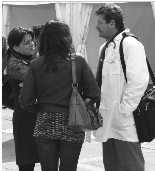
Rendelőiket és pácienseiket féltik az elégedetlenkedő házi orvosok

Az érintettek tiltakoznak az ellen, hogy részt kell venniük az egészségügyi rendszer digitalizálásának folyamatában, ami nemcsak pluszmunkát, hanem többletkiadást is jelent: a házi orvosoknak kell megvásárolniuk az egészségügyi kártya leolvasására alkalmas készüléket. „Nem vállalkozhatunk ilyen jellegű beruházásokra, mert ez nem függhet az egyéni döntésektől, itt egységes eljárásra van szükség. Ezt a beszerzést az Or-