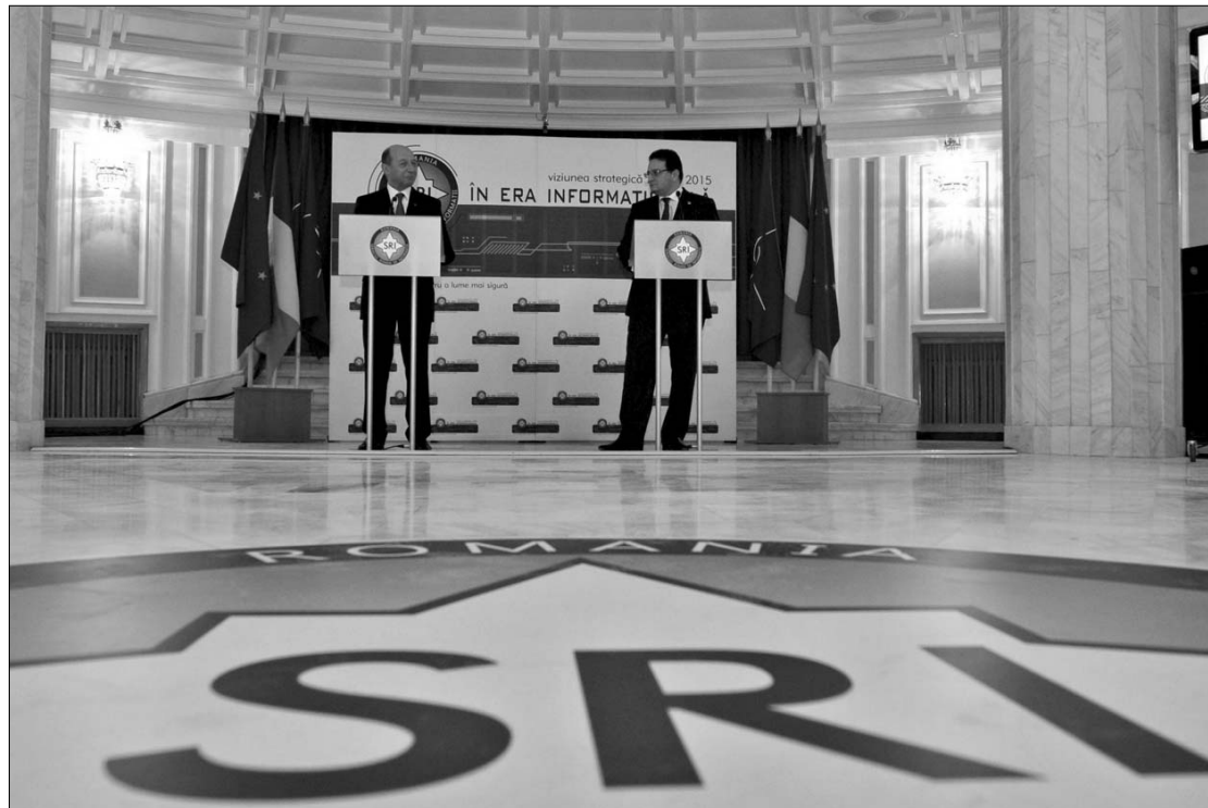
Traian Băsescu államfő (balra) a terrorelhárítás fokozására kérte George Maior SRI-igazgatót

tus védelmi bizottságának elnöke is, aki arra emlékeztetett, hogy forráshiány miatt bele sem kezdtek a britektől vásárolt két fregatt felszerelésébe, amelyek közül egyiket most „hadrendbe állítják”. „Modernizálni kellett volna a hajókat, de ez el sem kezdődött. Ugyanúgy maradtak, ahogy a britektől megvettük őket, másodkézből” – fogalmazta meg leújtó véleményét a volt védelmi miniszter. ◀