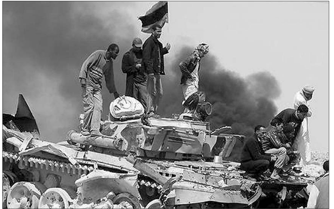
Felkelők a kormányerők egy kilőtt tankjával. Nem vették be Moammer el-Kadhafi szülővárosát

Az Egyesült Államok, Franciaország és Nagy-Britannia kész állni attól, hogy bíróság elé állítsák Moammer el-Kadhafi líbiai vezetőt, ha azonnal lemond a hatalomról, és elhagyja Líbiát – ez az értesülés néhány órával a konferencia kezdete előtt szivárgott ki. Diplomáciai források szerint a fórumon megvitandó egyik legfőbb kérdés az, hogy mi legyen Kadhafi és családja sorsa. Bár