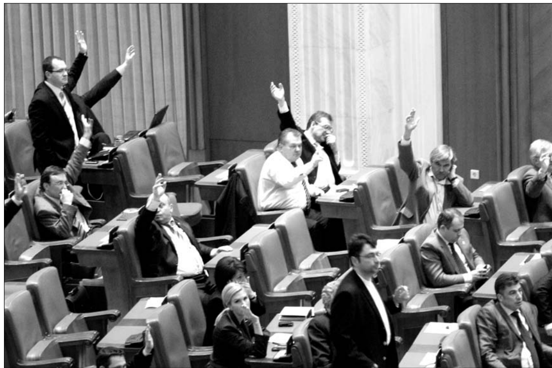
Az RMDSZ-es frakció sikerként könyvelte el a román–magyar viszonyra veszélyes nyilatkozat elutasítását.

A plenáris szavazást megelőzően a külügyi bizottságban is