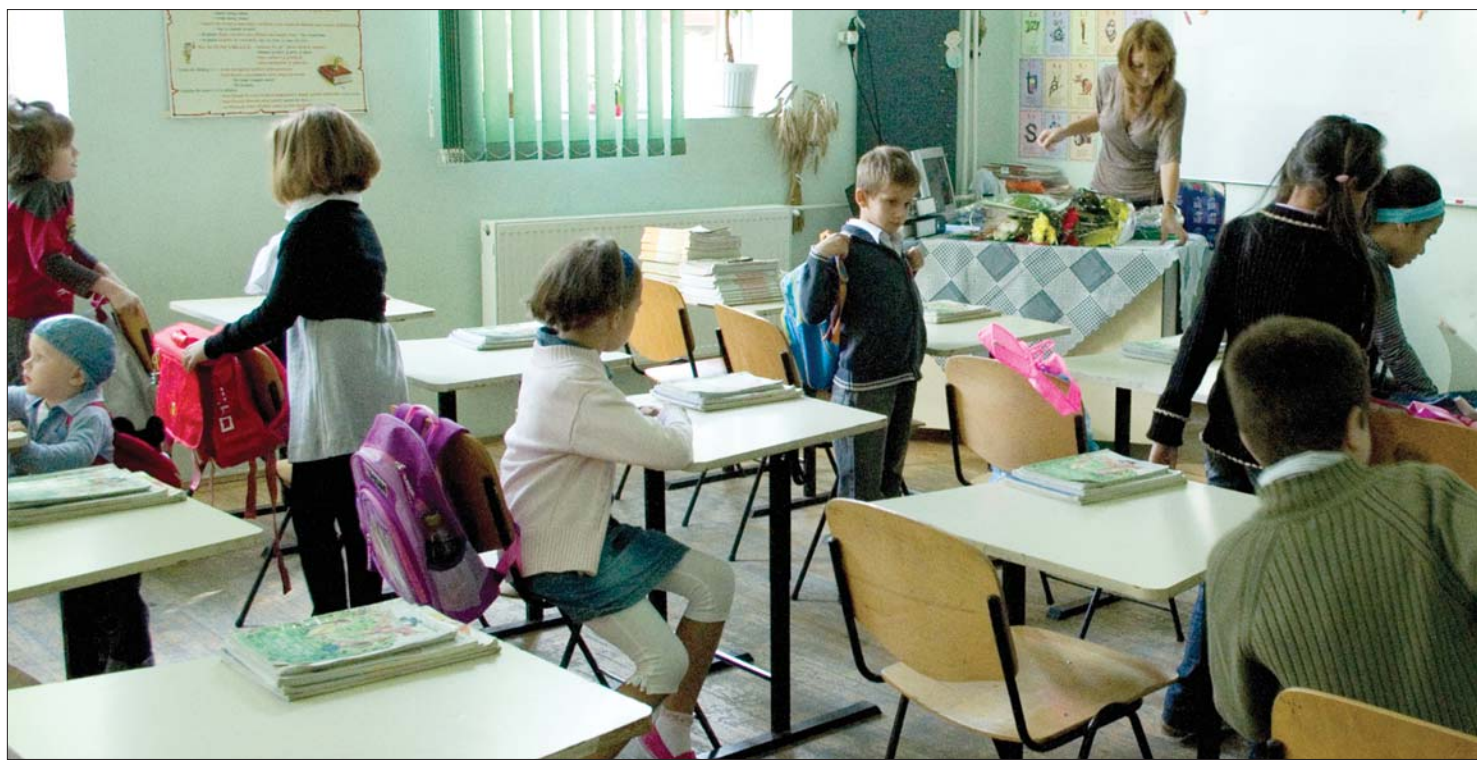
A bukaresti Ady Endre Líceum. Jelenleg a magyar tanintézményekben tanuló nem magyar nemzetiségű diákoknak is jár a támogatás