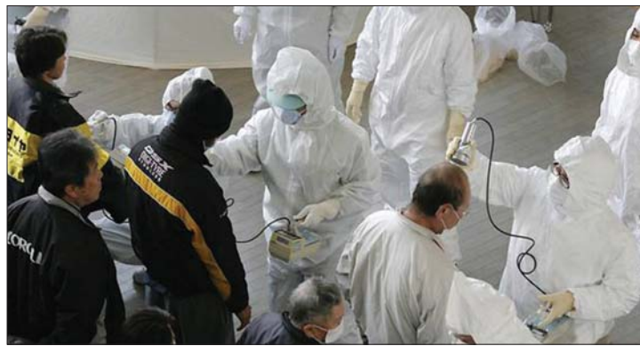
A fukusimai atomerőmű alkalmazottainak egészségét naponta ellenőrzik

▶ A Fukusima atomerőműben kiszámíthatatlan a helyzet alakulása – jelentette ki a japán miniszterelnök. A japánok azonban megszokták már a veszélyeztetettséget – számolt be az ÚMSZ -nek egy Yokohamában élő magyar mérnök. 2. és 4. oldal ▶