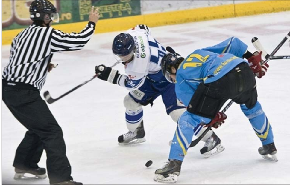
Null-kettőről fordítva nyerte meg 4-2-re a HSC a Brassói Fenestela 68 elleni döntőt

Ez volt a csíkszeredai jégkorongsport tizenharmadik bajnoki megkoronázása, hiszen 1949-ben IPEIL, 1952-ben Lendület, 1957-ben Termés, 1960-ban és 1967-ben pedig Akarat néven szerezte meg a címet. Az SC majd