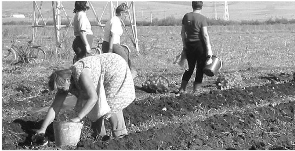
Idén már törvényesen dolgozhatnak a mezőgazdaságban alkalmazott napszámok is

A kezdeményezők elmondták, a tervezettel ellenében nem lesz napszámok könyvecské – az alkalmi munkavállaló adatait és ledolgozott óráit ehelyett a munkáltatónál lévő speciális napszámregiszterbe fogják bevezetni, amelynek kivonatát havonta kell benyújtani a Területi Munkaügyi Felügyelőséghez. ◀