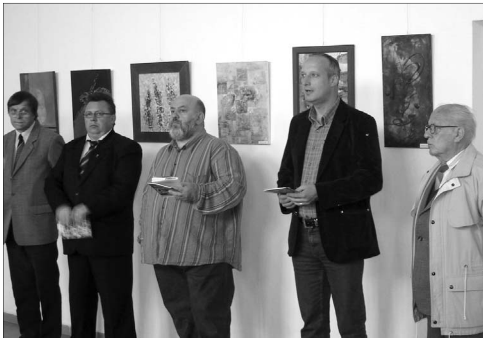
Nyári alkotótáborok munkáit bemutató képzőművészeti kiállítás nyílt a nagyenyedi közösségi házban

tóit Ioan Hădărig költő, az Inter-Art Alapítvány művészeti vezetője ismertette, majd átnyújtotta Kovács Krisztiánnak az első alkalommal 1930-ban Nagyenyeden megjelenő România Literară folyóirat egy példányát, amelyben az Erdélyi Helikon , illetve helikonisták munkásságáról is tájékoztattak. Ugyancsak Hădărig számolt be arról, hogy a nemzetközi művésztelep alkotásaival öszire újabb amerikai turnéra készülnek, áprilisban pedig Kelemen Hunor kulturális miniszter nyitja meg Bukarestben Balog István kiállítását. ◀