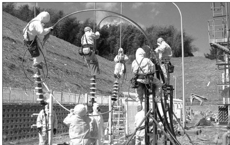
Villanyszerelők védőöltözékben. Fukusimában feszült munka folyik

A 131-es jódizotóp mennyiségének enyhe növekedését észlelték a környezetben mindkét Koreában és Kínában, továbbá a Fülöp-szigeteken. A hatóságok pénteken kezdték vizsgálni, hogy a térség vizeiben élő halaknál is kimutathatók-e radioaktív elemek – köztük jódom, cézium és mások –, de a sugárterhelés semmilyen jelet nem észlelték. ◀