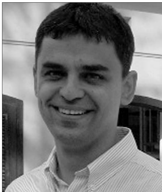
Ulicsák Szilárd, a határon túli támogatások miniszteri biztosa