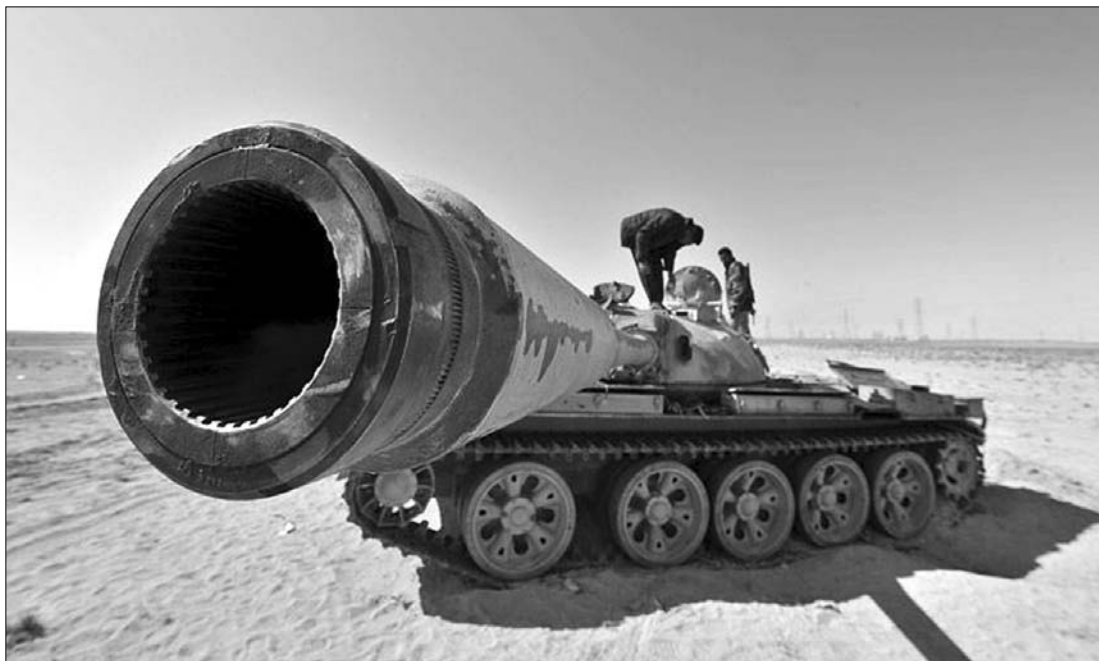
Felkelők Adzsábija mellett a kormányerők által elhagyott tankkal. A Kadhafihoz hű erők tegnap visszafoglalták a várost

Kedd éjszaka Tripoliban, a Bab al-Azizija, Moammer el-Kadhafi főhadiszállása körzetében, a főváros délkeleti részében két nagy erejű robbanás történt. A líbiai vezetőhöz hű erők visszafoglalták Rász-el-Unúfot, a líbiai kőolajexportban is fontos szerepet játszó, stratégiai fontosságú kikötővárost. Újabb támadást intéztek Miszráta ellen is a Kadhafihoz hű csapatok – mondta el a felkelők egy szóvivője. A szóvivő szerint a kormányerők reggel ismét „harcokcsilovegekkel és rakétákkal lőtték a város több negyedét”. ◀