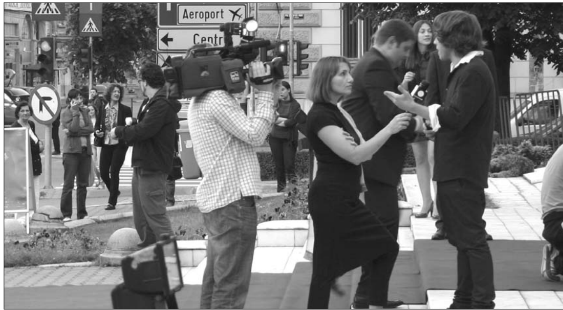
A magyarországi közmédiák határon túli tudósítói idén egyelőre ingyen dolgoztak, Budapest semmit nem fizetett

Lapunk felhívta a Duna Televízió titkárságát is, de miután elmondtuk, hogy milyen ügyben szeretnénk választ kapni, arra kérték, hogy várjuk, míg kapcsolják az illetékest. A hívás rövid idő múlva megszakadt, ami után hiába próbáltuk több alkalommal is visszahívni a Híradó irodáját, ahová a Közönségszolgálatról irányítottak. A készülék kicsöngett, majd néhány csörrenés után megszakadt a kapcsolat. ◀