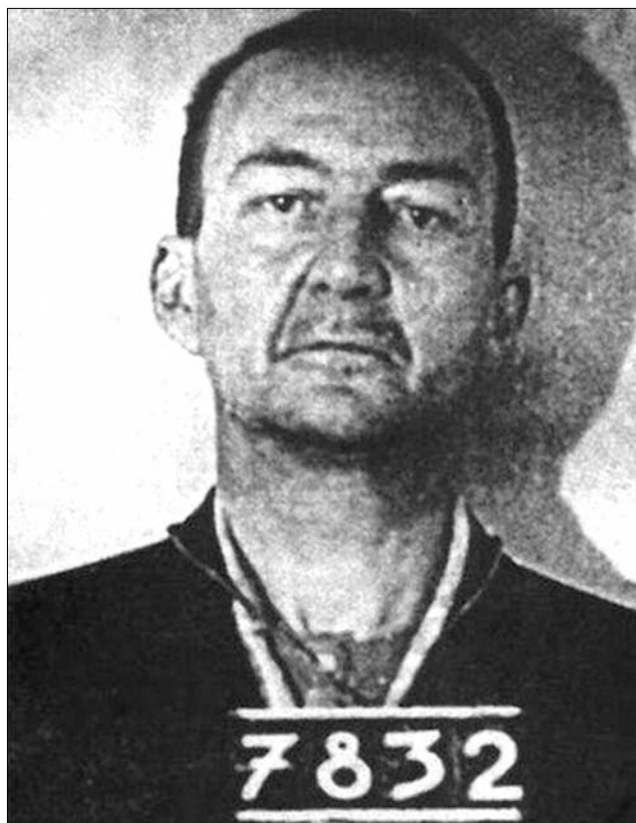
Esterházy megítélése korántsem azonos szlovák és magyar oldalon

A szobrot egy magántulajdonban lévő épület belső udvarán helyezték el, a szoborgyalázók tehát birtokháborítást, magánlaksértést is elkövettek. Az újság szerint minden további nélkül elképzelhető, hogy „mit tettek volna a szoborral akkor, ha – mondjuk – szabadtéren állítják fel”. Az Új Szó magyarázattal is szolgál: Esterházy János megítélése korántsem azonos a szlovák és a magyar oldalon. Míg ugyanis a magyarok hibás politikai döntéseit és a német birodalom iránt érzett egykori tiszteletét, csodálatát későbbi jó