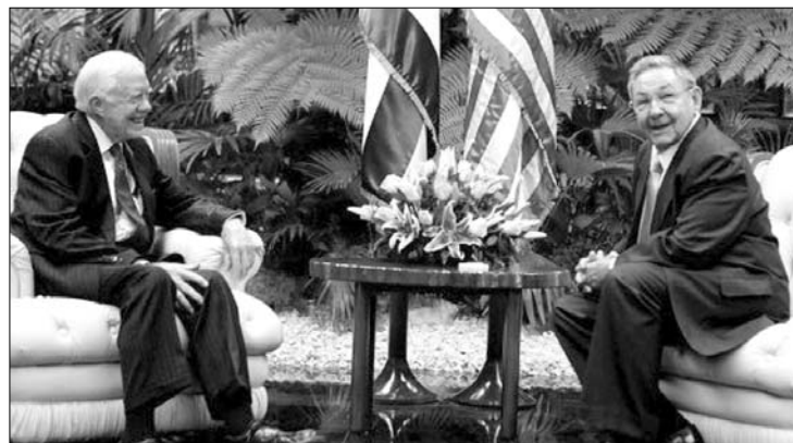
Carter (balra) és Raúl Castro. A volt amerikai elnök az ellenzékkel is találkozik

Legalább 58-an meghaltak és százan megsebesültek az iraki Tikritben lejátszódott túsdrámában – jelentette tegnap hajnalban az al-Dzsaszíra arab hírtelevízió. Iraki biztonsági források szerint katonai és rendőri egyenruhát, továbbá robbanóvet viselő fegyveresek foglalták el kedden az észak-iraki Szaláheddin tartomány székhelyén a tartományi tanács székházát. A támadás azzal kezdődött, hogy az épület bejáratánál egy öngyilkos merénylő működésbe hozta a testére erősített pokolgépet. Társai a robbanást követő pánikot kihasználva benyomultak a székházba, amelyet ellenőrzésük alá vontak, és tüzet nyitottak az épületet megközelíteni próbáló rendőrökre. Húsz perccel később – amikor erősítés érkezett a helyszínre – egy közelben parkoló autóban elrejtett pokolgép robbant fel. Az iraki biztonsági erők később megostromolták és visszafoglalták az épületet. Az 58 halálos áldozat közül 15 embert – köztük három tanácstagot – a támadók az épületben korábban túsul ejtettek, és fejlődéssel kivégzésükre meggyilkoltak. A robbanómellényt viselő támadók végül felrobbantották magukat. A városban még az incidens alatt kijárási tilalmat vezettek be. A Bagdadtól északra fekvő Tikrit a néhai diktátor-elnök, Szadám Huszein szülővárosa. Sokáig a szunnita felkelők felfegyverése volt, és jelenleg is véres merényletek helyszíne. ◀