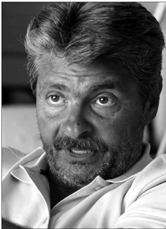
Sebastian Ghiță szerint Sorin Ovidiu Vîntu megszarolta és megfenyegette őt és a családját. SOV hallgat