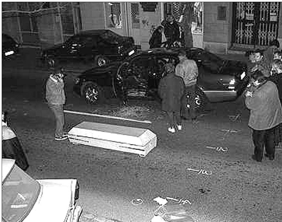
1998. február 11.: helyszínelés a gyilkosság színhelyén, a budapesti Margit utcában