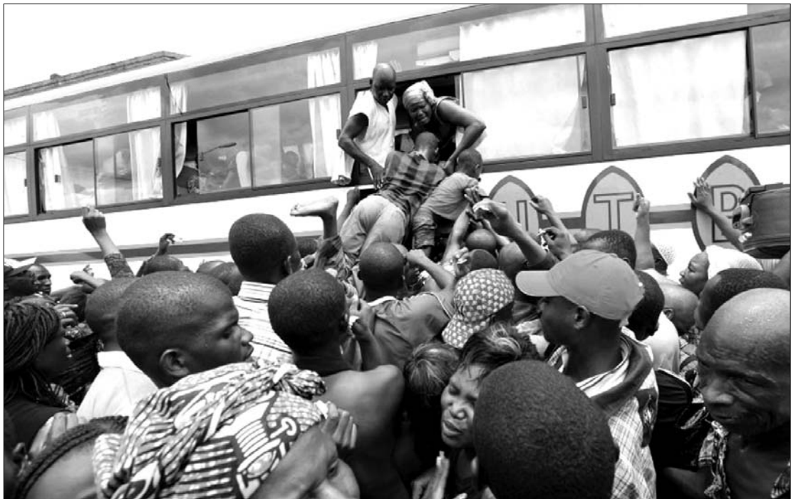
Hangulatkép Abidjan fővárosból. Ezek roharnak meg minden egyes ritkán induló autóbuszt

► Az elefántcsontparti hadsereg vezérkari főnöke elhagyta a Dél-afrikai Köztársaság abidjani nagykövetségét, vasárnap visszatért a hadsereg vezetőinek körébe, és találkozott Laurent Gbagbo „államfővel” – közölte az elnökválasztáson vesztes, de hatalmától megválni nem akaró Gbagbo kormányának szóvivője. Korábban olyan jelentések láttak napvilágot, hogy Philippe Mangou vezérkari főnök szerdán dezertált, és családjával együtt politikai menedéket kért a dél-afrikai nagykövetségen, miután az ENSZ Biztonsági Tanácsa szankciókat fogadott el Gbagbo ellen, a megválasztott és nemzetközileg elismert elnök, Alassane Ouattara erői pedig megkezdték Abidjan bekerítését. A francia hadsereg megkezdte vasárnap a külföldiek, főként a franciák evakuálását az elefántcsontparti Abidjanból, ahol csütörtök óta heves harcok dúlnak a hatalmához ragaszkodó Laurent Gbagbo volt elnökhöz hű erők és a megválasztott államfő, Alassane Ouattara mögött felsorakozott fegyveresek között. A hadsereg Transall típusú csapatszállító repülőgépei elsőként 167 személyt, főként gyerekeket és nőket vittek át Togó fővárosába, Loméba – közölte az ottani francia nagykövetség. Egyelőre nincs szó a Port Bouet támaszponton összegyűlt mintegy 1650 francia és