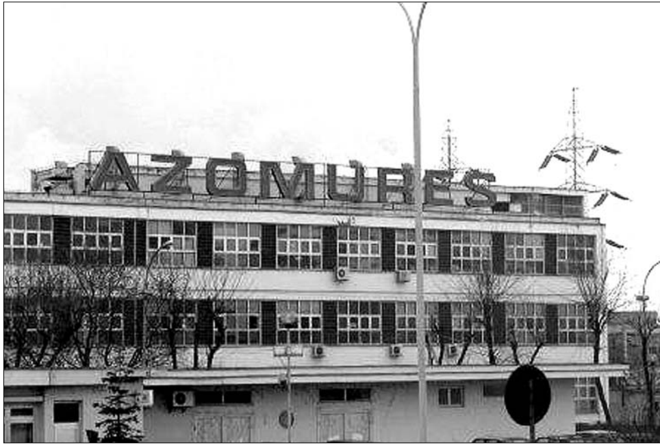
Súlyos bírsággal fenyegetik a marosvásárhelyi Azomureș műtrágyagyárat, ha továbbra is szabályt szeg