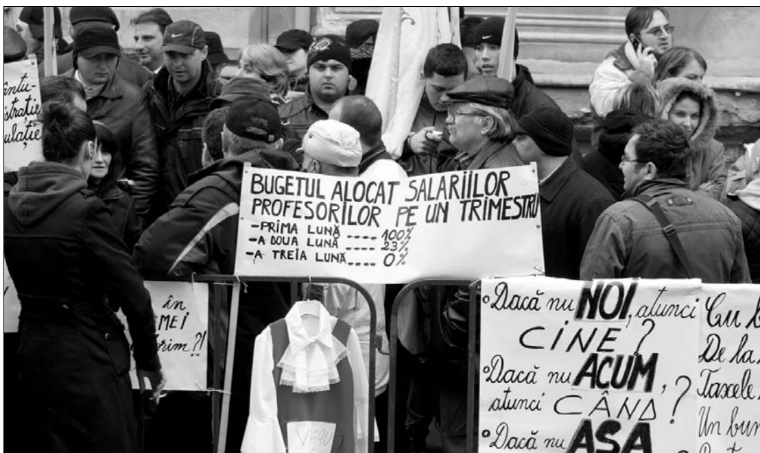
A pedagógusok tüntetéseket helyeztek kilátásba, ha nem jutnak hozzá a bíróságon elnyert jogaikhoz.

Az ellenzéki pártokat tömörítő Szociál-Liberális Szövetség (USL) országos vezetősége tegnap úgy döntött, hogy nem vesz részt egyetlen olyan parlamenti vitában sem, amelynek célja a tanári bérek szabályozása. A határozatot ismertető Victor Ponta szociáldemokrata elnök szerint a jogállamiság elvét sérti az igazságszolgáltatásban megnyert jogok parlamenti eljárással való megkurtítása. ◀