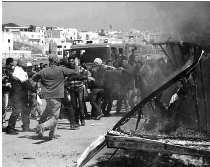
Menekültek Lampedusán. Az olaszoknak elégük van a rendbontásokból

még úgy nyilatkozott: reméli, az „erőtlen, nem választott” tunéziai kormány megtalálja a módját, hogy a rendőrség képes legyen ellenőrzése alá vonni a helyzetet, megakadályozva, hogy újabb menekültek keljenek útra. Az olasz miniszterelnökre – akinek a parlamentben szüksége van a bevándorlásellenes Északi Liga képviselőinek szavazataira – erőteljes nyomás nehezedik otthon, hogy vessen véget a menekültválságnak. Róma segítséget kért a többi nyugat-európai országtól, rámutatva, hogy a menekültáradat nem csak Olaszország gondja. A menekültek – zömmel munkanélküli fiatalok – Franciaországba vagy más országba akarnak továbbutazni Itáliából, oda, ahol a családtagjaik élnek, vagy ahol munkát vállalnának. ◀