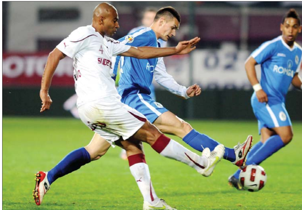
A vasárnap esti zárómérkőzésen a Rapid (fehér mez) 2-1-re nyert a Gaz Metan ellen

A 23. forduló eseményei közül említést érdemel a listavezető galaciak botlása, amelyet képtelen volt kihasználni a hazai közönsége előtt szereplő temesvári gárda. A bajnok CFR 1907 a kiesés elkerüléséért küzdő „pandúroktól” is kikapott, a Sportul pedig zsinórban nyolc vereség után tudott ismét nyerni, a Craiova ellen. Az Oțelul–Temesvár–Vaslui vidéki hármas megugrott fővárosi üldözőitől, s a Rapid, a Dina-