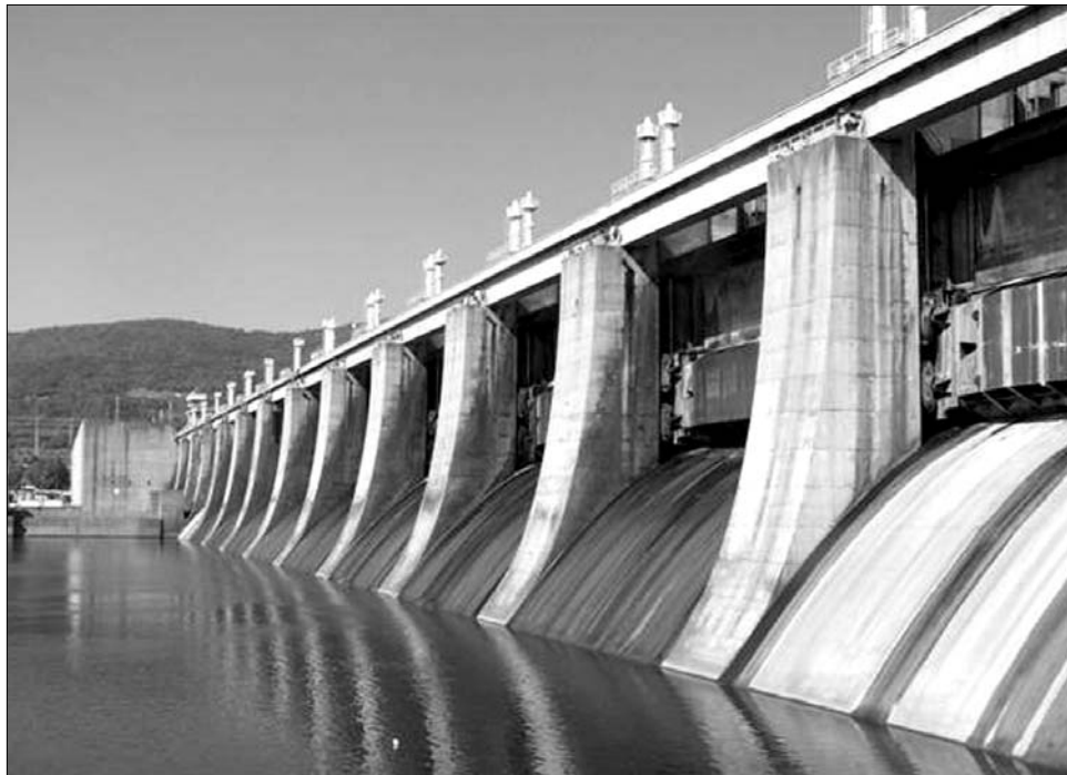
Bár Romániában a vízerőmű a legelterjedtebb megújuló erőforrás, még mindig sok csepp vész kárba

tudnának hozzájárulni a megvalósításhoz. Az építkezés már tavasz folyamán elkezdődik, s bár az önkormányzat szerint kedvező lesz a pályázat elbírálása, a csíkmadarasiak annyira el-tökélték, hogy ennek kudarc esetén is megépítik az erőművet, legfeljebb hitelek-ből fedeznék a költségeket. „Úgy vélem, hogy a japán atomerőmű katasztrófája