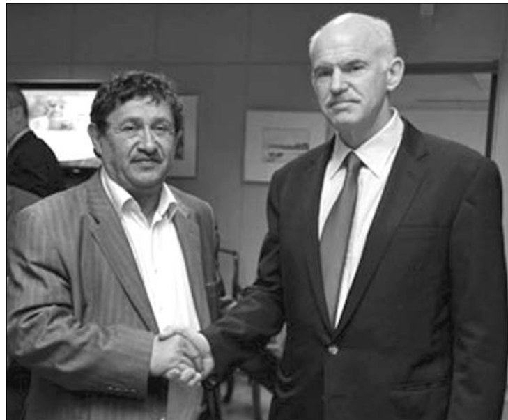
Abdelati Obeidi (balról) Athénban tárgyalt. Fogadta Papandreu kormányfő is

részén lévő Adzsdábijától nyugatra támadtak a felkelők, megpróbálva visszaszerezni azokat a területeket, amelyekről a Kadhafihoz hű erők kiszorították őket. A felkelők ugyanakkor hiányolják a hatékonyabb NATO-támogatást, az erőteljesebb légi csapásokat. Fegyveres felkelők megtámadták Törökország konzulátusát is a líbiai Bengáziban. Az NTV török tévéállomás beszámolója szerint négyszáz, fegyverekkel és késekkel felszerelt ember kísérelte meg a behatolást a képviselőre, tiltakozásul azért, mert Recep Tayyip Erdogan török kormányfő bejelentette, Ankara nem kíván fegyvert szállítani a líbiai felkelőknek. ◀