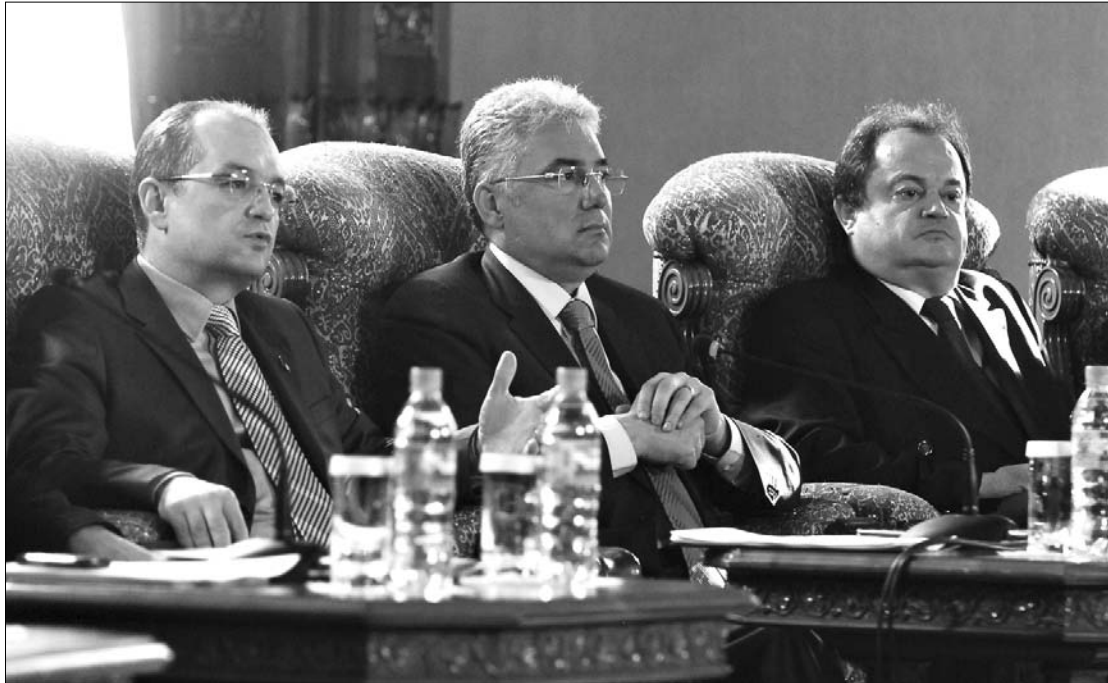
Emil Boc (balra) és Vasile Blaga (jobbra) között éles csata várható a PD-L elnöki tisztségéért

A PD-L-elnök hétfőn jelenti be indulását egy újabb mandátumért, programjának címe „Jobboldali csapat egy erős Romániáért” lesz. Boc zártkörű tanácskozáson ismertette híveivel terveit, szerinte a PD-L első számú prioritása a jövőre esedékes helyhatósági választások megnyerése, ennek érdekében az alakulat minden hivatalban levő polgármestertől elvárja, hogy új, a közösség érdekét szolgáló projekteket indítson el. ◀