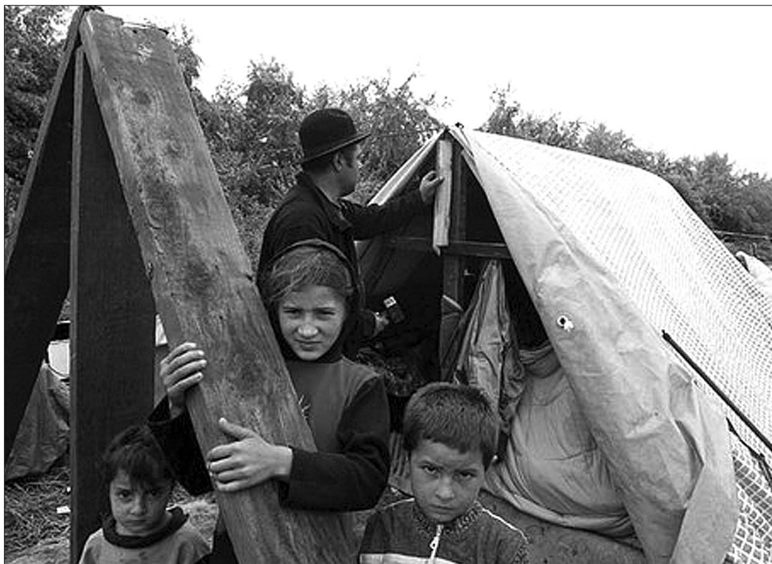
A cigánytábor az égbe megy. Gyerekenként száz eurót kapnak, hogy hazatérjenek Romániába

Az Európai Parlament egy hónapja már megszavazta Járóka Livia (Fidesz) e témához kapcsolódó jelentését, amely szerint az európai romák helyzetének javítása, a munkahelyhez, a lakhatáshoz, a minőségi oktatáshoz és az egészségügyi ellátáshoz fűződő jogok biztosítása csak akkor lehetséges, ha a tagállamok