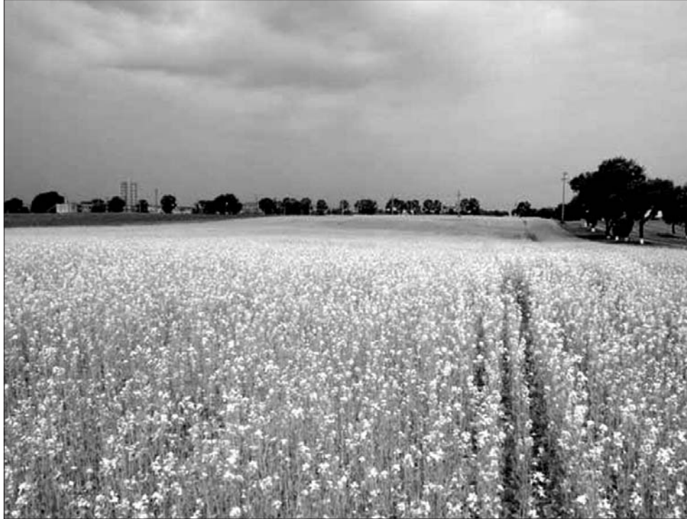
A kedvező felvásárlási árak köszönhetően néhol megduplázódott a repceföldek aránya

zéssel pontosan kimutatható, hogy ezeknek az anyagoknak több mint 60 százaléka bioetanol” – magyarázta Tímár. Elmondása szerint a bioüzemanyag 50 százalékos vegyítési arányban is használható, ebben az eset-