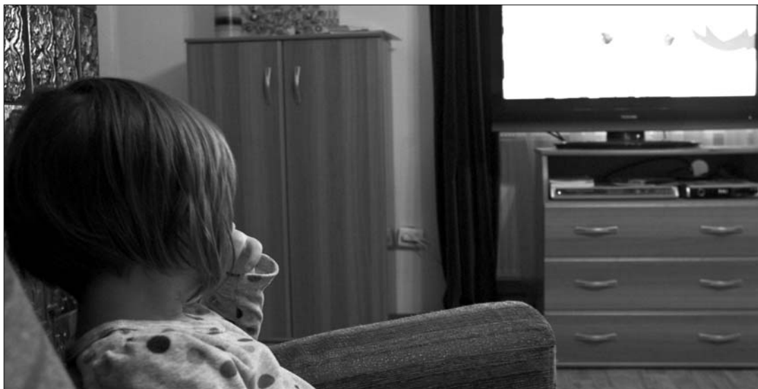
Az ország lakossága átlagosan évi 65 napot tölt a tévé előtt. A varázsdoboz a fiatalok körében is hódít

Európában a tévé előtt töltött idő tavaly 2009-hez képest 17 perccel nőtt Nagy-Britanniában és 11 perccel Németországban, az előbbiben 4 óra 2 percet, az utóbbiban 3 óra 43 percet tett ki. Franciaországban hét perccel nőtt a „nézésidő” és 3 óra 32 percet jelentett. A globális átlaghoz képest a románok egy óra 7 perccel töltöttek a tévékészülék előtt, a tévézésre fordított idő így eléri a 4 óra 17 percet, azaz az évi 65 napot. Bár a 2009-es