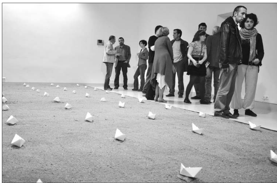
Irsai Zsolt, a „mester” élete utolsó éveiben szinte kizárólag csak installációkat készített