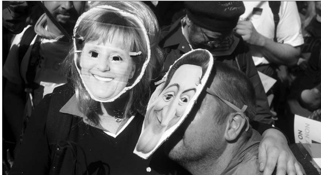
Az európai vezetőket szólították meg. Két tüntető Angela Merkel és Nicolas Sarkozyt jelképező álarcokkal