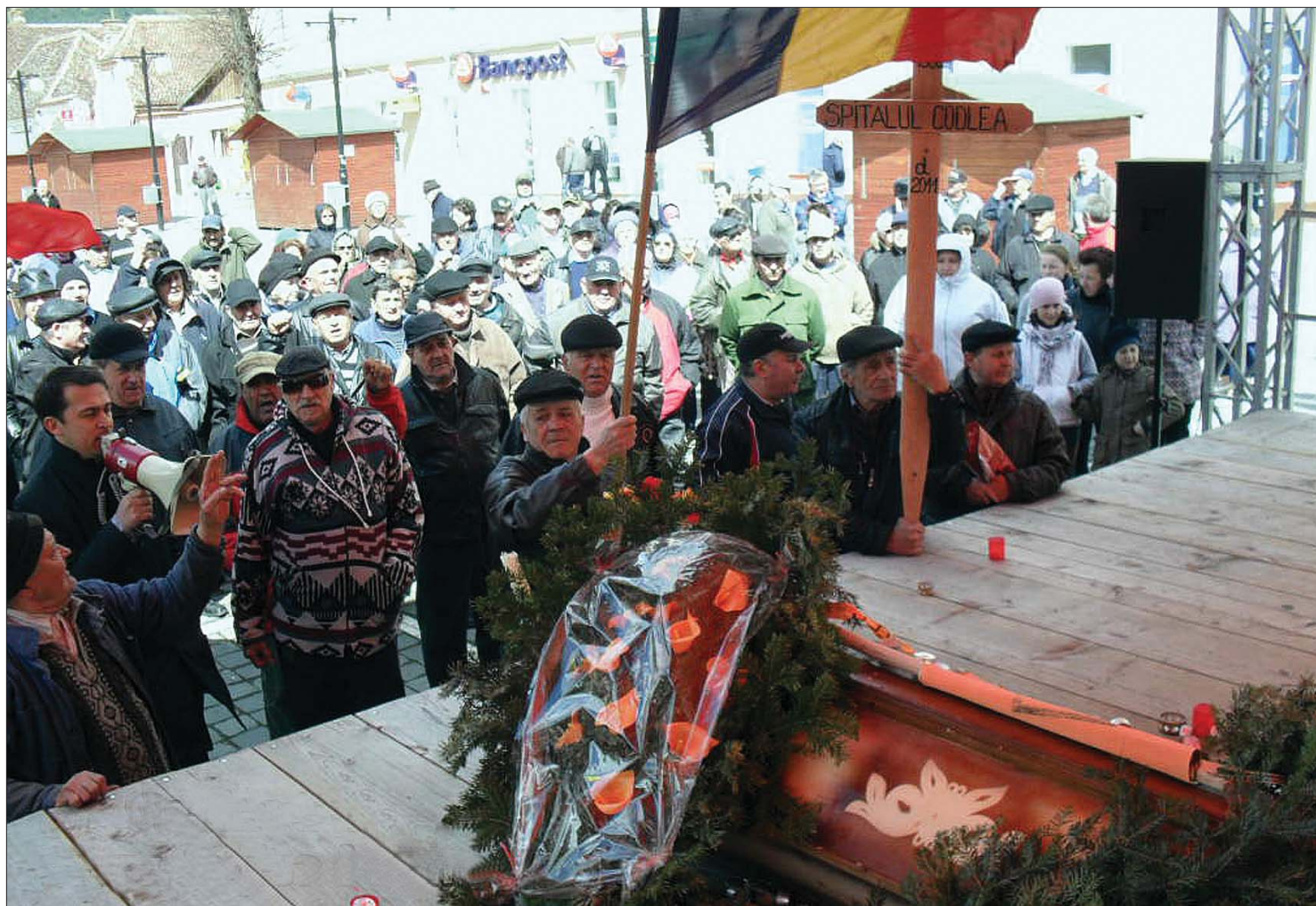
Ütlezárással tiltakoztak a helyi kis kórház bezárása miatt. A Brassó megyei Feketehalomban lezárták a DN1-es jelzésű főutat

Etnikai felhangot is kapott a kistelepülések egészségügyi intézményeinek bezárása