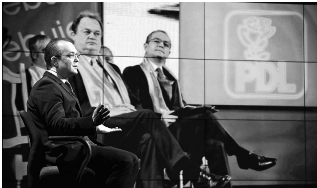
Emil Boc pártelnök (balra) „valódi” kihívója Vasile Blaga főtitkár lesz a PD-L május 14-i tisztújításán

szókimondóbb autonómiaellenes üzenetet fogalmazott meg Vasile Blaga, aki leszögezte, hogy alakulata még elméleti szinten sem tud egyetérteni azzal, hogy nemzeti-szemponyokat vegyenek figyelembe a fejlesztési régiók újrajrólásánál. A PD-L főtitkára ugyanakkor az ellenzék tudtára adta, hogy bár belső megmértetésre készül a párt jelenlegi elnöke ellen, soha nem fogja „Emilt kiadni Geoanának, Olgának (Vasilescu), Crinuţnak (Antonescu) vagy másnak”. „A székelyföldi románok szavazatait könnyűszerrel meg tudjuk szerezni, miért engednénk át őket másoknak? Magunk között barátok vagyunk, a többiek politikai ellenfeleink” – fogalmazott Blaga. ◀