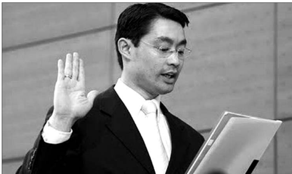
Philip Rösler miniszteri eskütétele közben. Valóban különbözik az átlagos némettől...

kormányában Hans-Dietrich Genscher, Gerhard Schröderben Joschka Fischer, az első Merkel-kabinetben pedig Frank-Walter Steinmeier töltötte be.) Amúgy a hétköznapi életben az alkancellárnak semmi hivatalos feladata nincs, a vonatkozó törvény szerint azonban üresedés vagy akadályoztatás esetén ellátja a kancellári teendőket. Ez történt 1974-ben: Brandt lemondását követően május 7-től kilenc napig Walter Scheel volt a megbízott kancellár is. Érdekes módon változik a közvélemény hangulata Németországban (is). A berlini kormány legnépszerűbb tagjának Karl Theodor zu Guttenberg bizonyult, maga is arisztokrata származású, rendkívül dekoratív felesége egyenesen Bismarck dédunokája; közkedvelt volt egészen addig, amíg ki nem derül róla, hogy doktori disszertációját az internetről – legyünk méltányosak – ollózták össze. A népszerűségi listán Philip Rösler vette át a helyét, mert bár a német egészségügy ugyanúgy gondokkal küszködik, ha nem is olyan súlyosakkal, mint a világ legtöbb országában (nálaunk is), rokonszenves és sze-