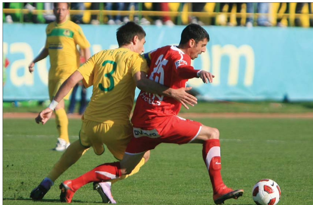
A Vaslui (sárga mez) újabb értékes három pontot szerzett a Dinamo elleni 2-0-ás győzelmével

három pontot szerzett a Dinamo elleni 2-0-ás győzelmével. A Galaci Oțelul sem hibázott, magabiztos 3-0-s sikert jegyzett a szebb napokat is megélt Urziceni otthonában. A Brassó 1-0-ra kikapott a vendég Besztercétől, míg a Kolozsvári Universitatea 2-2 arányú döntetlennel zárt hazai pályán a Medgyes ellen. Tegnap a Tg. Jiu-i Pandurii 4-2-re legyőzte a Brănești-et, míg a lapzártánkkor befejeződött Sportul Studentesc–Temesvár-találkozó 2-3-al végződött. A Marosvásárhely–Kolozsvári CFR- (18 óra) és a Rapid–Craiova-mérkőzések (20 óra) mára maradtak, s mivel a bukaresti vasutasok az elmúlt fordulóban 1-0-ra legyőzték a CFR-t, egy újabb sikerrel meglephetnek a Dinamótól. ◀