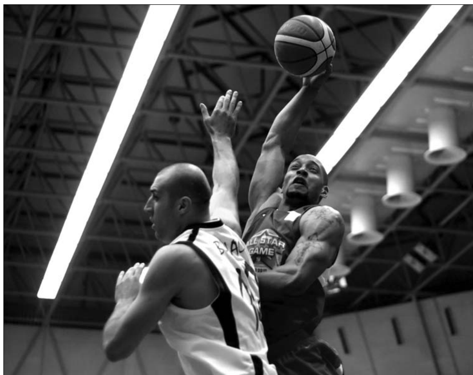
Észak Dél ellen. Az északiak (sötét mez) a tavalyi vereség után 121-118-ra győztek

A Medgyesi Gaz Metan férfi-kosárlabdacsapata nyerte meg az idej Román Kupát, miután a marosvásárhelyi négyes döntő fináléjában 71-61-re legyőzte a Steaút. A Szeben megyei együttes már tavaly is szerepelt a döntőben, ám akkor kikapott a Temesvári Elbától, most viszont megszerezte története első serlegét. Noha a találkozó első percekben meglépett bukaresti ellenfelétől, a találkozó tartogatott izgalmakat, hiszen a fővárosiak nemcsak ledolgozták hátrányukat, de a félidőben 37-33-ra vezettek. A harmadik negyed ennek megfelelően fej fej mellett, szoros csatát hozott, de az