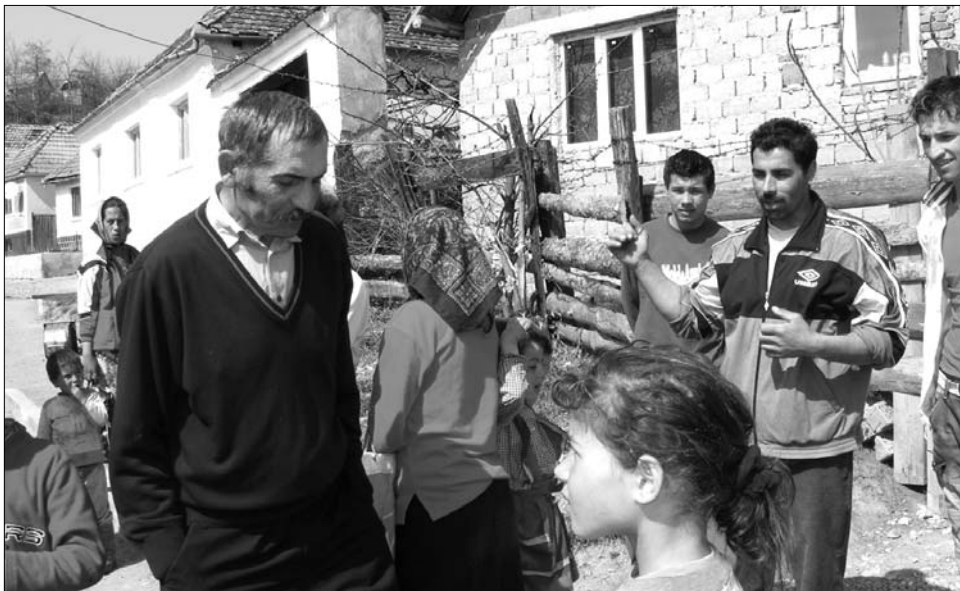
Az alsórákosai romák többsége a Brassó megyei község Borbáth-telep nevű részén él

A településen folyamatos a készültség. Pénteken este Gáspár Tamás polgármester háza előtt szólalt meg egy autóriasztó, a házban lévők a jelzésre kirohantak, ekkor négy ember megtámadta őket. A verekezés után néhány óra alatt lincshangulat alakult ki a faluban, amelynek lakosai villákkal, és bunnókkal felszerelve indultak el a romatelepe felé. A