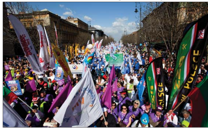
A budapesti Hősök téren 50 ezer szakszervezetis tüntetett

▶ Ötvenezeren is lehettek szombaton a budapesti Hősök téren annak a tüntetésnek a résztvevői, amelyen a megszorító intézkedések beszüntetésére szólították fel az európai vezetőket és a magyar kormányt a felvonulók. A demonstráción húsznál több külföldi és hat magyar szakszervezet képviseltette magát. 2. oldal ▶