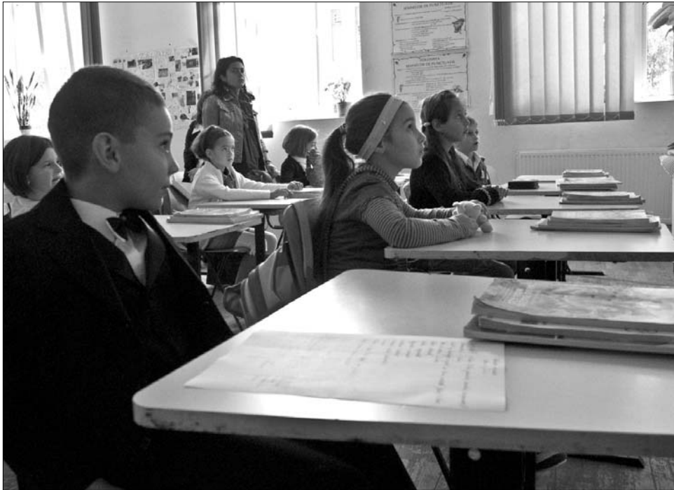
A kisebbségekhez tartozó diákoknak még egy tanévnit várniuk kell a változtatásokra.