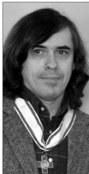
Mircea Cărtărescu

Mircea Cărtărescu tíz prózakötete közül már az ötödik – a Sárkányok enciklopédiája (2002) – jelenik meg magyarul. Olvasható tőle a Miért szeretjük a nőket? , a Sóvárgás , az Orbitor (Vakvilág) című trilogia első kötete, a bal szárny című. Valamennyit a Jelenkor Kiadó gondozta, a Lulut a Gondolat Kiadó jelentette meg 2004-ben. Emellett tíz verseskötete látott napvilágot, ebből a Levante című magyarul 1998-ban adták ki. ◀