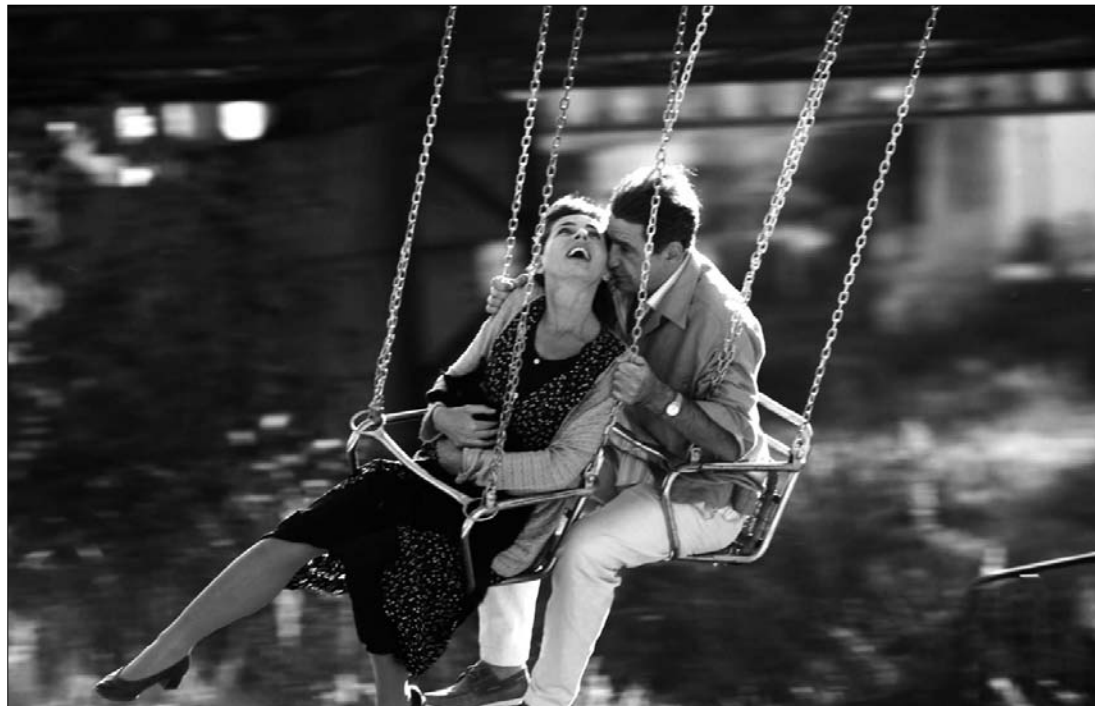
A Cirkus Columbia című dráma Divko, a volt partizán hercegovinai bosszúját meséli el a bukarestieknek