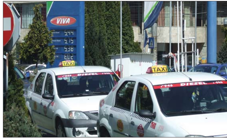
Ársokk. A benzinkutaknál megjelent a hatlejes üzemanyag

értéket. A dráguláshullámnak globális szinten sem látni a végét: valutaalapi elemzések szerint a benzin ára többé sosem vesz csökkenő irányt. 6. oldal