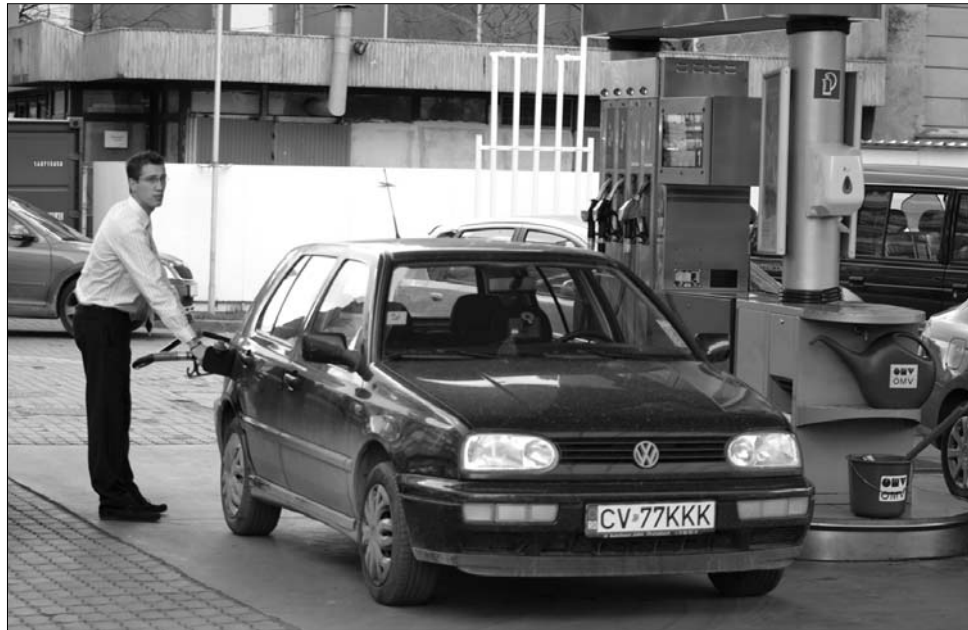
Kül- és belföldi tényezők egyaránt hozzájárulnak a „sokkterápiáért” a töltőállomásoknál.

Ezt cáfolni látszanak a szektor hivatalos adatai, amelyek szerint a töltőállomások eladása visszaesett ugyan, de csak a tavalyihoz hasonló öt százalékos mértékben. A gazdasági elemzők arra is figyelmeztetnek, hogy a dráguló üzemanyag meghúzóhatja az amúgy is „törékeny” gazdasági fellendülést. Lapunk éppen egy évvel ezelőtt annak kapcsán cikkezett a hazai üzemanyagpiacról, hogy a benzin ára átlépte az ötlejes küszöböt. Akkor Cristian Orgonaş gazdasági szakembert idéztük, aki szerint az elkövetkező években akár tízlejes benzinára is be rendezkedhetünk. ◀