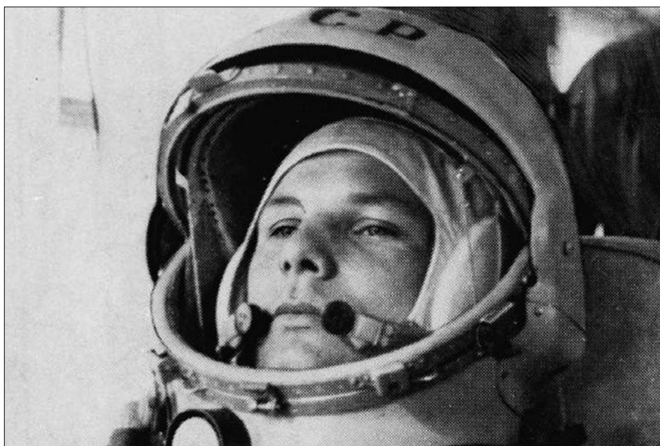
Ember a kozmoszban! Az első űrhajós: Jurij Alekszejevics Gagarin

Ekkor azonban a szovjetek egy lépéssel mindig előrébb jártak. Szenzációszám- ment 1957 szeptemberében az első sputnyik, azaz műhold, majd a legelső élőlény, amely világhírnévre vergődött: Lajka kutya, amelynek szomorú sorsáról (miután befejezte küldetését, a légkörbe belépve űrkapszulájával együtt elégett) annak idején nem számolt be a sajtó. A történelem első „páros űrutazása” már szerencsés véget ért: Bjelka és Sztrelka már szerencsésen visszatérhetett a Földre. A szovjetek összesen 43 kutyával végeztek űrkísérleteket, mielőtt elérkezettnek látták