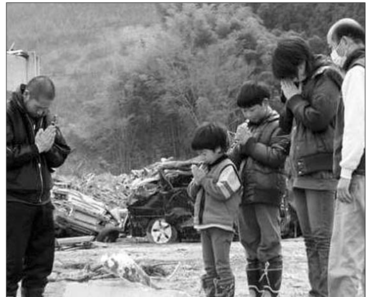
Japánban a földrengés áldozataira emlékeznek. Ismét kiűritették az erőművet

zatként elmondta, hogy ugyan nagymértékben csökkent egy nagyobb, újabb radioaktív szivárgás kockázata a megsérült atomerőműben, de a csekély mértékű sugárzás hosszabb távon káros lehet. A tokiói kormányzat mostantól kitelepíti azokat a lakosokat, akiket évi 20 millisievertnyi sugárterhelés ér. A Greenpeace nemzetközi környezetvédő szervezet korábban saját mérései alapján követelte, hogy a japán kormány számottevően bővítsse ki az érintett övezet határát. A Greenpeace szerint a mért szintek elég magasak ahhoz, hogy az ott élők a még elfogadható maximális éves sugárzási dózist hetek alatt megkapják. ◀