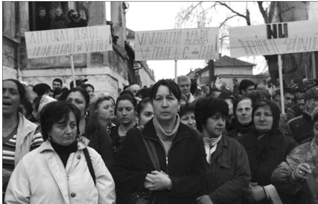
Kórházakat féltik a bufteaiak. Cseke Attila miniszter az utóbbi napok tüntetéseire reagált

„Az RMDSZ szerint az egészségügyi rendszer reformja szükséges a romániai társadalom számára, ezért egyértelműen támogatja Cseke Attila miniszter tevékenységét” – szögezi le az állásfoglalás. ◀