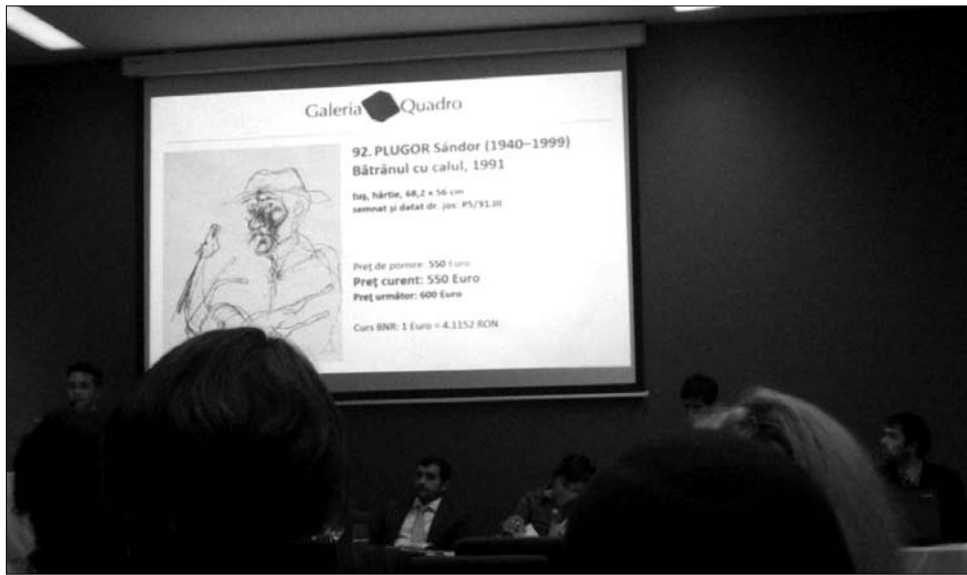
Kisebbségi árakat fizettek, de többen vásároltak a Quadro Galéria tavaszi aukcióján mint tavaly

Az előkelő City Plaza Hotelben tartott árverésen az elsőként kínált kép Slevenszky Lajos olajfestménye volt, a Gyümölcsös kert tavasszal Nagy-bányán. A vásárlás azonban csak később indult be: a tizedikként behozott Anton Lazăr-festmény, a Tengeri látkép kelt el először, illetve a tizennegyedik képre, a kolozsvári Teodor Harșia Csendélet almákkal című munkájára kezdtek licitálni. A megajánlott árak szempontjából legnépszerűbbnek bizonyuló mű, amelyet végül a kikiáltási ár több mint kétszereséért adtak el, Bene József Macskák című grafikája volt.