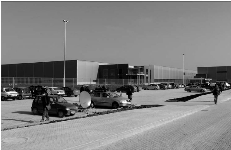
A multinacionális vállalatok jelentősen hozzájárulnak a megyék mutatóinak „kozmetikázásához”

„A Közép-erdélyi megyéknek a határmentiekhez viszonyított gyorsabb fejlődése ellentmondásosnak tűnik annak a közgazdasági elemletnek a fényében, miszerint Nyugat-Európából a kontinens közép-keleti része