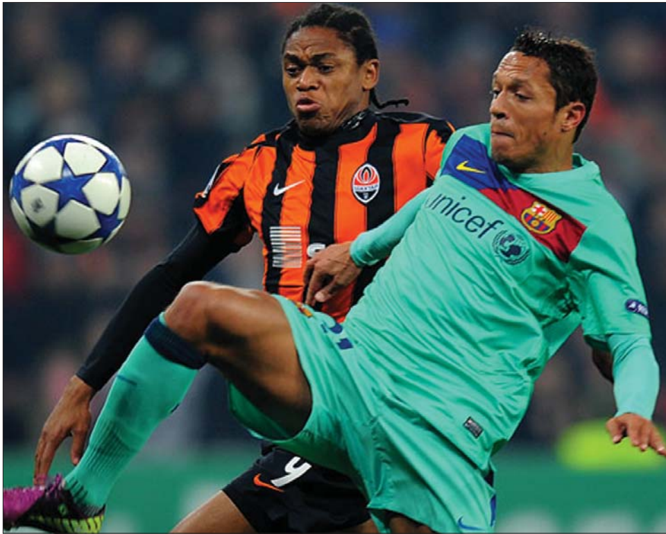
A katalán sztárok (zöld mezben) Donyeckben csak annyira bővítették a labdát, amennyire kellett

Továbbjutásával a Manchester United rendkívül eredményes idényzárásnak néz elébe, hiszen a BL-éldöntő mellett ott van a legjobb négy között az angol FA Kupában is, a Premier League-ben pedig hovatovább biztosnak látszik a bajnoki cím, akkora előnnyel áll az élen a gárda. Ugyanakkor a Chelsea háza táján okkal le-