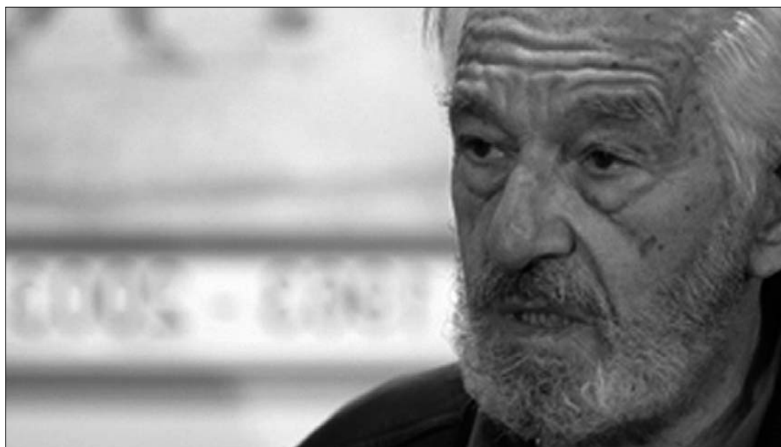
A tegnap 81. életévét töltő Sergiu Nicolaescu még két filmet rendezne visszavonulása előtt

► „Még van két elkészítetlen filmem. Csak ha azokkal megvagyok, akkor mondhatom azt, hogy bevégeztem” – nyilatkozta a Mediafax -nak Sergiu Nicolaescu. A neves filmrendező tegnap töltötte 81. életévét. Bevégezten filmjei közül az egyik a Hogyertya (Candele de západá) , amelyet kizárólag Romániában forgat és a tervek szerint az év második felében kerül mozikba. „A másik filmtervemről még én sem tudok sokat, egyelőre annyi biztos, hogy egy jelenben játszódó komédia lesz” – fogalmazott sejtelmesen a rendező. „Minden de és lehet nélkül válságban vagyunk. És nem csupán gazdaságban. Romániát teljességgel újjá kell változtatni. Kegyetlen erőfeszítésekre lesz szükség, de meg kell tennünk” – véli az Adevărul című napilapnak nyilatkozó rendező. A zsilvásárhelyi születésű, gépészmérnöknek tanult Nicolaescu rövidfilmjeivel robbant be a mozgóképes világba. 1967-ben