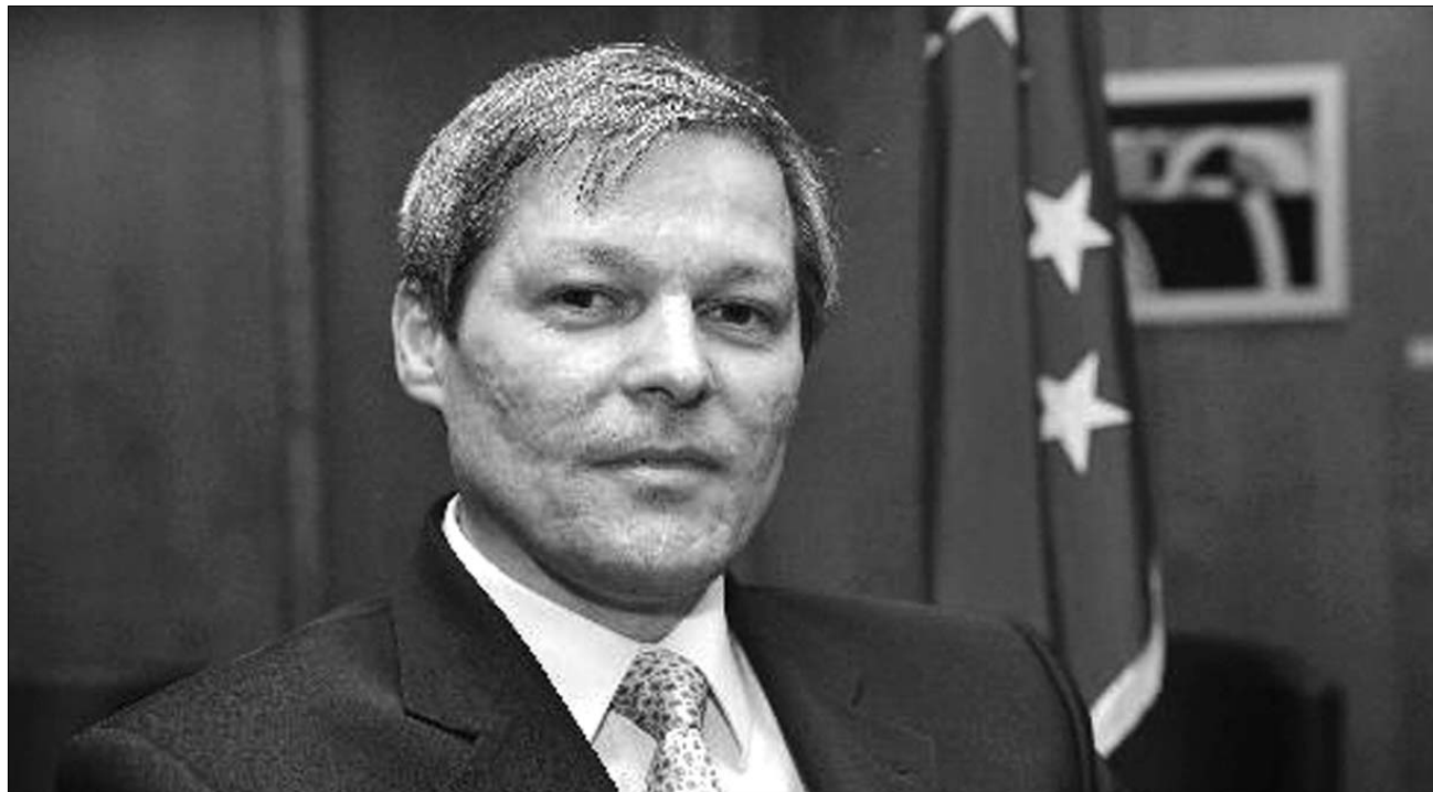
Dacian Cioloș, az Európai Bizottság romániai mezőgazdasági és vidékfejlesztési biztosa

Az európai alapok lehívása rendkívül fontos, elsősorban gazdaságélénkítő hatásuk miatt. Olyan körülmények között, amikor Románia bruttó nemzeti összterméke 120 milliárd euró, csupán évi 3–4 milliárd eurónyi uniós pénz felvétele évi 1,5–2,5 százalékos gazdasági gyarapodással járhat. Romániának ezekre a pénzekre már csak azért is rendkívül nagy szüksége lenne, mivel az ország évente bruttó nemzeti össztermék mintegy 1 százalékkal járul hozzá az Európai Unió költségvetéséhez, a jelenlegi pénzfelvételel így nettó befizetőjévé válhat az európai közösségnek, amint az a 2007–2009. közötti időszakban is történt. Ráadásul ezeket az összegeket nem kell visszafizetni, térítésmentes támogatásról van szó, fel nem használásuk tehát tiszta veszteségnek számít az ország számára. ◀