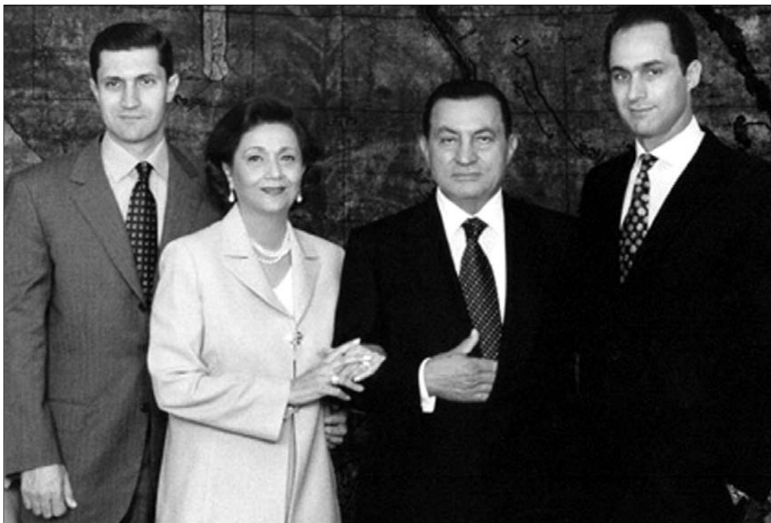
A Mubarak család tagjai. Az ügyészek kihallgatták a megbuktatott egyiptomi államfő mindkét fiát

mi igazságszolgáltatás bejelentette a volt elnök és két fia, Gamál és Alaa berendelését. Manszúr el-Iszávi belügyminiszter közölte, hogy amennyiben a felszólításnak nem tesznek eleget, akár le is tartóztathatják őket, bár a bírói meghallgatás még nem jelenti automatikusan azt, hogy pert indítanak Mubarak ellen. Az ügyészek kihallgatták Hoszni Mubarak megbuktatott államfő mindkét fiát – jelentették be kedden egyiptomi igazságügyi források. Alaa és Gamál Mubarakot hűtlen kezeléssel vádolják. A közvélemény szemében azonban olyannyira ellenszenvesek, hogy kedden tüntető tömeg követelte a két Mubarak-fiú felakasztását. ◀