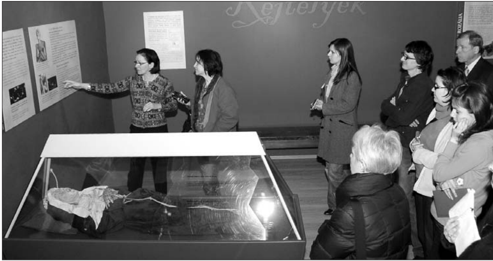
A csíki muzeológusok először a sajtó képviselőit avatták be a múmiák titkaiba

A leletegyüttes felfedezése egy szerencsés véletlennek köszönhető, hangzott el a kiállítás megnyitóján: a magyarországi Vácon 1994-ben, a domonkos rendi Fehérek templomának felújítása során egy 1729–1731 között épített kriptára bukkantak, amely közel másfél évszázadon keresztül szolgált temetkezési helyként. A lejáratot 1838-ban befalazták és hamarosan a kriptá létezése is feledésbe merült, majd annak kibontása után 265, gazdagon díszített és teljesen ép koporsóra bukkantak, amelyekben a holttestek – korabeli egyházi- és világi személyek földi maradványai – természetes úton mumifikálódtak. A leletegyüttes a Magyar Természettudományi Múzeum Embertani Tárába