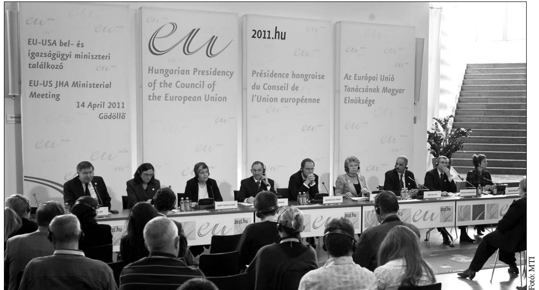
Az Európai Unió és Amerika belügyminiszterei Gödöllőn. A személyes adatok védelme mindkét fél számára fontos

Az EU és az Egyesült Államok egyetért abban, hogy előrelépésre van szükség a bel- és igazságügyi együttműködésükben, különösen a személyes adatok védelmével kapcsolatban – mondta Viviane Reding, az Európai Bizottság alelnöke, uniós biztos tegnap Gödöllőn. A jogérvényesítésért, alapvető jogokért és uniós polgárságért felelős biztos az amerikai–uniós bel- és igazságügyi miniszteri talál-