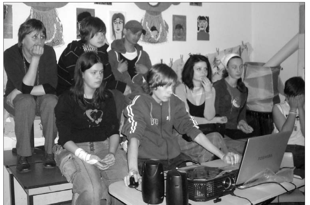
A filmkészítés folyamata jó alkalmakat nyújtott arra, hogy saját magukról is beszéljenek a fiatalok