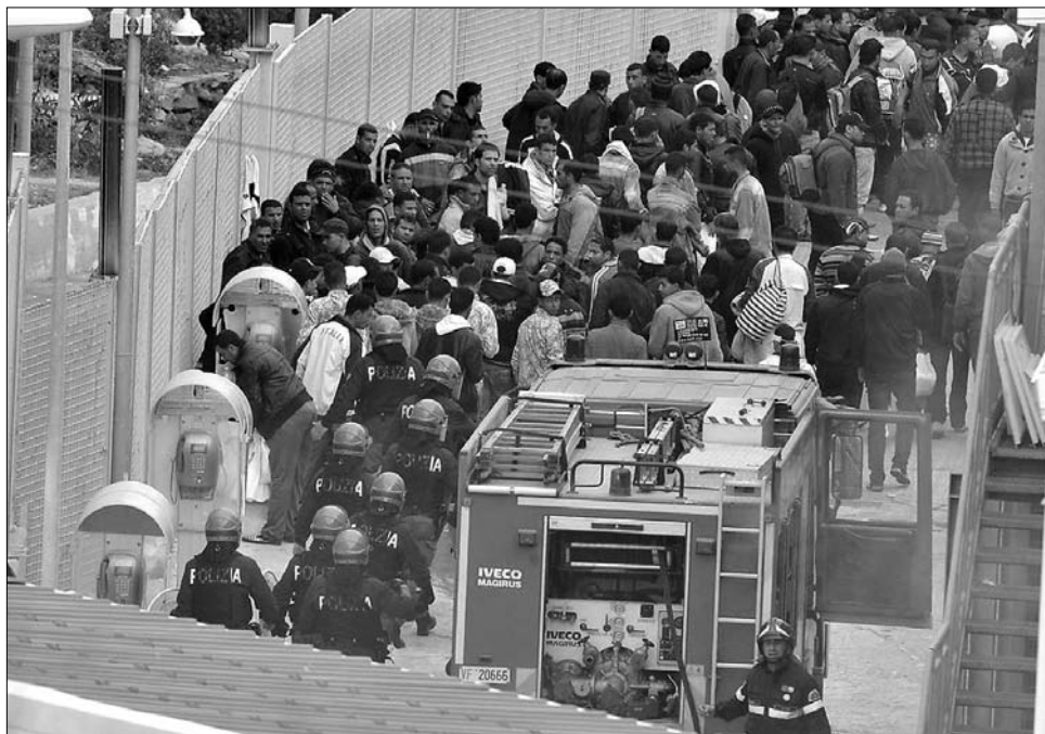
Pillanatkép a lampedusai menekülttáborból: előzönlötték Európát az észak-afrikaiak

Róma kétségkívül kelepcebé került, mivel valamilyen formában kezelnie kell a Lampedusán kialakult helyzetet. A sziget, amely Itália partjaitól a Földközi-tengerben, Málta és Tunézia között, Szicíliától 205, a tunéziai partoktól 113, Máltától 140 kilométernyire fekszik, tulajdonképpen az Európai Uniónak a Tunéziához legközelebb eső pontja, így az észak-afrikai országban bekövetkezett drámai események hatására tömegek vágta neki a tengernek, hogy életüket kockáztatva, apró kis lélekvesztőkön átkelve keressenek menedéket. Mára tízezer fölé duzzadt a számuk azoknak, akik partot is értek vagy az olasz hatóság-