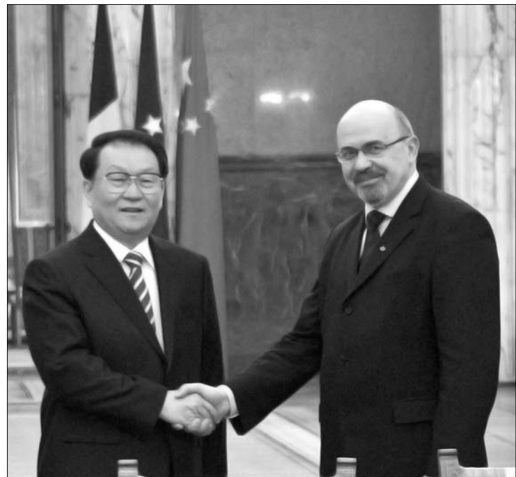
Markó Béla kormányfőhelyettes fogadta a kínai vendéget

könyvek, kiadványok révén. Korábban Emil Boc kormányfő nyilvános felhívással fordult a kínai befektetőkhez, hogy vegyék ki részüket az országban tervezett infrastruktúrális fejlesztésekből. A miniszterelnök konkrétan megemlítette a forráshiány miatt elakadt autópálya-építési projekteket, tudva, hogy a kínai befektetők a régióban számos hasonló infrastruktúrális tervhez biztosítottak anyagi fedezetet. ◀