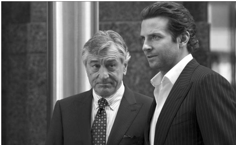
A Csúcschatás – a címmel ellentétben – nem a film egészére, legfeljebb a színészek játékára jellemző, ez menti valamennyire az alkotást

A mozgóképes alkotás alapsztorija Glynn könyvét idézi (amelyet a film premierje alkalmából közel egytucat nyelvre fordítottak le). Főhősünk ezúttal is a csóró író, aki itt Eddie Morra névre hallgat. A Matrix hőseivel ellentétben azonban nem választhat a kék és piros kapszula közül – neki ugyanis csak egyetlenegy átlátszó bogyót, úgynevezett NZT-t kínál fel ex-sógora, mondván: az segít a dolgok mögé látni. A „designer drog” kategóriájába tartozó szer másodpercek alatt felpörgeti az író, aki agyát százszázalékos kapacitással használja, előjönnek rejtett képességei, kitér előtte a tér, és pár óra alatt megírja azt a könyvet, amellyel már évek óta nyögvenyelősen bajlódik. A csodadroggal – amellyel, hogy nem tesztel-