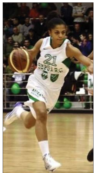
Lendületben a Seps BC

Az 9–16. csoport első eredményei: CS Otopeni–Brassói CSU Cuadripol 85-57, Energia Rovinari–Politehnica Iași 86-90, Temesvári BC–Csík-szeredai Hargita Gyöngye BC 88-58, Buk. CS Municipal–SCM U Craiova 92-86. A tegnapi visszavágók közül is csak kettő ért véget lapzártáig: CS Otopeni–Brassó 78-63, CS Municipal–Craiova 111-92. A sorozatok harmadik mérkőzéseinek Brassó, Iași, Csík-szereda és Craiova ad otthont hétfőn. ◀