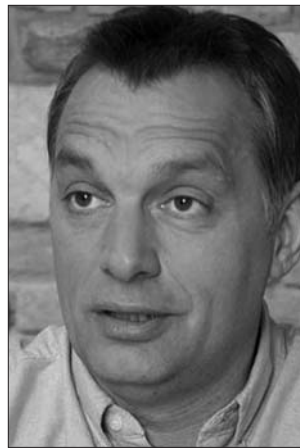
Orbán Viktor – bebetonozva

A szabadságjogi alapú, liberális demokrata alapvetés helyébe a tekintélyelvű-nacionalista-konzervatív elkötelezettség lép. Ennek nemcsak az a következménye, hogy az államapparátusban és a köztisztviselői-köznevelési karban a mostaninál is erőteljesebbé válik a kontraszelekció, hanem az életviszonyainkat alakító közpolitikai alternatívák köréből is kizáródnak azok a javaslatok, amelyek nem kompatibilisek az új rend ideológiai arcúlatával. A döntési alternatívák beszűkülnek, a hozzáértés háttérbe szorul. A csak a kine-