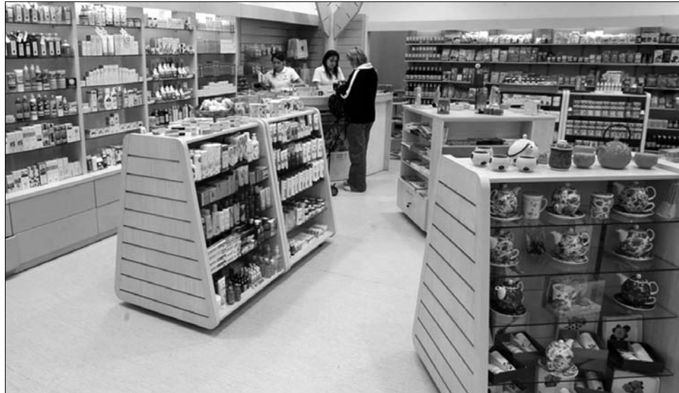
Lekerülhetnek a polcokról a gyógynövényekből készült görcsoldók, köhögéscsillapítók, hashajtók