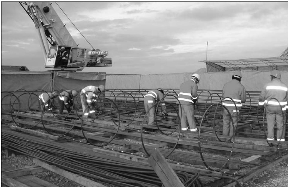
Hét év alatt sem készült el. Pénzhiány hátráltatja az észak-erdélyi autópályája megépítését

▶ Az észak-erdélyi autópályája átadási ütemtervének változtatásáról tárgyal a kormány az építést végző Bechtel társasággal, miután bebizonyosodott, hogy az eredetileg megcélzott jövő decemberi időpont nem tartható – értesült hivatalos forrásokból a Mediafax . A hírügynökségnek nyilatkozó illetékesek szerint a határidő kitolását elsősorban az indokolja, hogy a költségvetési megszorítások és a munkálatok kifizetésének tavalyi késlekedése miatt az amerikai vállalat kénytelen volt lassítani a munkafolyamatot. A megrendelők – a szállítási ügyi minisztérium, illetve az Országos Út- és Autópályatársaság – most arról tárgyalnak, hogyan törlesszék az építéssel szemben felhalmozott tartozásokat, ugyanakkor elemzik, hogyan illesz-