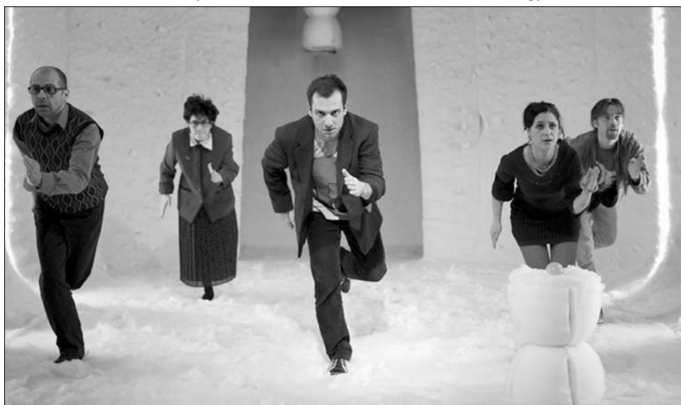
A Woody Allen nyomán készült Mellékhátások című előadást öt városban mutatják be

mint nagyon fontosak a barátaim. Érdekel a fiatalság sorsa, a jövő, amit ma teremtünk számukra. Fontosnak tartom a felelősségteljes nevelést, a környezettudatosságot” – nyilatkozta korábban a Transindex -nek adott interjújában a díjnyertes, aki azt is elmondta, hogy az egyetem éveiben több versenyre is benevezett a barátaival, így hát gondolta, veszíteni valója nincs, itt az alkalom, hogy kipróbálhassa magát. ◀