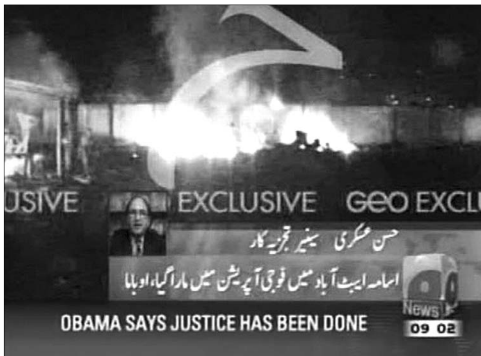
Lángokban a ház, amelyben Oszama bin Laden élete utolsó perceit töltötte

Abbotábád a pakisztáni fővárostól, Iszlámábádtól 50 kilométerrel, északkeletre helyezkedik el, fél napi autóra az afgán határvidéktől. A város 1260 méteres magasságban fekszik egy hegyek által övezett völgyben. Sokan furcsának találják, hogy a helyi katonai akadémiától alig száz méterre magasodó városos erőd senkinek sem keltette fel a figyelmét. Biztonságpolitikai szakértők szerint Oszama bin Laden halála nagy veszteség az al-Kaida számára, mert „egyik ideológusát, fő jelképét, vezéregyéniségét veszítette el a terror-szervezet, de csak a hidra fejét sikerült levágni”. Hozzáteszik: az utóbbi években Oszama bin Laden szellemi vezér volt, inkább jelképes, mint közvetlen irányító szerepet játszott, bár a kettő nem zárja ki egymást. Oszama bin Ladenhez mint természetes jelképhez a fanatikusok erősen kötődnek, így visszavágási kísérletekre lehet számítani.