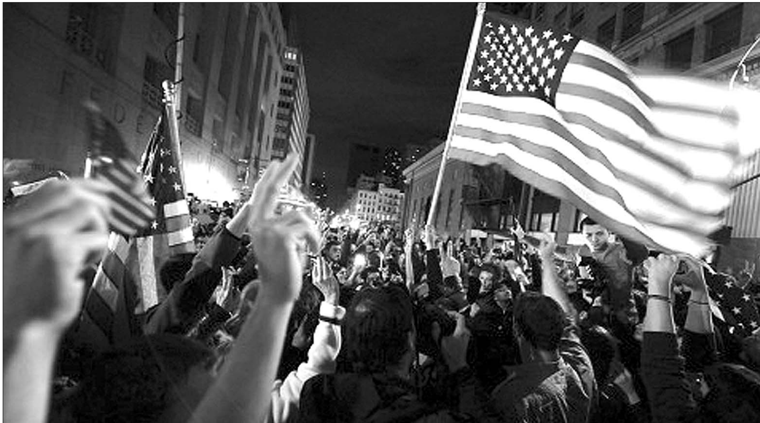
Örömmünne a New York-i Ground Zeronál. Amerika-szerte üdvözlötték az első számú közellenség halálhírét, az iszlám világ azonban felháborodott

2001. szeptember 11-én az al-Kaida által a New York-i Világkereskedelmi Központ ikertornyai ellen elkövetett merénylettel vált mindenki számára ismertté.) Megnyilatkoztak vezető politikusok is Angela Merkel német kancellártól Nicolas Sarkozy francia elnöktől és David Cameron brit kormányfőig, Hillary Clinton amerikai külügyminisztertől az Európai Unió vezetőiig, és mindannyian a terrorizmusellenes küzdelem fényes napjaként értékelték a történetet. Ugyanakkor felhívták a figyelmet arra, hogy a veszély nem hárult el teljesen, mert fel kell készülni az iszlám világ esetleges bosszújára. ◀