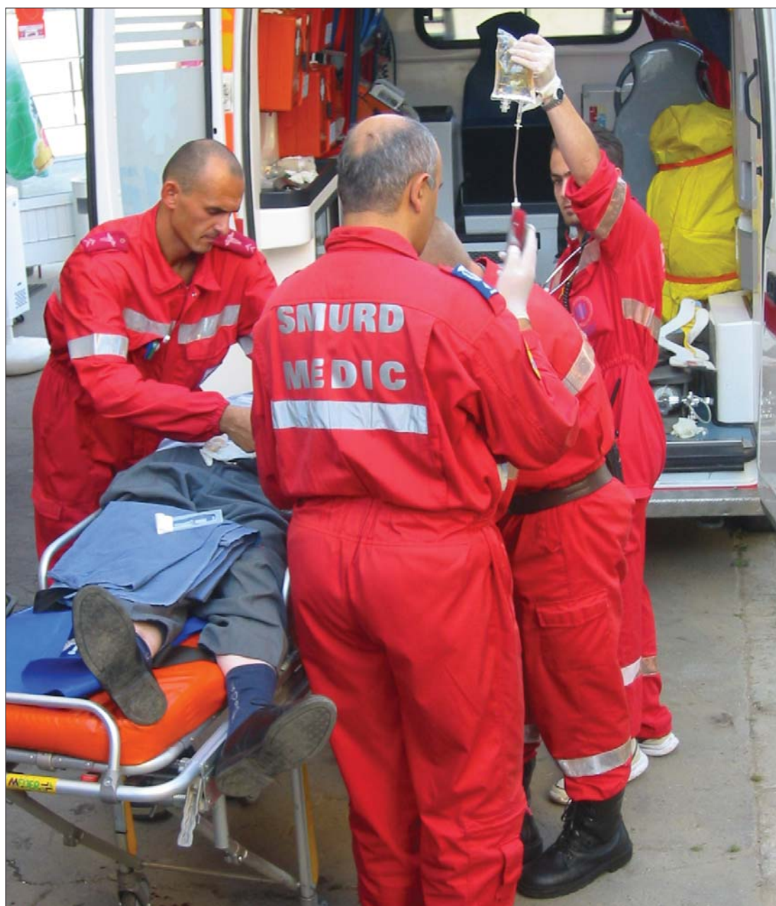
Hargita megye hátrányos helyzetben van, mert a térség viszonylag jelentős része gyéren lakott