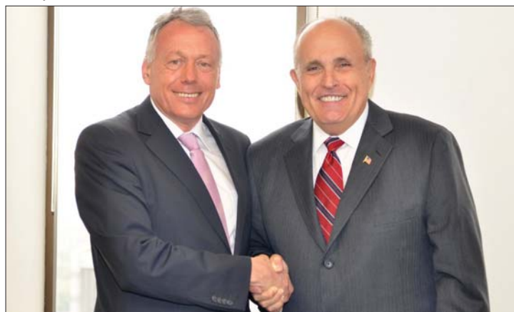
New York volt polgármesterével találkozott a környezetvédelmi miniszter

miniszter tanácskozott Rudolph Giuliani volt New York-i polgármesterrel, elsősorban arról, hogy miként lehet a metropolis tapasztalatait Romániában is alkalmazni. 2. oldal ▶