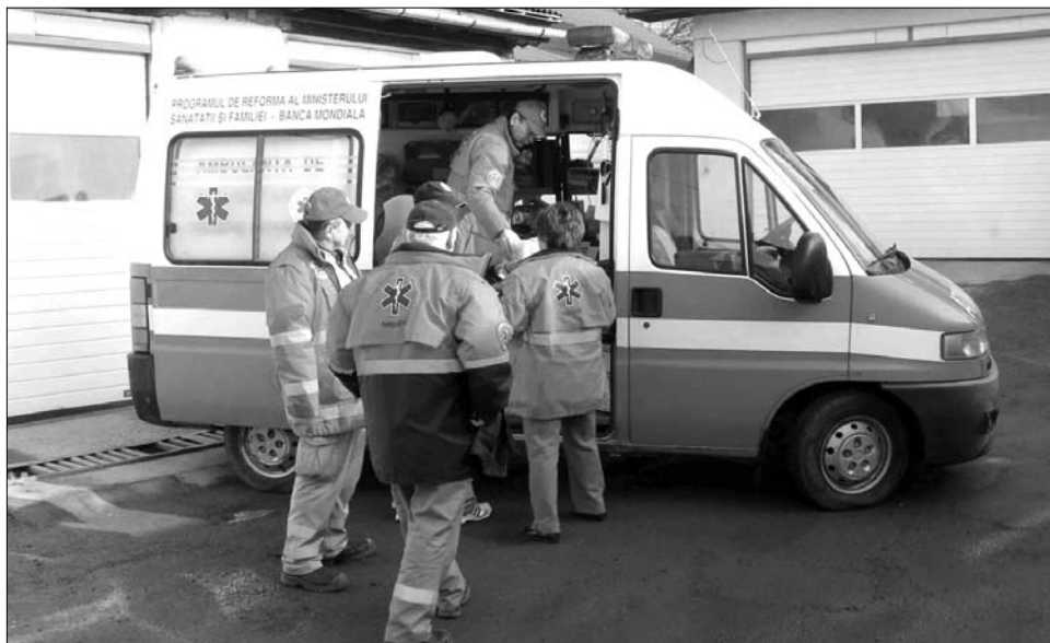
Székelőföldet sújtaná a mentőszolgálatok finanszírozására vonatkozó minisztériumi terv Fotó: ÚMSZ/archív

Az aránytalanságok felszámolása érdekében a tervek