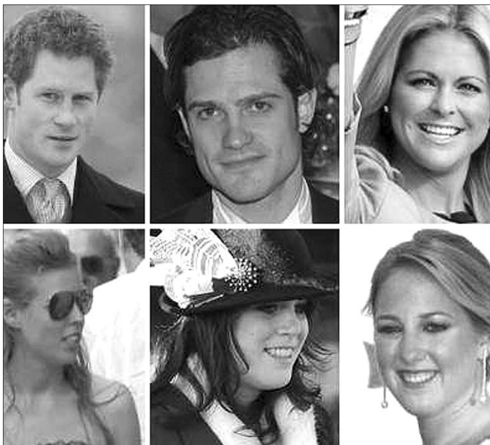
Gazdagok és kaposak. Harry herceg, Károly Fülöp, Madeleine, Beatrix, Eugénia, valamint Teodóra

Az „esküvői piacon” Vilmos és Albert mellett is még sokan számítanak facérnak, és nemcsak hercegekre, királyfiakra várnak, hogy hófehér paripájukon meghódítsák a női szíveket: megannyi kékvérű leányzó is szeretné végre levetni a pártát, hogy kössék be a fejét. Nagy-Britanniában itt van mindjárt a huszonhat esztendő Mounbatten-Windsor Henrik, alias Harry, akit – elsősorban szinglisége és származása miatt – a szigetország legattraktívabb fiatal emberének tartanak. A népszerű Harryt máris összeboronálta (pontosabban összebörönlé) a sógornője felülően mutató hűgával, aki végtére is bekerült a királyi családba, tehát már az ő vére is kezd kékülni. Csak annyi hibádzik, hogy mindkettőn már komolyan elkötelezték.