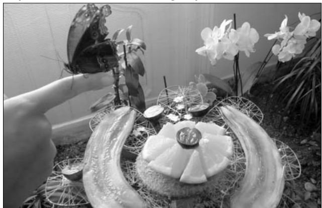
A trópusi lepkék néha „megsimogatják” a látogatót

A különleges természetudományi tárlatot a Vulticulus Földrajzi Társaság hozta el Udvarhelyre, ahol élőben lehet megtekinteni az Afrikából, Dél-Amerikából és Ázsiából származó lepkébábokat és azok kibontakozását. A Trópusi Lepkeház a múzeum egyik időszakos termében kapott helyet, s bár a helyiség kialakítása nem kis munkával járt, a szervezőknek sikerült a lepkék eredeti életterének egy kis darabját idevarázsolni.