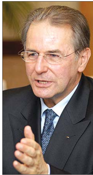
Jacques Rogge, a NOB elnöke

érintett kormányok és tag-szövetségek feladata ennek garantálása” – fogalmazott az elnök. ◀