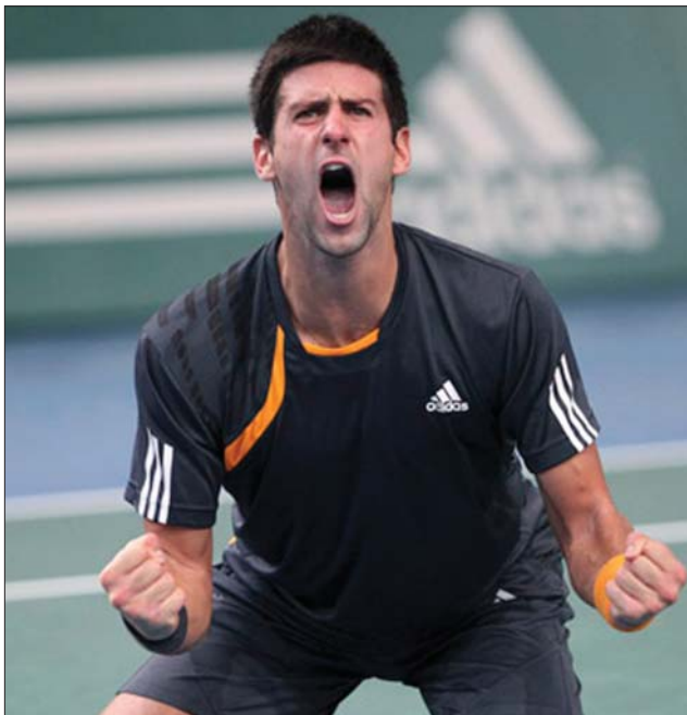
Novak Djokovic idén mind a harminckett meccsét megnyerte

zé. Jelenleg Nadalnak 12.470, Djokovicnak pedig 10.665 pontja van a világrangsorban, mindketten elhúztak az egykori világszám 1-es svájci Roger Federertől (8900 pont).