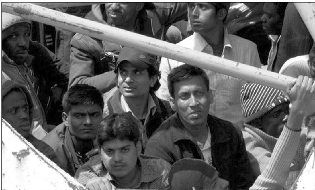
Akiknek sikerült eljutni Lampedusára. A tömegesen menekülők óriási veszélynek teszik ki magukat a tengeren

Három holttestet emeltek ki a búvárok annak a hajónak a roncsa alól, amely vasárnapra virradó éjjel sziklának ütközött az olaszországi Lampedusa szigetének a közelében, több száz bevándorlóval a fedélzetén – közölte a kikötői kapitányság. A bal eset után sokan – köztük nők és gyermekek – a tengerbe vetették magukat, de a parti őrség vasárnap még arról számolt be, hogy a hatóságok gyors akciójának köszönhetően „mindenkit sikerült kiemelni a vízből”. A kimentett 528 utas többsége Afrikának a Szaharától délre eső olyan országaiból és Ázsiából származó bevándorló volt, aki a legutóbbi időkhöz Líbiában dolgozott és a családja is ott élt. ◀