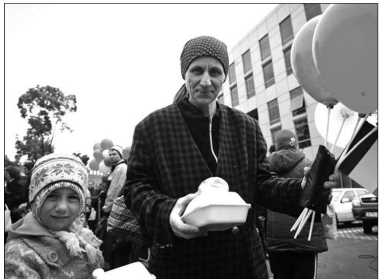
Kisik és nagyok egyaránt örültek az „európai” töltött káposztának

és kötelessége hozzájárulni a közös európai identitás kialakításához”. Emil Boc miniszterelnök arra hívta fel a figyelmet, hogy Románia európai integrációja még nem teljes, hiszen a román állampolgárokkal szemben továbbra is több ország munkaügyi korlátozásokat alkalmaz. „Ugyanakkor mindent megteszünk annak érdekében is, hogy még az idén csatlakozhassunk a Schengen övezetbe. Az európai szolidaritás jegyében készen állunk arra, hogy megvédjük az Unió külső határait” – üzent a többi tagországnak Emil Boc. ◀