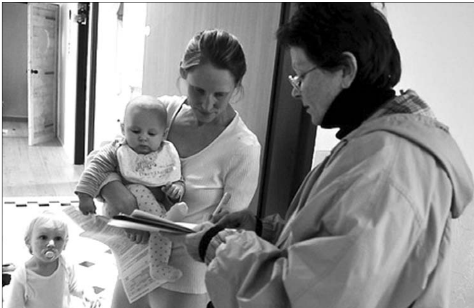
Ezen a héten kérdezőbiztosok járnak a családokat a főpróbára kizemelt településeken