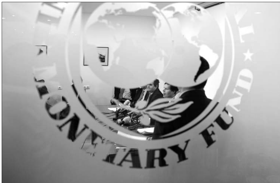
Tébėjárlékos csiki-csuki: az IMF hallani sem akar a kormány által dédelgetett csökkentésről

A valutaalap ismételten „feladta a leckét” a Román Nemzeti Banknak (BNR) is,