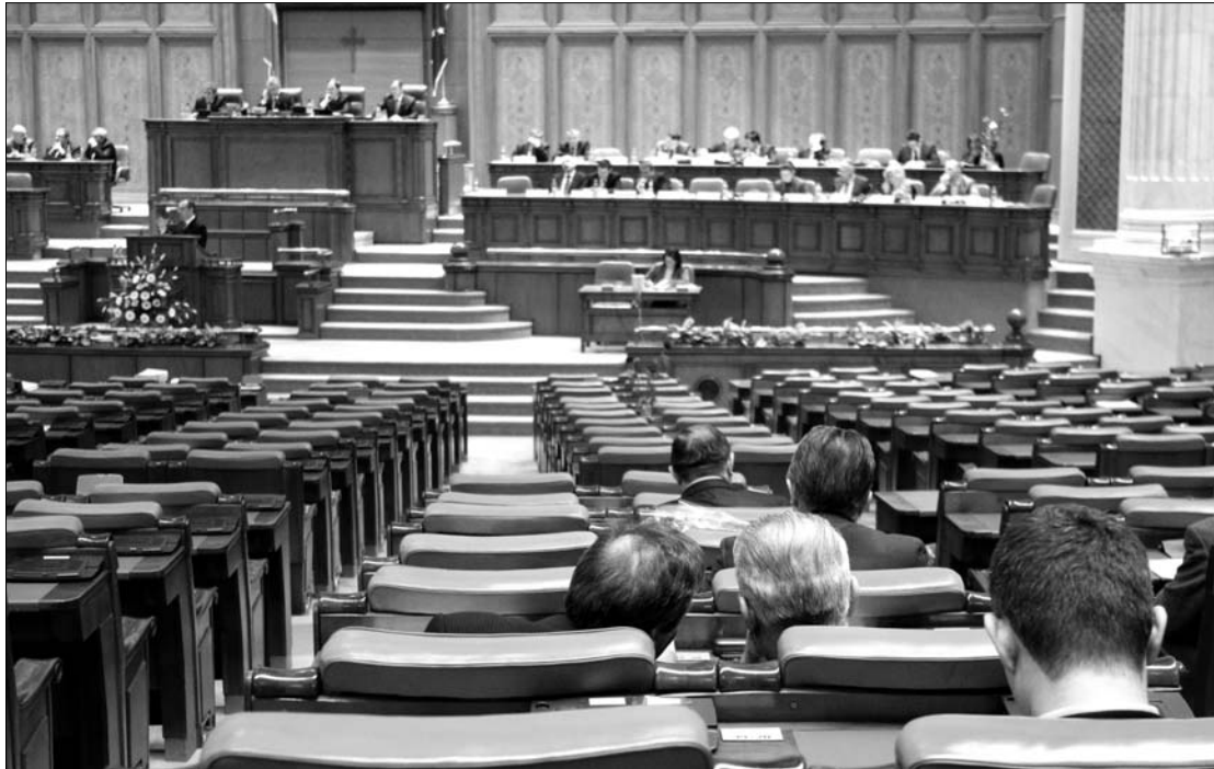
A képviselőházban húsvét óta nem gyűlt össze a sarkalatos törvények elfogadásához szükséges kvórum