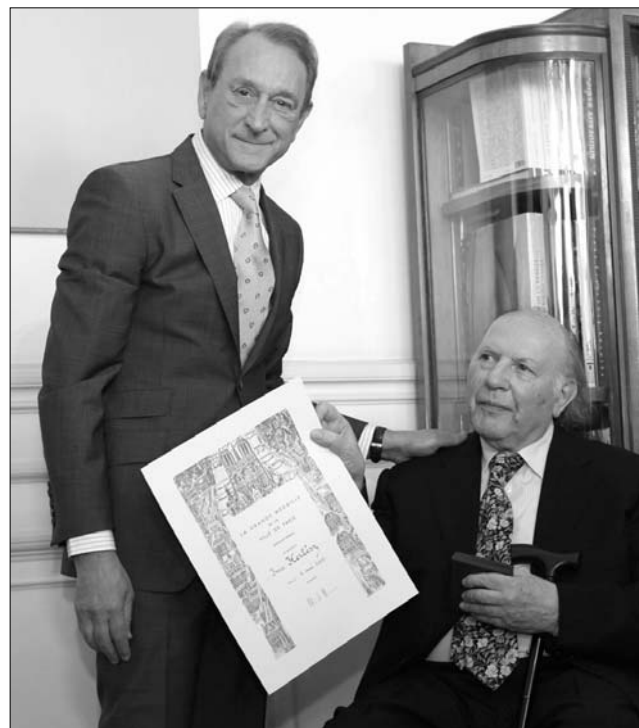
Bertrand Delanoé polgármester adta át a kitüntetést

Bertrand Delanoé méltatásában arról beszélt, hogy a mai változó társadalomban a kultúrára és azon belül is az irodalomra olyan referenciaként van szükségünk, amely segít megérteni a világ történéseit. Kertész Imre „személyisége és művésze azonosan sokkal szélesebb értelemben vett referenciát, mert kulturális örökséget és civilizációs jellegű válaszokat hordoz magában” – mutatott rá Delanoé. A polgármester kiemelte: óriási hatással van rá az, hogy Kertész Imre mennyire elegánsan és gyakran ironikusan adja át olvasóinak a művein keresztül mindazt, amit átél, különösen a Sorstalanság című regényében. „Ugyanakkor tény, hogy az olvasó egyfajta sérülést él át, de ez a sérülés fon-