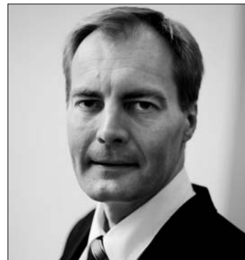
Peter Skaarup a DVP szóvivője

Az utazóknak fel kell készülniük arra, hogy hamarosan újból ellenőrizni fogják őket a határon, amikor beutaznak Dániába.