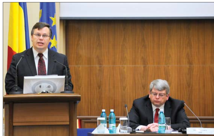
Jeffrey Franks szerint Románia nem nyúl hozzá az IMF-hitelhez

▶ A Nemzetközi Valutaalap (IMF) szerint csak 5-10 év múlva csökkenhetnek az adók Romániában, a társadalombiztosítási hozzájárulások mérsékléséről egyelőre szó sem lehet – mondta tegnap bukaresti „búcsúajótájékoztatóján” Jeffrey Franks, az IMF-küldöttség vezetője. 4. és 6. oldal ▶