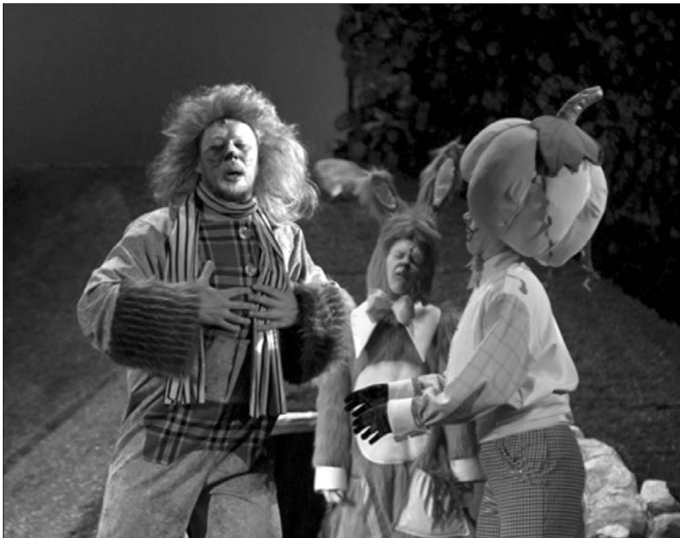
Vasárnap Lázár Ervin klasszikusát, a Négyesgöletű Kerekérdőt mutatták be

Programokban sűrű hónap várja a kolozsvári színházzsereget: költői esttel, koncerttel, mozgásszínházi előadással, felolvasószínházi produkciókkal. Holnapután, csütörtökön az új stúdióban Heltai Jenő: A néma levente című drámájának felolvasószínházi változatát láthatják az érdeklődők a Klasszikus magyar drámasorozat keretében, Salat Lehel rendezésé-