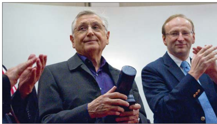
Jiri Menzel a román állam kulturális érdemkeresztjét vette át

Kelemen Hunor kulturális és miniszter tegnap a román állam kulturális érdemkeresztjével tüntette ki a filmművészet legendás alakját, az Oscar-díjas cseh rendezőt, Jiri Menzelt. 8. oldal