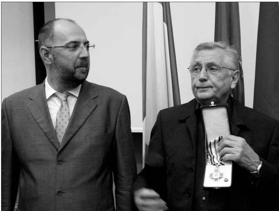
Kelemen Hunor művelődésügyi miniszter adta át a román állami kitüntetést Jiri Menzelnek.

Jiri Menzel a díj átvételkor hangsúlyozta, hogy azt a Cseh Köztársaság és a