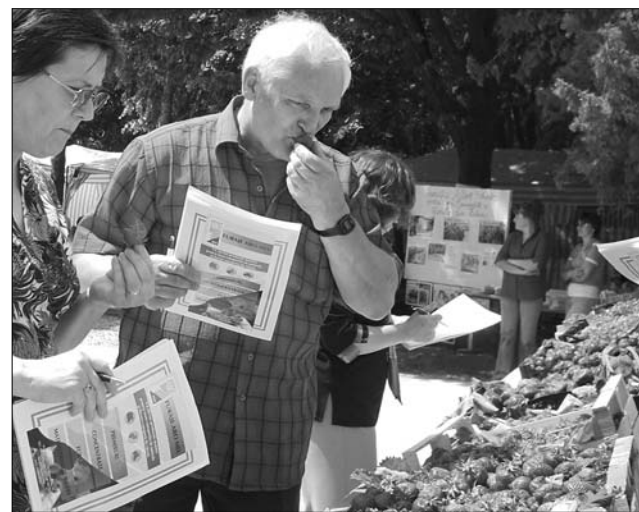
Hétvégére megérkezik a piacokra az első epertermés

A Szatmár megyei nagyközségben és környékén terem a hazai eper 75 százaléka – amely mintegy kétezer helyi családnak az egyik legfontosabb jövedelemforrása. A vidék több mint ezer hektárnyi eperültetvénye igen tagolt, de a gazdák közt egyre több a nagytermelő. Az eperrel beültetett területek aránya tavaly óta száz hektárral bővült. A polgármester szerint az április eleji fagyok mintegy 15–20 százalékkal „vámolták” meg a termést, főleg a korábban érő fajtáknál, ezt azonban nem élik meg tragédiaként, sőt, úgy véli, a kiesés jórészt pótolható, mert a gazdák közel fele már átállt a védettebb „fóliás-csepegtető” termesztési módra, amely csak az elején