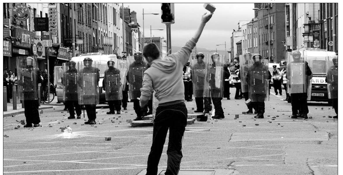
Kísérőjelenés a királynő látogatása közben. A követ dobáló dublini fiatalokat a rendőrségnek kell kordában tartania