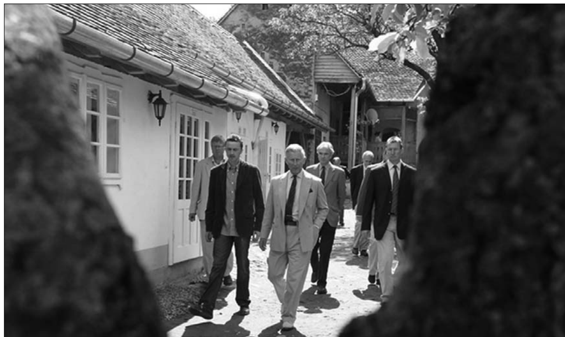
Károly herceg (középen) csak a három székely megyét keresi fel egyhetes romániai látogatásán

elő gyerekek készítették. Emellett vittek egy Kovászna megye értékeit bemutató angol nyelvű kiadványt is, amelyet közösen lapoztak végig a brit trónörökösrel. Károly hercegnek leginkább a Székely Nemzeti Múzeum bemutatása tetszett, és megígérte, hogy a következő látogatásakor megtekintti azt. Értesülésünk szerint a brit trónörökös tegnap a Hargita megyei Delnére utazott, ahol gyalogtúrán vett részt, illetve találkozott a Pogány-havas Kistérségi Fejlesztési Egyesület tagjaival. Károly herceg szombaton a marosvásárhelyi repülőtérrel utazik haza Londonba. ◀