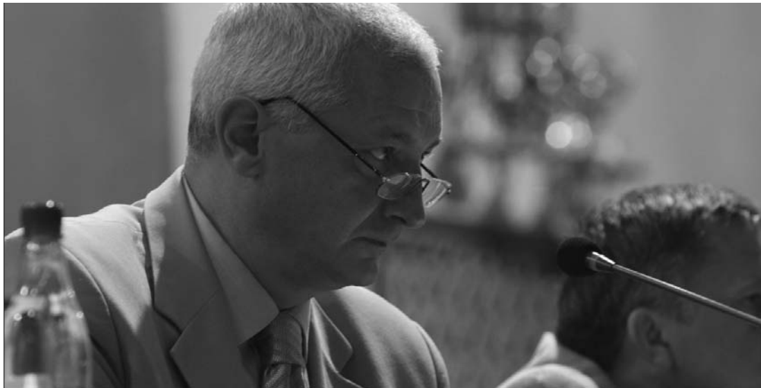
Frunda György: törvénnyel kellene rendet teremteni a hazai sajtóban, amely néha túlságosan szabad és sértő

Sajtótörvénnyel „teremtene rendet a médiában” Frunda György, akinek kezdeményezését ellenérzésekkel fogadta az újságíró-társadalom. A szenátor szerint kritikusai nem értik a szándékait.