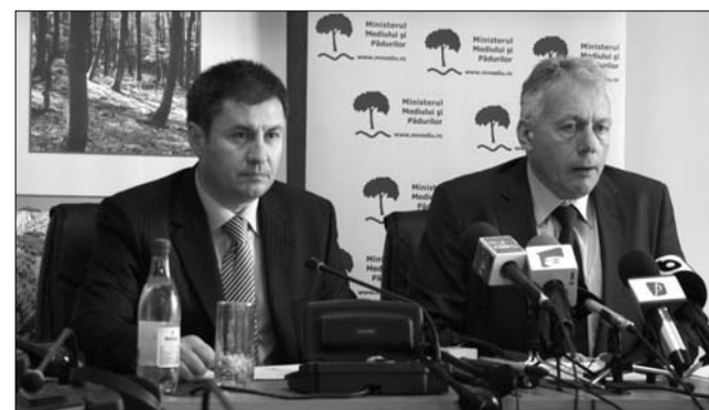
Traian Igaş belügyi és Borbély László környezetvédelmi miniszter

„Az erdő pajzsa” fedőnevű akcióról Borbély László elmondta: 2011-ben, az Erdők Nemzetközi Évében kiemelten fontos a Romsilva és Környezetvédelmi Alap keretében támogatott újraerdősítési program és az ezt erősítő kiegészítő, az illegális erdőki- vágás mértékének csökkentését szorgalmazó, ellenőrzéssorozat. „Az illegális erdőirtások, falopások mértékének csökkentésével kapcsolatosan