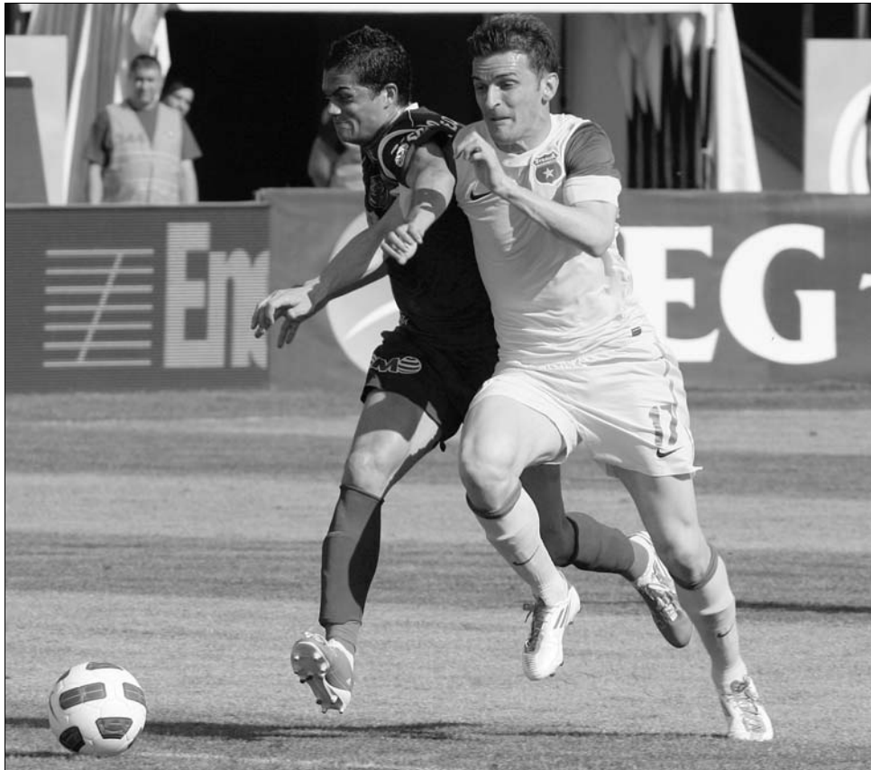
A steauások (sárga mez) a kupaszereplés reményében lerohanták a kolozsvári vasutasokat.

Ismert tehát Románia hat képviselője a 2011–12-es BL-ben és EL-ben. Szerdán a brassói kupadöntő már csak arra ad választ, hogy a Steaua vagy a Dinamo szerepel az EL play-off-jában, a Vasluijal együtt. A meccs vesztese a 2., a Rapid pedig a harmadik selejtezőkörben kapcsolódik be az EL-ben. Az Oțelul főtablás a Bajnokok Ligájában, míg a Temesvár a BL-selejtezők harmadik körében kapcsolódik be, a nem bajnokok ágán. ◀