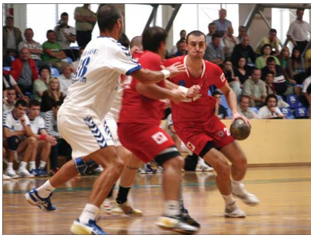
Az SZKC játékosai (pirosban) a második helyen zárták a bajnokságot

A bajnokság végeredménye: 1. Konstanca 47 pont, 2. Székelyudvarhely 39, 3. Suceava 37, 4. Krassó-Szörény 35, 5. Kolozsvár 34, 6. Bákói Știința 27, 7. Tg. Jiu 29, 8. Szatmárnémeti 27, 9. CS Municipal 20, 10. Brassó 17, 11. Temesvár 16, 12. Steaua MFA 15, 13. Minaur HC 11, 14. Nagyvárad 6. Kiesett a Minaur HC és a Nagyvárad. ◀