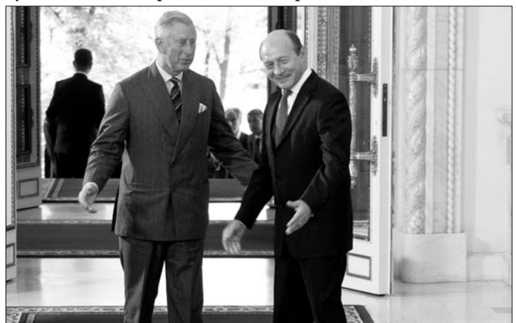
Károly herceg Bukarestben „benézett” Traian Băsescuhoz is

Ötnapos romániai látogatásán Károly herceg megtekintett egy tejfeldolgozó üzemet, felavatta Románia első biológiai szennyvíztisztítóját, és felkereste a székelyföldi Csíkdélce XV. századi római katolikus templomát. Ezen a településen kipróbálta a kaszálat, ami annyira megtetszett neki, hogy megkérte a helybélieket, küldjenek neki Nagy-Britanniába egy kaszát. A herceg eltöltött két napot Kovászna megyei birtokán, a Zalánpataka nevű kis, eldugott településen is.