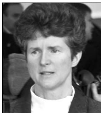
Répás Zsuzsanna

Mint ismert, egy 2003-es román-magyar kormányközi egyezség értelmében a magyar állam az Iskola Alapítványt bízta meg az