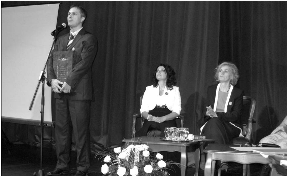
Boka László, az Országos Széchényi Könyvtár igazgatója adta át a restaurált iratokat

Nyolc napon át 56 rendezvény várta az érdeklődőket az „Önálló magyar kultúrát! Teljes körű anyanyelvi oktatást! Önálló magyar színházat! Erőteltjes civil szerveződést!” mottóval szervezett fesztiválon. Volt fotó- és festménykiállítás, könyvbemutató, klasszikus hangverseny, hagyományörző mesterségek találkozója, színházi bemutató, iskola- és különböző témákról szervezett konferenciák, vetélkedők és számos k