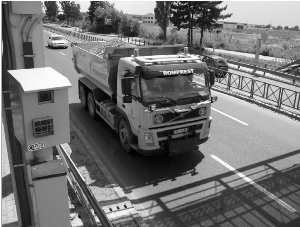
Bevetésre készen. A rögzített sebességmérők jogi helyzete egyelőre tisztázatlan

Az országos rendőrpáncsnok tájékoztatása a bel-