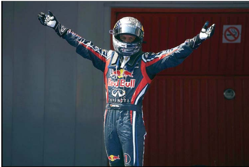
Sebastian Vettel, a Red Bull német pilótája Barcelonában is a dobogó legfelső fokára állt.

Vettel a második pozícióból rajtolt a barcelonai pályán, a verseny második felében nagy csatában volt Hamiltonnal, végül kemény küzdelemben győzött, és toronymagasan – 41 ponttal – vezeti a pontversenyt. A hazai közönség óriási öröme Fernando Alonso (Ferrari) remekül kapta el a rajtot, a negyedik helyről startolva megelőzte az ausztrál Mark Webbert (Red Bull), Vettelt és Hamiltont is. Az élbolyból először Vettel járt a boxutcában, a német pilóta a 10.