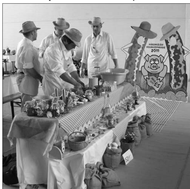
Kolbászillattal csábítják a turistákat Háromszéken