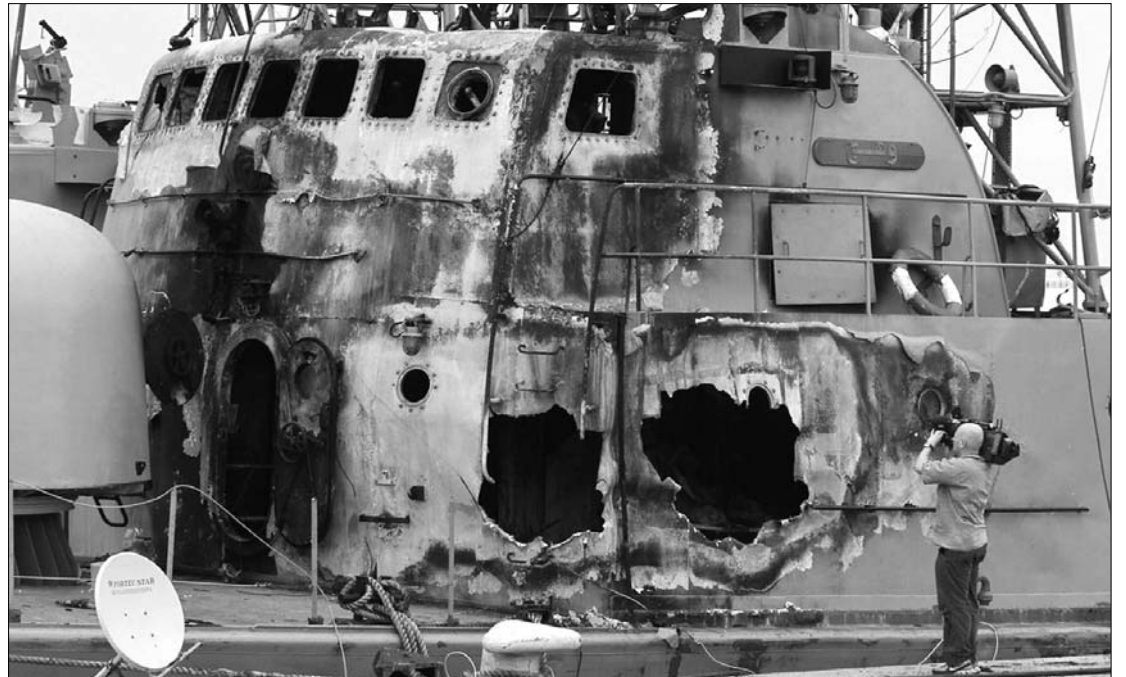
Készül a tudósítás. Tripoli kikötőjében Kadhafiék nyolc hajóját bombázták szét a NATO repülőgépei

Az Egyesült Államok magyarországi nagykövete személyesen fejezte ki hálóját Martonyi János