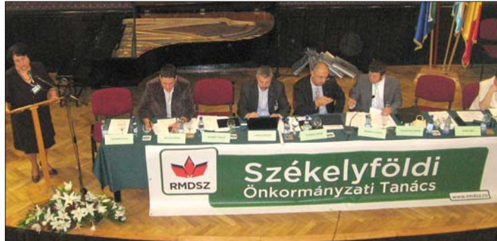
A tanács a jövőben székely nagygyűléseket is szervez majd

szabályzata értelmében a héten várhatóan megalakul az RMDSZ közép-erdélyi, június elején pedig a partiumi regionális tanácsa is. 3. oldal ▶