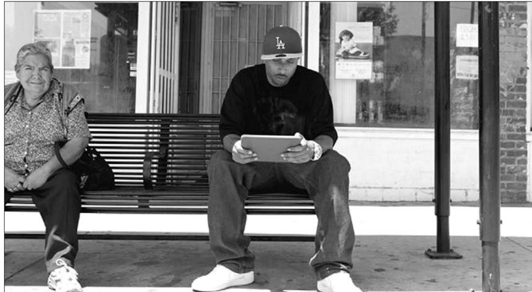
Az internetfüggő a való életben minimalizálja a társas érintkezést és virtuális térben, chatszobákban éli mindennapjait

Minden huszonötödik tinédzser „ellenállhatatlan készletet” érez, hogy folyamatosan online legyen, és ha nem éri el a világhálót vagy megpróbál egy időre lelépni a netről, feszültté válik – derült ki egy friss pszichológiai tanulmányából.