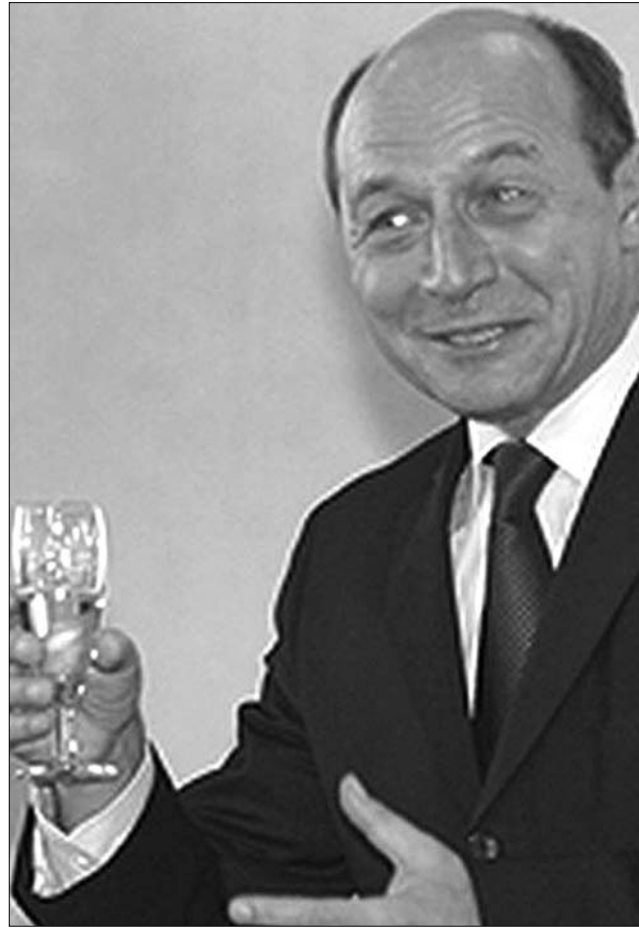
Traian Băsescu államelnök. Koccintsunk az új alkotmányra!

Az az alkotmányos rendelkezés, amelynek értelmében a kormányfőt az államelnök