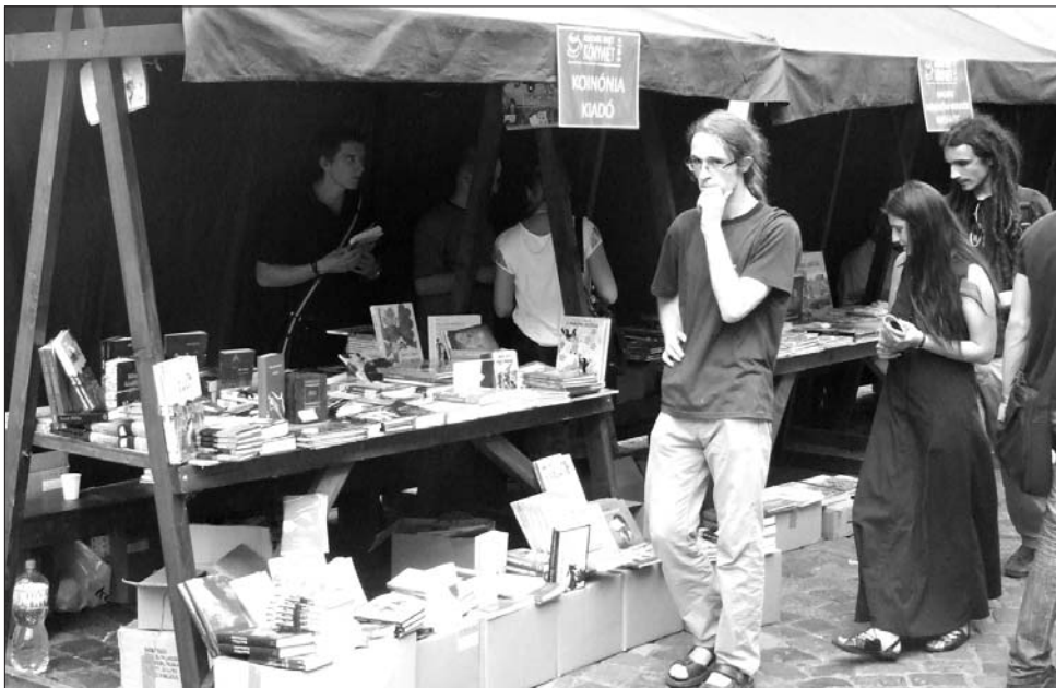
Könyvekből „kortyolgathatnak”. A Mátyás szülőháza előtti teret ellepték a könyvkiadók

„Egy könyvnap megnyitóját mindig ünnepi alkalom. És különösen ünnepi alkalomnak tekinthetjük a máit, ha arra gondolunk, hogy ebben a pillanatban egyszerre nyílik meg a budapesti Vörösmarty téren és Kolozsváron, Mátyás király szülőháza előtt a könyvhét” – fogalmazott Kelemen Hunor kulturális és örökségvédelmi tárcavezető a kolozsvári könyvhét megnyitóján. A tárcavezető kifejtette: a magyar könyvkiadás minden gazdasági nehézség ellenére talpon tudott maradni Romániában is, ami elsősorban annak köszönhető, hogy az erdélyi magyar emberek továbbra is az írott szót, a nyomtatott könyvet értéknek és nem luxusnak tartják. „Határozottan vallom, hogy a könyvkiadást nem lehet kitenni a piac kénye-kedvének, mert nem azért vannak könyvek, kulturális intézmé-