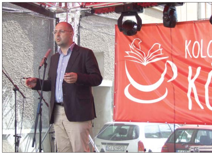
Kelemen Hunor művelődési miniszter a tegnapi megnyitón

▶ Hetven évvel az első kolozsvári könyvhét megrendezése után tegnap a kincses városban Kelemen Hunor miniszter részvételével megnyílt a Kolozsvári Ünnepi Könyvhét. 6. oldal ▶