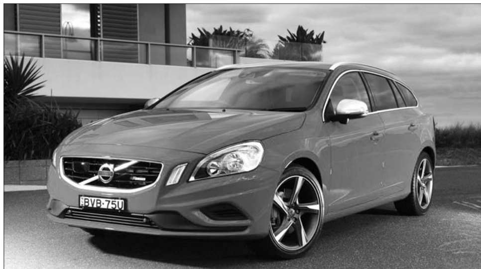
A Volvo egyértelműen legyőzte riválisait ütközésmegelőzésben

A tesztet végző szakemberek szerint a Volvo V60-as ütközésmegelőző rendszere lényegesen csökkenti a sebességet, így a városi forgalomban jelentősen csökken