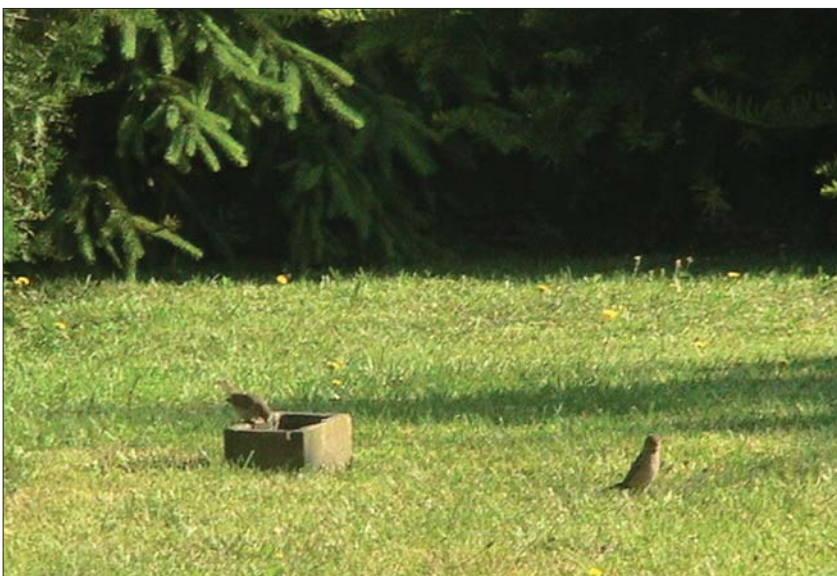
Verebek az itatónál