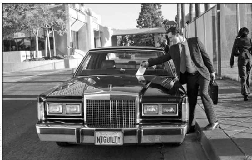
A magabiztos ügyvédnek, Mickey Haller-nek (Matthew McConaughey) kiadós fejtörést okoz egy ravasz selyemfű Az igazság ára című filmben

egyszerre elkényeztetett selyemfű és kegyetlen bűnöző, ugyanakkor átlagon felül intelligens. Megfőkezése épp ezért csak áldozatok árán lehetséges, és sajnos, ez a film egyik leggyengébb fonala: a súlyosabbnál súlyosabb ese-