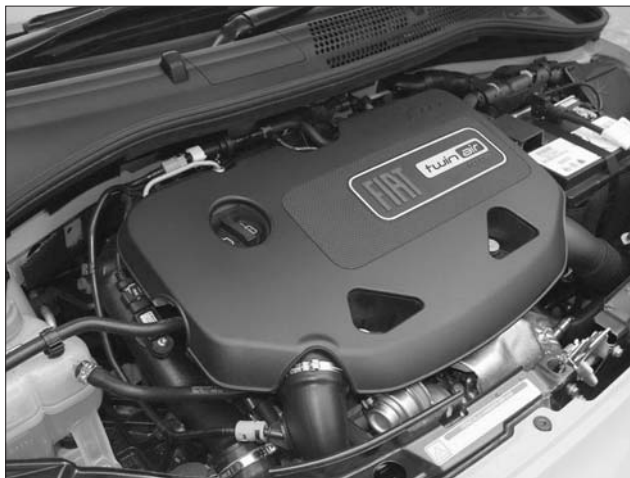
A Fiat 875 köbcentis kéthengeresét választották az év motorjává

De mitől is olyan jó a TwinAir? A kéthengeres a tavalyi Genfi Autószalonra lett szériaérett, s rögtön fel-