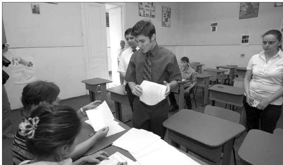
„Körmükre néznek” az idei érettségin a vizsgázóknak, szigorúan büntetik a puskázást

„A szóbeli érettségi úgy történik most is, mint tavaly. Ismeretlen szöveget kapnak a maturandusok, szövegértési kérdésekre kell majd válaszolniuk, ez egyszerűbb, mint az írásbeli” – részletezte