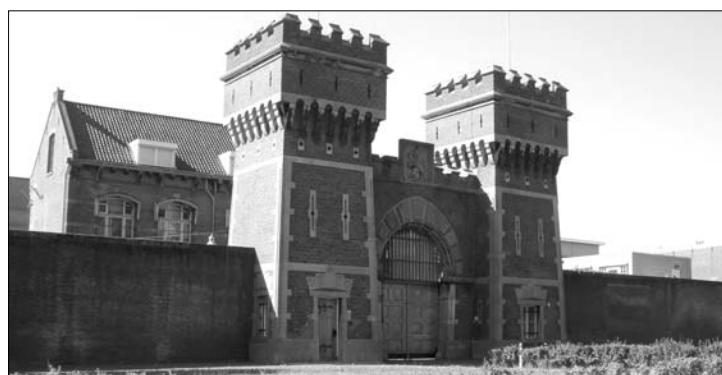
Luxusbörtön a scheveningeni tengerparton. Napközben klubélet folyik

Mladicsot azonnal orvosi vizsgálatnak vetették alá, de semmilyen problémát nem találtak nála, ami akadályozná abban, hogy megjelenjen a bíróság előtt. A 69 éves vádlott ügyvédje Belgrádban még úgy nyilatkozott, hogy sem lelkileg, sem testileg nem alkalmas egy tárgyalásra. Hocking elmondta, hogy a védelemről is beszélt a volt tábornokkal, de még nem látta jelét bármilyen ezzel kapcsolatos tervnek.