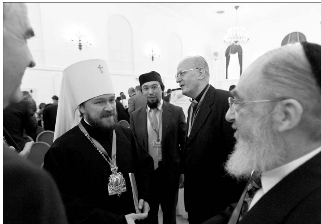
Vallásközi párbeszéd Gödöllőn. Metropólita, iszlám és zsidó vezető, illetve bíboros egy társaságban

Keresztény-zsidó-izlám konferenciát tartanak Gödöllőn