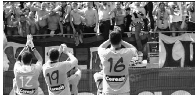
A ploiești-iek győzelemmel és feljutással búcsúztak szurkolóiktól. Labdarúgás