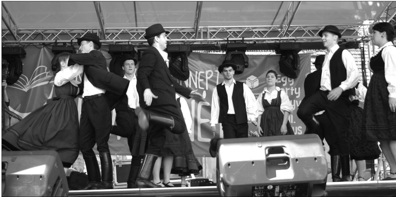
A Kolozsvári Ünnepi Könyvhét a könyvstandok mellett néptánc-előadásokkal és koncertekkel várta az érdeklődőket