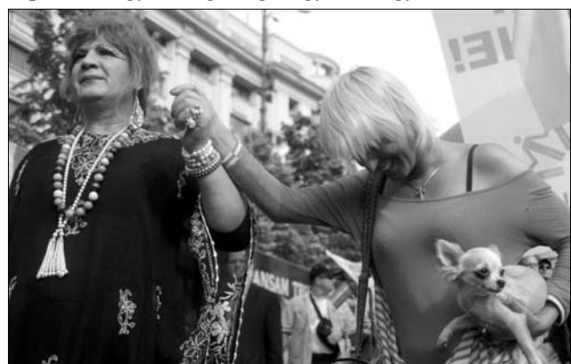
A kisebbségi jogokért is tüntettek a bukaresti melegek