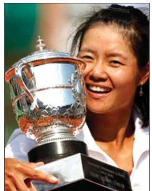
Li Na nyerte Roland Garros

▶ A 6. helyen kiemelt Li Na nyerte a francia nyílt teniszbajnokság női egyesét, miután a szombati döntőben 6-4, 7-6 (0) arányban bizonyult jobbnak a címvédő olasz Francesca Schiavone (5.) ellen. A 29 éves kínai pályafutása során először diadalmasodott Grand Slam-tornán és egyben ő az első ázsiai teniszező, aki GS-viadalt tudott nyerni egyben. Az idei Roland Garros győztese 1,2 millió eurót kapott, míg ellenfele 600 ezerrel vigasztalódott. A férfi egyes döntőt a címvédő és világelső spanyol Rafael Nadal nyerte, miután négy játszmában győzött a svájci Roger Federer ellen. Nadal pályafutása során tizedszer diadalmasodott Grand Slam-tornán és hatodszor a Roland Garros-on. Tegnap huszonötödik alkalommal verte nagy csatában 7-6 (6), 4-6, 10-7-re. Elsőként Nadal jutott be a fináléba az év második Grand Slam-tornáján, miután a pénteki elődöntős mérkőzésen 6-4, 7-5, 6-4-re nyert a skót Andy Murray ellen. A másik ágon az egykori világelső Federer megszakította Novak Djokovic veretlenségi sorozatát: a 24 éves szerb idén 41 megnyert mérkőzést követően szenvedett vereséget, ezzel éppen egy sikerrel maradt el a rekordertől: az amerikai John McEnroe