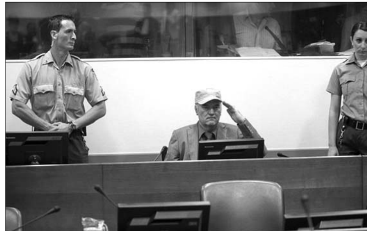
Ratko Mladics tábornok bírái előtt. Zavarosan védekezett Hágában

sági falut, ahol elfogták, Lázárföldet (Lazarevo) a jövőben Mladicsevónak nevezzék el. Pénteki számában a Magyar Szó című délvidéki napilap idézett egy lázáröldi lakost, aki szerint nemcsak a falu átkeresztelését szeretnék elérni, hanem a főutcáét is, amelyet a jövőben Ratko Mladics utcának kellene hívni. A lázáröldiek emellett egy emlékházat is szeretnének kialakítani, valószínűleg abban az épületben, ahol a volt tábornokot letartóztatták. ◀