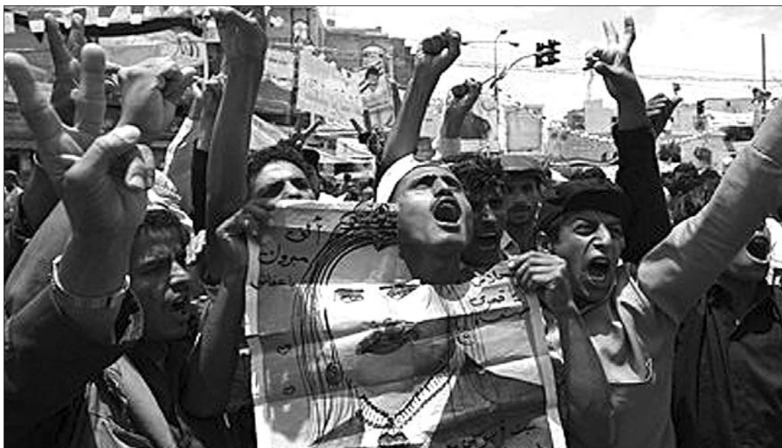
Szanaában örömmel tört ki az elnök távozása nyomán. Az „arab tavasz” sorra üzi el diktátorait

ügyminiszter. A líbiai hadseregből dezertált több egykori magas rangú tiszt ugyanakkor a The Sunday Times nek azt mondta: a Kadhafi-rezsim hadseregének hadműveleti kapacitása a NATO és a felkelők támadásai nyomán az „ötödére zsugorodott”, és Moammer el-Kadhafi akár „hegyen belül” távozni kényszerülhet. A NATO először vetett be harci helikoptereket a Kadhafi rendszere ellen indított légi hadművelete során. A légi járművek a líbiai partok közelében cirkáló hadihajókról szállnak fel bevetésre. Közben pénteken az amerikai képviselőház határozatban dorgálta meg Barack Obama amerikai elnököt, mert kongresszusi határozat nélkül vezényelt amerikai fegyveres erőket a Líbia elleni beavatkozásra. A határozatot 268:145 arányban fogadták el a képviselők. A Fehér Ház tiltakozott a döntés ellen, amelyet „szükségtelennek és haszontalannak” minősített. ◀