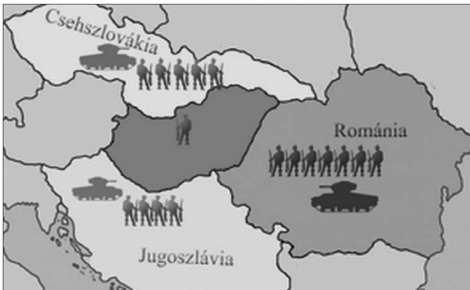
Magyarország ellen fegyverkezett a kisantant: Románia, Csehszlovákia és Jugoszlávia

Ennek a nézetnek az alapvető tévedése, hogy a kisantant létrejöttét a francia külpolitika kezdeményező szerepének, a francia külpolitika Duna-völgyi koncepciójának tulajdonították. Ez a félreértés a szélesebb közvéleményben fél évszázadnál is hosszabb időszakon át élt makacsul. Ennek oka elsősorban az, hogy a Francia Külügyi Levéltár, amelynek iratanyaga perdöntő a kérdés valós megítélésben, csak nemrégiben vált hozzáférhetővé a ku-