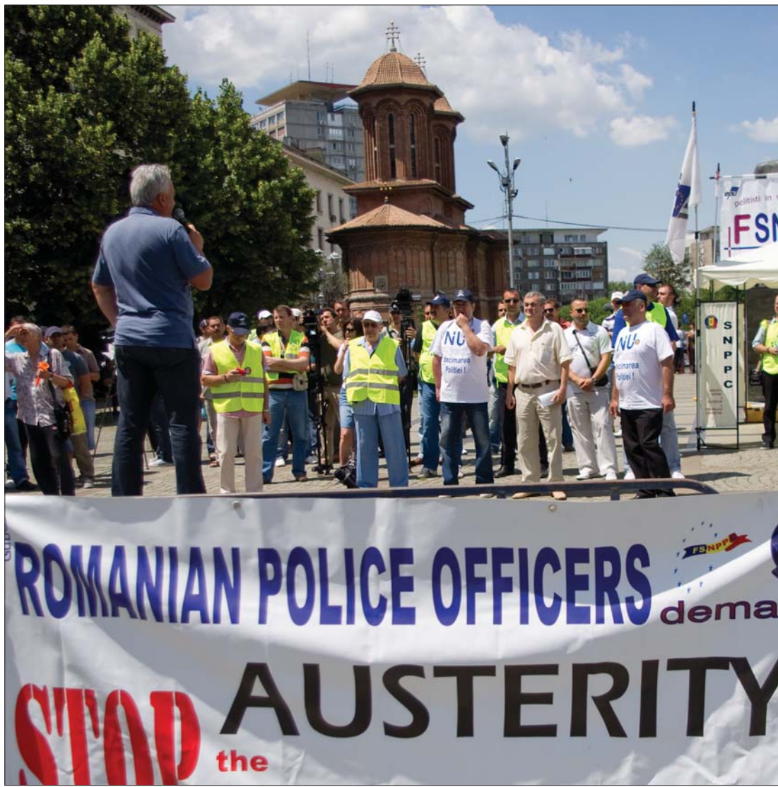
A rendvédelmisek türelme azért fogyott el, mert csökkentették étkezési bérkiegészítésüket

A 2013-tól lehívható uniós pénzekhez való hozzáféréssel indokolta tegnap az ország adminisztratív-területi átszervezésének szükségességét Emil Boc miniszterelnök azt követően, hogy a képviselőház épületében zárt ajtók mögött tárgyalt a Demokrata Liberális Párt (PDL) parlamenti frakcióival. Mint ismeretes, az RMDSZ már 2008 októberében benyújtotta régióát-szervezési törvénytervezetét a szenátusba. A jogszabály feldarabolná a jelenleg létező régiókat: nyolc helyett tizenhat kisebb és öt makrorégiót „hozna létre”. A felsőház februárban hallgatólagosan elfogadta a jogszabályt, amely így az ügydöntő képviselőház elé került. 3. oldal