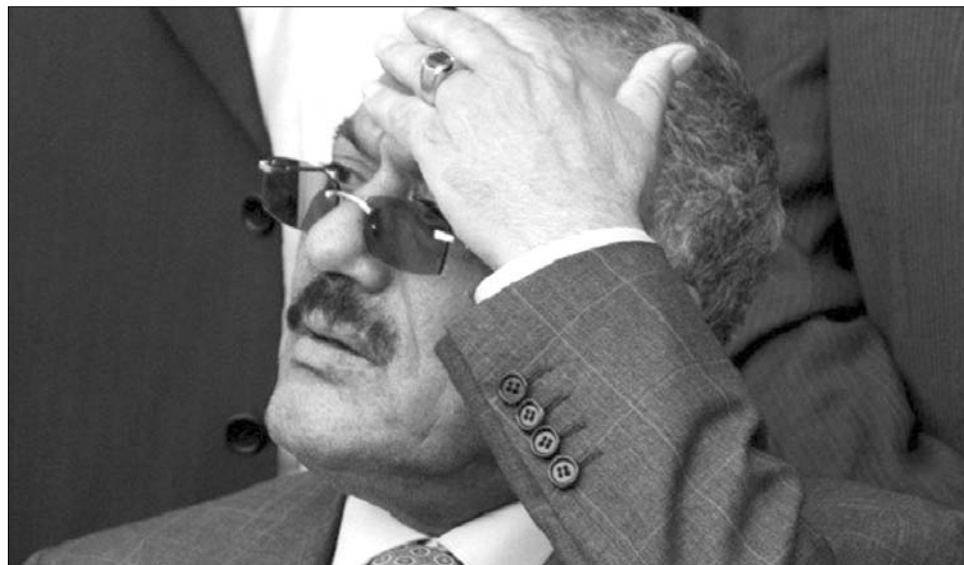
Ali Abdalláh Száleh jemeni elnök. Van miért fognia a fejét

Sok függ attól, milyen álláspontot foglal el a követke-