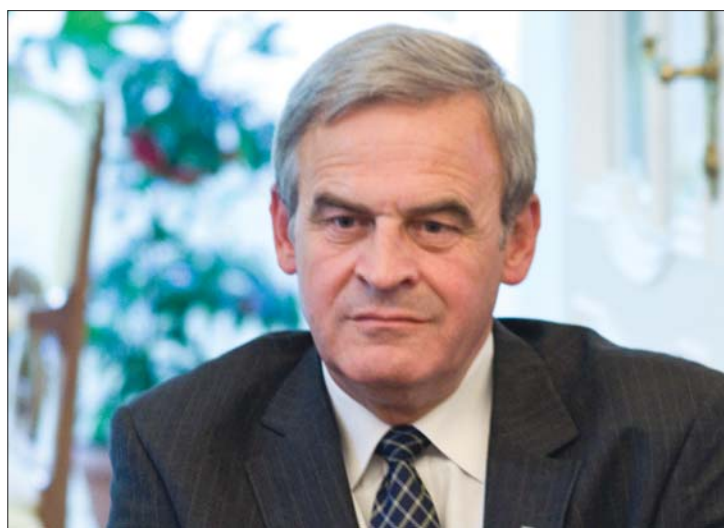
Tőkés László korábban azt állította: csak magántámogatóik vannak.

Tényfeltáró anyagában a lap arról írt, hogy Tőkés Lászlóék az elmúlt hónapokban összesen 2,2 millió lejt, azaz félmillió eurót