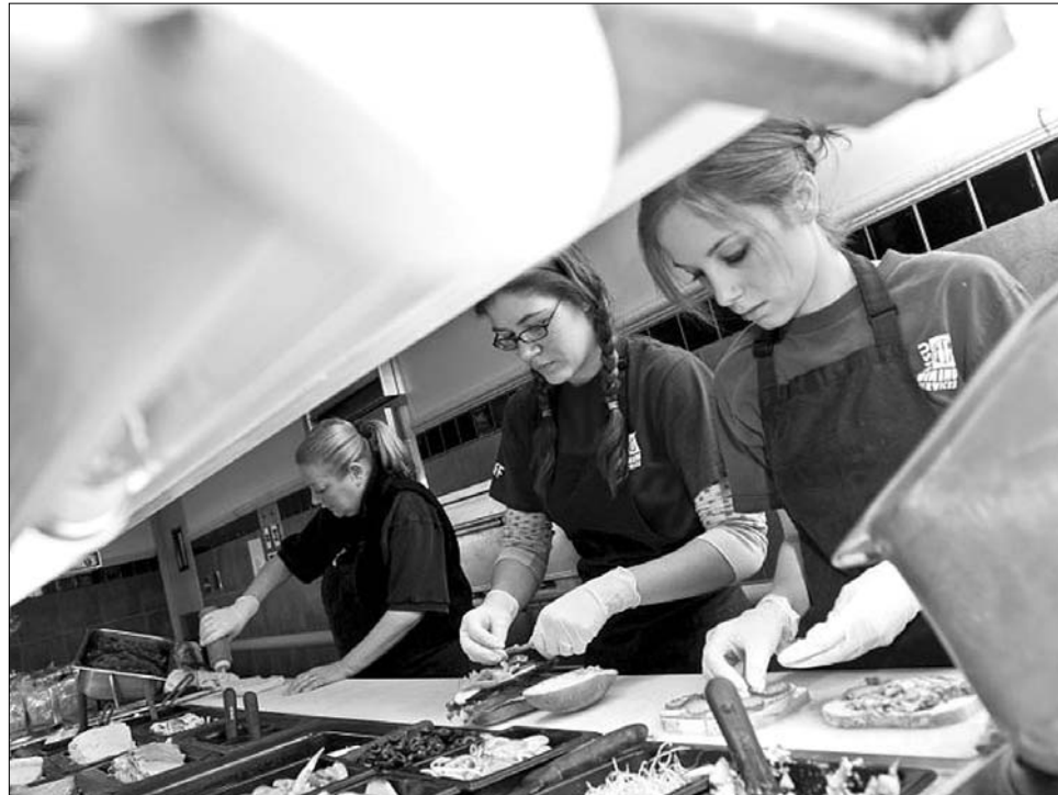
Főiskola – mellékállásban. A diákevek finanszírozásának hazai módja a korai munkába állás

Az eddig nyilvánosságra került információk szerint a kölcsönszerződést csak olyan pénzintézetek képviselői köthetik meg, akiknek anyabankjuk magyar, illetve Magyarországon is rendelkeznek fiókkal. Mivel Romániában mindeddig nem jött létre egyetemi hallgatók számára nyújtott speciális hitelkonstrukció, arra voltunk kíváncsiak, hogy a magyarországi kezdeményezés ösztönözheti-e, illetve felgyorsíthatja-e ennek kialakítását a hazai bankrendszerben.