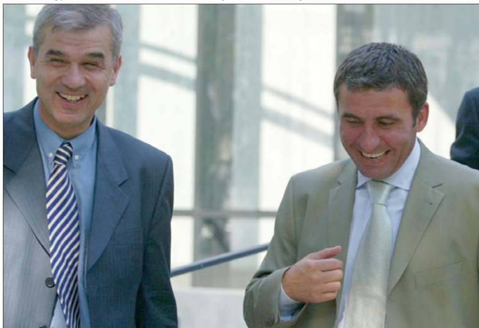
Újra együtt a román „aranycsapat” edzője és kapitánya: Anghel Iordănescu és Gică Hagi