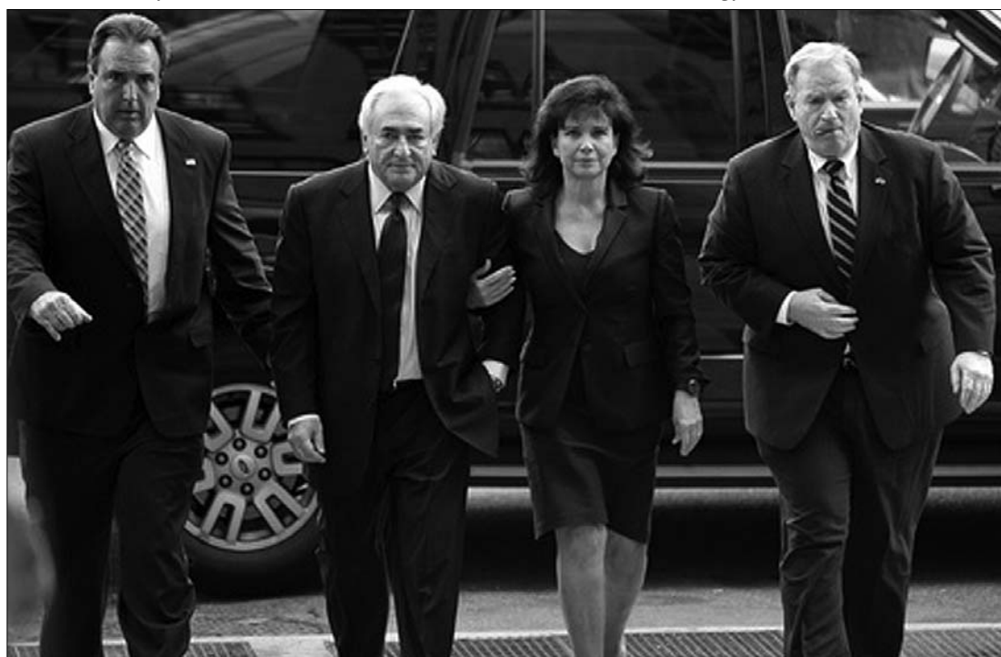
Dominique Strauss-Kahn felesége kíséretében jelent meg tegnap a New York-i bíróságon

A volt IMF-vezért azzal a gyanúval vették őrizetbe, hogy a manhattani Sofitel szállóban erőszakoskodott az egyik szobalánnyal. A 32 éves szobalány szerint Strauss-Kahn május 14-én a New York-i Sofitel szállodában kényszerítette orális szexre és kísérletet tett megerőszakolására. A bíróság épülete előtt több tucat női szállodai alkalmazott tüntetett Strauss-Kahn ellen, aki a felesége, Anne Sinclair társaságában jelent meg a tárgyaláson. ◀