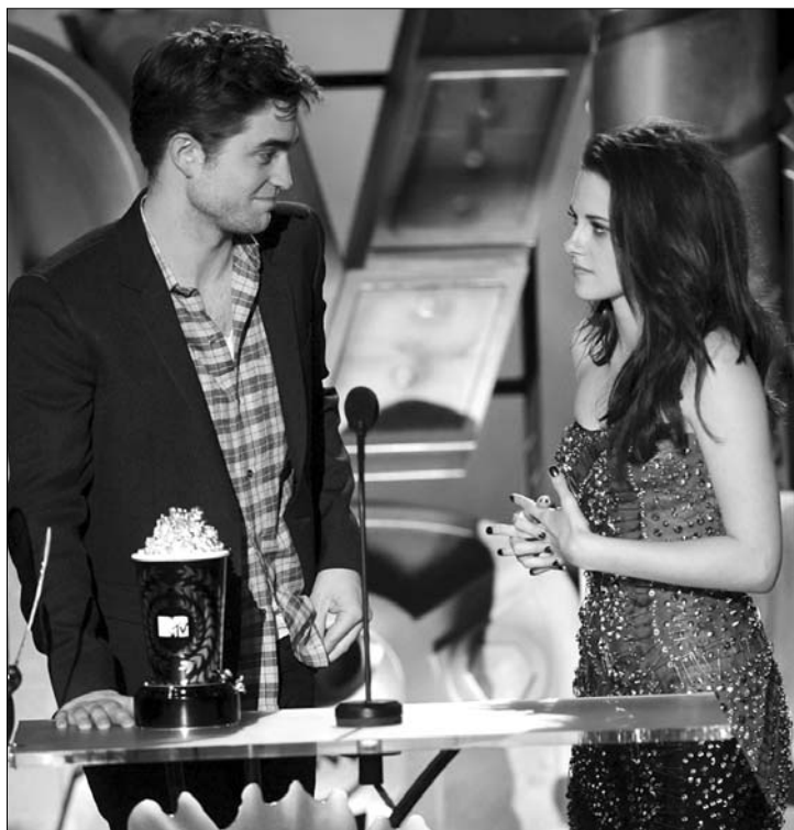
Robert Pattinson és Kristen Stewart, az idei MTV Movie Awards sztárjai

A show másik sztárja Chloe Moretz, aki a Legátütőbb alakítás és a leg„badass”-ebb (legtökösebb) főszereplő díjakat kapta meg. A legjobb mozis gonosz idén is Tom Felton, aki a Harry Potter és a Halál ereklyéi 1. részé-