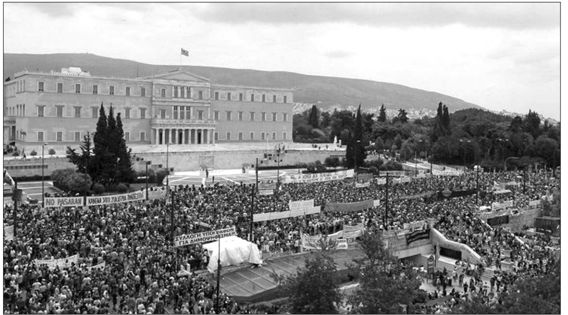
A megszorító intézkedések ellen tüntettek. A görög kormány akár bele is bukhat a tömegmegmozdulásokba

A görög kormány újabb takarékosági csomagot akar elfogadtatni, hogy az ország lehívassa a 110 milliárd eurós nemzetközi hitelsomag következő részleteit, és ezzel elkerülje az államcsődöt. Az öt évre szóló, 28 milliárd eurós megszorító csomag többek között újabb adóemeléseket, kiadáscsökkentést, a közzféra további karcsúsítását helyezi kilátásba. Ehhez társul egy ambicióz-