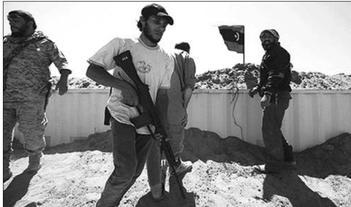
Tunisz hajlandó elismerni a felkelőket. Tömegesen menekülnek Líbiából

A jogszabály tiltja az amerikai fegyveres erőknek, hogy hatvan napon túl kongresszusi felhatalmazás nélkül katonai hadműveletekben vegyenek részt. ◀