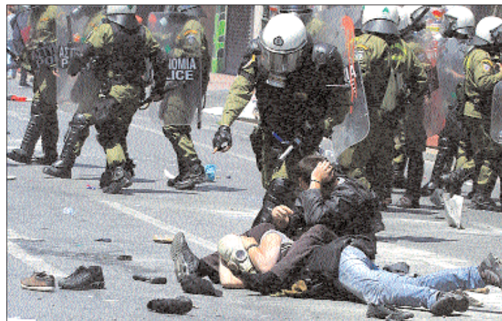
A görögországi tiltakozásnak sérültjei is voltak

▶ Könyörgött is bevetett a görög rendőrség tegnap Athénban, hogy föloszlassa a parlamentnél összegyűlt több tízezres tömeget. Görögországban tegnap teljesen megbénult az élet, miután a szakszervezetek huszonnégy órás sztrájkot tartottak a megszorító intézkedések ellen. 2. oldal ▶