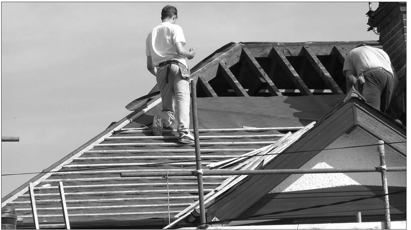
Idén szembetűnő növekedést hozhat a tavaly jelentősen visszaesett építőipari szektor