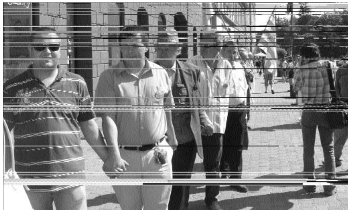
Elő láncsal a magyar igazgatóleváltások ellen. A székelyföldiek hasonló tiltakozó akciókra készülnek.