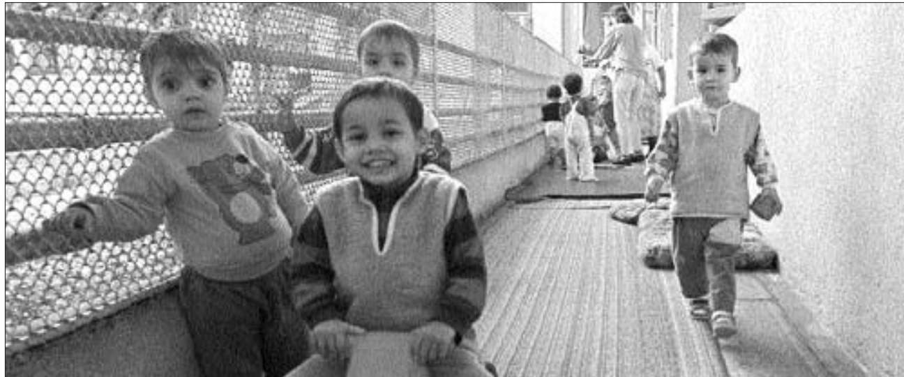
Enzentül külföldi szülők is vállalkozhatnak a romániai árvák gondozására, ha a szülőpár egyike román állampolgár