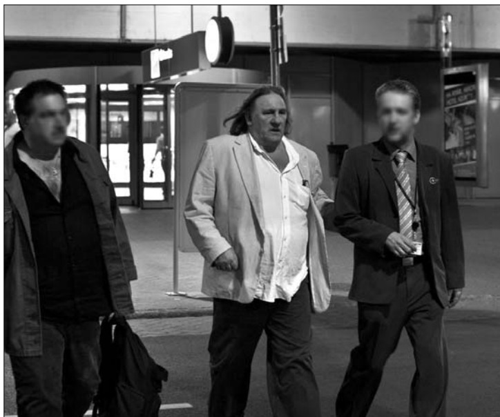
Gérard Depardieu a főtű stúdióban forgatja a 3D-s Asterix és Obelix -et

Az 1948. december 27-én született művész egyike a legfoglalkoztatottabb francia színészeknek, ami nem csoda, hisz közel kétszáz filmben játszott. Első szerepét 1970-ben kapta Michel Audiard-tól, aki Le cri du cormoran le soir au-dessus des jonques című filmjében foglalkoztatta. Az igazi áttörést 1974-ben Bertrand Blier rendező filmje, a Herék, avagy a tojástartó hozta meg számára. Egy évvel később sikerült megszabadulnia a huli-