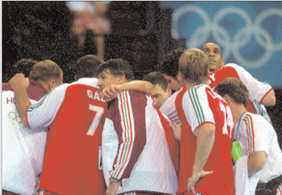
Kemény dió. A magyaroknak a franciákkal, az oroszokkal és a spanyolokkal kell megküzdeniük.

Az már korábban eldőlt, hogy Mocsa Lajos szövetségi kapitány együttese Újvidéken játssza a csoportmeccseit, és továbbjutása esetén a középdöntőben is marad a szerb-magyar határtól közel 100 km-re fekvő, Duna-parti vajdasági városban. Ha sikerül a továbblépés, a horvát-szlovén-izlandi-norvég négyes legjobb három alakulata megy át Újvidékre. Az is biztos volt, hogy a dán, a norvég, a svéd, a horvát, a mace-