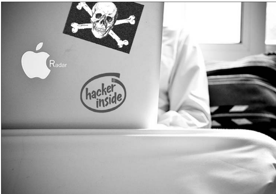
„A hackerek már a spájzban vannak”. Az adathalászatok támadásaira mindig résen kell lenni

Az adathalászatok leggyakoribb áldozata az átlagfelhasználók, de nem ritka, hogy a vérfilmek is megtevesztő, összetett csalási eljárásokat dolgoznak ki. Sajnos, a netezés hétköznapihoz tartozik, hogy nemcsak a személyi számítógépeiken békésen szörfölők, de a biztonságtechnikailag legjobban védett intézmények „bombabiztos” gépei és hálózatai is csúfosan felsülnek egy-egy rosszindulatú támadás hatására. Az Egyesült