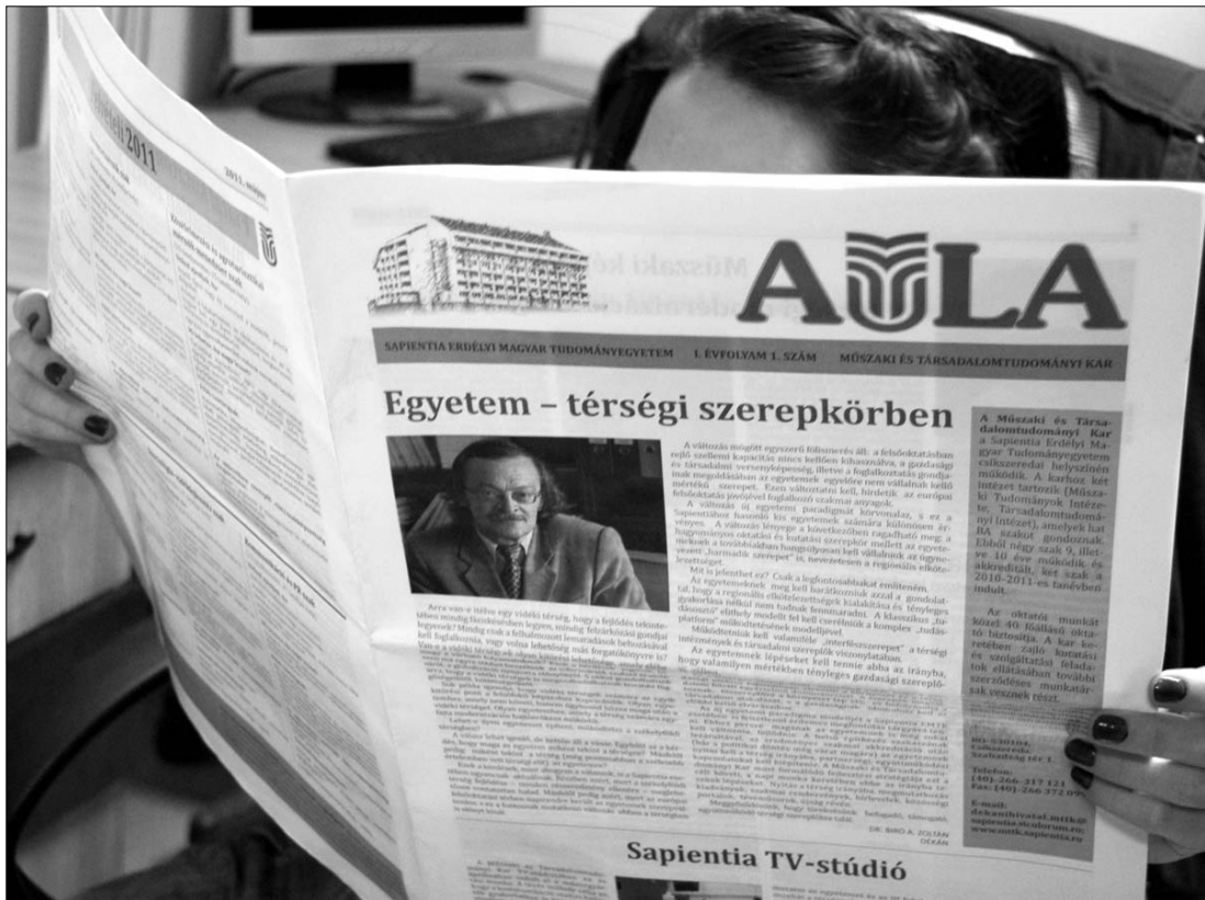
Megjelent a Sapientia csíkszeredai Műszaki és Társadalomtudományi Karának új kiadványa, az Aula első száma