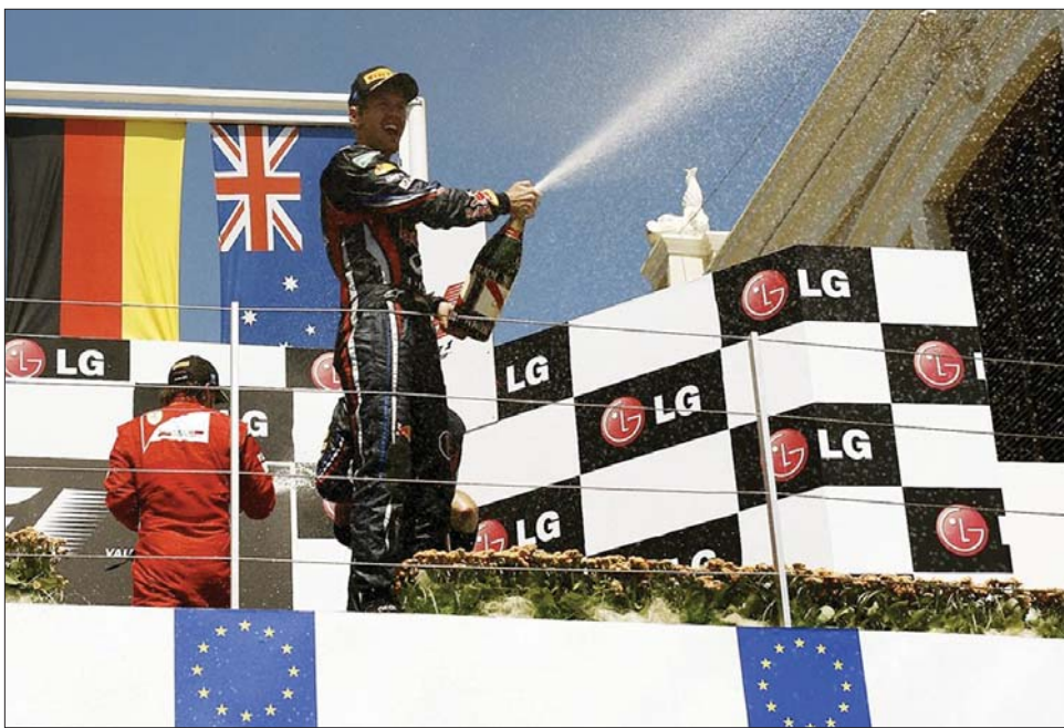
Sebastian Vettel (Red Bull) pályafutása 16. futamgyőzelmét szerezte meg

Vettel idei hatodik, pályafutását tekintve pedig 16. futamgyőzelmét szerezte meg. A 24 esztendőes versenyző rajt-cél győzelmet aratott a valenciai városi pályán és hatalmas előnnyel vezeti a pontversenyt. A 24 pilóta közül 17-en körhátránnyal fejezték be a viadalt. Vettelnek 186, Buttonnak 109,