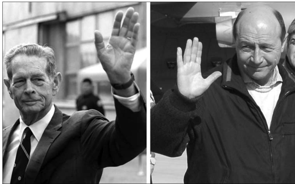
I. Mihály király és Traian Băsescu államfő. Búcsút intettek egymásnak?

Ha az ellenzék bírálatait „természetesnek” is tartja, az államfőnek mindenképpen el kell gondolkodnia azon,