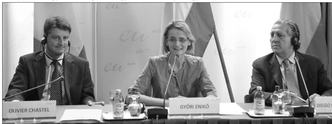
Györi Enikő magyar, valamint Olivier Chastel belga (balra) és Diego López Garrido spanyol államtitkár

ményt sem tudnak megnevezni az elnökségi félév időszakából – áll a Policy Solutions és a Medián tegnap nyilvánosságra hozott, legfrissebb közös kutatásában. Az ellenzéki pártok szavazói közül csak a szocialista érzelműek között vannak relatív többségben (50 százaléknyan) azok, akik sikertelennek tartják a magyar elnökséget. A kutatás szerint a magyar soros elnökség utolsó hónapjában az állampolgárok 80 százaléka tudta fejből, hogy ezt a pozíciót Magyarország töltötte be 2011 első felében. ◀