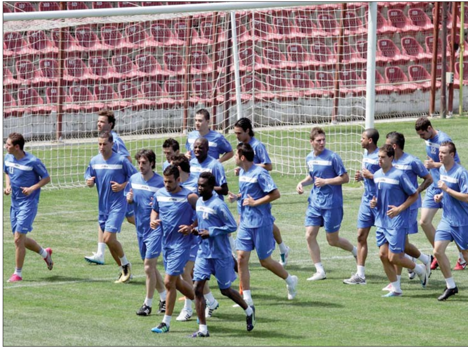
A Kolozsvári CFR 1907 már három győzelmet aratott az eddigi előkészületi mérkőzéseken.

Az újonc Petrolul Ploiești az Anorthosis Famagustával (július 5.), az osztrák SC Florisdorffal (július 7.), a Levszki Szófiával (július 9.), a szlovák Spartak Mjavával (július 11.) és a cseh Slovacóval (július 13.) játszik. ◀