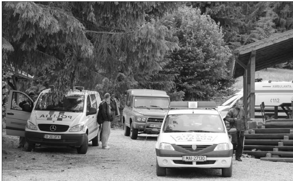
A hatóságok tegnap a helyszínen próbálták rekonstruálni az április 22-i gyilkosságot.

László Kovászna megyei önkormányzati alelnök, aki szerint a közös fejlesztési stratégia teremthet megoldást. Az előjáró szerint túl merész elképzelés, hogy 12 hónap alatt teljes stratégia születik, de úgy vélte ez az időszak az adatgyűjtésre, és a prioritások felmérésére elég. Henning László emlékeztetett: prioritást érdemelnek az ásványvízforrások, az erdőgazdálkodás, a megújuló energiaforrások, turizmus és hagyományos termékek terén kialakítható fejlesztések. A tervek szerint a közös projektek révén széleskörű közvélemény-kutatást végeznek, felméri, hogy térségben élő lakók milyennek látják Székelyföldet és melyek az általuk támogatott fejlesztési irányvonalak. A résztvevők hálózati elemzéseket készítenek, felméri, hogy mennyire hatékony az önkormányzatok, az intézmények, a vállalkozói- és a civil szféra együttműködése. ◀