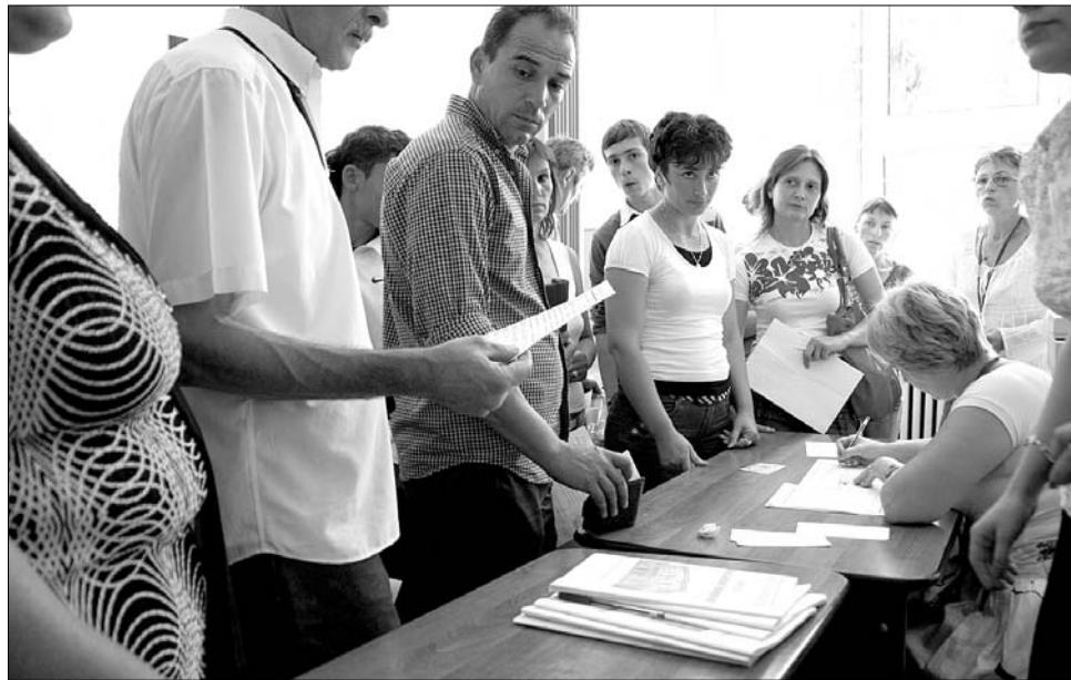
A szülők is elkísérték a gyerekeket tegnap, a középiskolai beiratkozás első napján.