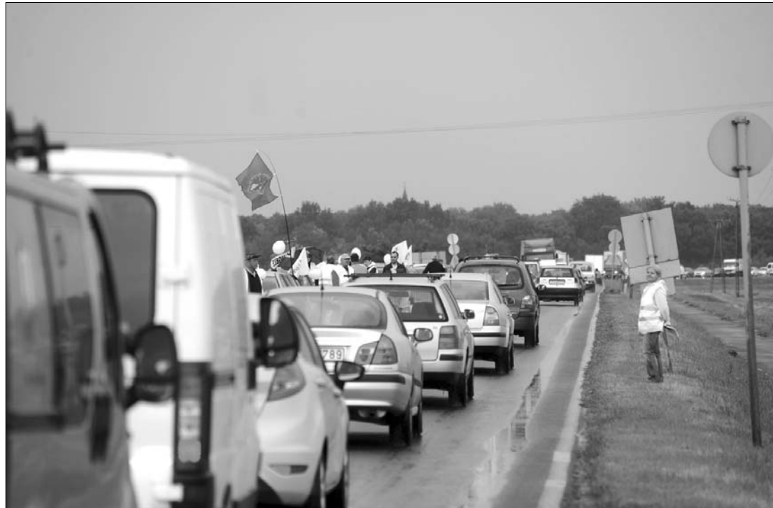
Feltorlódott kocsisor a 43-as úton Szeged és Deszk között. Magyarország negyven pontján volt hasonló akció