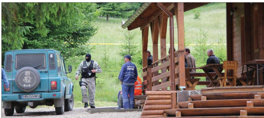
Gyilkosságrekonstrukció Borzonton. A gyanúsított nem vett részt, mert a helyszínen elájult