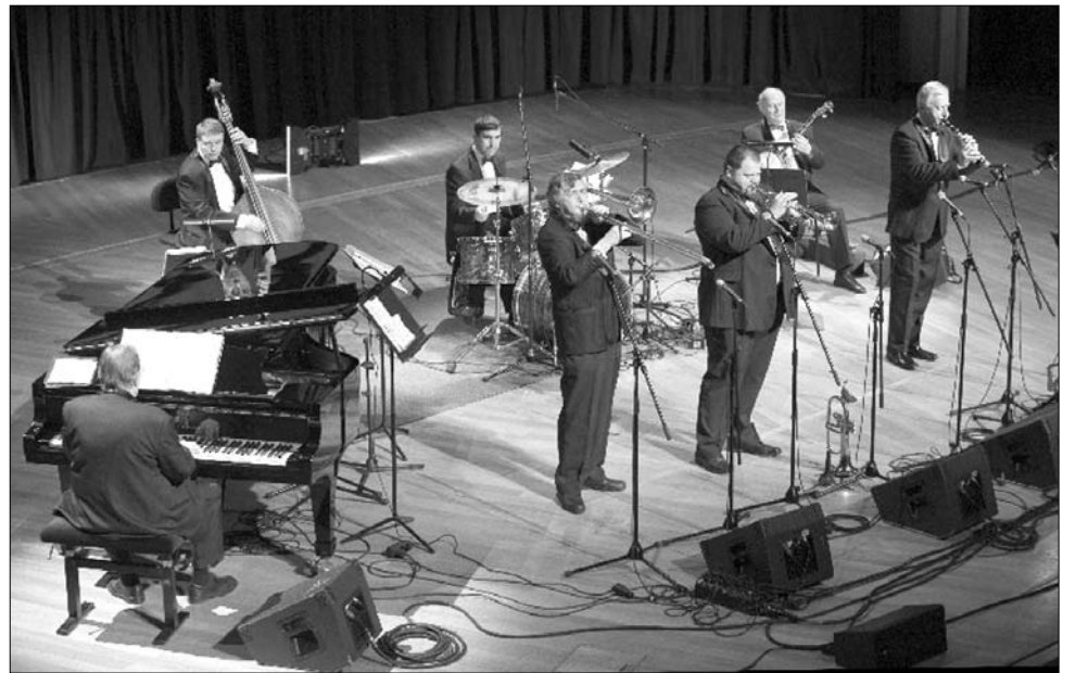
Az 1957-ben alakult magyarországi Benkó Dixieland Band lesz a III. Mini Jazzfesztivál idei sztárvendége