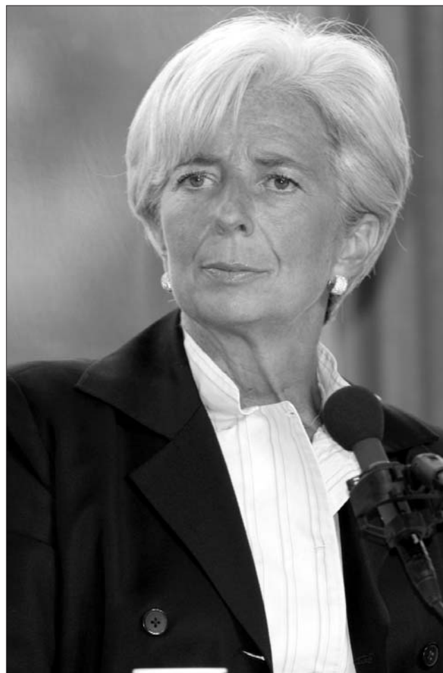
Christine Lagarde az első nő a Nemzetközi Valutaalap élén

A mindvégig első számú esélyesnek tekintett Lagarde megbízása az után vált egy-