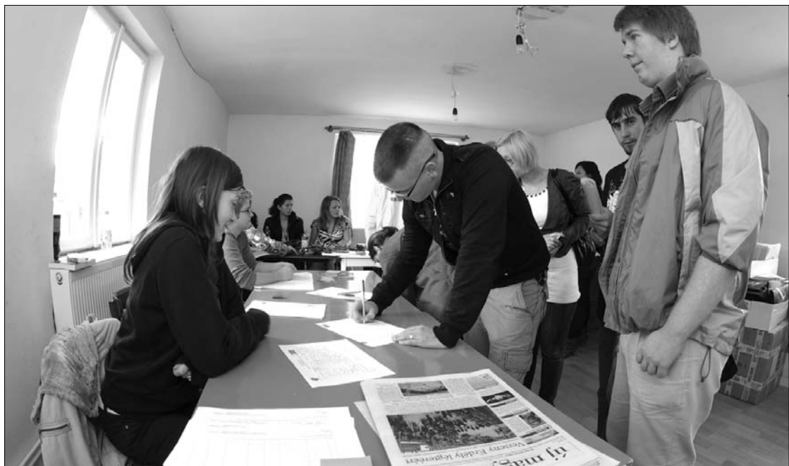
Beköltözéskor a marosfői táborlakókat az Új Magyar Szó legfrissebb száma várta a regisztrációs irodában.

► Szokatlanul élesen bírálta Dmitrij Medvegyev orosz elnök Traian Băsescu román államfőt a Szocsiban tartott NATO–Oroszország-csúcstalálkozón azért, a már korábban is Moszkva „szájára került” kijelentéséért, miszerint Ion Antonescu marsallhoz hasonlóan 1941-ben ő is kiadta volna a román csapatoknak azt a parancsot, hogy keljenek át a Pruton, támadják meg a Szovjetuniót. „Sose hallottam az elnök urat ilyen haragosnak” – számolt be a fentebb említett orosz lapnak egy szemtanú. Medvegyev szerint elfogadhatatlanul oroszellenes álláspontjával Traian Băsescu felsorakozott azok mögé, akik hetven évvel ezelőtt kirobbantották a második világháborút. A román államfő azzal hívta fel magára orosz kollégája „figyelmét”, hogy a másfél héttel ezelőtt a B1 kereskedelmi televízióknak adott interjújában azt hangoztatta, hogy Antonescuhoz hasonlóan ő is parancsot adott volna a román katonáknak a Pruton való átkelésre, hiszen „szövetségünk (a náci Németország – szerk. megj.) és területi követeléseink ezt megkövetelték”. ◀