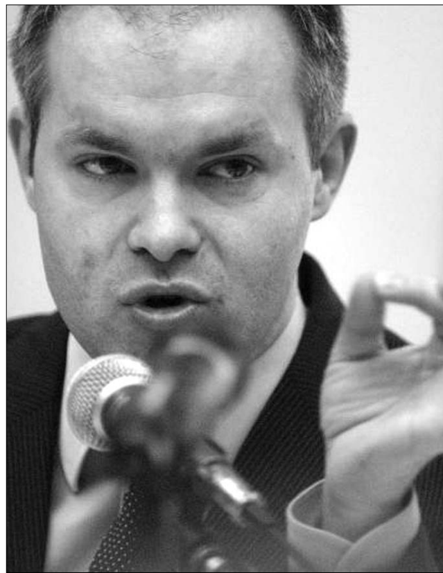
Daniel Funeriu oktatási miniszter: oké az érettségre!

Az érettségin országos viszonylatban elért eredmények egyébként az évtized első nyolc esztendejében nagyjából 10 százalékos ingadozást mutattak, a sikerrel vizsgázók részaránya 76 és 86 százalék között ingadozott. 2001-ben például a vizsgára jelentkezők 86,21 százaléka ért el átmenő osztályzatot, egy évvel később ez az arány további csaknem 5 tized százalékkal javult. 2003-ban 10 százalékos visszaesés következett be, majd egy esztendő múltán a sikerrel vizsgázók részaránya megint csak meghaladta a 84 százalékot, öt-százalékos visszaesést, 79,6 százalékos arányt 2006-ban jeleztek, majd 2008-ban ismét gyengébb eredmény, 77,24 százalékos siker született. A negatív rekordot eddig a tavalyi év tartotta, alig valamivel több, mint 69 százalékkal, az idei érettségin elért 44,47 százalék pedig most – remélhetőleg – nehezen megdönthető csúcshatáron bizonyulhat. ◀