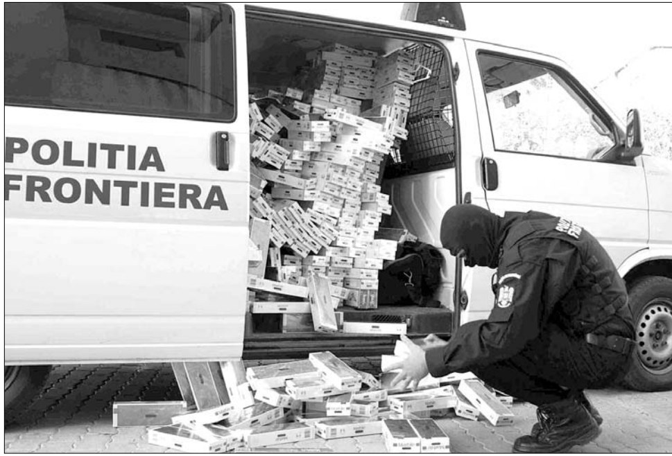
Az alkohol mellett a fekete cigarettakereskedelem az adócsalók egyik legjövedelmezőbb forrása

A gazdaság törvénytisztelő szereplői szerint a legnagyobb probléma, hogy maga a piac is megtűri a tisztességtelenül eljárókat. Megfigyelések szerint az adócsalásra leggyakrabban alkalmazott eszköz a fiktív export, illetve a cégek szándékosan kikényszerített csődhelyzete. Az adócsalók ugyanakkor előszeretettel használnak hamis zárjegyeket, címkeket vagy egyszerűen nem jelennek meg a legyártott mennyiség egy részét. ◀