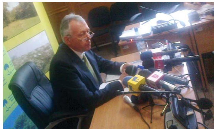
A miniszter szerint a zöld tárca élen jár EU-alapok terén

alapok lehívása terén. Az államfő egy hónappal ezelőtt arról beszélt, hogy az EU-s alapok lehívásában gyengén teljesítő minisztereket le kell váltani. 6. oldal ▶