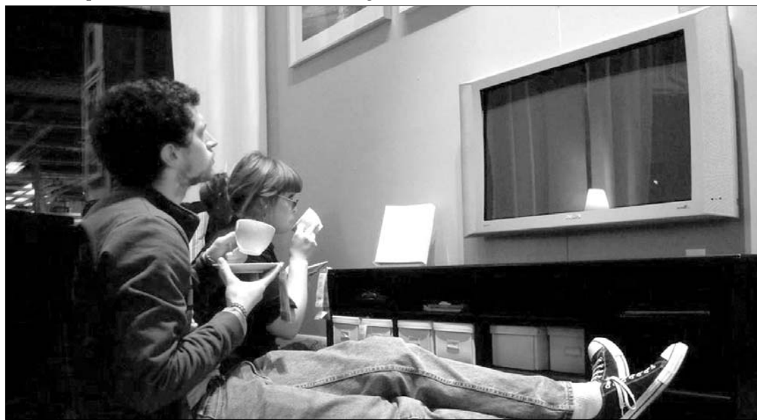
Júniusban több tízezer nézőt veszítettek a kereskedelmi televíziók. A nézővándorlásból a hírtévék profitáltak

zőt számlált, ami a negyedik helyre röpítette a csatornát a nézettségi listán. A konkurens Realitatea Tv-t hatezerrel többen választották az elmúlt hónapban, mint tavasszal, viszont így is csak a Prima Tv és az Acasă Tv után foglal helyet, amelyek 13 ezer illetve nyolcezer nézőt veszítettek. A Top 10 harmadik televíziója, amelyik májushoz képest több nézővel zárta az elmúlt hónapot a Disney Chanel – a kétezres plusz egyértelműen az iskolai szünidőnek tudható be. ◀