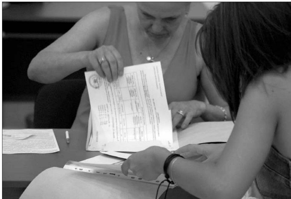
Lesz elég beiratkozó? A kolozsvári BBTE-n nem aggódnak a diákihiány miatt