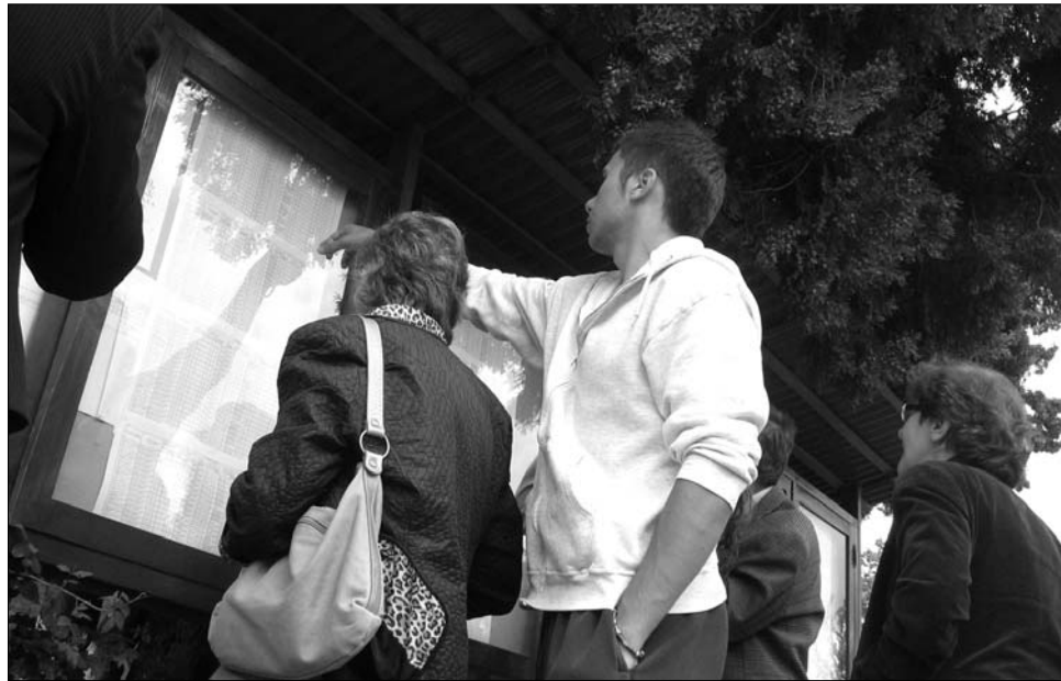
Sok érettségiző számára tartogatott kellemes meglepetést az óvások eredménye