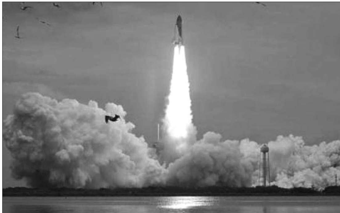
Látványos rajt Cape Canaveralban. Utoljára indult el küldetésére amerikai űrrepülőgép