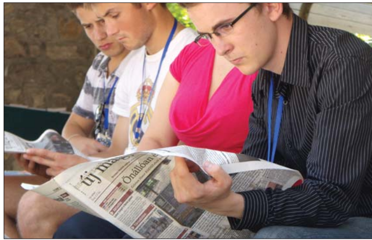
ÚMSZ-olvasók Marosfőn, az utolsó nap „médiacsörtéjén”

▶ Sikeresnek értékelte Bodor László MIÉRT-elnök a szombaton eset Marosfőn lezáruló EU-tábort. A rendezvénynek 108 meghívottja volt, 15 előadást és 6 szekcióülést tartottak. A táborban megfordultak az RMDSZ vezető politikusai is. 3. és 8. oldal ▶