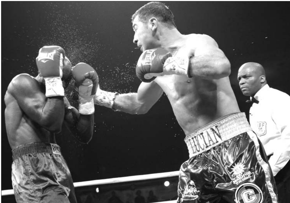
A végzetes pofon Mendynek. Lucian Bute négy éve nem talál legyőzőre súlycsoportjában

Lucian Bute 2007. október 20-án lett IBF-világbajnok,