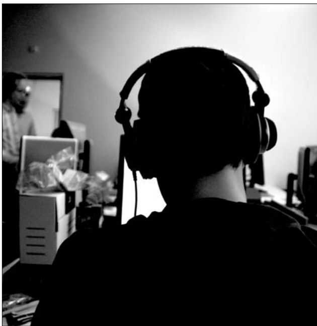
Sokaknak az új játékprogramok jelentik a tökéletes kikapcsolódást Duke feltámad

A német Crytek stúdió 2007-ben bemutatott Crysis első része technikailag már akkor is a videójátékok abszolút csúcsát jelentette (sok tekintetben ma is etalonnak számít), ez hat-