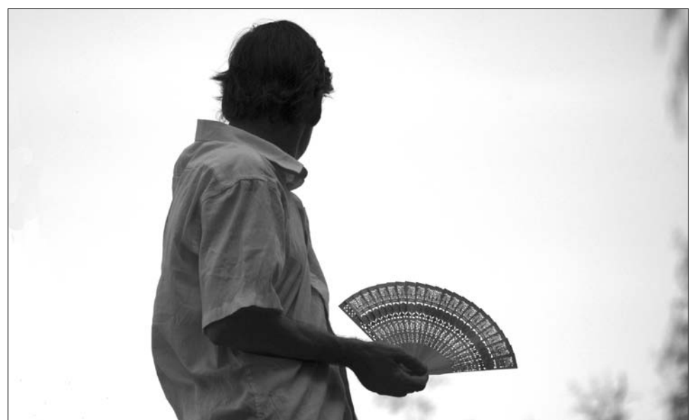
Legyezővel a 35 fokos hőség ellen. A déli órákban nem tanácsos a napon tartózkodni

Az Országos Mentőszolgálat adatai szerint a szív- és érrendszeri betegségben szenvedőket érintette súlyosan a felmelegedés, de az idősebbeket