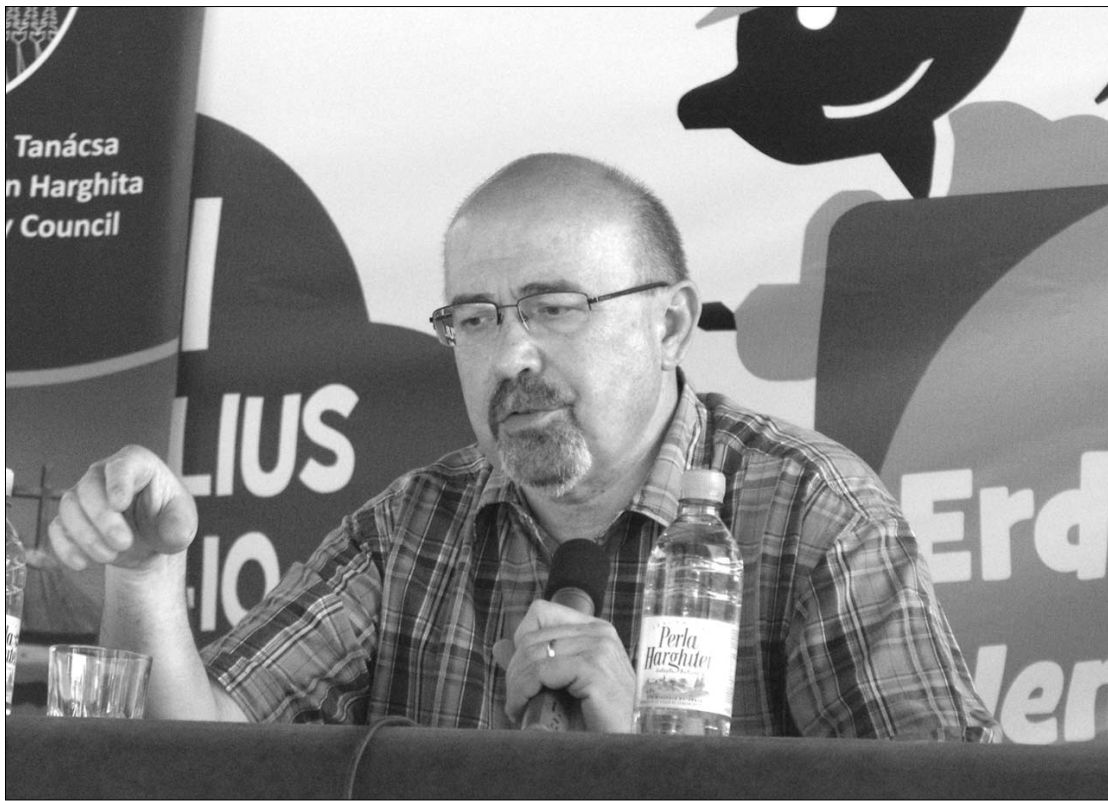
Markó Béla kormányfő-helyettes „Erdélyi múlt, erdélyi jövő” címmel tartott előadást az EU-táborban.

Az EU-tábor pénteki szakmai programját az ifjúsági szervezetek kerekasztal-beszélgetése zárta. ◀