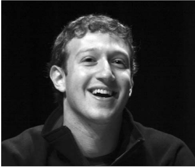
Állítólag Mark Zuckerberg Facebook-alapító aktív Google+-os

A Facebook oldalán belül ingyenes „native” videotelefonálási szolgáltatás a Skype kommunikációs szoftvere segítségével valósulhat meg, így a felhasználók egy aprócska plugin telepítésével egyenesen a böngészőből létesíthetnek videokapcsolatot. A hívás minden ismertebb böngészőben fut majd, legyen az Firefox , Google Chrome vagy Internet Explorer , ráadásul Windows-os, és Mac-es platformokon egyaránt. Az új csoportos csevegés funkciót szintén egy ap-