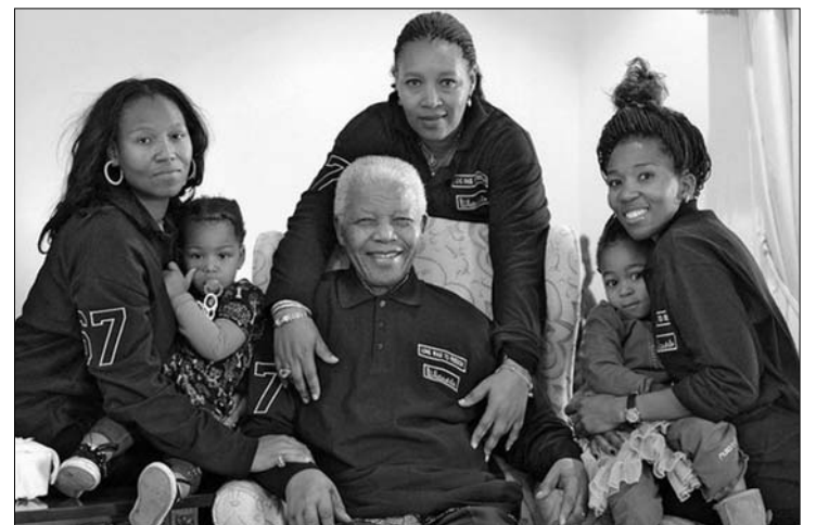
Nelson Mandela a családjában ünnepelte születésnapját