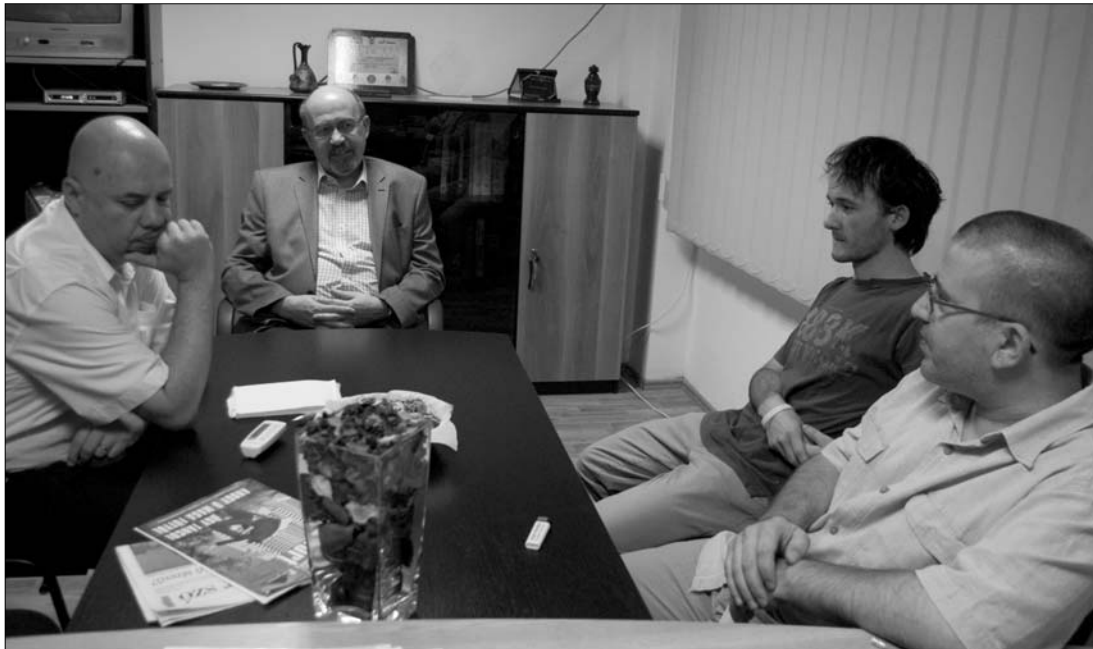
„A hagyományos sajtótermékek híve vagyok” – mondta Markó Béla szerkesztőségünkben

„Bár azt nem állítom, hogy az Új Magyar Szó minden lapszámát átforgatom, a miniszterelnök-helyettesi kabinetben készülő lapszemle révén naponta látom, hogy mi jelenik meg a lapban, mire reagál az Új Magyar Szó, mi az aznapi sajtótéma” – fejtette ki a tegnap lapunk szerkesztőségébe látogató Markó Béla miniszterelnök-helyettes. Markót többek közt újságolvasási szokásairól kérdeztük. Mint elárulta, ő maga ilyen szempontból „konzervatív”, minthogy az internet előretörése ellenére továbbra is a nyomtatott betű híve. „Online nem nagyon szeretek olvasni, néha-néha elol-