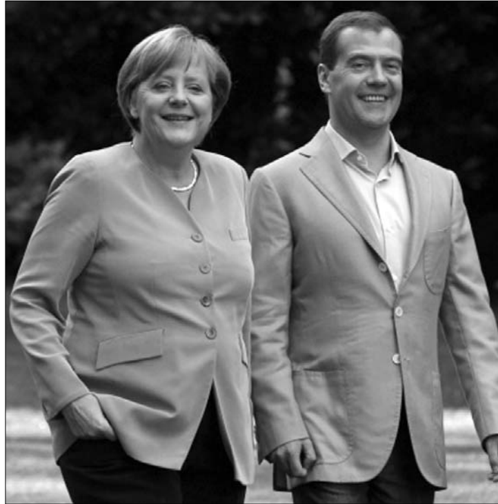
Lazán. Merkel és Medvegyev mosolya nem csupán a sajtónak szól

A rendszeres kormánykonzultációk napirendjén mindenekelőtt a gazdasági, másodsorban pedig a politikai együttműködés kérdései álltak. A tanácskozáson mindkét részről több miniszter vett részt, a delegációkat pedig Merkel és Medvegyev vezette. A sajtókonferencián mindketten hangsúlyozták az együttműködés erősítésével kapcsolatos köl-