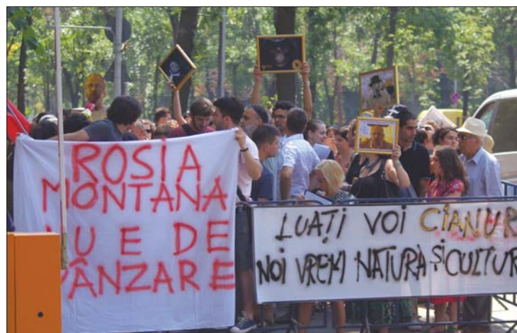
Mintegy hetven aktivista tüntetett tegnap a minisztérium előtt

köztük az Abrudbányai Magyar Kulturális Egyesület is köszönetet mondott a művelődési miniszternek a verespataki kulturális örökség kapcsán született döntésért. 8. oldal ▶