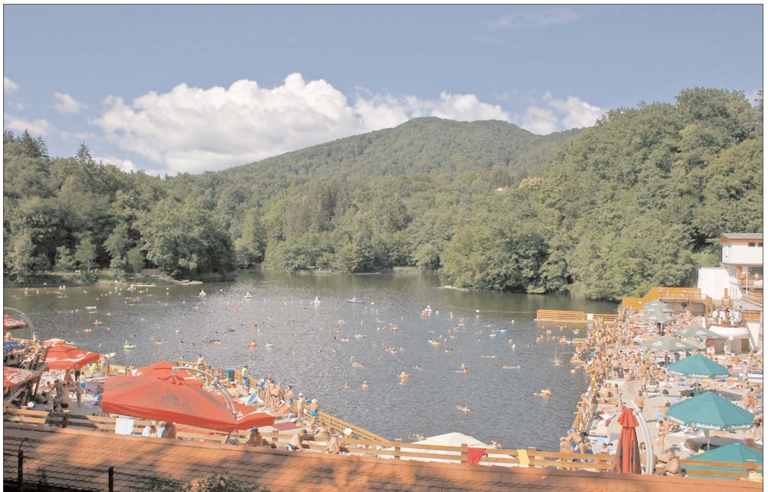
A szovátai Medve-tó. A legnevesebb Maros megyei üdülőközpont néhány év alatt rendkívül látványos fejlődésen ment keresztül

Aláírták a hazai üdülőtelepek fejlesztését célzó tárcaközi megállapodást