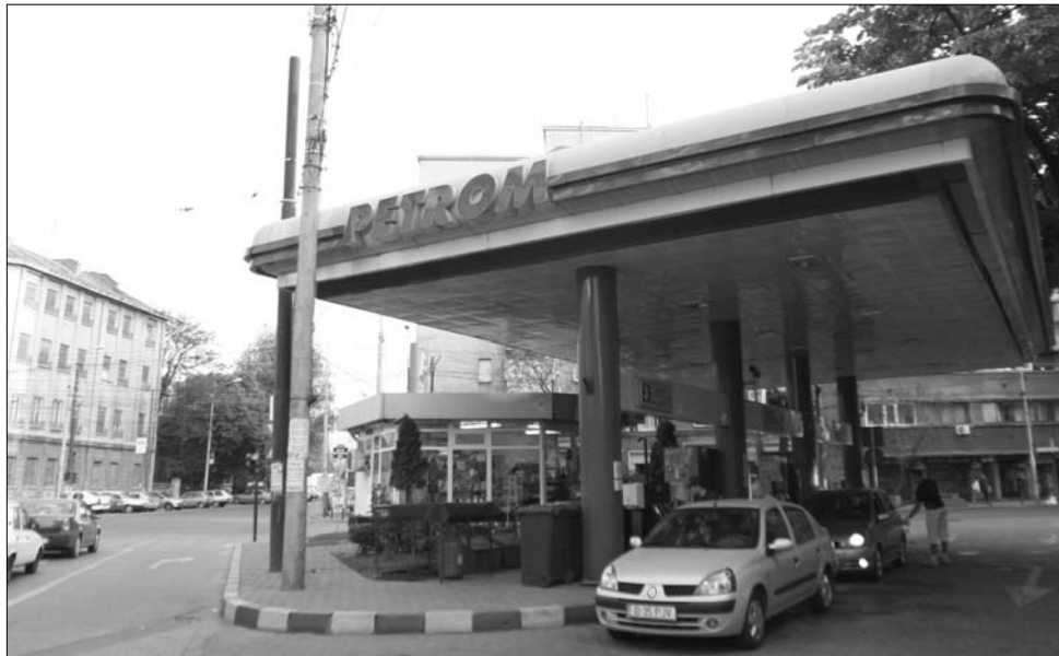
Biztos üzletet ígérnek a Petrom-részvények, az érdeklődés azonban még várat magára

ez a gyakorlatban azt jelenti, az állampolgárok is vásárolhatnak Petrom-papírokat. A tekintélyes üzleti napilap, a Ziarul Financiar (ZF) éles szavakkal bírálta a kormányt amiatt, hogy ennek az információnak a terjesztésére nem fordított elég figyelmet, annak ellenére, hogy a román polgárok így az egyik legfontosabb hazai vállalat rész tulajdonosává válhatnak. A szakértők a lengyel példával vonnak párhuzamot, amikor a helyi PKO bank részvényeiért valóságos rohamot indított a lakosság, ami később jelentős lépésnek bizonyult az ország gazdasági felvirágzása felé vezető úton. A ZF vezetője, Cristian Hostiuc vezércikkben mutatott rá, hogy az egyik legrosszabb lépés, amit a román kormány jelenleg tehet, hogy csendben, hírverés nélkül, szinte titokban készül „Románia történelmének legnagyobb nyilvános ajánlattételére”, ahelyett, hogy minden fórumon hirdetni az ügylet fontosságát, hogy a megnövekedett érdeklődéssel emelje részvénypapírjai értékét, és ami a legfontosabb, hogy polgárait hozzásegítse egy biztosan nyereséges befektetéshez. ◀