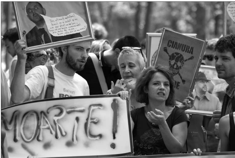
A verespataki bányaterv ellenzői kormányellenes jelszavakat skandáltak a minisztérium előtt.