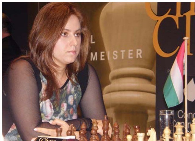
Polgár Judit kettőt megnyert eddigi három mérkőzéséből

oly, Kaposvár polgármestere emlékezett meg. Az eseményt a 7. Kaposvári Ifjúsági Futballfesztivál megnyitójá előtti tartották. Az egy hétig tartó nemzetközi tornán három kontinens 25 országának 200 csapata vesz részt, s 11 korcsoportban hirdetnek majd győztest. ◀