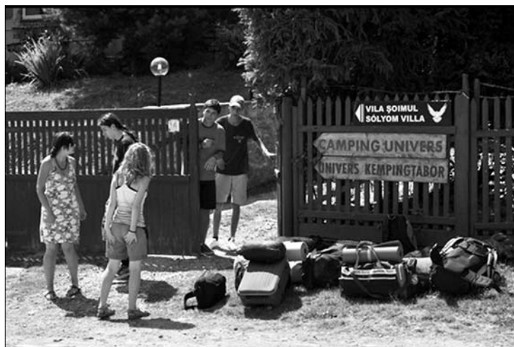
Sokan már tegnap megérkeztek a tusnádi diáktáborba