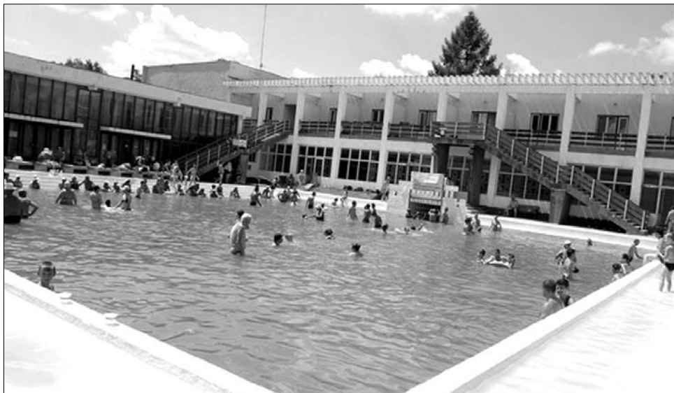
Szatmáron évszázados hagyománya van a termálfürdőnek, most új üdülő is épül

„Romániában találhatóak Európa leggazdagabb és legváltozatosabb gyógyhatású természeti kincsei – gyógyvizek, mofetták, sóbányák stb. Szakértők szerint a kontinens gyógyhatású forrásainak egynegyede, mások szerint egyharmada hazánkban található. Ezeket nemcsak megtalálni kell, hanem ellenőrizni és hasznosítani is” – jelentette ki a megállapodás kapcsán Cseke Attila egészségügyi miniszter. Tájékoztatása szerint az egészségügyi tárca fennhatósága alá 13 olyan kórház tartozik, ahol terápiás céllal hasznosíthatóak ezek az erőforrások, ezekben az intézményekben 3359 ágy áll a gyógyulni vágyók rendelkezésére. Cseke felhívta a figyelmet: két év múlva, 2013 októberében életbe lép az Európai Parlament és az Európai Tanács irányelve a határon átnyúló egészségügyi ellátásról. Ez azt jelenti, hogy a hazai egészségügyi infrastruktúrát az unió polgárai is használhatják a jövőben. Cseke Attila szerint ez a direktíva hatalmas nyereséget hozhatna Romániának, mert már most minden tizedik Romániában kezelt páciens külföldi. A tárcaközi