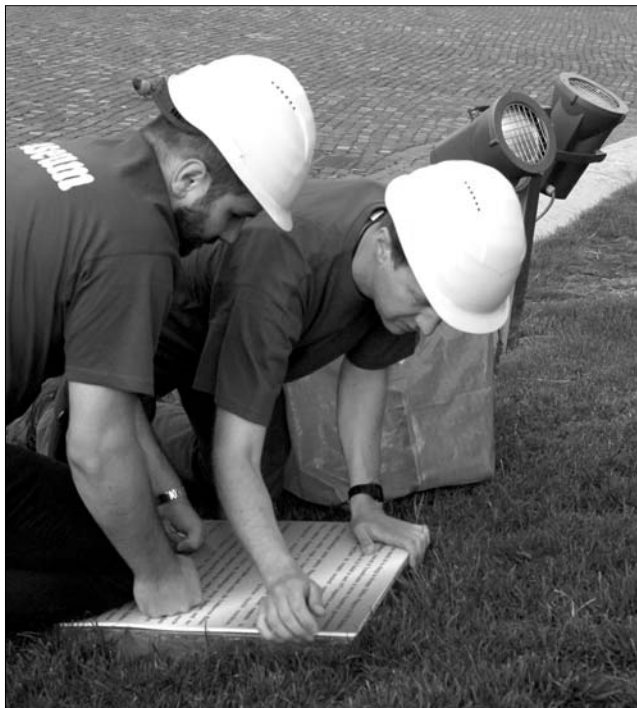
Műanyag táblával takarta le a BKB a Mátyás-szobor előtti Iorga-táblát

Amint arról lapunkban már beszámoltunk, a Iorga-idézetes bronztábla május 23-án jelent meg a Mátyás-szoborcsoport előtt. Kelemen Hunor kulturális miniszter két alkalommal levél-