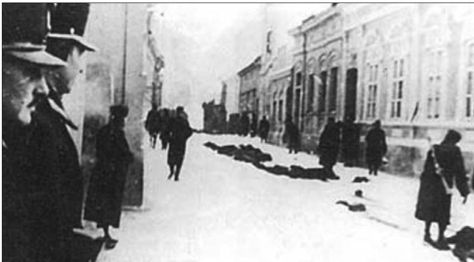
Újvidék, 1942. január. Hideg – és véres – napok

A vád szerint 1942-ben a katonai vezetés elégedetlen volt a januári razzia eredmé-