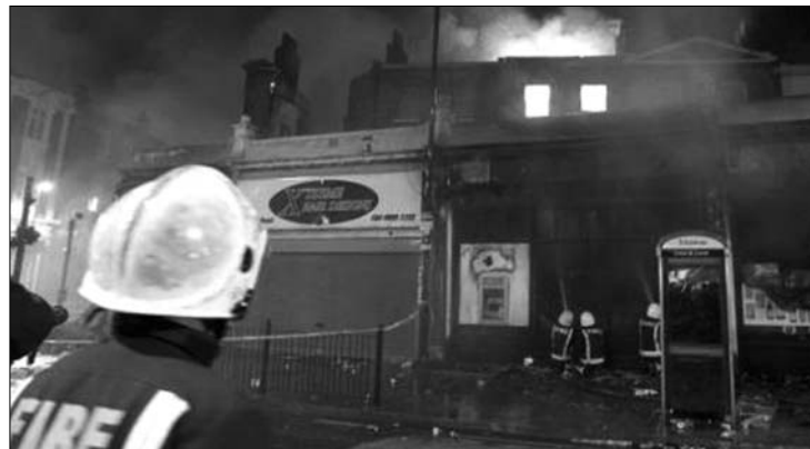
Tottenhamben 25 évig nyugalom volt. A londoni városrész lángba borult