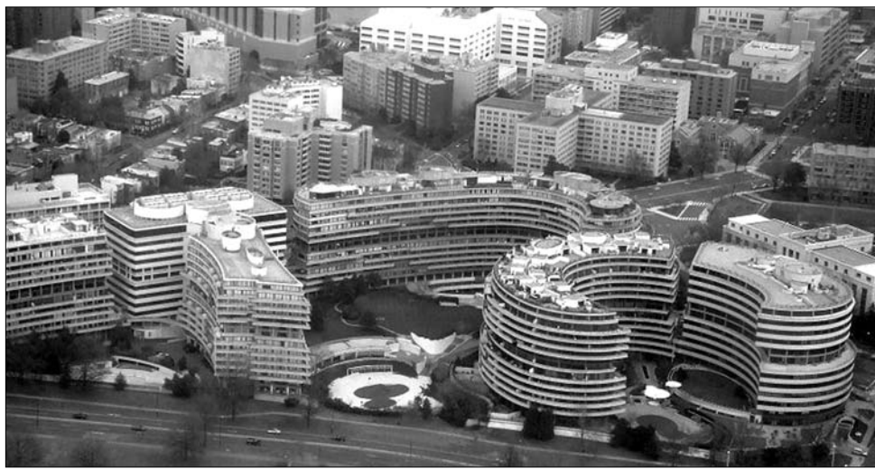
A hírhedt vált washingtoni épület. A Watergate-házban volt a lehallgatott demokraták főhadiszállása

Az igazságot tulajdonképpen csak egyetlen személy tudta volna feltárni: a Mély Toroknak nevezett illető, aki annak idején a leleplező információkat szolgáltatta a sajtónak Nixon közvetlen környezetéből. (Gúnynevét egy 1972-ben készült, azóta kultikussá vált amerikai szex-filmről kapta.) Kiléte évtizedeken át volt találgatás tárgya, mígnem 2005-ben maga vallotta be a tényeket. Nem sokkal később, 2008-ban azonban, 95 esztendőskorában egy idősotthonban elhunyt. W. Mark Felt hosszú időn keresztül volt a rettegett FBI-főnök, J. Edgar Hoover helyettese, s bár Nixon környezetében sokan támogatták, hogy ő legyen az utód, az elnök ezt elutasította. Sokan éppen ezért úgy tartják, hogy a sérült Felt bosszújából talált ki