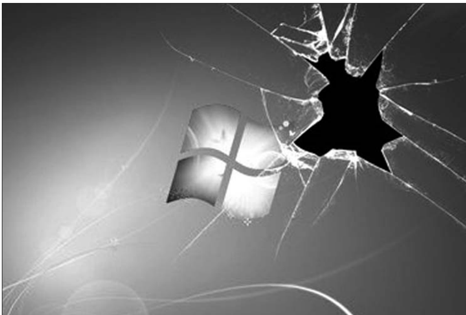
Redmondi korszakváltás? A Windows XP sikerei magasra tették a mércét a Microsoft számára

A „divatjamúlt” platform kihalását maga a Microsoft is sietteti, ugyanis az új számítógépekre legálisan már nem lehet XP-t installálni, így a konfigurációjukat frissítő, vagy új gépet vásárló felhasználók a Windows 7-es verzióját kénytelenek te-