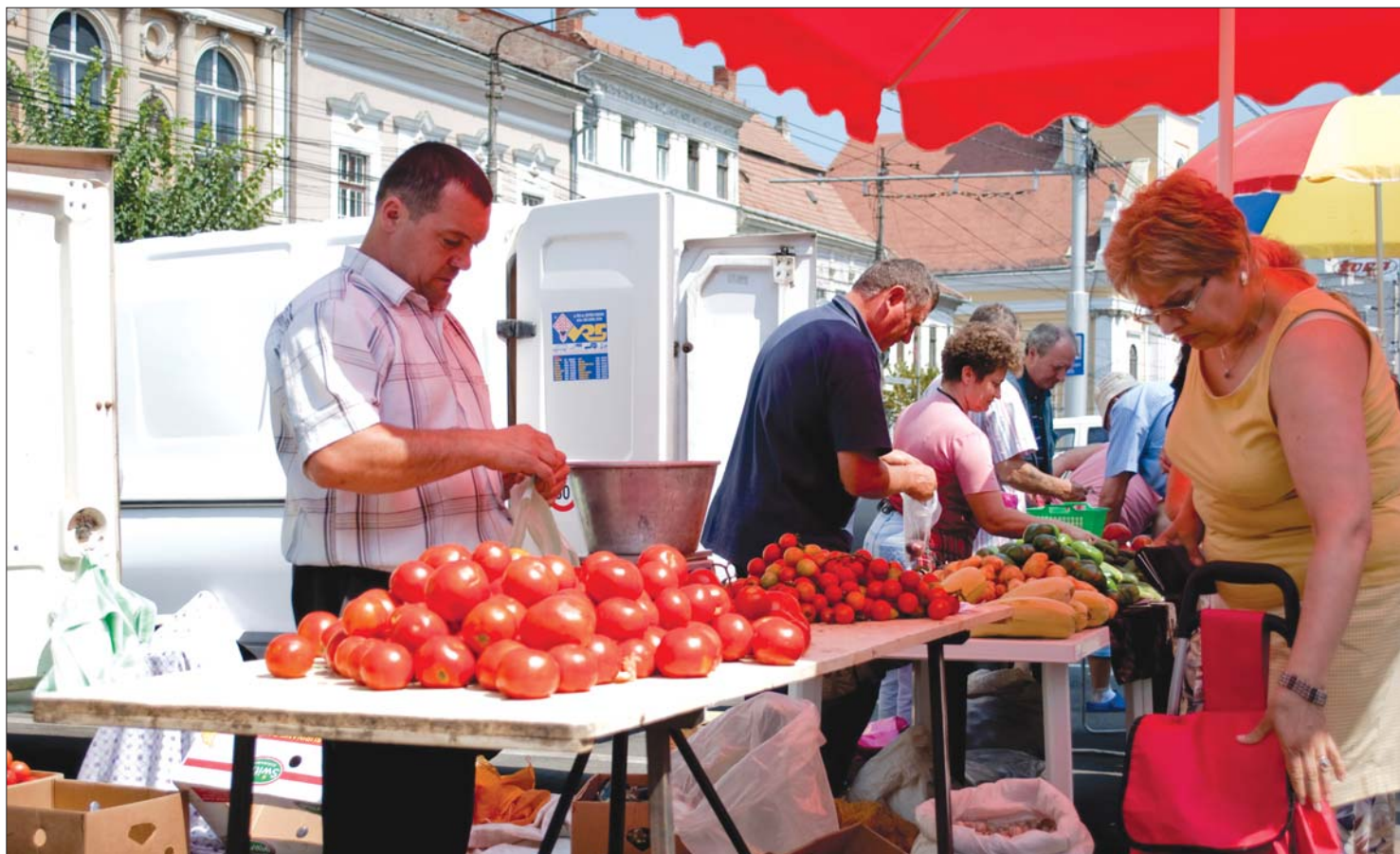
Kolozsvár főterének hangulatához méltánytalannak tartják a kincses város lakosai a történelmi környezetben létrehozott zöldségpiacot.

A kolozsvári RMDSZ felfüggesztette együttműködését a PDL-vel a főtéri piac miatt