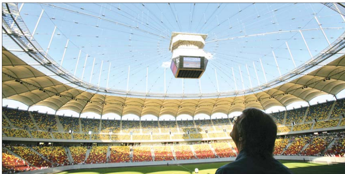
A Național Arena lelátóinak befogadóképessége 55 ezer hely, a parkolóba 1200 jármű fér majd be.

▶ Több mint százezer bukaresti volt kíváncsi egy nap alatt a főváros legújabb építészeti látványosságára, a Național Arena stadionra, amely szombaton nyitotta meg kapuit a közönség előtt. A létesítmény jövőre már biztosan az Európa Liga döntőjének lesz a házigazdája. A stadiont hivatalosan a szeptember 6-i, Franciaország elleni Eb-selejtező mérkőzésen avatják fel. 12. oldal ▶