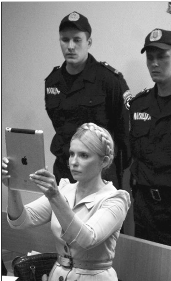
Julija Timosenko a vádlottak padján. Látványosan az iPadjával foglalkozik

zetközi visszhangot váltott ki. Reagált Jerzy Buzek, az Európai Parlament elnöke is, aki aggodalmát fejezte ki a döntés politikai motivációját és Ukrajna jogállamiságát illetően. Erős kételyeket