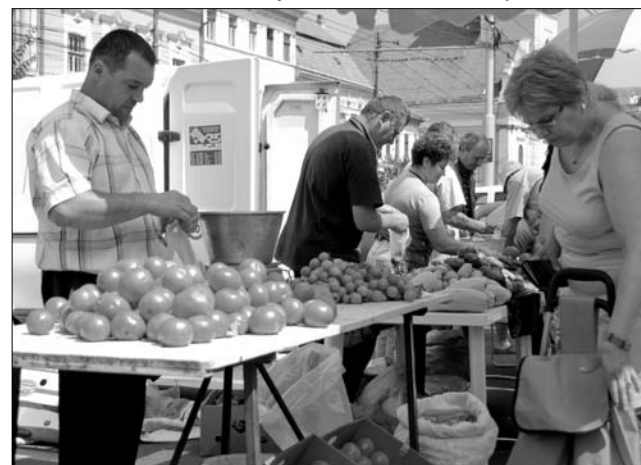
A kolozsváriak továbbra is a piacon vásárolnak be

„Jó ötletnek tartottam a programot, és az elején egyszerű-kétszer rendeltem is a honlapjukon meghirdetett termékekből, viszont az árak borsosnak tűntek. A legnagyobb gond az volt, hogy minimum száz lejes értékű rendelést vettek csak fel, amit megtoldottak a tíz lejes szállítási költséggel. Ekkora mennyiségű élelmiszert nem egyszerű raktározni, ezért inkább a piacról szereztem be továbbra is azokat a termékeket, amelyekre szükségem van” – osztotta meg tapasztalatait lapunkkal egy kolozsvári háziasszony. ◀