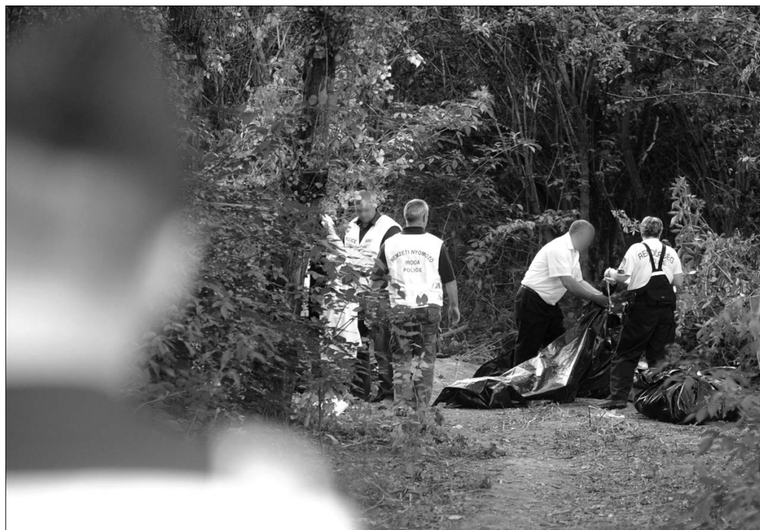
Helyszínelés a csepeli erdőben. A bűnbanda tagjai elevenen temették el kiszemelt áldozataikat