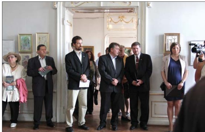
A Bánffy-palotában öt tárlat nyílt a magyar napokon

Szilágyi Mátyás főkonzul a megnyitón bejelentette, augusztus 21-én a rendezvény vendége lesz Schmitt Pál, Magyarország köztársasági elnöke. 8. oldal ▶