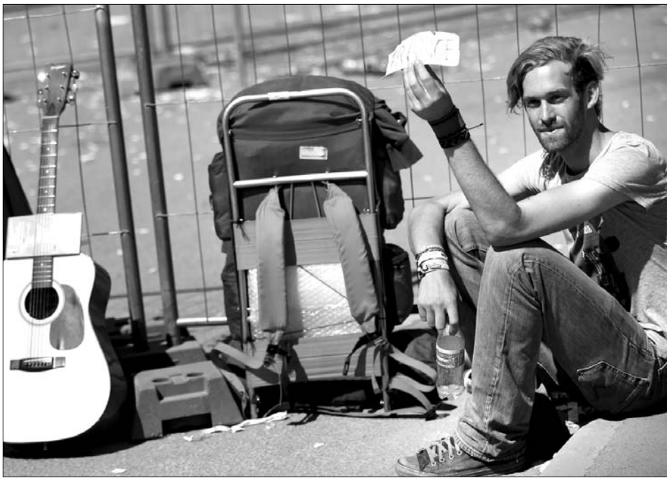
Elnéptelenedett a Hajógyári-sziget. A többnapos koncertsorozat már a múlté, a veszteség a szervezőké

▶ Igencsak elnéptelenedett tegnap délre a budapesti Szigetfesztivál helyszíne – igaz, a hétfői ráadásnapra már nem is jutott program. Aki ott maradt, javában csomagolt, és a szó szoros értelmében szedte a sátorfáját. A rendezők pedig nekifogtak a bontáshoz, ami a hírek szerint hetekig is eltarthat. A hét végén már a fáradás jelei ütözköztek ki Közép-Európa egyik legrangosabb megabuliján, talán nem is jöttek el most annyian, mint tavaly. Pedig az időjárásra ezúttal nem lehetett panasz: ázni-fázni nem kellett, de a pörgés mégis mintha lelassult volna. Persze most is sokan táncoltak, például a Dizze Rascalon, és a Skunk Anansie koncertjének vendégei sem fanyaloghattak.