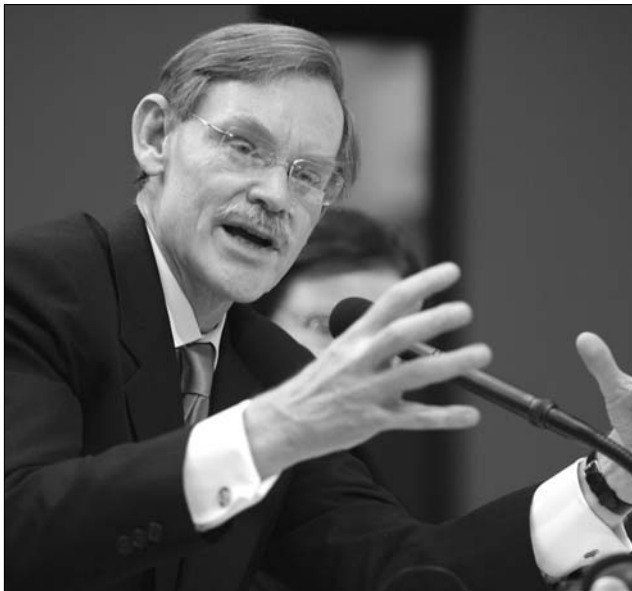
Robert Zoellick: a világgazdaság „veszélyes szakaszba” lépett

Olaszországnak, Spanyolországnak és Franciaországnak nem lesz szüksége az európai mentőmechanizmusok támogatására, mivel megte-