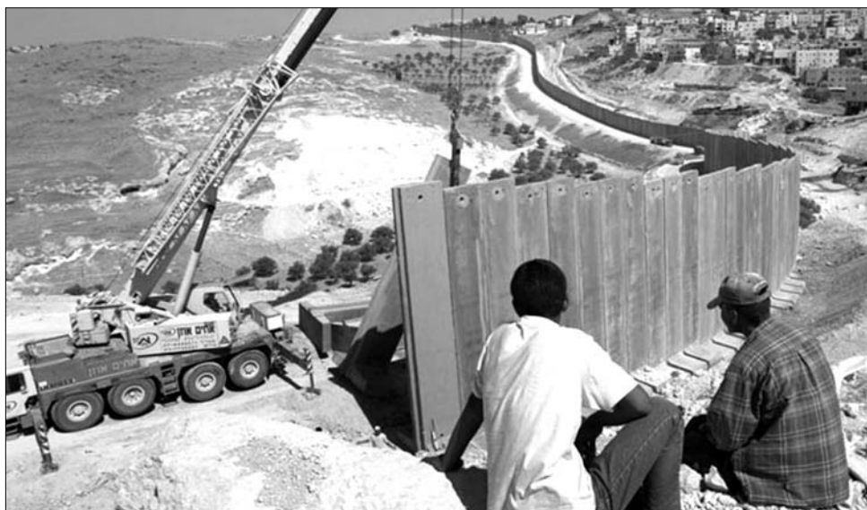
700 kilométer hosszú lesz a fal Izrael és Ciszjordánia között. Nyújt-e védelmet a zsidó államnak?

Korea 1948 óta megosztott ország, a 38. szélességi fok mentén szigorúan meg erősített és őrzött demarkációs vonal húzódik. Az ideiglenesnek szánt határ mögött a kommunista Észak-Korea elsáncolta magát a szabad világtól. A megosztással családok omlottak össze, akárcsak később, 1961-ben Berlinben. Az inség vagy a rendszerrel való elégedetlenség miatt elmenekülő észak-koreaiak száma az utóbbi években megsokszorozódott. A legtöbben Kína felé lépik át illegálisan a határt, hogy ott várják ki a beutazási lehetőséget a déli országgrszbe.